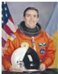
Леонід Каденюк (нар. 1951)

МИНИСТЕРСТВО ПРОСВЕЩЕНИЯ РОССИЙСКОЙ ФЕДЕРАЦИИ