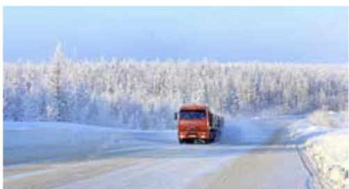
Мал. 284. Простори Сибіру взимку

МИНИСТЕРСТВО ПРОСВЕЩЕНИЯ РОССИЙСКОЙ ФЕДЕРАЦИИ