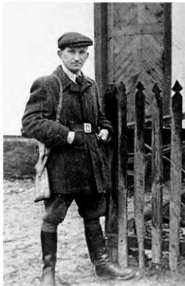
Роман Шухевич — командир УПА.

Брати КАПРАНОВИ. Мальована історія Незалежності України. К.: Гамазин, 2013. С. 64