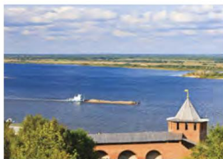
Мал. 213. Волга (Європа)