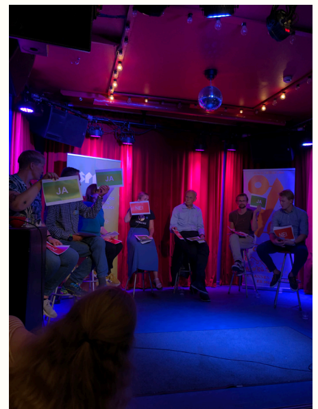
Paneldebatt med partiene om handelspolitikk før Stortingsvalget