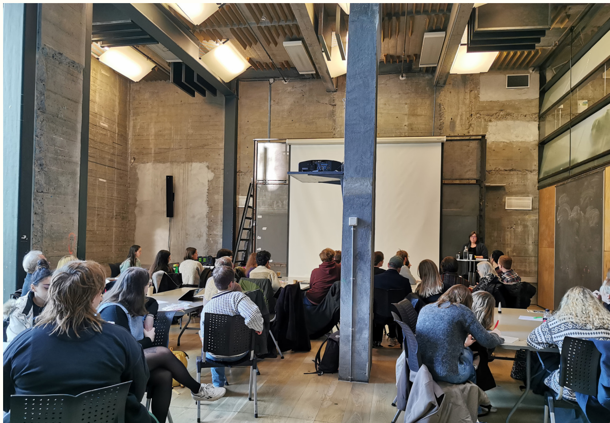
Politisk verksted om å temme teknologigigantene på Globaliseringskonferansen