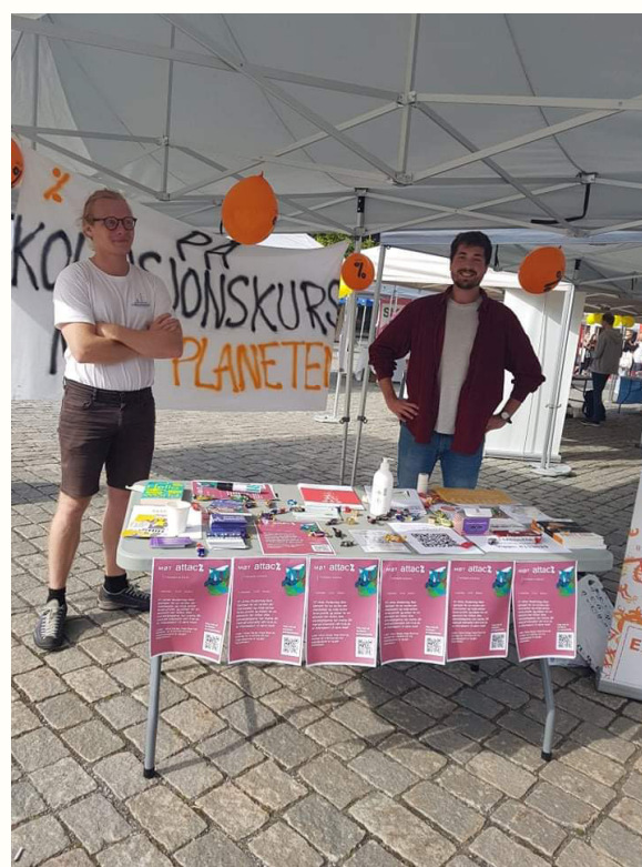
Stand med Attac Studentlag Oslo