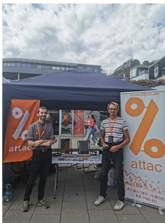
Stand på Arendalsuka