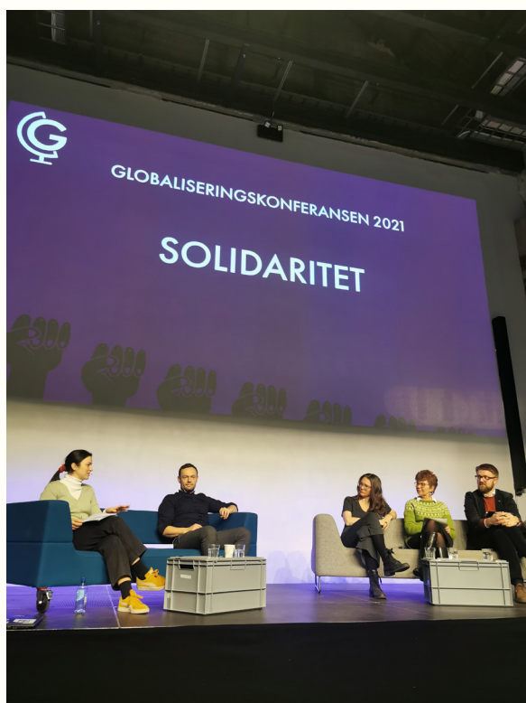
Handelsdebatt på Globaliseringskonferansen