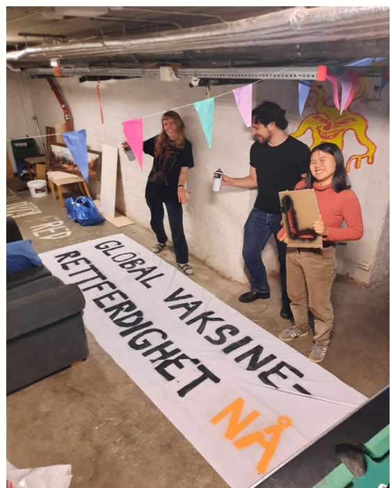
Attac Studentlag Oslo maler banner

Det ble gjennomført informasjonsmøte og seminar om digital økonomi i oktober 2021, og i etterkant ble det gjennomført et stiftelsesmøte for Attac Trondheim. Lokallaget ble formelt godkjent av Attacs styre 10. november. Lokallaget er fortsatt i oppstartsfasen. I Trondheim finnes også en aktiv SambAttac-gruppe, SambAttac Trondheim.