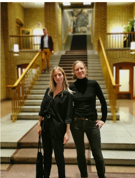
På Stortinget sammen med Handelskampanjen for å snakke med SV og Rødt før toppmøtet i WTO (som ble avlyst)

Til tross for en tid hvor fysiske møter har vært gjennomført i varierende form, har vi blitt invitert til å delta i en rekke debatter og andre arrangementer. Til sammen har vi deltatt i 13 debatter og samtaler fra april 2020 til februar 2021.