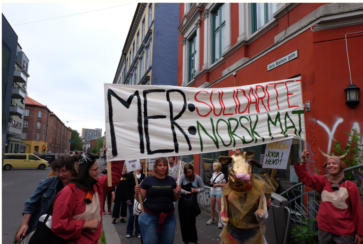
Markering for ny landbrukspolitikk