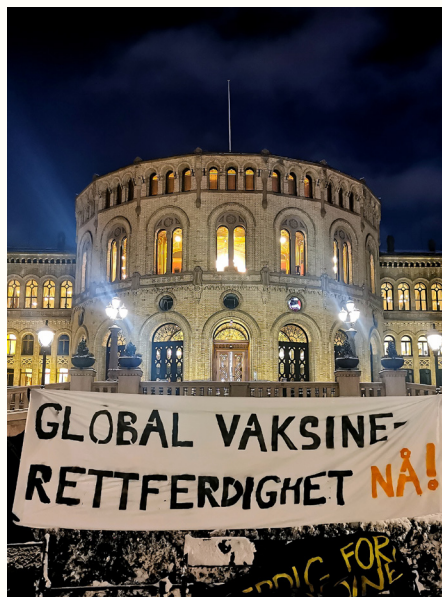
Demonstrasjon for vaksinerettferdighet foran Stortinget