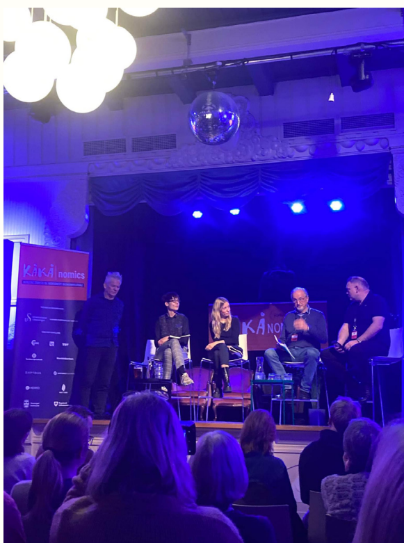
Debatt om økonomisk teori på Kåånomics