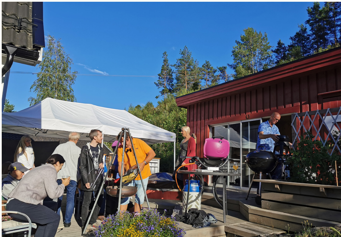
Aktivistsamling i Arendal