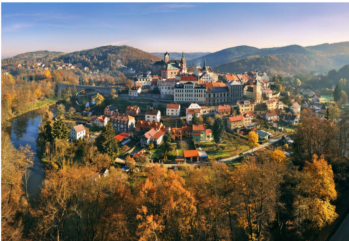
Loket nad Ohří