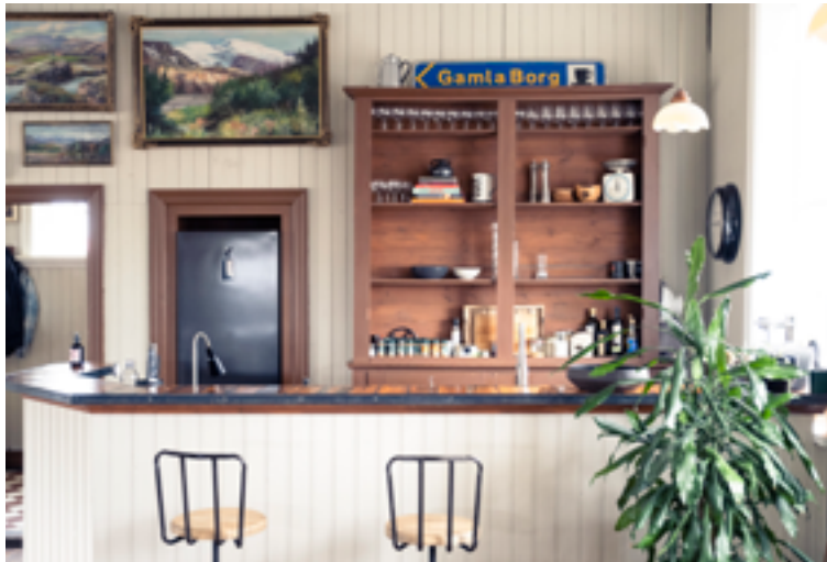
Engin bjórdæla er lengur á staðnum heldur er barinn núna eldhús.

„Þetta hljómar eins og handrit að bíómynd, atburðarásin í þessu. Ég vissi það að einhvern daginn myndi ég klasa við þessa stofnun og það stefndi allt í það. Það fór rosalega mikið í taugarnar á mörgum í þessum bransa