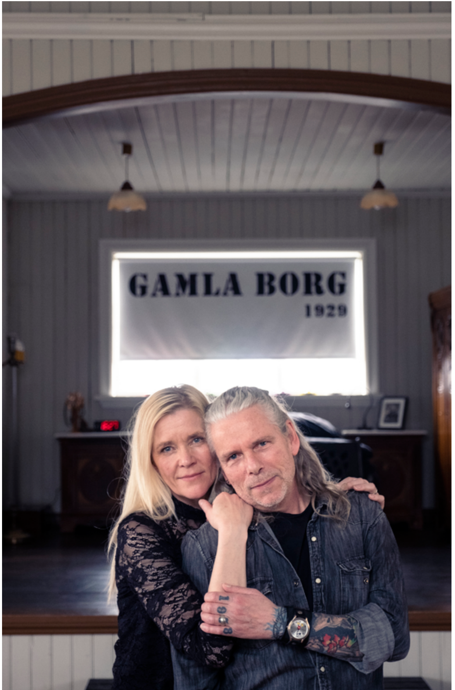
Sviðið á Gömlu Borg hefur nú fengið nýtt hlutverk – svefnherbergi.

„Þetta var svakaleg umræða og hún er ekki búin ennþá því ég og lögmaður minn erum að fara fram á það við ráðherra að hún verði rannsökuð þessi lokun og ég fái mannorðið mitt til baka því þetta var ljót aðför og illa gerð því þetta snerist allt um peninga. Þetta snerist um það eftir hrun að það átti að skera niður í barnaverndarkerfinu og ég og ónefndur maður hjá þessari stofnun vorum aldrei vinir.