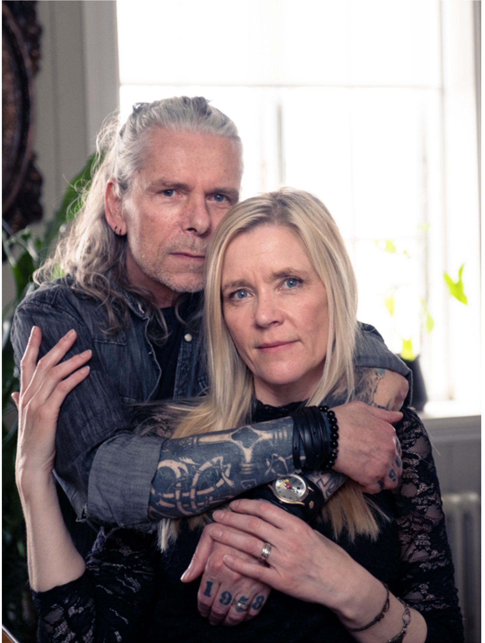
Ástfangnir unglingar í seinni hálfleik lífsins.

„Við eigum bæði 17 ára gutta sem eru hrútar, apríl-