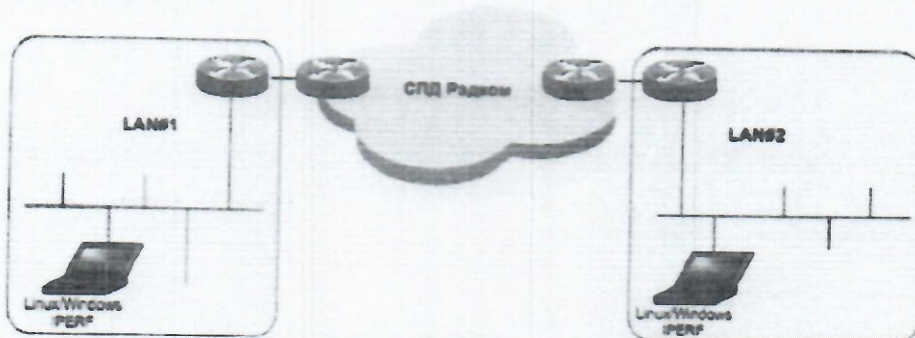
Схема испытаний приведена на рисунке:

Методики измерения количественных показателей