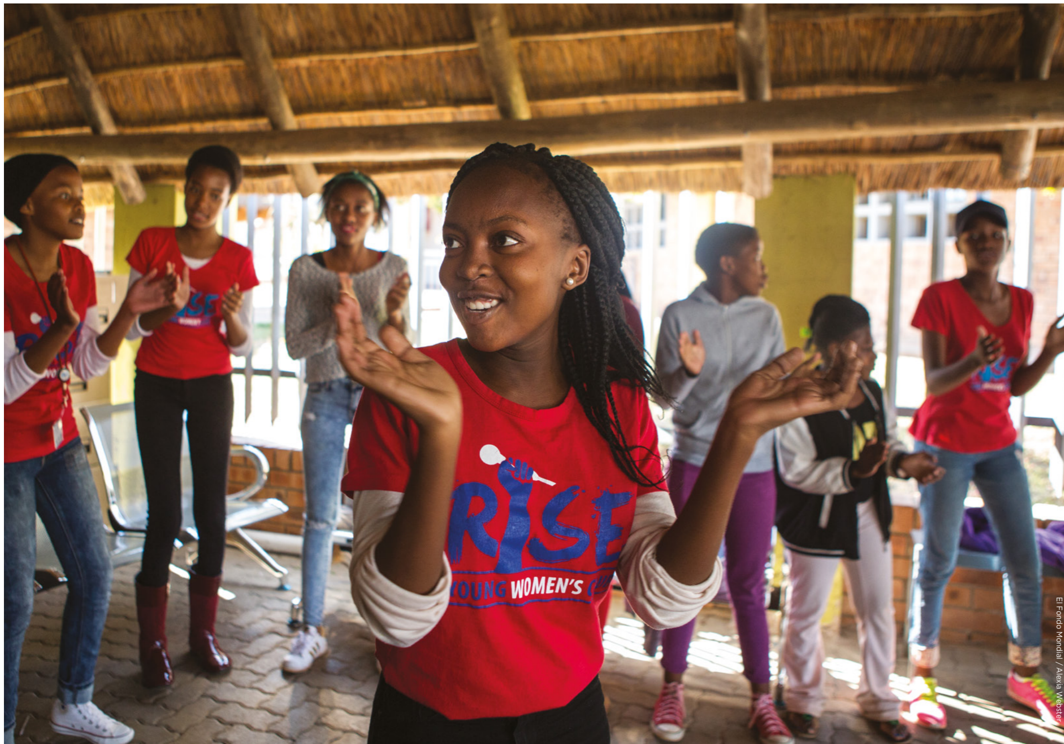
El Fondo Mundial / Alexia Webster