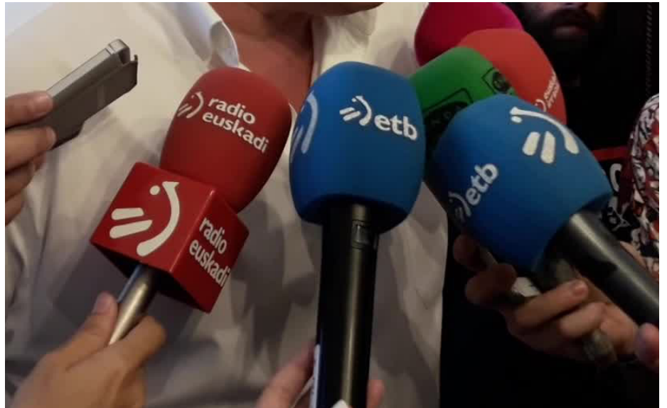
Udalerrri euskaldunetako udal ordezkariak eta herritarrak ETBn gazteleraz hitz egiten ez jartzeko eskatu du UEMAK.

UDALERRI EUSKALDUNETAKO ALKATEAK, ZINEGOTZIAK EDO HERRITARRAK ETBn GAZTELERAZ HITZ EGITEN AGERTZEAK UDALERRI EUSKALDUNEN IRUDIA LAUSOTZEN DU, IRUDI HORREK EZ DUELAKO HERRI HORIETAKO ERREALITATE SOZIOINGUISTIKOA ISLATZEN. HORREK KEZKA ERAGIN IZAN DU UEMAREN BAITAN, ETA EGOERA IRAULI NAHIAN, IRIZPIDEAK FINKATU, UDALAI JAKINARAZI ETA EiTBRekin BILERA EGIN ZUEN 2014an. HARREZKERO, IBILBIDE LUZEA IZAN DU GAIAK, BAINA ORAINDIK ERE ETBn GAZTELERAZ ENTZUN DAITEZKE UDALERRI EUSKALDUNETAKO ORDEZKARIEN ETA HERRITARREN ADIERAZPENAK. BERAZ, UEMA BERRIRO BILDU DA AURTEN EiTBRekin.