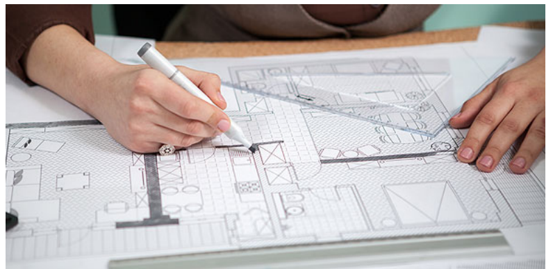
Lurralde-antolamenduko eta hirigintzako planen eta proiektuen inpaktu linguistikoa neurtzen lan egiteko aukera izango dute ELE aditu titulua eskuratzen duten ikasleek.

'ERAGIN LINGUISTIKOAREN EBALUAZIOA' ADITU-TITULUA (15 ECTS KREDITU) ANTOLATU DUTE EHUK eta UEUK, UEMAREKIN eta KONTSEILUAREKIN batera, eta ekainaren 30 arte zabalik da MATRIKULA EGITEKO EPEA. 150 ORDUKO GRADUONDOKOA DA. ERDIAK aurrez aurreko eskolatan eskainiko dira, 2020ko URRTIK 2021eko APIRILERA, eta beste ERDIA IKASGELA BIRTUALEAN LANDUKO DA. GRADUONDOKOA EHUREN BEREZKO TITULUEN eskaintzan sartzen da, eta HIZKUNTZA eta LURRALDEA LOTZEN DITUZTEN HAINBAT ERAKUNDEETAKO ORDEZKARIAK IZANGO DIRA IRAKASLEAK, TARTEAN BAITA ELE SORTU DUTEN UEMAKO ARDURADUNAK ere.