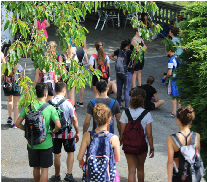
Besteak beste, Zumaiaetik Lekeitiora egitekoak ziren Udalerrri Euskaldunetako Gazteen Topaketak utzi behar izan ditu UEMAk bertan behera.

UEMAk 2020ko PLANGINTZAN eta EGITASMOETAN aurreikusitako zenbait kontu bertan behera utzi behar izan ditu, udaberrian COVID-19ak eragindako osasun larrialdiaren eta alarma egoeraren ondoren. Maiatzaren 30ean Seguran egitekoa zen Udalerrri Euskaldunen Eguna edota ekainaren amaieran hastekoak ziren Udalerrri Euskaldunetako Gazteen Topaketak dira nabarmenenak.