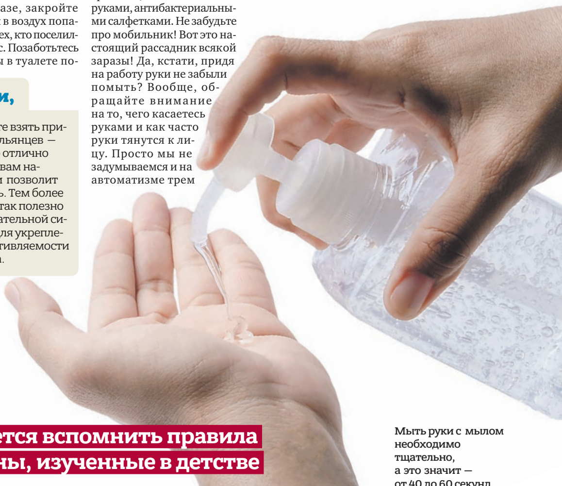
Мыть руки с мылом необходимо тщательно, а это значит — от 40 до 60 секунд

Придется вспомнить правила гигиены, изученные в детстве