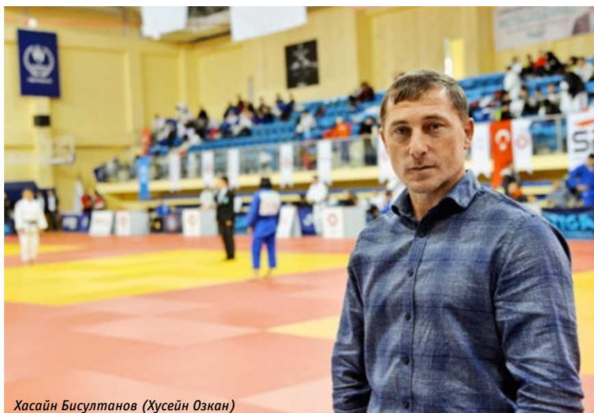
Хасайн Бисултанов (Хусейн Озкан)