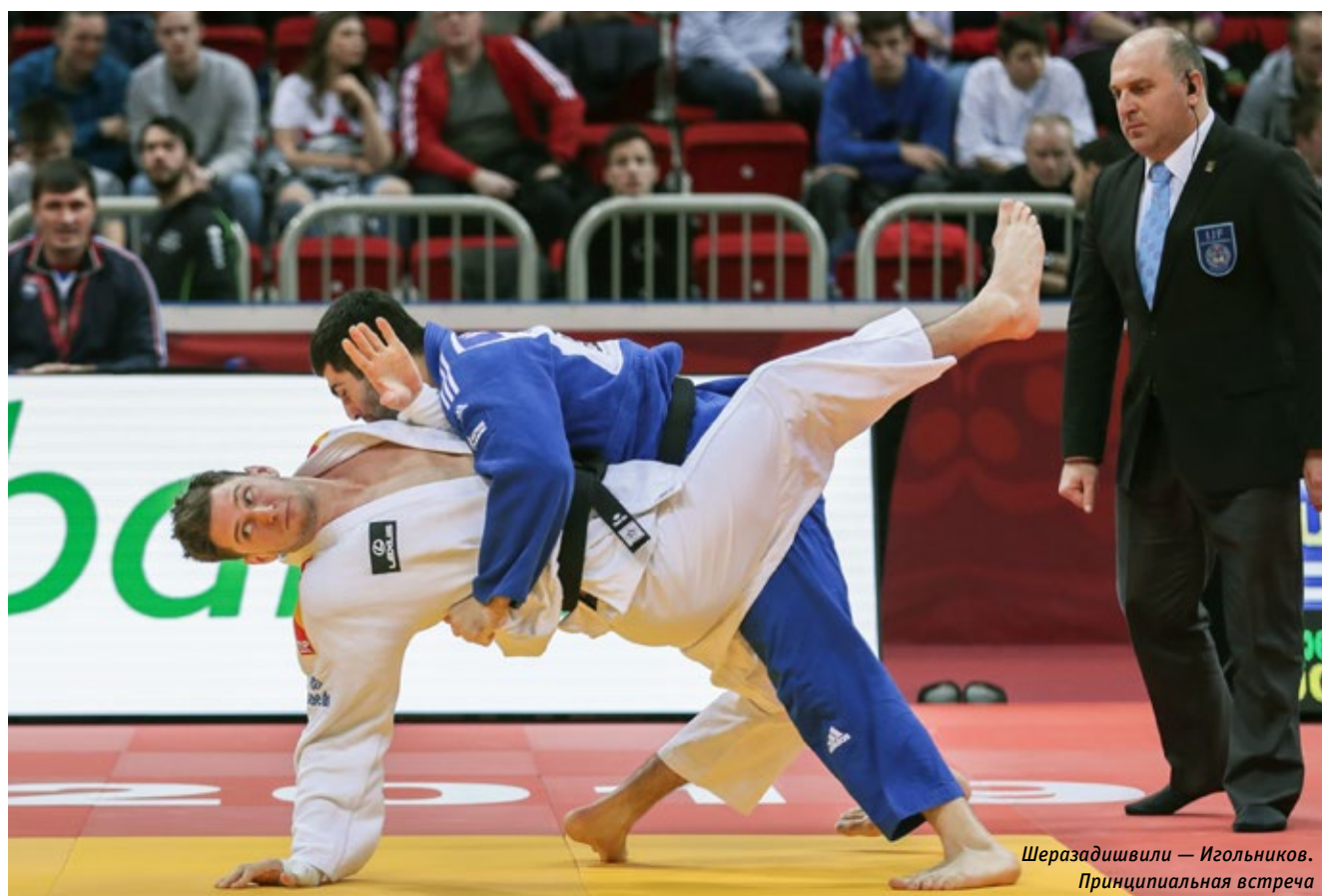
Шеразадзиви — Игольников. Принципиальная встреча