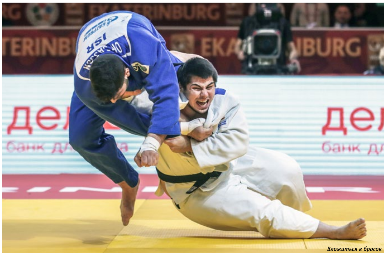
Вложиться в бросок