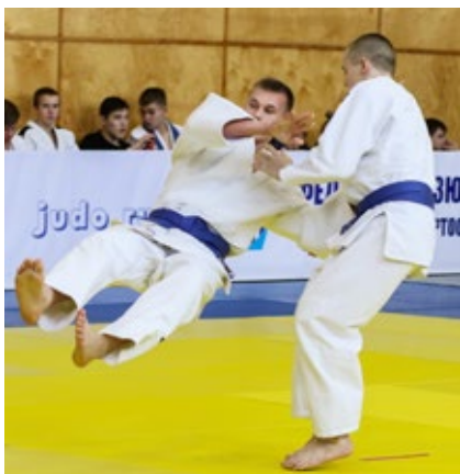
87. Первенство и Чемпионат России по КАТА в Кумертау