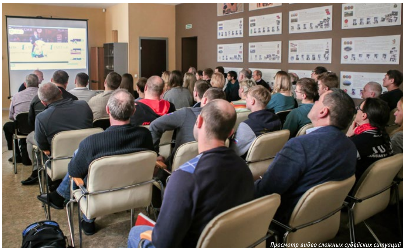
Просмотр видео сложных судейских ситуаций