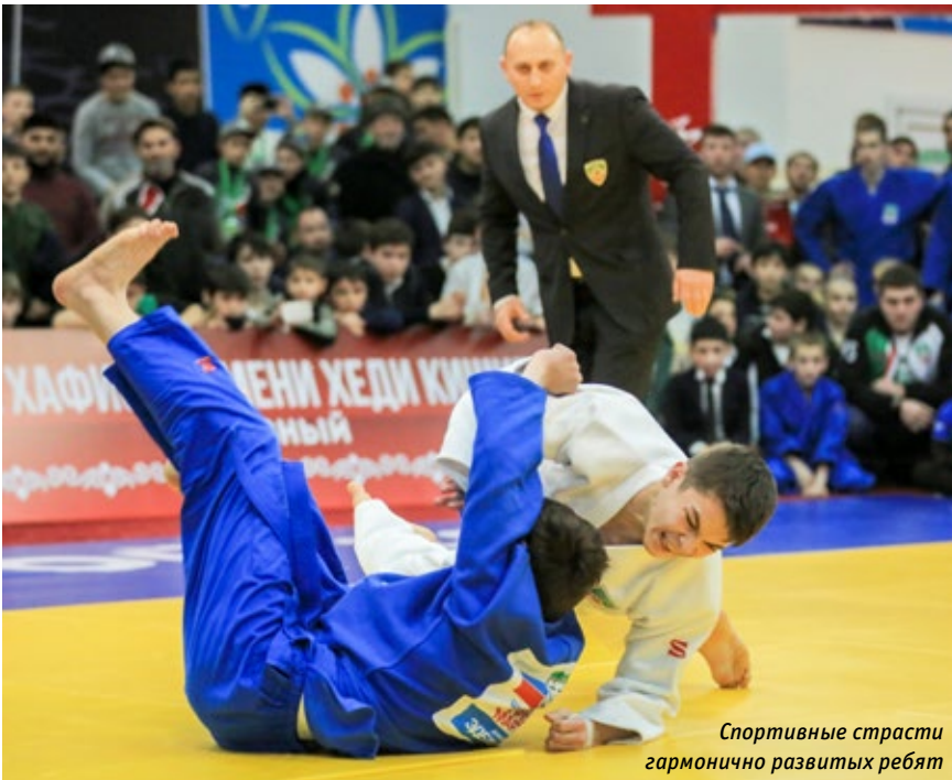
Спортивные страсти гармонично развитых ребят