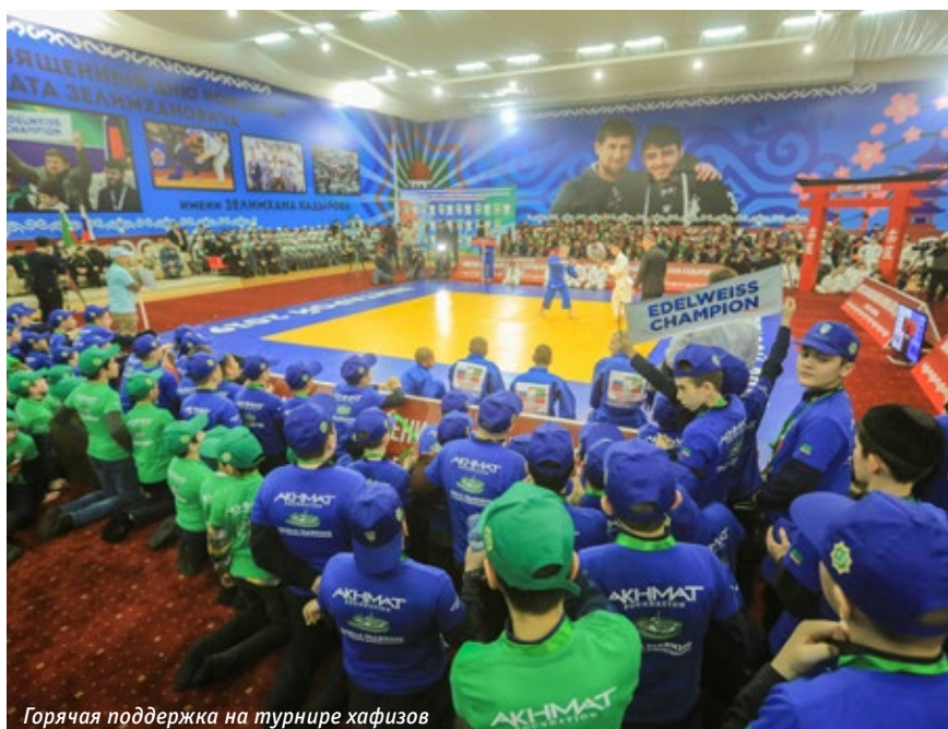
Горячая поддержка на турнире хафизов