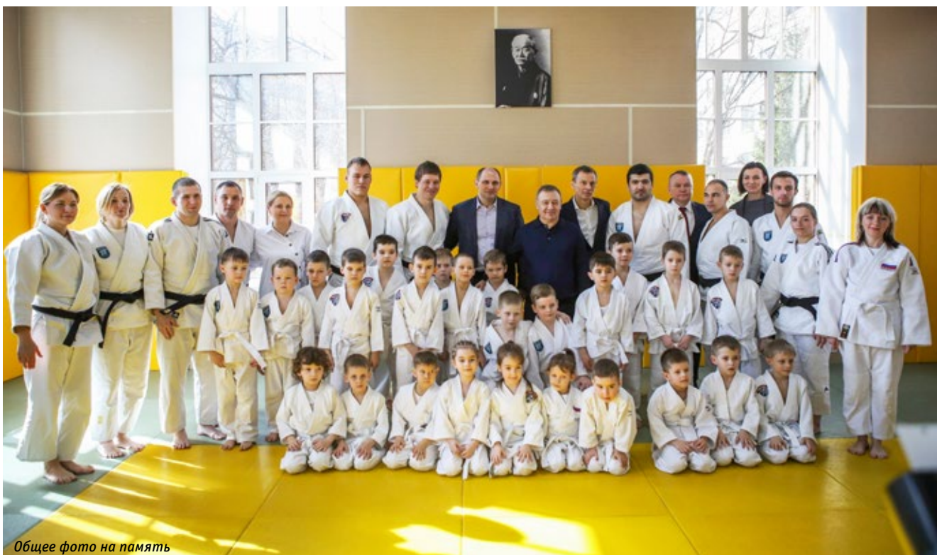
Общее фото на память

В Петербурге методика работы с дошкольниками успешно практикуется тренерами «Турбостроителя» уже порядка пяти лет. На первом этапе клуб организовал секцию на базе двух детских