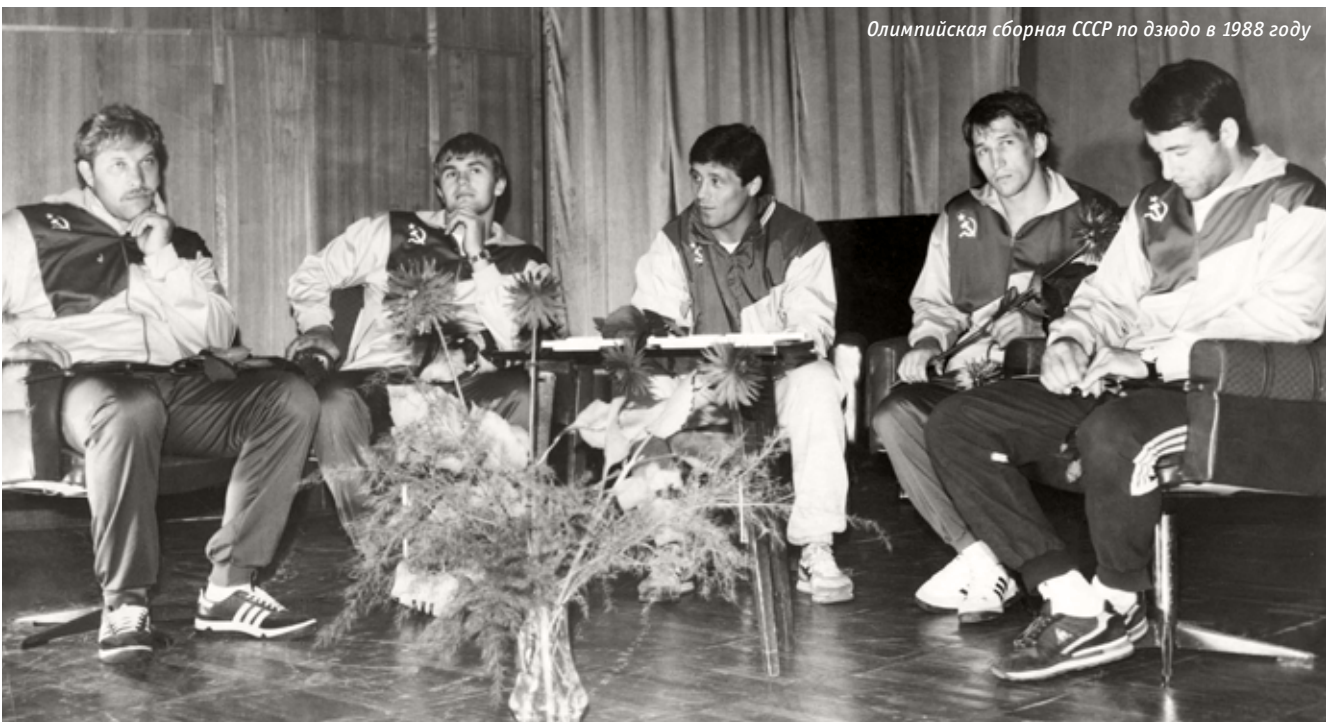
Олимпийская сборная СССР по дзюдо в 1988 году