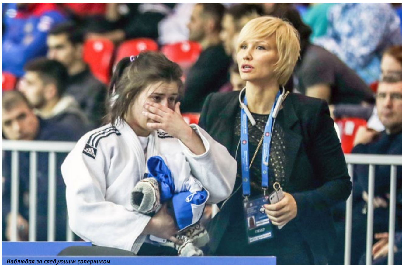
Наблюдая за следующим соперником