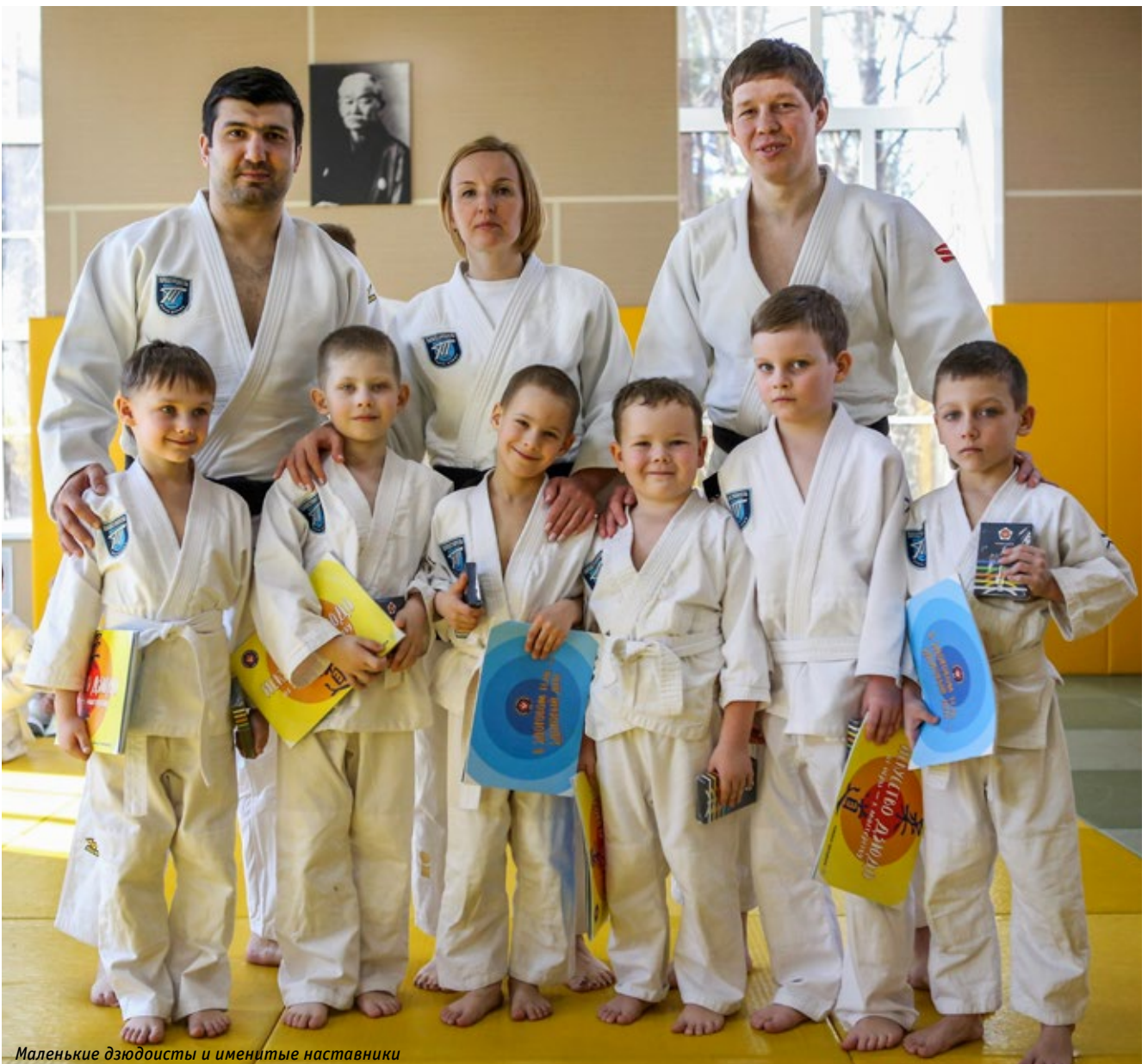
Маленькие дзюдоисты и именитые наставники

Уникальность сочинского проекта в том, что малыши не просто