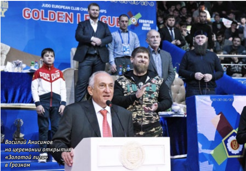
Василий Анисимов на церемонии открытия «Золотой лиги» в Грозном