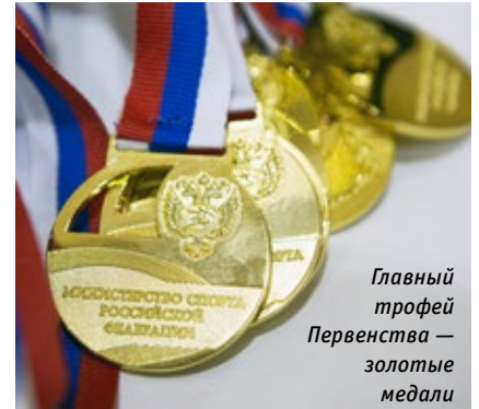
Главный трофей Первенства — золотые медали

Состязания среди юношей и девушек до 15 лет, прошедшие в марте в новороссийском спорткомплексе «ПАТРИОТ», стали рекордными по числу участников.