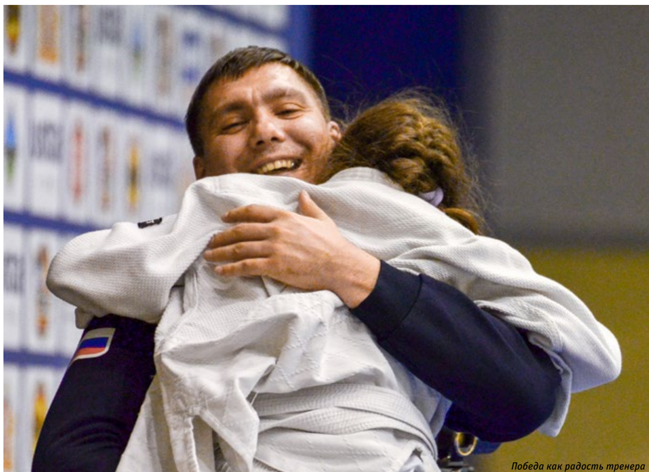
Победа как радость тренера