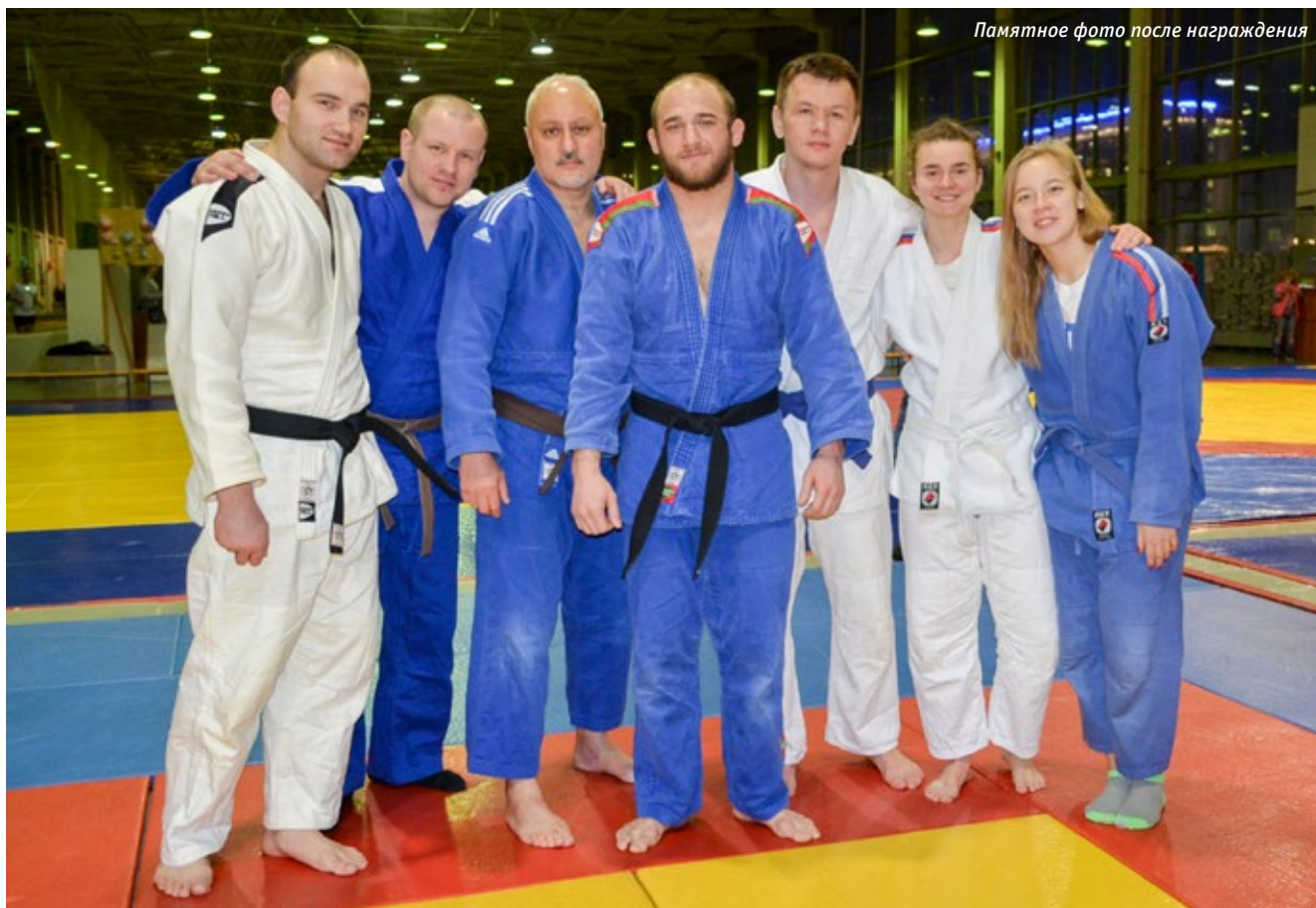
Памятное фото после награждения