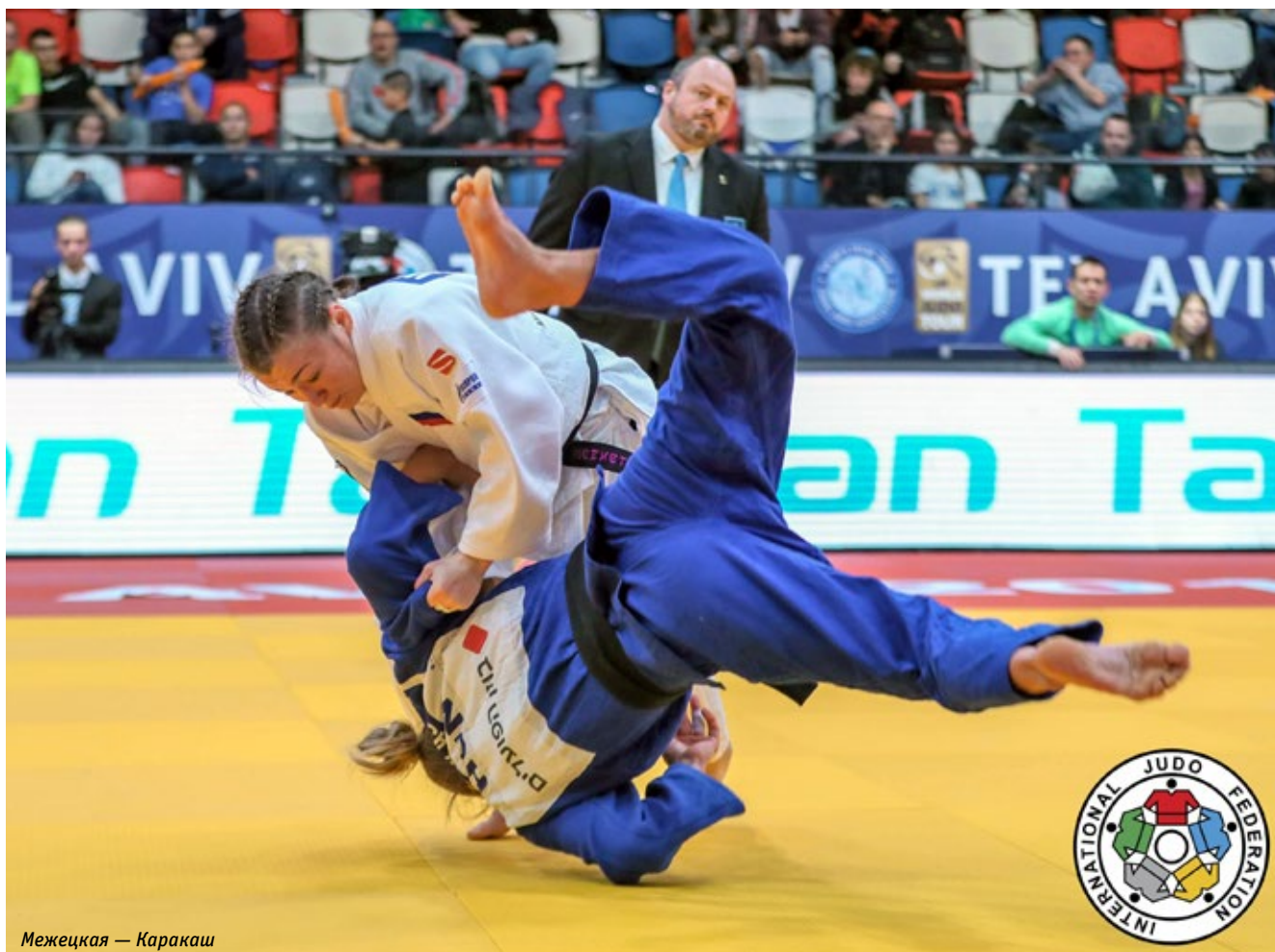
Межецкая — Каракаш

Дзюдоисты открыли новый сезон январским турниром серии «Гран-при», впервые организованным в Израиле, во втором по величине городе страны — Тель-Авиве.