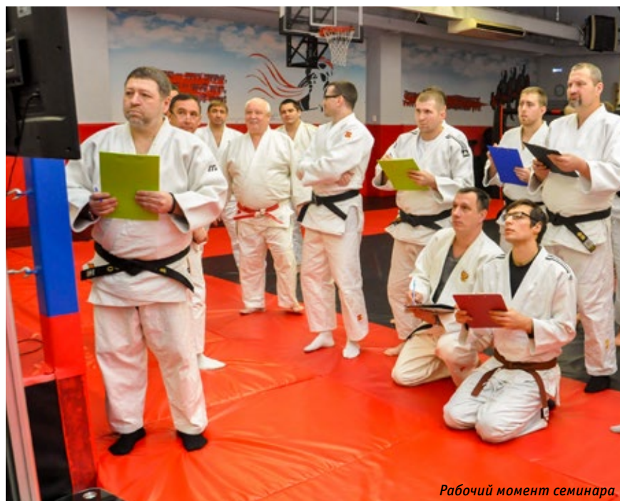
Рабочий момент семинара

По результатам экзамена был проведён отбор судей для судейства первенства и чемпионата России по дзюдо (КАТА) в 2019 году: основных арбитров — 17, судейско-вспомогательного персонала — 7, резерва — 12.