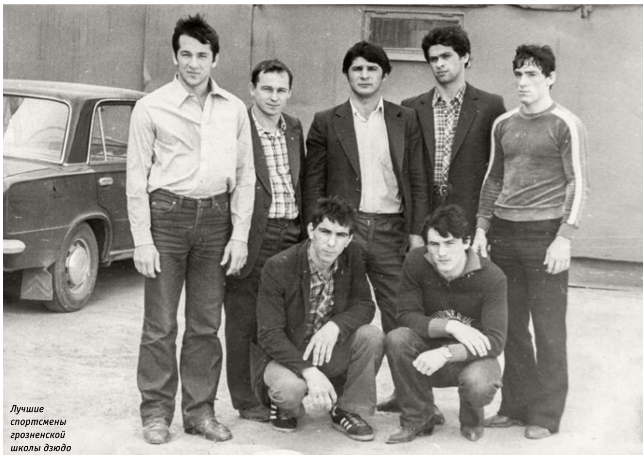
Лучшие спортсмены грозненской школы дзюдо