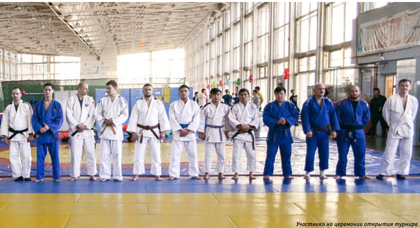
Участники на церемонии открытия турнира

профессиональной реабилитации лиц с ограниченными возможностями здоровья (инвалидов) МГТУ им. Н.Э. Баумана, реализующий их инклюзивное обучение). Одним из доступных для занятий видов спорта является дзюдо.