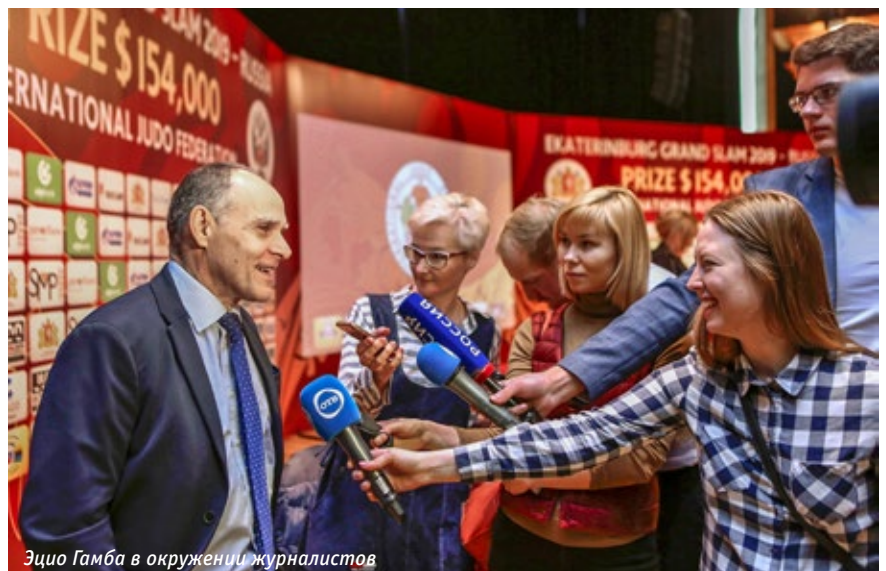
Эцио Гамба в окружении журналистов