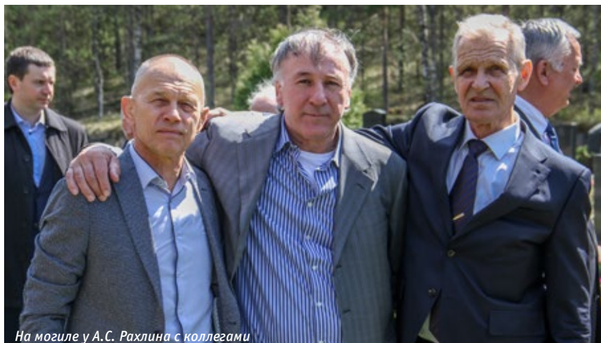
На могиле у А.С. Рахлина с коллегами