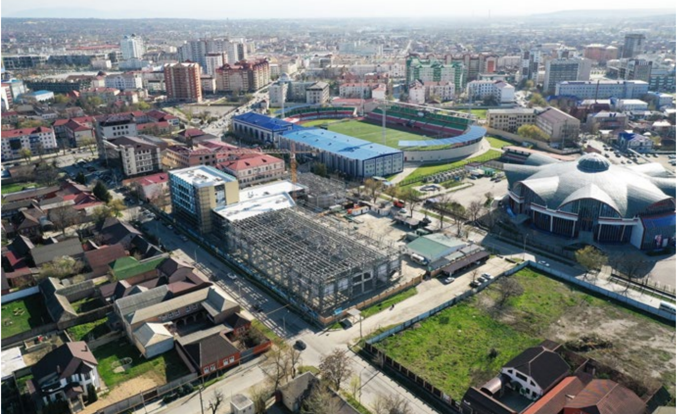
Строительство олимпийского центра развития дзюдо имени Владимира Путина

– Да, этот уникальный объект планируется сдать в 2019 году.