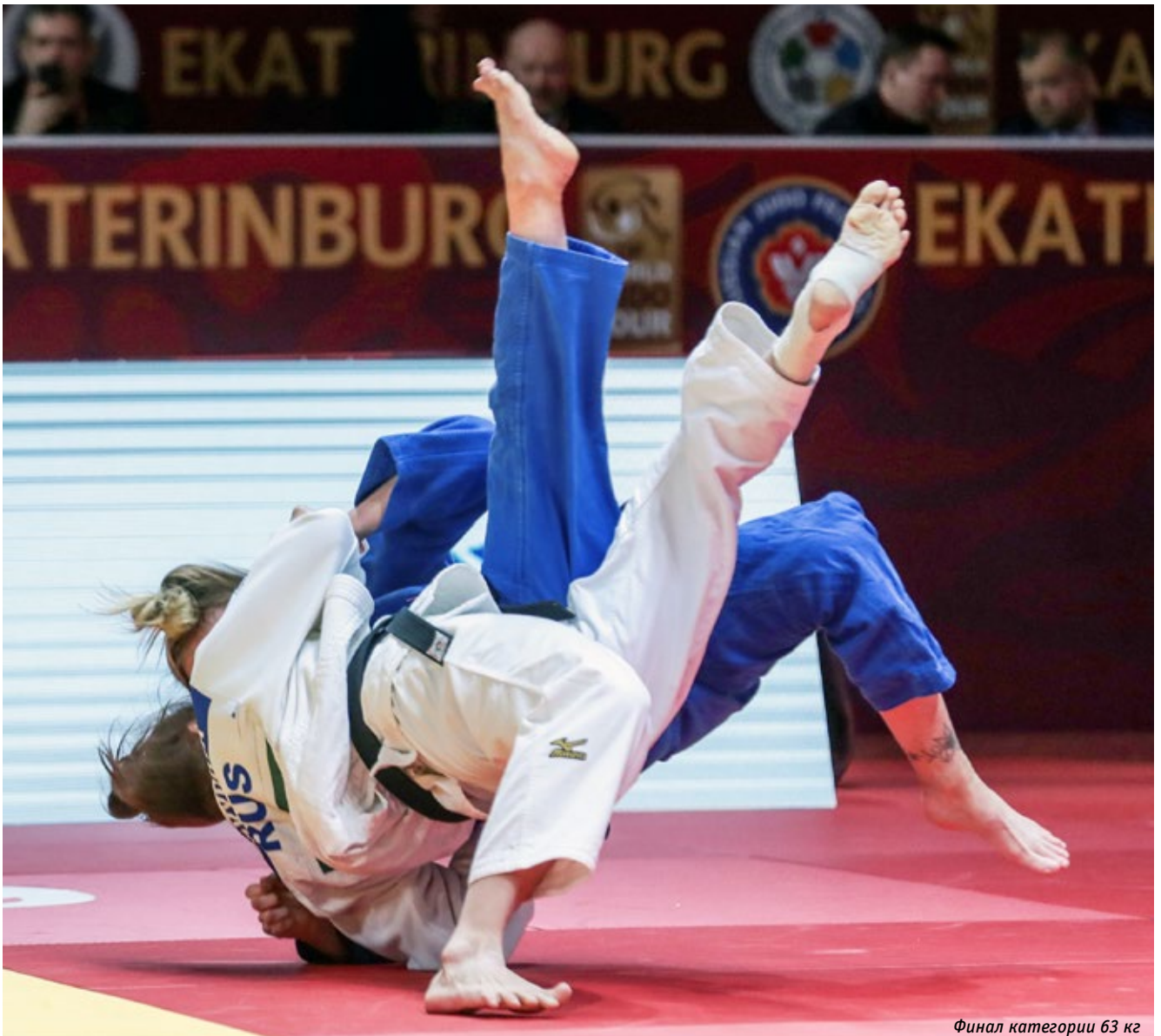
Финал категории 63 кг