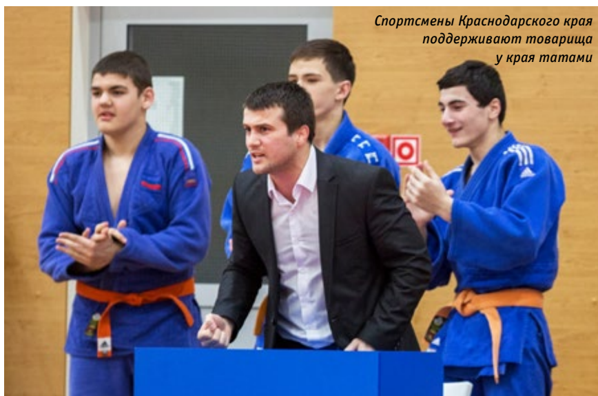
Спортсмены Краснодарского края поддерживают товарища у края татами