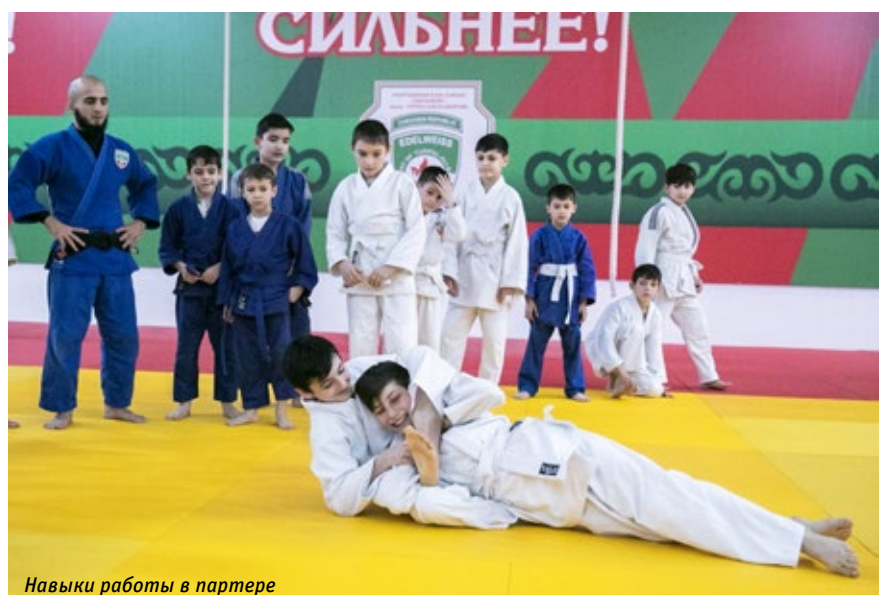
Навыки работы в партере