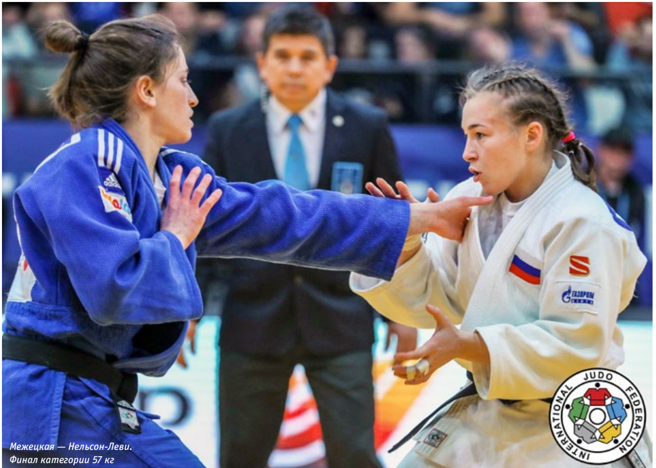
Межецкая — Нельсон-Леви. Финал категории 57 кг

трибунах израильские дзюдоисты собрали урожай из семи медалей (4-2-1) и завершили турнир лидерами итогового протокола.