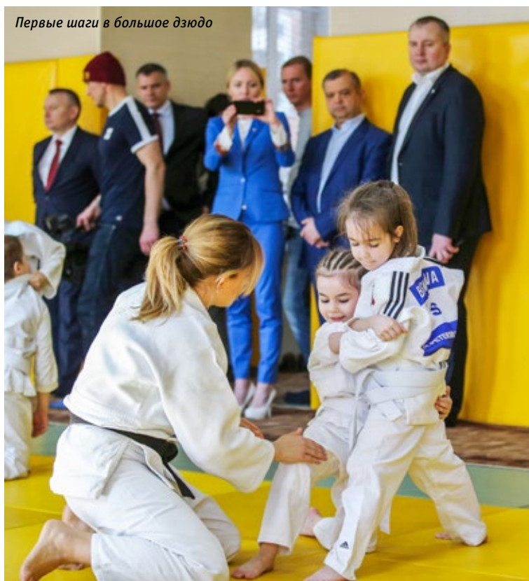
Первые шаги в большое дзюдо