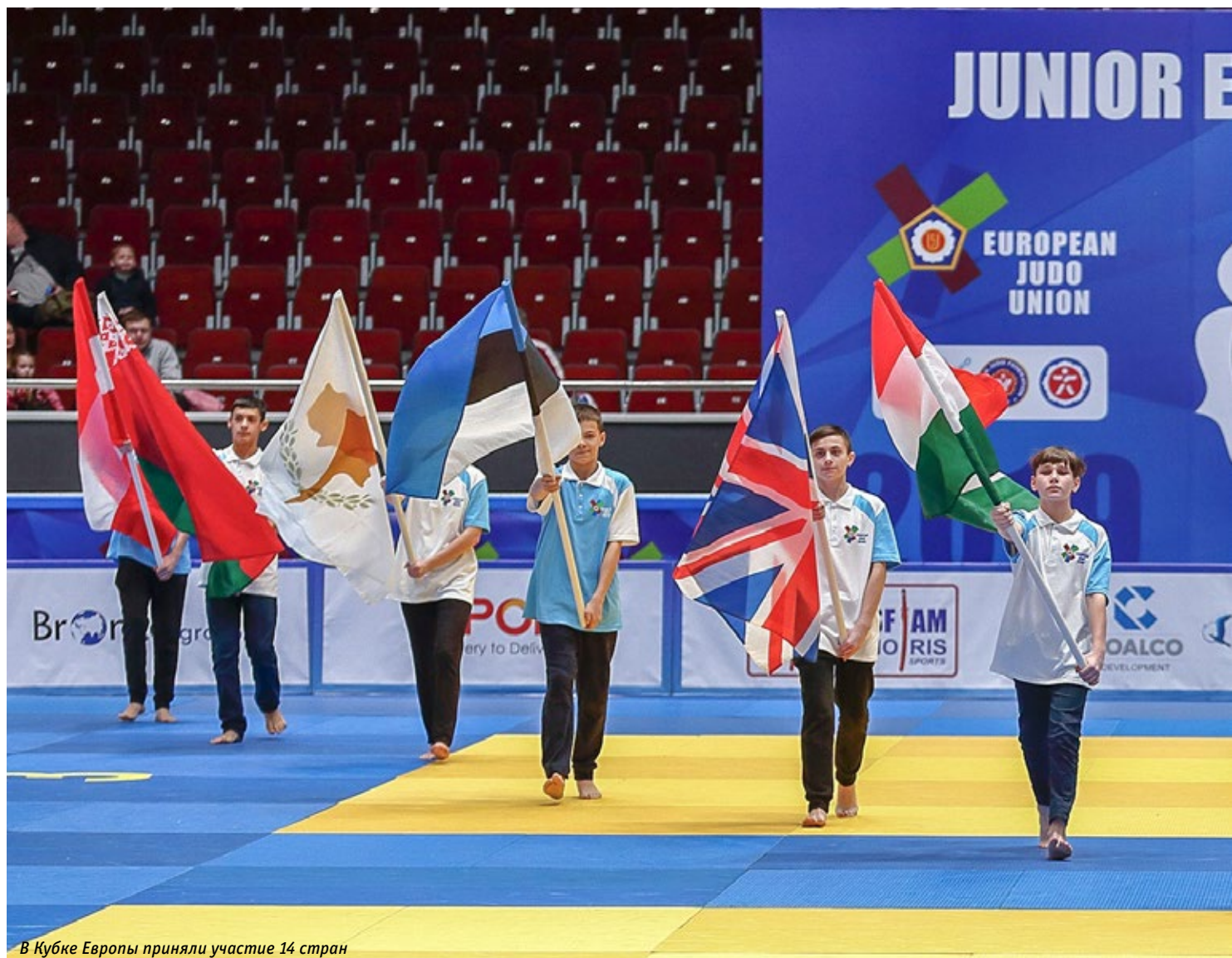
В Кубке Европы приняли участие 14 стран