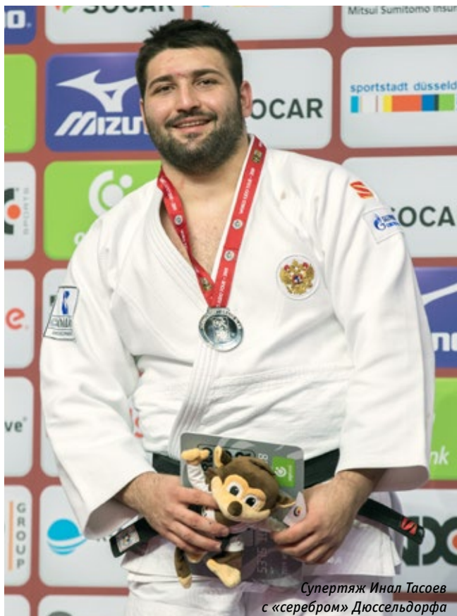
Супертяж Инал Тасоев с «серебром» Дюссельдорфа