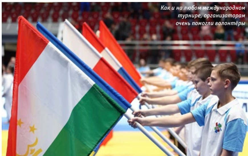
Как и на любом международном турнире, организаторам очень помогли волонтеры