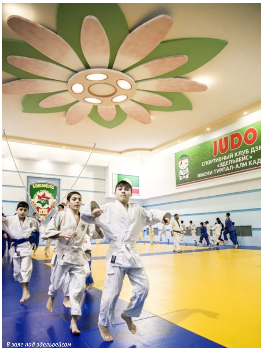
В зале под эдельвейсом