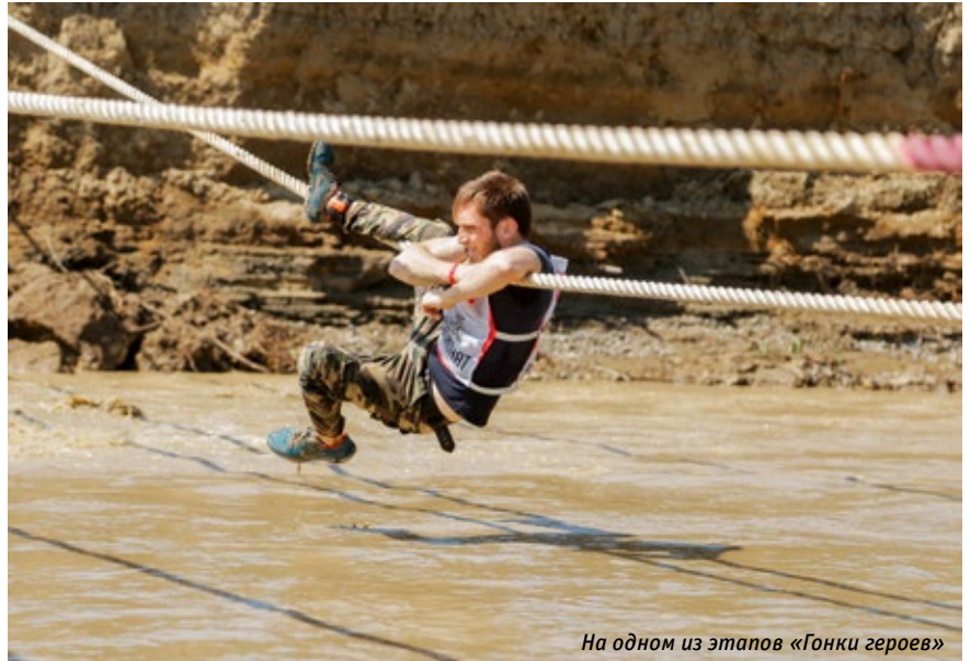
На одном из этапов «Гонки героев»

Ещё один показательный момент растущей силы наших дзюдоистов — победа спортсменов «Эдельвейса» в «Гонке героев», российском экстремальном забеге с препятствиями по пересеченной местности в Грозном. Она была признана участниками и организаторами самой сложной: 39 этапов, раскиданных на девяти долгих километрах с перепадом высот более 200 метров под палящим солнцем среди гор, рек и густого леса. Участники, а их было более 2,5 тысяч,