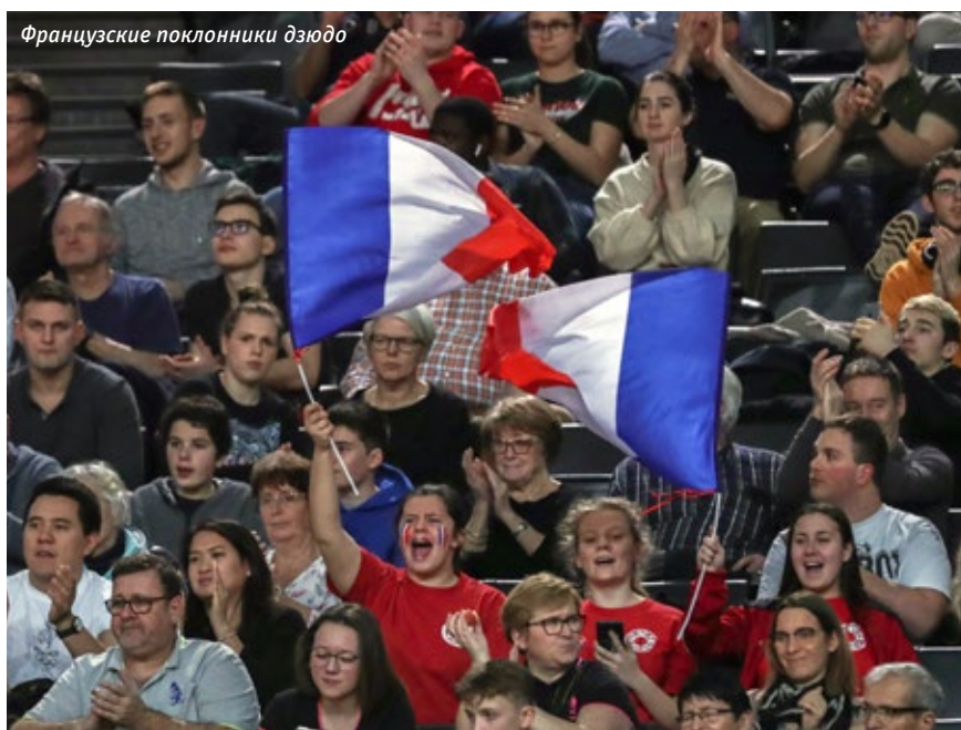
Французские поклонники дзюдо

Уникальность парижского турнира, который обоснованно называют неофициальным чемпионатом мира, складывается из нескольких параметров. Это история состязаний, которая насчитывает без малого полвека; это репутация — бороться в Париж приезжают атлеты со всей планеты: как самые титулованные (в 2019-м на татами выходили чемпионы Олимпийских игр: