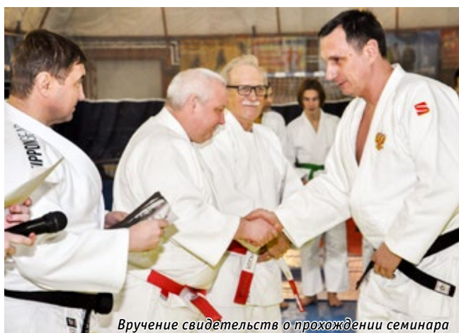
Вручение свидетельств о прохождении семинара