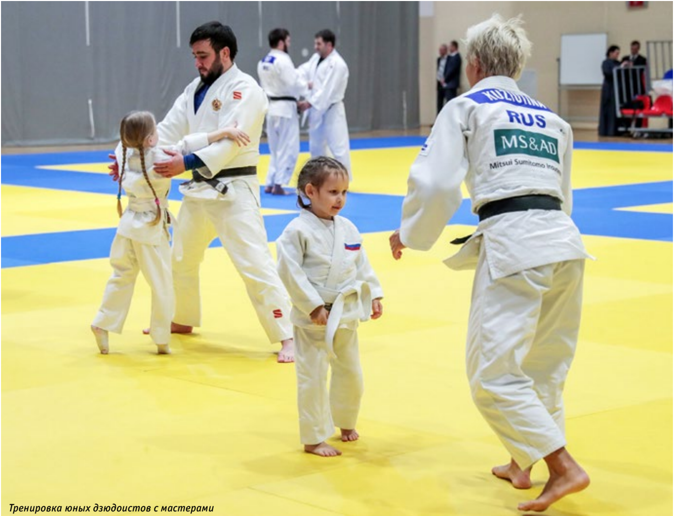
Тренировка юных дзюдоистов с мастерами