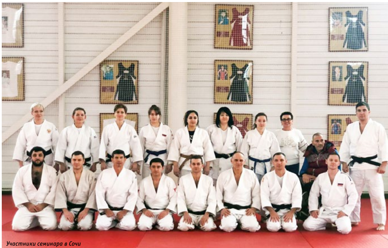
Участники семинара в Сочи