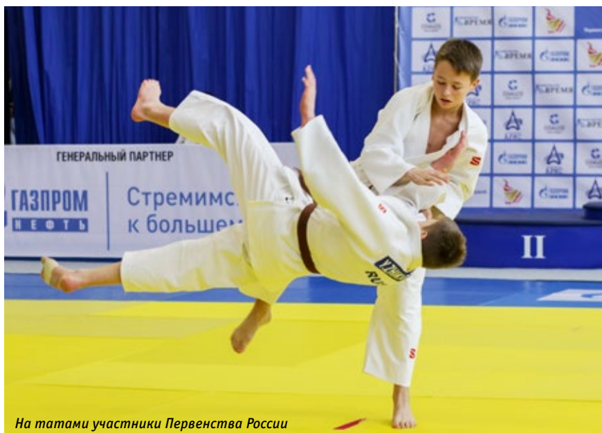
На татами участники Первенства России