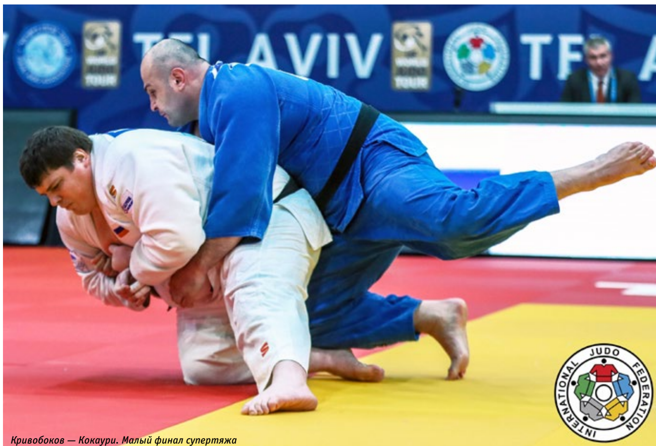
Кривобоков — Кокаури. Малый финал супертяжа