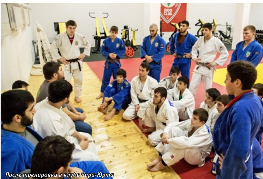
После тренировки в клубе Чире-Юрта

лодые, амбициозные, увлечённые, с горящими глазами, но при этом ответственные, нацеленные на результат. Многие сами ещё недавно боролись на татами, а сегодня реализуют себя в новой ипостаси.