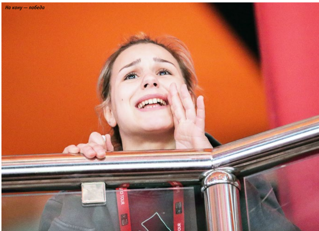
На кону — победа