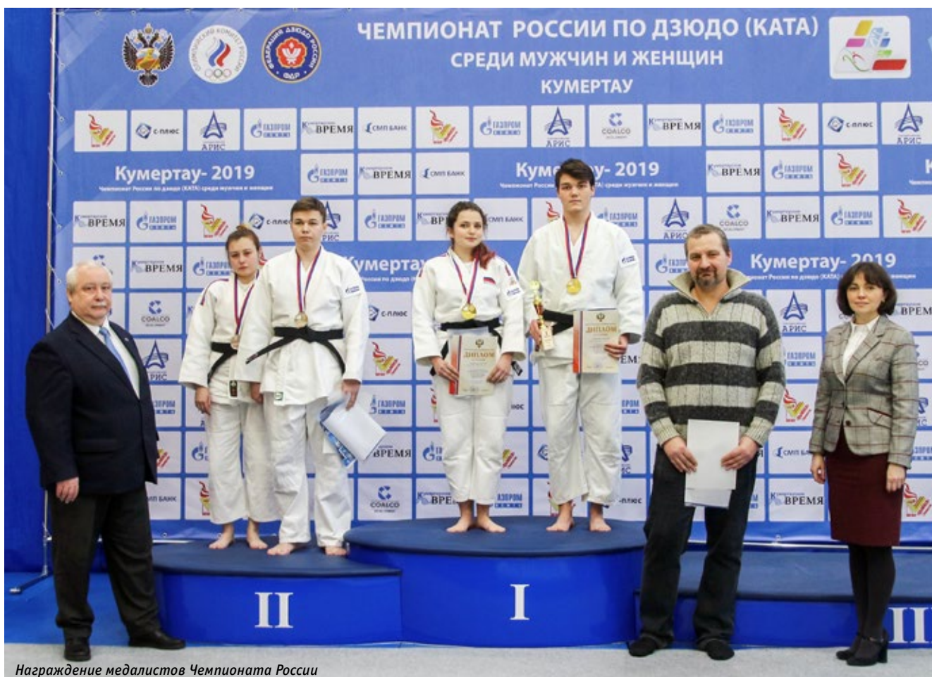
Награждение медалистов Чемпионата России