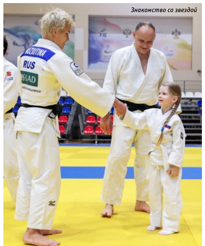
Знакомство со звездой