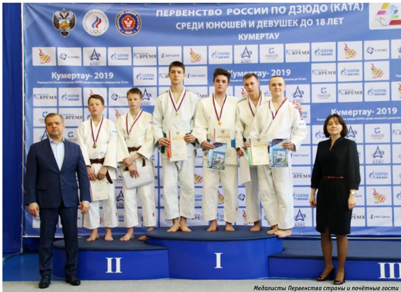
Медалисты Первенства страны и почётные гости