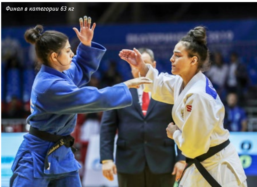
Финал в категории 63 кг

шла к этому результату и довольна, что достигла поставленной цели! Все получилось так, как я задумала: смогла вывести соперницу в партер и провести болевой приём, принёсший мне „золото“!»