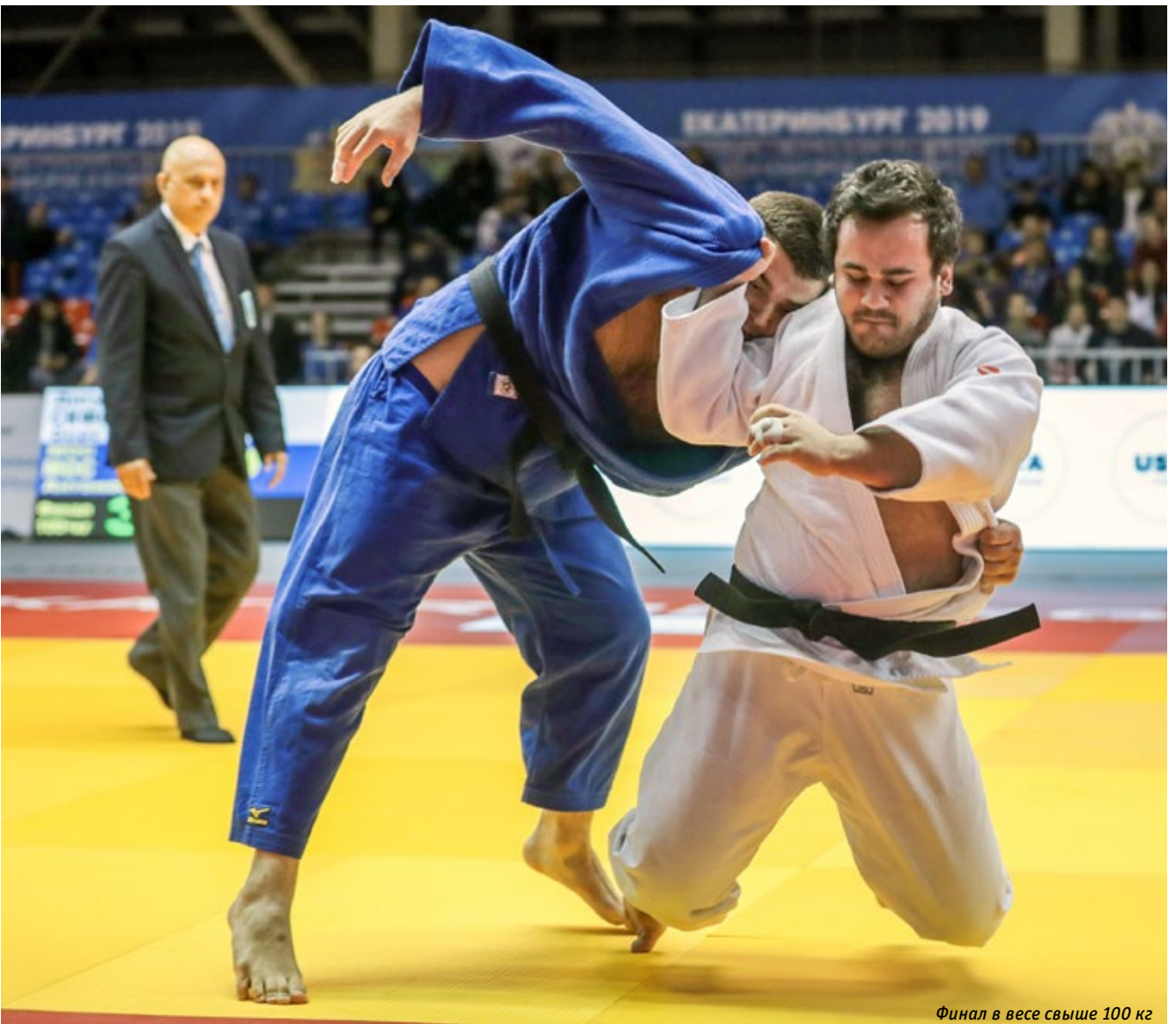
Финал в весе свыше 100 кг