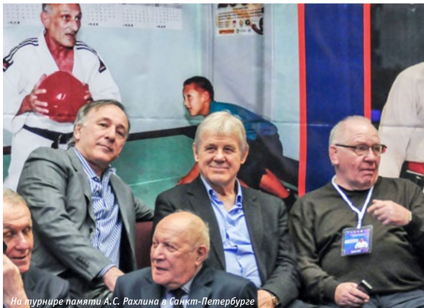
На турнире памяти А.С. Рахлина в Санкт-Петербурге