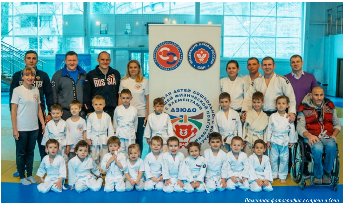
Памятная фотография встречи в Сочи