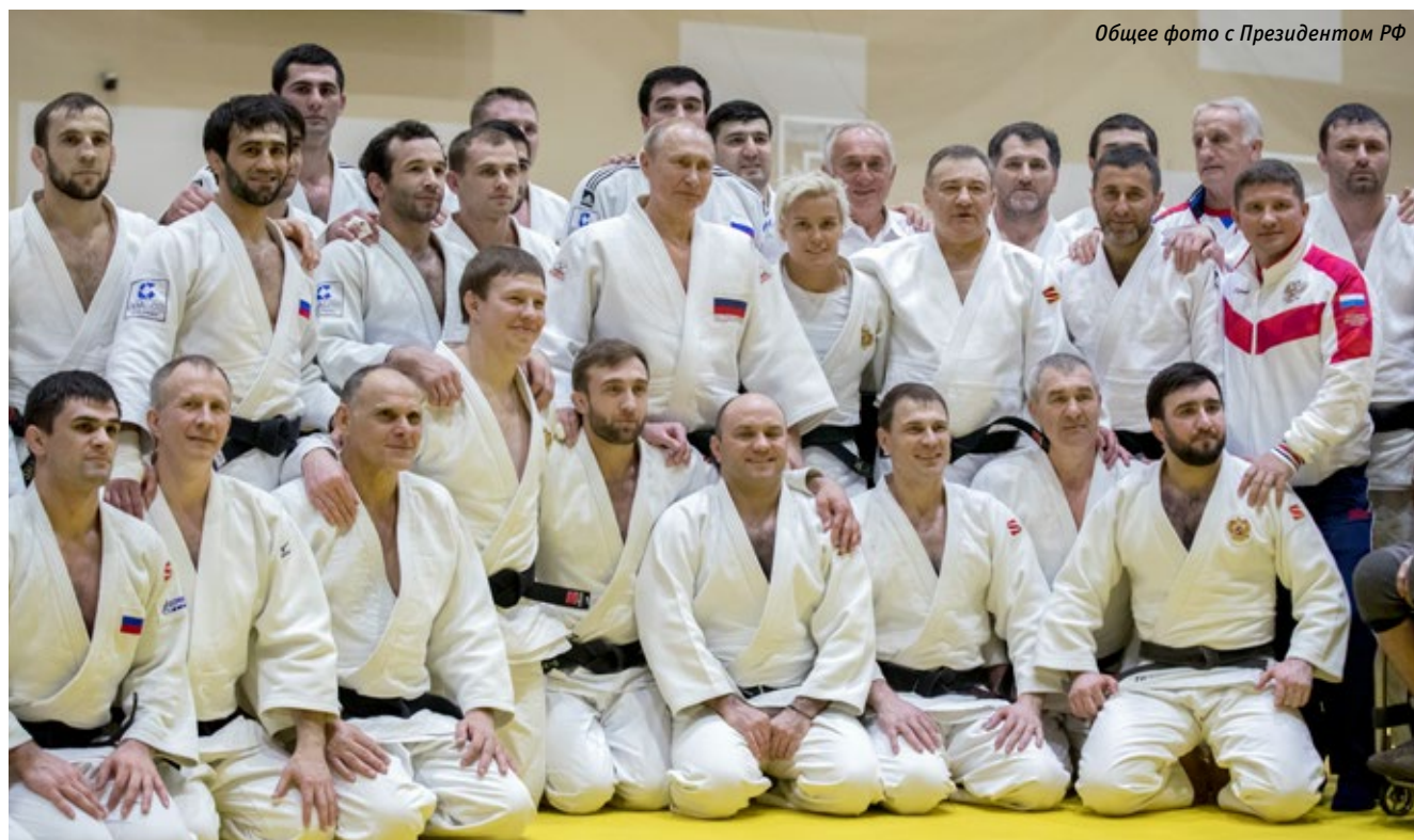
Общее фото с Президентом РФ