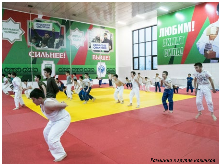
Разминка в группе новичков