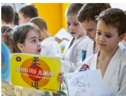
96. Детское дзюдо в Санкт-Петербурге