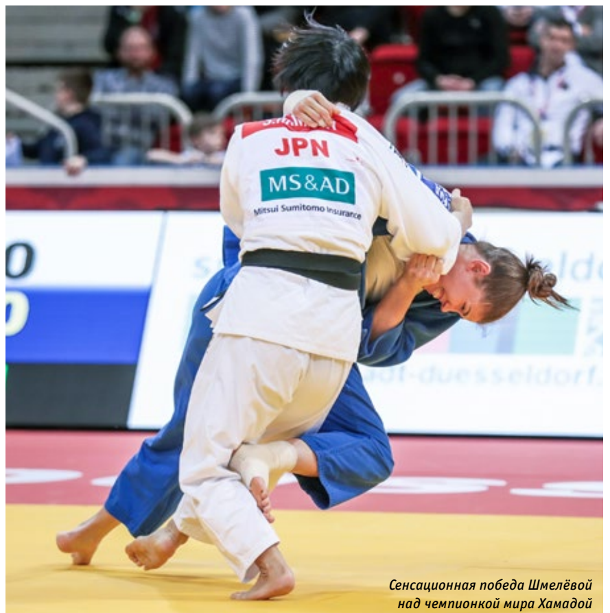
Сенсационная победа Шмелёвой над чемпионкой мира Хамадой