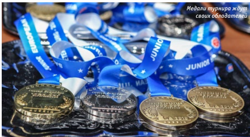
Медали турнира ждут своих обладателей