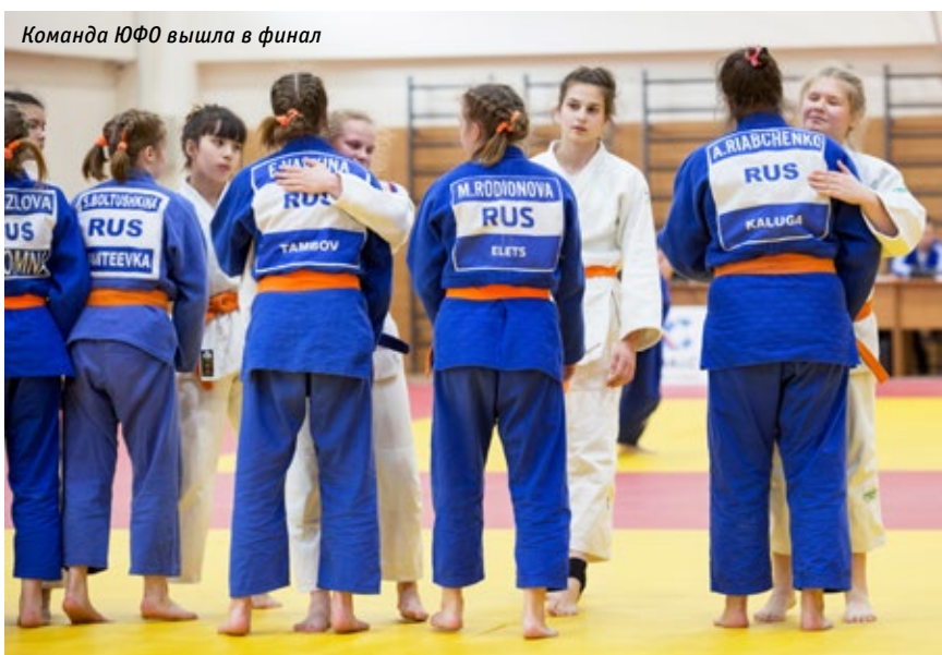
Команда ЮФО вышла в финал

то». Мы же стали первыми в общем зачёте, что особенно приятно. Теперь я хочу выполнить норматив КМС, а в будущем, разумеется, выиграть Олимпийские игры!»