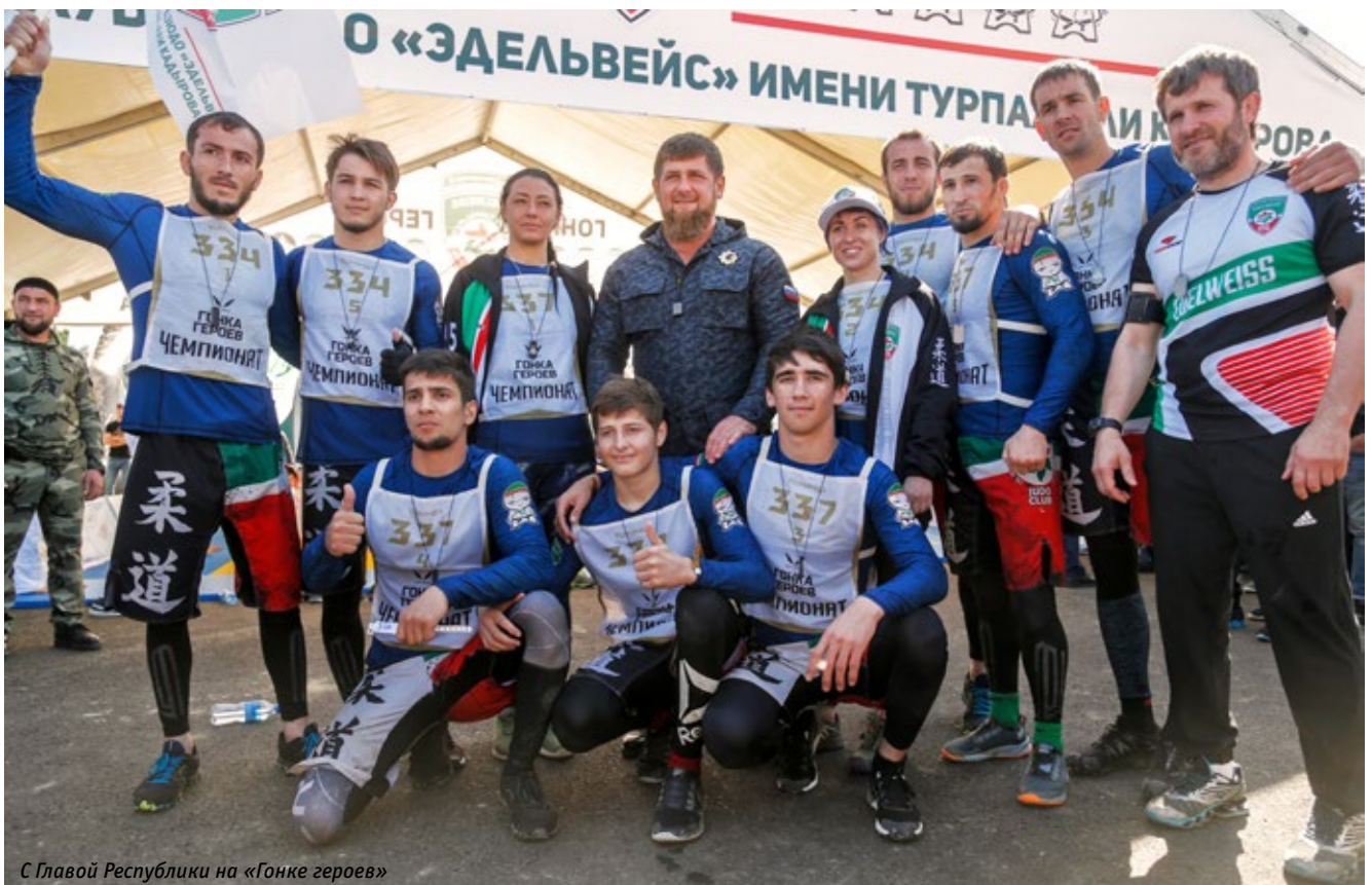
С Главой Республики на «Гонке героев»

– У нас прекрасный тренерский коллектив: все работают вместе, сообща. Большинство — бывшие спортсмены, выпускники пединсти-