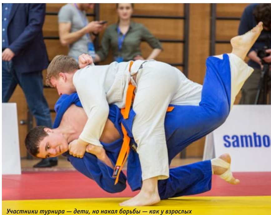
Участники турнира — дети, но накал борьбы — как у взрослых