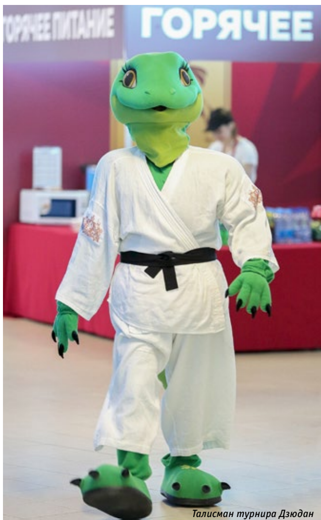
Талисман турнира Дзюдан