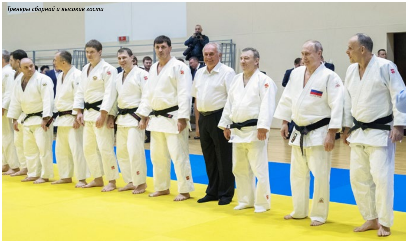
Тренеры сборной и высокие гости