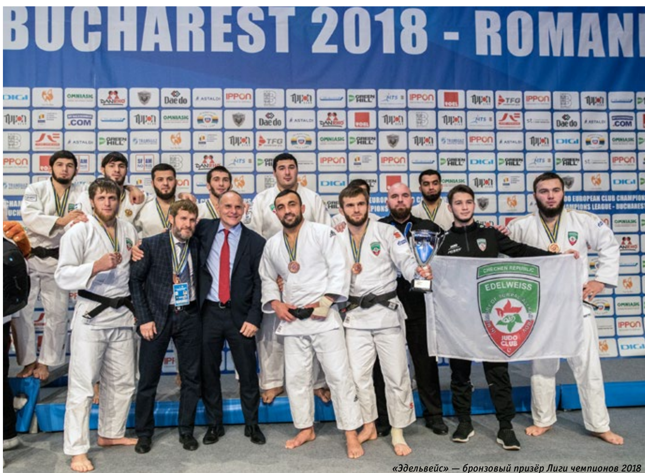
«Эдельвейс» — бронзовый призёр Лиги чемпионов 2018