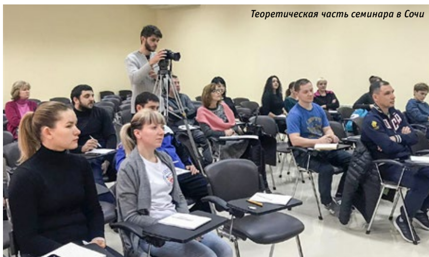
Теоретическая часть семинара в Сочи

По словам Гамбы, он остался доволен той работой с дошкольниками, результаты которой увидел в Сочи.