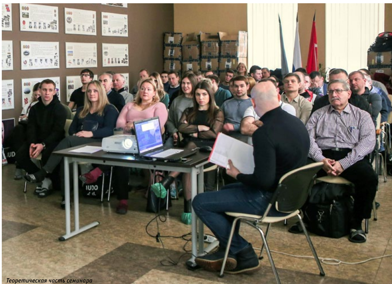
Теоретическая часть семинара