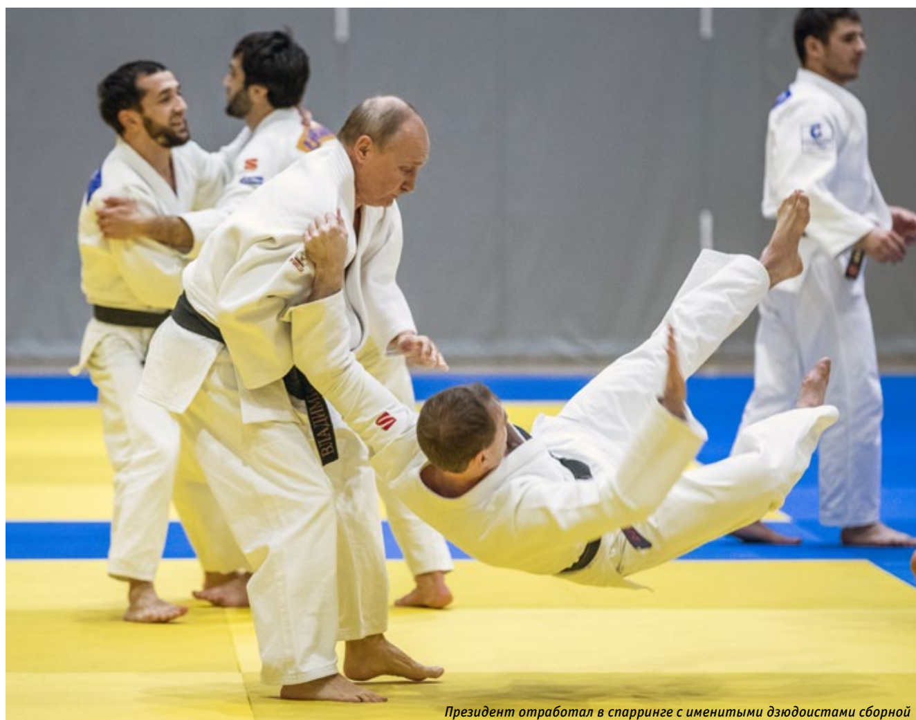
Президент отработал в спарринге с именитыми дзюдоистами сборной