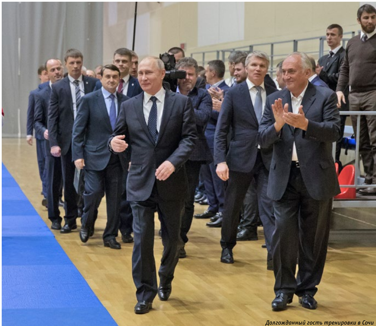
Долгожданный гость тренировки в Сочи

14 ФЕВРАЛЯ В СОЧИ ПРЕЗИДЕНТ РОССИИ ВЛАДИМИР ПУТИН ПОСЕТИЛ ТРЕНИРОВКУ СБОРНОЙ ПО ДЗЮДО НА БАЗЕ ЦЕНТРА СПОРТИВНОЙ ПОДГОТОВКИ «ЮГ СПОРТ».