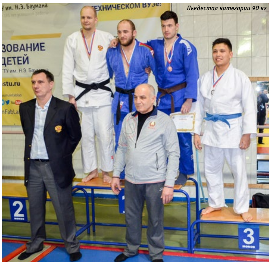
Пьедестал категории 90 кг