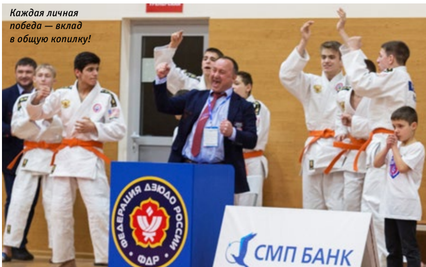
Каждая личная победа — вклад в общую копилку!