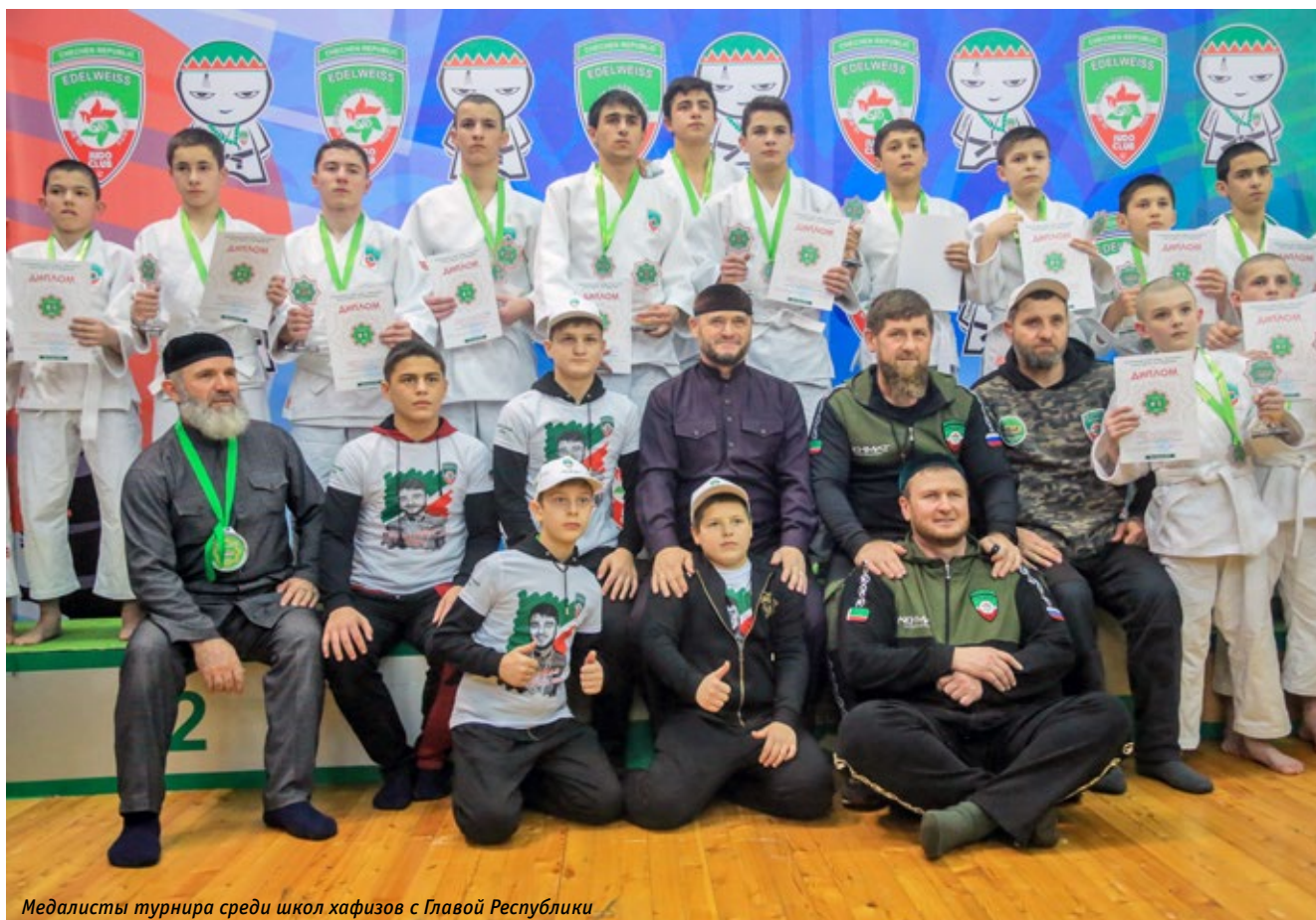
Медалисты турнира среди школ хафизов с Главой Республики

Нам хочется увидеть плоды своей работы, прогресс чеченского дзюдо. Специалисты из других регионов признаются, что завидуют нам: мы не упустили момент, вы-