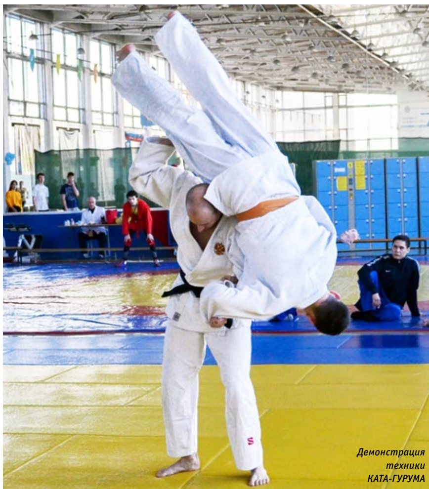
Демонстрация техники КАТА-ГУРУМА