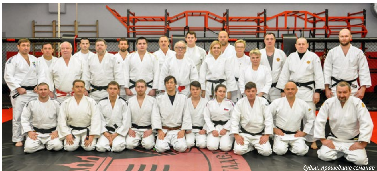
Судьи, прошедшие семинар