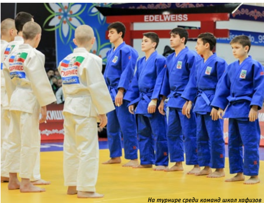
На турнире среди команд школ хафизов