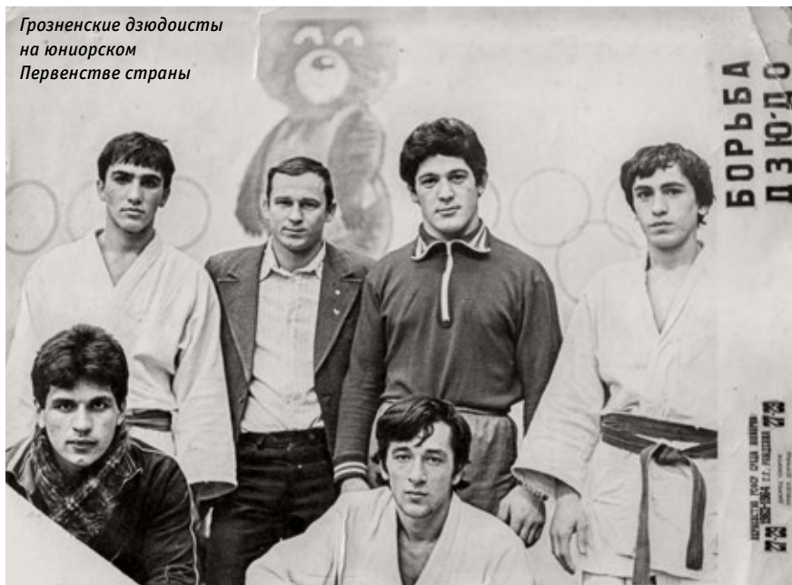
Грозненские дзюдоисты на юниорском Первенстве страны

«Броски можно исполнить по-разному, но Башир боролся так, что это было скорее искусство, нежели борьба, — считает известный политик, советник Президента РФ, мастер спорта международного