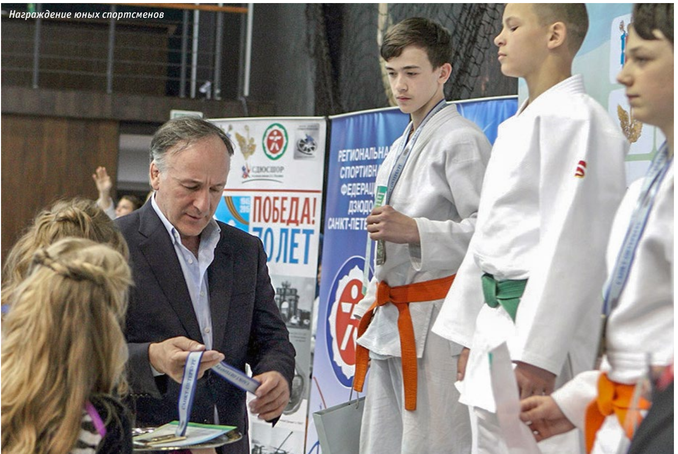
Награждение юных спортсменов

тамбуре и обратно. Ужин — та же история, завтрак второго дня... Я всё «в ресторане ем», а сам уже не знаю, как дожить голодному до дома. Наступает время обеда. Соседи мои стол накрыли — хлеб, колбаса, овощи. И один другому громко так, чтоб я услышал, говорит: «Пойдём, покурим перед обедом?»