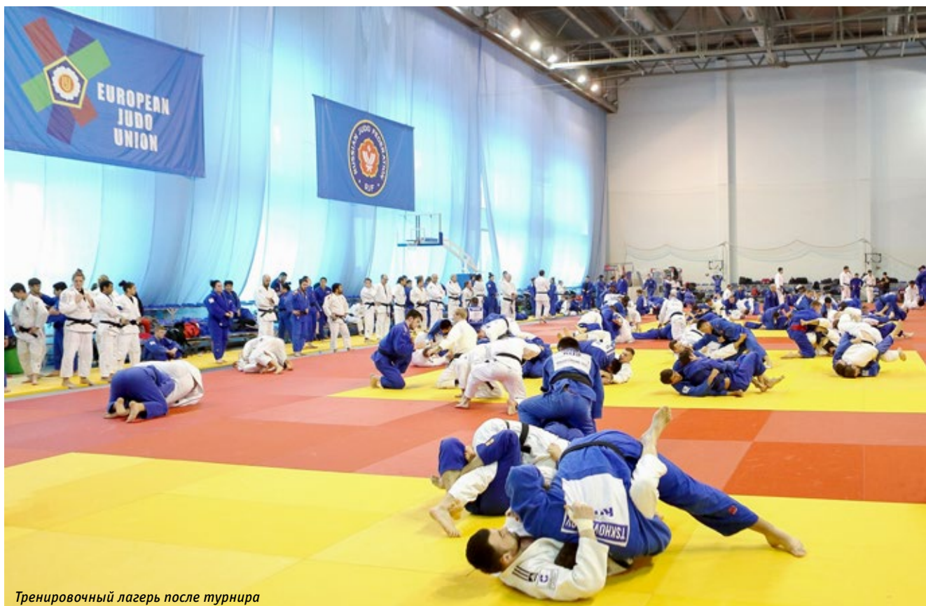
Тренировочный лагерь после турнира

«Это хороший результат. Нельзя выиграть во всех весовых категориях, это дзюдо: соперники у нас серьезные. Важно, что все ответственно проделали свою работу» , — считает Генеральный менеджер сборной России Эцио Гамба.