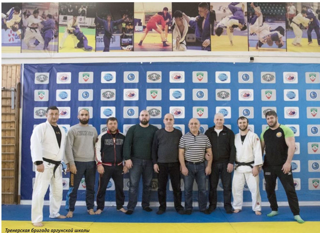
Тренерская бригада аргунской школы