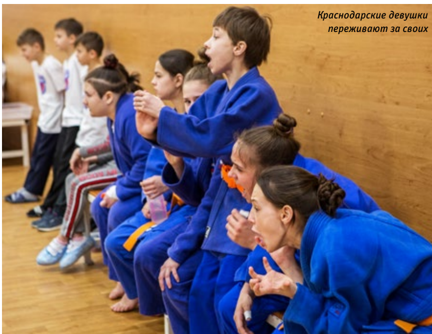
Краснодарские девушки переживают за своих

ребята из команды «Краснодарский край-1», на третью — «Урал-Западная Сибирь-1».