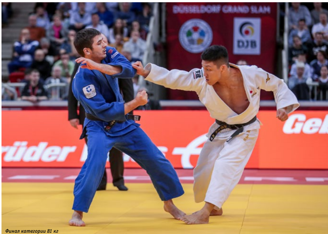
Финал категории 81 кг