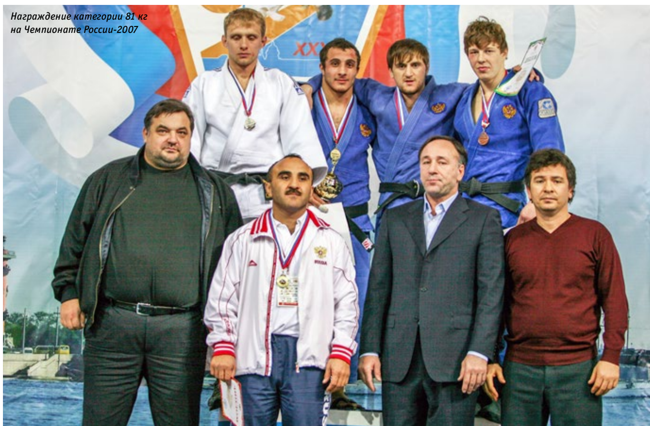
Награждение категории 81 кг на Чемпионате России-2007

Переглянувшись, они все вместе демонстративно покинули купе, оставив меня одного. Я на еду набросился как волк. Как же мне было вкусно! Поел и обратно на полку. Тут и они вернулись и, сделав вид, что не заметили поредевший ассортимент, сели за стол. Вот какие люди!