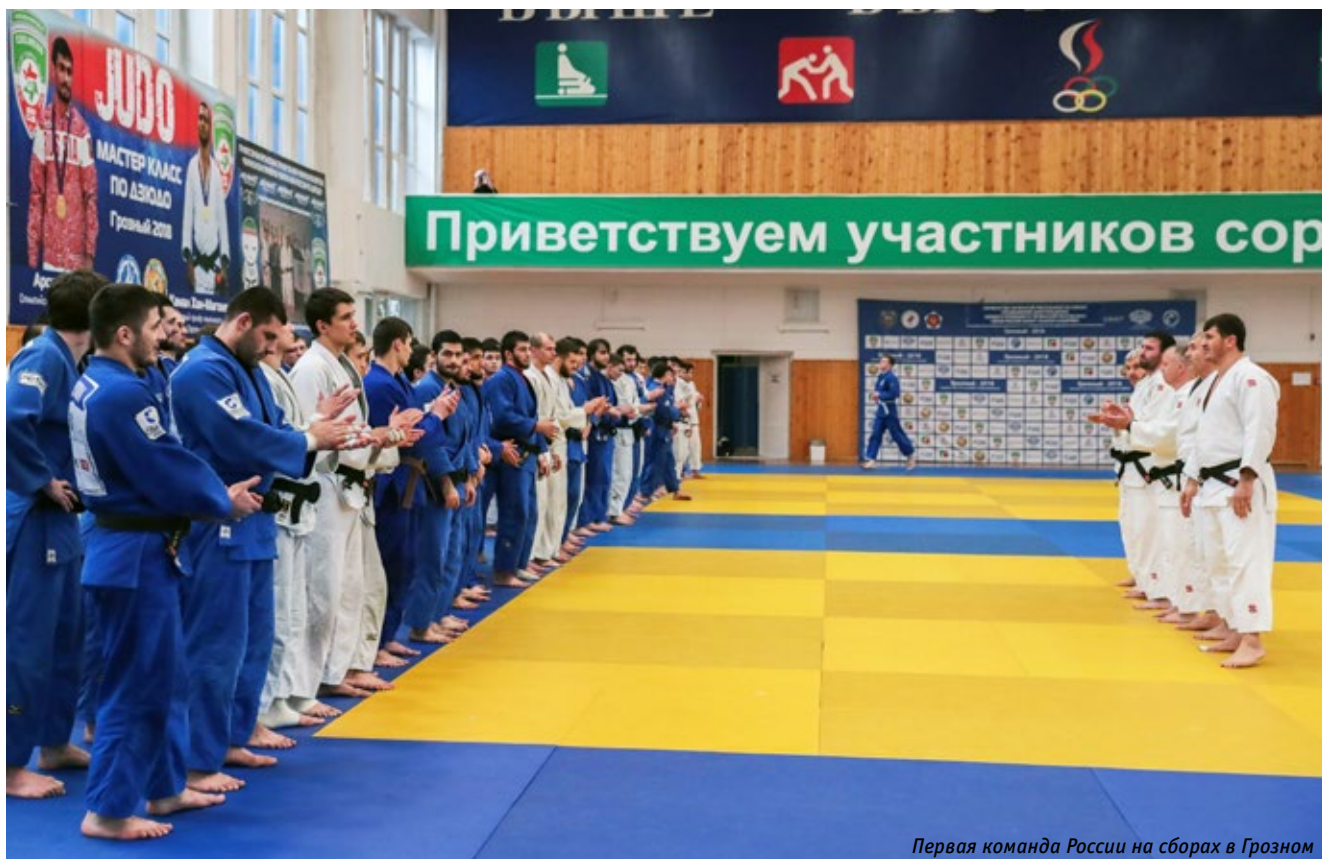
Первая команда России на сборах в Грозном