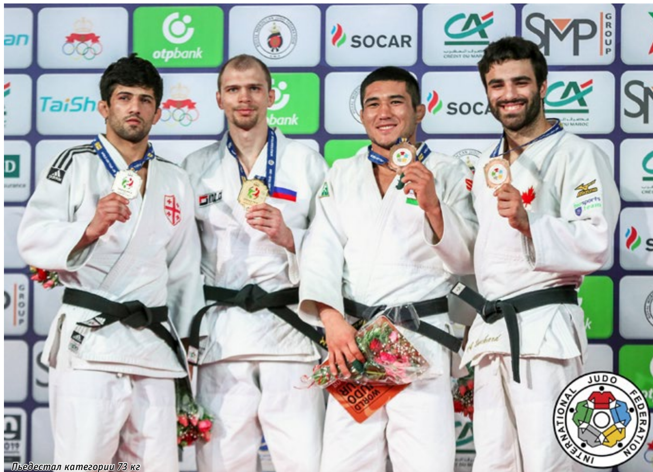
Пьедестал категории 73 кг

МАРОККАНСКИЙ МАРРАКЕШ — ЧЕТВЁРТЫЙ ПО ВЕЛИЧИНЕ ГОРОД ЭТОЙ АФРИКАНСКОЙ СТРАНЫ, В ВЕСЕННИЙ УИКЕНД 8-10 МАРТА ПРИНЯЛ У СЕБЯ ЧЕТВЁРТЫЙ ЭТАП «МИРОВОГО ТУРА IJF» 2019 ГОДА — ТУРНИР «ГРАН-ПРИ» ПО ДЗЮДО.