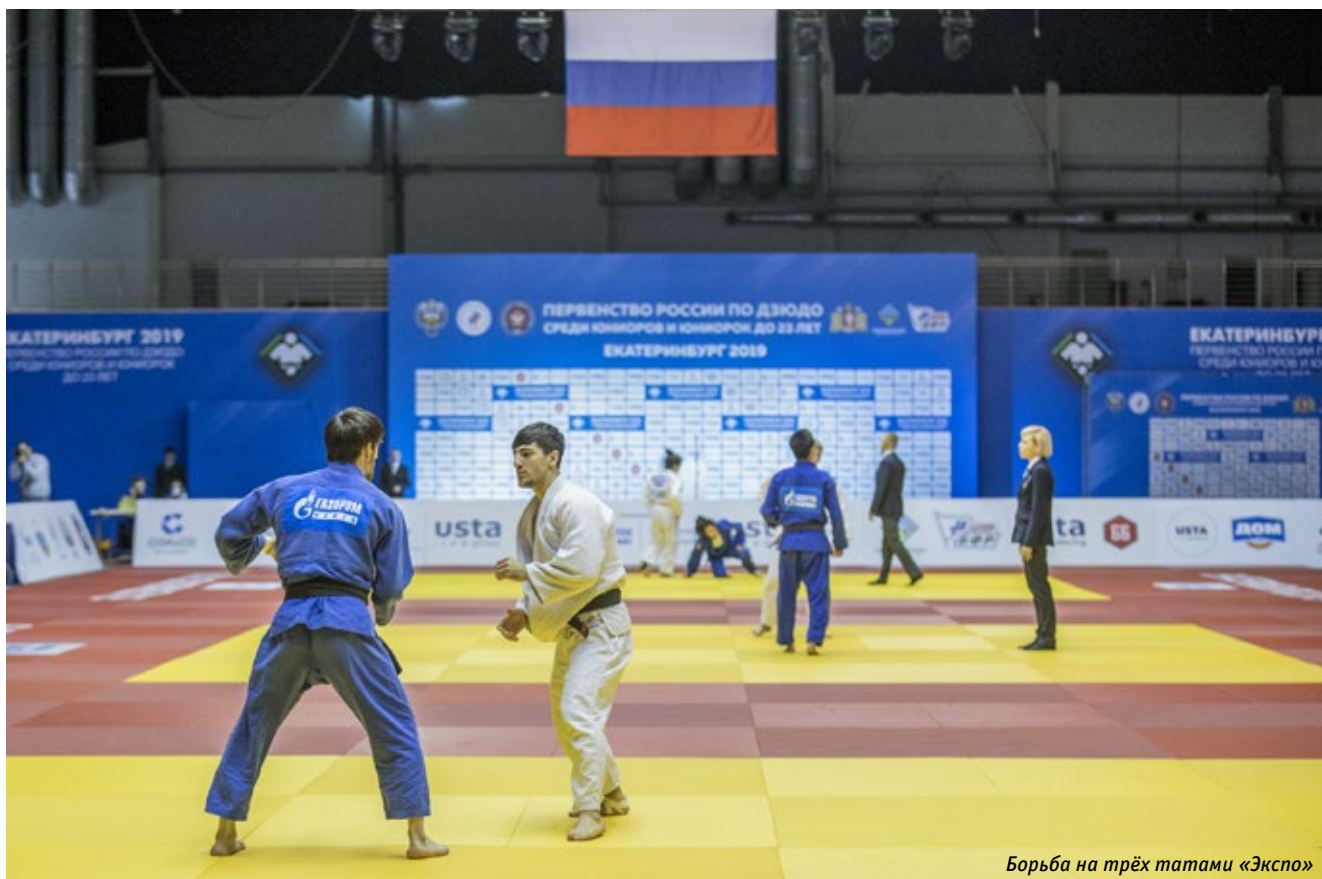
Борьба на трёх татами «Экспо»