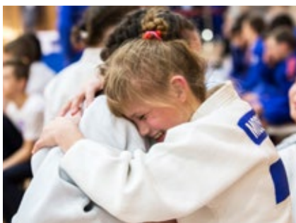
91. Юношеское Первенство России (КАТА-группа) в Новороссийске