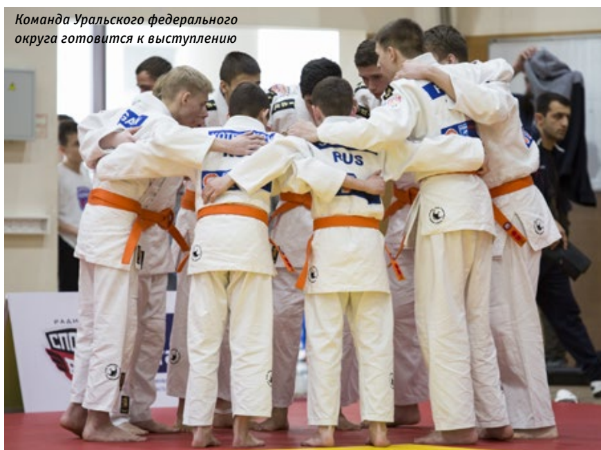
Команда Уральского федерального округа готовится к выступлению