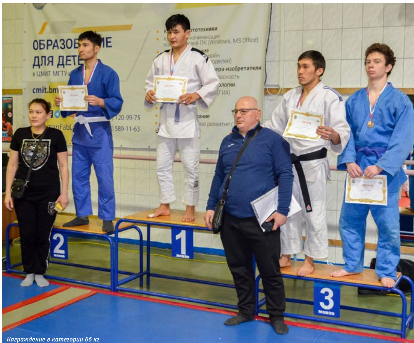
Награждение в категории 66 кг