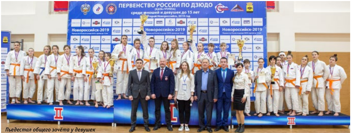
Пьедестал общего зачёта у девушек