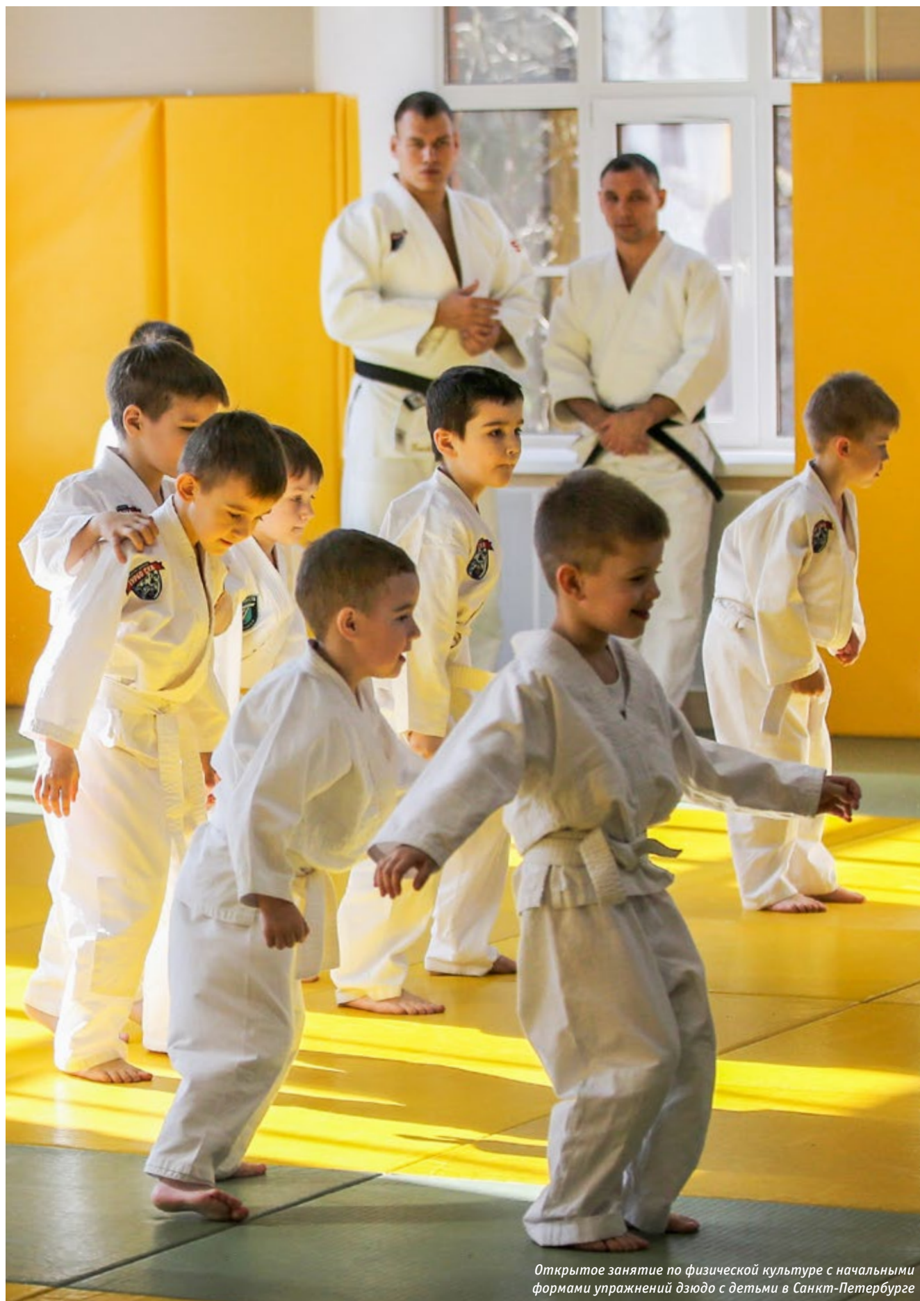
Открытое занятие по физической культуре с начальными формами упражнений дзюдо с детьми в Санкт-Петербурге