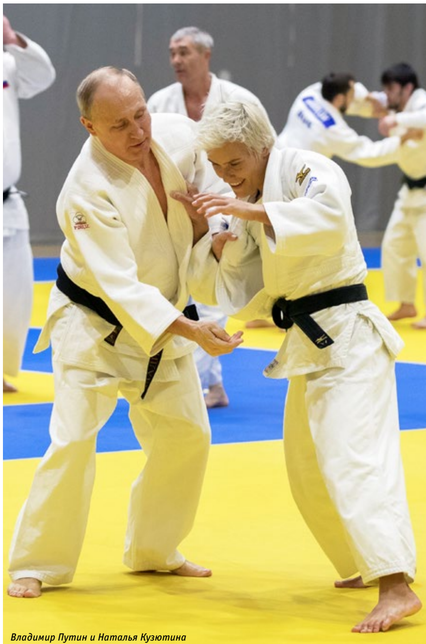
Владимир Путин и Наталья Кузютина

цев, что называется. Не только чувствует, но и понимает, что происходит. И там, где нужно, и поможет, и поддержит, и потом — с ним безопасно», — поделился своими впечатлениями Президент. Путин подчеркнул, что с высококлассными спортсменами ему легче и надёжнее.