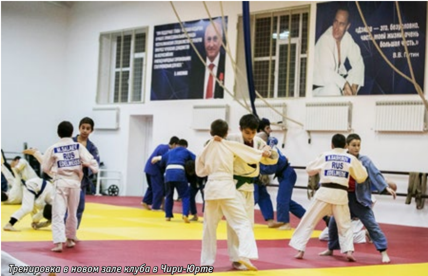
Тренировка в новом зале клуба в Чире-Юрте