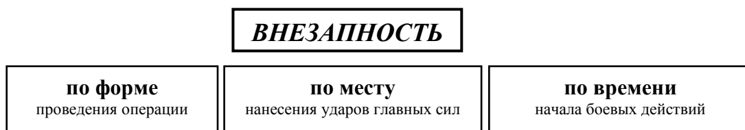
Схема №1. Достижение внезапности нападения на СССР летом 1941 г.

В такой же неопределенности советское командование находилось при определении мест и направлений нанесения противником главных ударов. Это обстоятельство крайне негативно отразилось на действиях приграничной группировки Красной армии в первые дни войны. Не заметив действий танковой группы Гудериана в направлении на Барановичи, командующий Западным фронтом генерал-полковник Д.Г. Павлов обрек значительную часть своих войска на окружение.