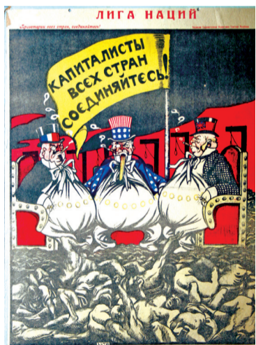
В. Н. Дени. Лига наций. 1919 г.

В России агитационные плакаты сыграли огромную роль в событиях 1917 года. Они несли массам призывы большевистской партии, звали на борьбу за свободу и справедливость. Советское правительство нуждалось в пропаганде своих идей и целей. Большинство дореволюционных художников стали сотрудничать с советской властью, а те, что не находили признания до революции, оказались востребованными и оставались таковыми до прихода социалистического реализма,