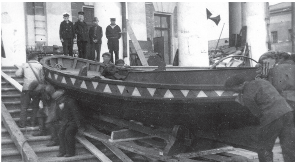
Ботик Петра Первого перемещают в здании Биржи

Сегодня ботик экспонируется в Зале славы русского флота в основном здании Центрально-