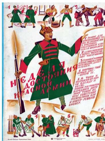
Д. С. Моор. Неделя достояния Красной Армии. 1921 г.