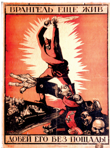
Д. С. Моор. Врангель еще жив. Добей его без пощады. 1920-е гг.