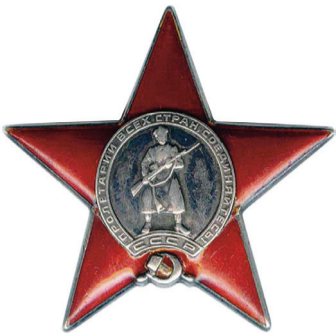
Ордена Красной Звезды