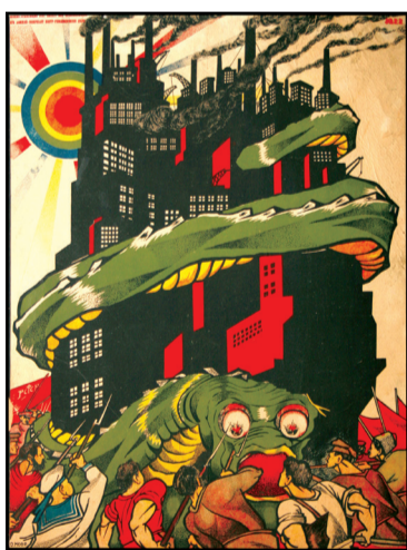
Д. С. Моор. Борьба с капиталом. 1919 г.