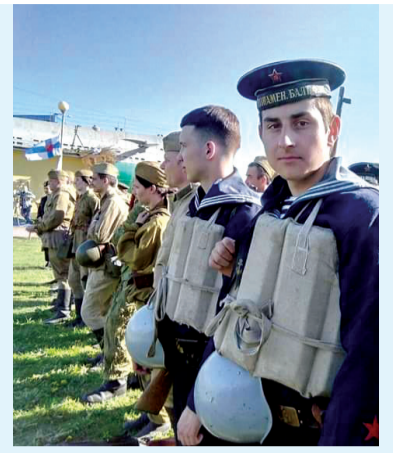
Участники «Ночи музеев» в филиале «Подводная лодка Д-2 "Народовец"»