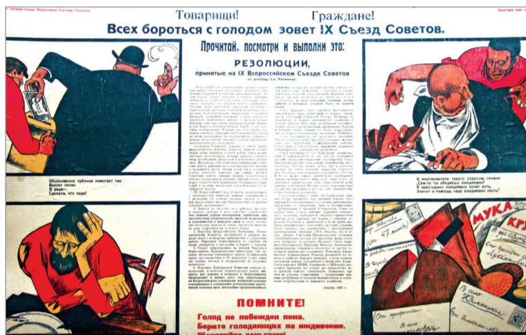
М. М. Черемных. Товарищи! Граждане! Всех бороться с голодом зовет IX Съезд Советов. 1922 г.