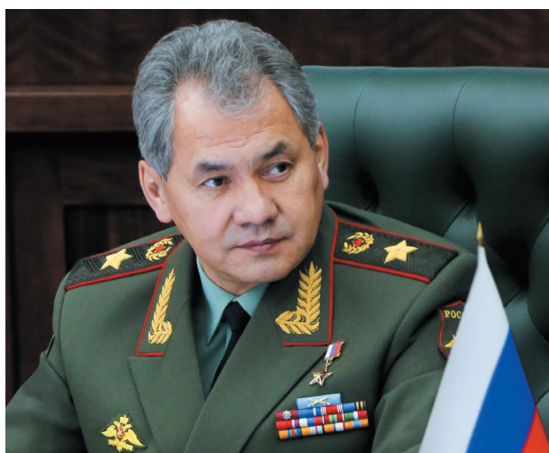
Сергей Кужугетович Шойгу

Сергей Кужугетович Шойгу, генерал армии, министр обороны Российской Федерации