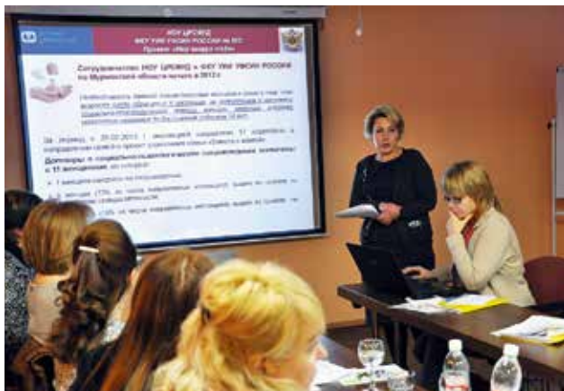
Презентация проекта на заседании Координационного совета по реализации программы «Детская деревня—SOS» в Мурманской области