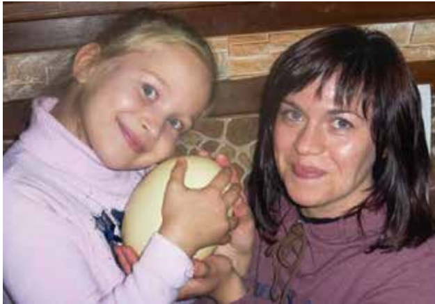
Экскурсия на Мурманскую страусиную ферму, 27.08.2016 г.