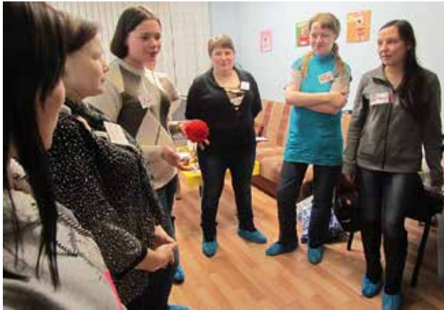
Занятия по программе «Сильные родители—сильные дети»