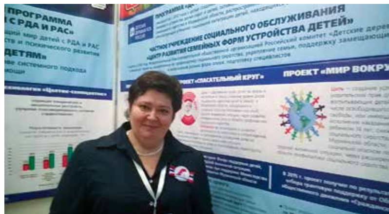
Презентация проекта на VII Всероссийской выставке-форуме «Вместе — ради детей! Вместе с детьми», 07–09.09.2016 г.

7–9 сентября 2016 г. в Москве состоялась VII Всероссийская выставка-форум «Вместе — ради детей! Вместе с детьми», организатором которой является Фонд поддержки детей, находящихся в трудной жизненной ситуации. Для представления программы