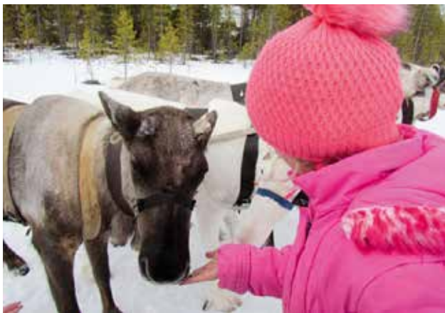
Информационно-познавательный тур-путешествие в хаски-парк «Лесная Елань», 03.04.2016 г.