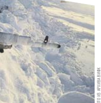
На Северном полюсе курсанты проводили утреннюю физическую зарядку, выполняли нормативы боевой подготовки, участвовали в вечерней поверке.

щего ледового лагеря «Барне» и в течение семи суток преодолели более ста километров с грузом за плечами. Северного полюса группа достигла 13 апреля в 1 час 59 минут. Интересный факт: будучи в столь непростых условиях, ребята занимались утренней физической зарядкой, выполняли нормативы боевой подготовки, участво-