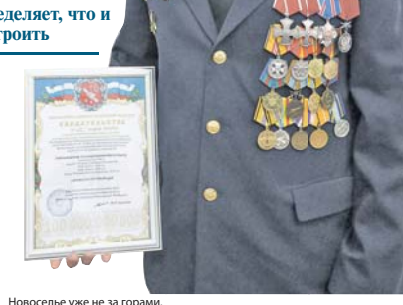
Новоселье уже не за горами.