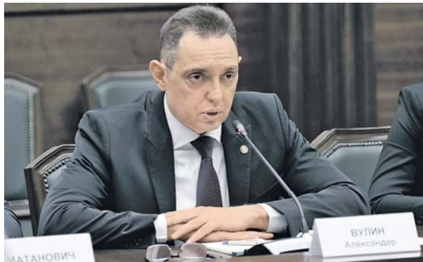
Министр обороны Сербии Александр ВУЛИН

«Отлично, что первый зарубежный визит в новой должности вы совершаете в Россию, — добавил министр. — Это в очередной раз подчеркивает особый характер российско-китайских отношений всеобъемлющего партнерства и стратегического взаимодействия». При этом он выразил уверенность, что встреча будет способствовать углублению дружественных связей между военными ведомствами двух стран.