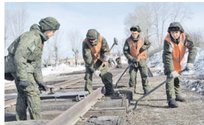
Путьцы-конкурсанты отработывают норматив по сборке звена рельсошпальной решётки.