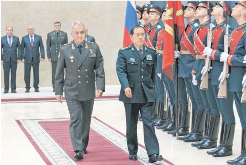
Встреча главы военной делегации Китая – министра обороны КНР генерал-полковника ВЭЙ БЕНХЭ

Наряду с насыщенной программой форума спланировано и проведение на его полях ряда двусторонних переговоров на уровне глав военных ведомств. Так, министр обороны РФ генерал армии Сергей