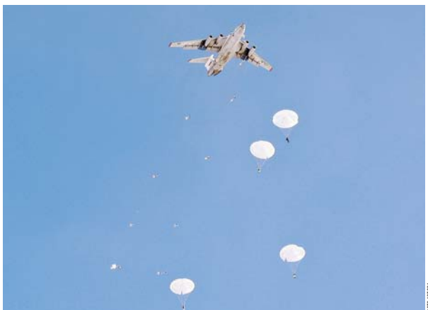
С лёта в бой.