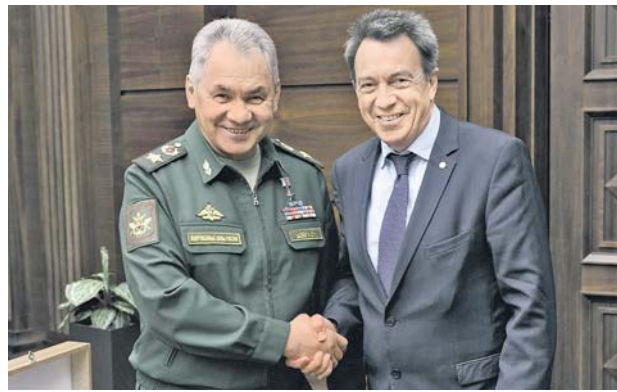
Генерал армии Сергей ШОЙГУ и президент Международного Комитета Красного Креста ПЕТЕР МАУРЕЛ

дународной безопасности станет важной площадкой для обсуждения как вопросов борьбы с терроризмом, так и постконфликтного урегулирования в кризисных регионах. Такое мнение выразила на встрече с министром обороны РФ его индийский коллега Нирупама Ситхараман. «Это важный форум для обсуждения глобальных проблем, которые угрожают миру», — сказала Н. Ситхараман. По её мнению, темой борьбы с терроризмом для этой конференции предопределено время, сделав московскую площадку важной платформой для глобальных наблюдателей.