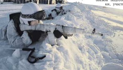
На Северном полюсе курсанты проводили утреннюю физическую зарядку, выполняли нормативы боевой подготовки, участвовали в вечерней поверке.