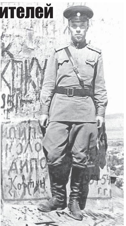
В начале пути.

Санкт-Петербург