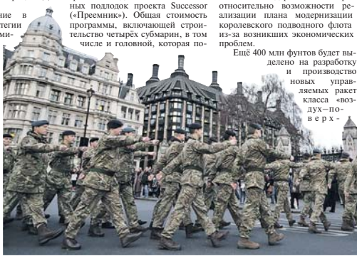
Английские солдаты отрабатывают строевой шаг.