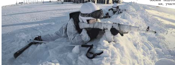
На Северном полюсе курсанты проводили утреннюю физическую зарядку, выполняли нормативы боевой подготовки, участвовали в вечерней поверке.

деть все желающие. Немало усилий профессорско-преподавательского состава направлено на подготовку мастеров спортивного ориентирования. Воспитанники института много раз побеждали на всевозможных соревнованиях, в том числе на чемпионатах мира и Европы,