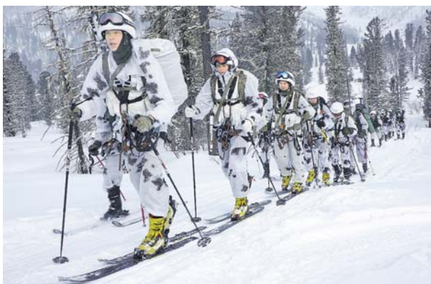
На этапе «Санского марша» — 2018.

организаторы «Санского марша» сформировали по-военному лаконично: совершенствование профессиональных навыков командиров в управлении подразделением в условиях проверки сложными подразделениями, а также способности военнослужащих применять вооружение и использовать горные снаряжения при выполнении задач в горах. Причём в зимний период. Небольшой поход, — акцентирует внимание представитель Управления физической подготовки и спорта Вооружённых Сил РФ, — стало принципиальным моментом в ходе разработки конкурсного положения.