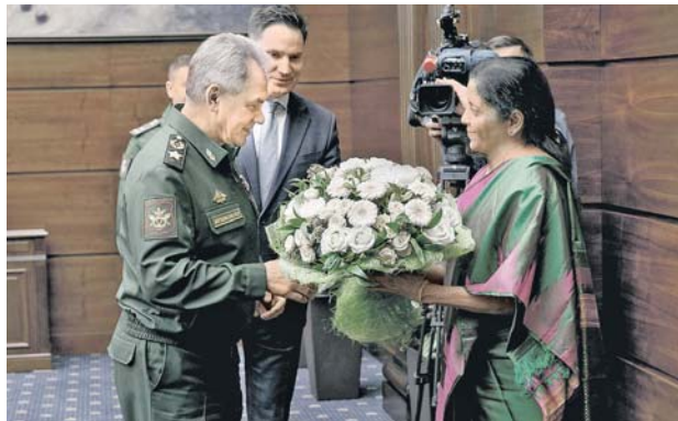
Генерал армии Сергей ШОЙГУ встречает министра обороны Индии Нирупаму СИТХАРАМАН.