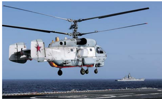
Ка-27 садится на палубу корабля.