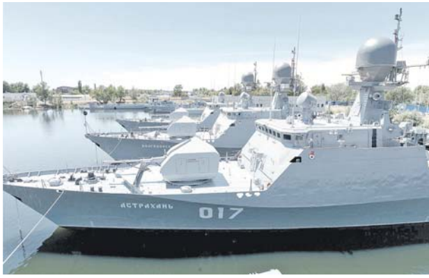
Корабли флотилии на базе в Астрахани.

СОБЫТИЕ МЕЖДУНАРОДНОГО МАСШТАБА Во вступительном слове на секторальном совещании министр обороны обозначил основные темы открывающейся 4 апреля VII Московской конференции по