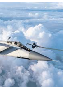
Дозаправка МиГ-31 в воздухе.

На Камчатке лётчики отдельного смешанного авиационного полка Тихоокеанского флота впервые отработали полёты экипажа высотных истребителей-перехватчиков МиГ-31 с дозаправкой в воздухе в ночное время. Тренировка проходила на высоте семи тысяч метров при скорости около 500 километров в час. Всего лётчики-истребители морской авиации выполнили десять вылетов, проведя в общей сложности свыше десяти часов в небе и осуществив более 15 контактов с самолётом-заправщиком (дозаправка осуществлялась от самолётов Ил-78М дальней авиации ВКС России).