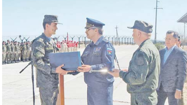
Победитель турнира принимает награду из рук командующего войсками ПВО-ПРО — заместителя главнокомандующего ВКС России генерал-лейтенанта Виктора ГИМЕНЕВО.

Но уже после выполнения стрельбы из зенитных автоматов по наземным целям экипаж Ти-