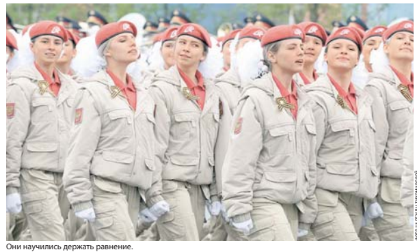
Они научились держать равнение.