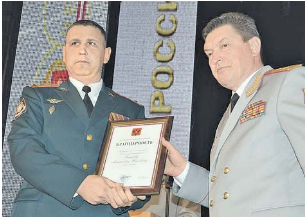
Командующий войсками ЦВО благодарит особо отличившихся в службе.