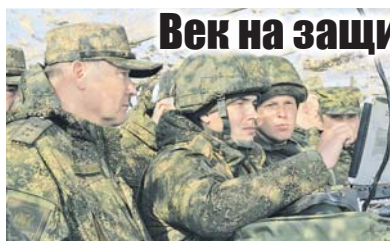
Генерал-полковник Александр ДВОРНИКОВ (слева) на учении.

МИНИСТР ОБОРОНЫ РОССИЙСКОЙ ФЕДЕРАЦИИ генерал армии С. Шойгу