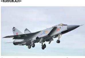
Остроту «кинжала» проверяют на опытно-боевом дежурстве.

Об этом сообщил заместитель министра обороны РФ Юрий Борисов.