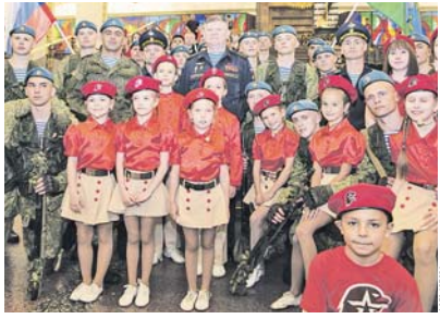
Совместное фото на память.

Акция «Весёлые люди» охватит более 40 регионов Российской Федерации и продлится до 13 ноября 2018 года, когда будет отмечать вековой юбилей прославленного десантного вива.