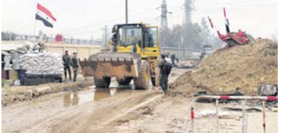
В городе Дума продолжается расчистка завалов с помощью тяжёлой автодорожной техники.

Российский Центр по примирению враждующих сторон в Сирийской Арабской Республике продолжает работу по мирному урегулированию конфликта и нормализации гуманитарной ситуации в этой стране. На минувшей неделе по статистике перемены происходили в следующей провинции.