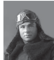
Эмир-Усеин Чалбаш, 1942 год.

аэродрома. Неоднократно выполнял воздушную разведку с фотографированием передовой, вылетал на штурмовку войск противника под Москвой.