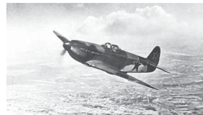
Любимой машиной Чалбаша был Як-1.

За время пребывания на фронте совершил 360 боевых вылетов, сбив 17 самолётов. Двигаясь вперёд, лётчик сумел довести машину до своего