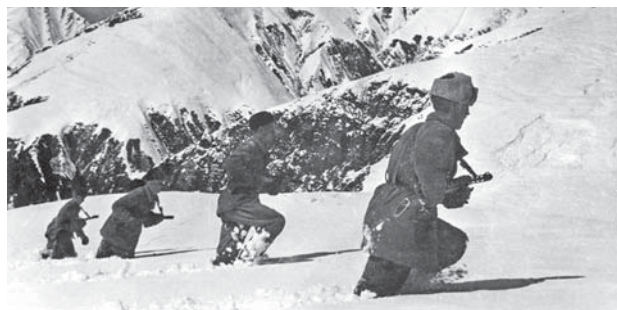
Конникам 214-го кавалерийского полка пришлось воевать в пешем строю.

разведбата горно-стрелковой бригады провели на этих склонах небывалую доселе поисковую работу и подняли из безвестности останки и подвиги солдат Великой Отечественной.