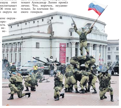
Торжества на улицах и площадях.