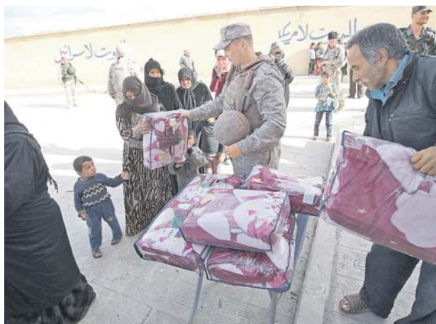
Российский Центр по примирению продолжает работу по оказанию гуманитарной помощи жителям населённых пунктов, освобождённых от боевиков.

ной помощи жителям населённых пунктов, освобождённых от боевиков. «Только за последние несколько дней», — заявил официальный представитель Минобороны России, — российскими военнослужащими проведено десять гуманитарных акций, в ходе которых населению было передано более 25 тонн про-