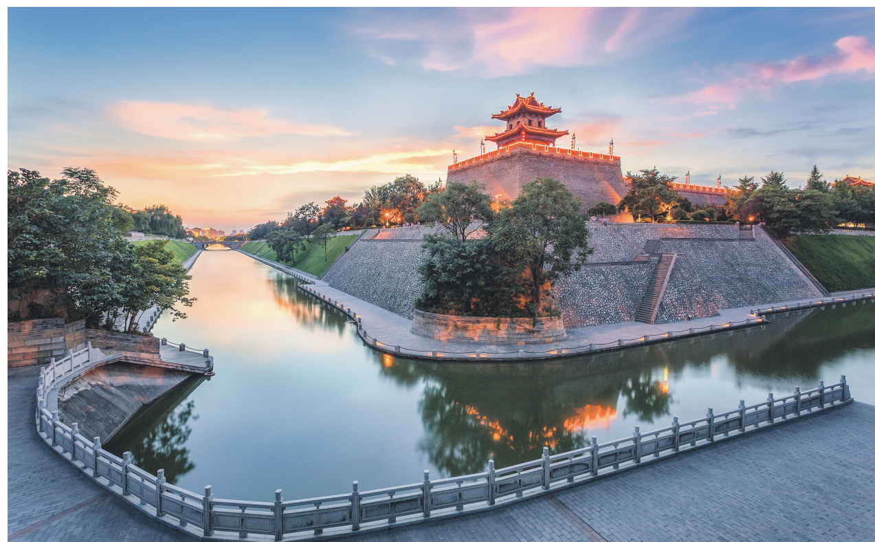
Древняя городская стена в городе Сиань

С момента воссоздания международного портового района Сиань в 2008 году были обустроены торговые порты железнодорожных и автотранспортных дорог для импорта пищевой