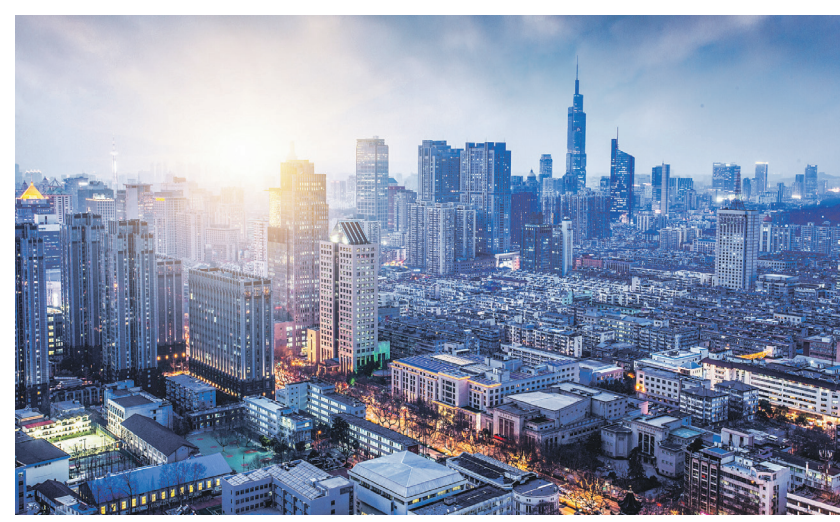
Город Сучжоу | Сюй Яньхон | ChinaVisual