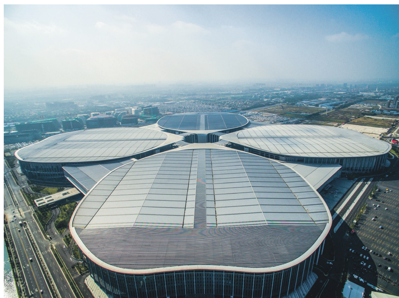
Национальный выставочный и конгресс-центр (Шанхай) | ChinaVisual