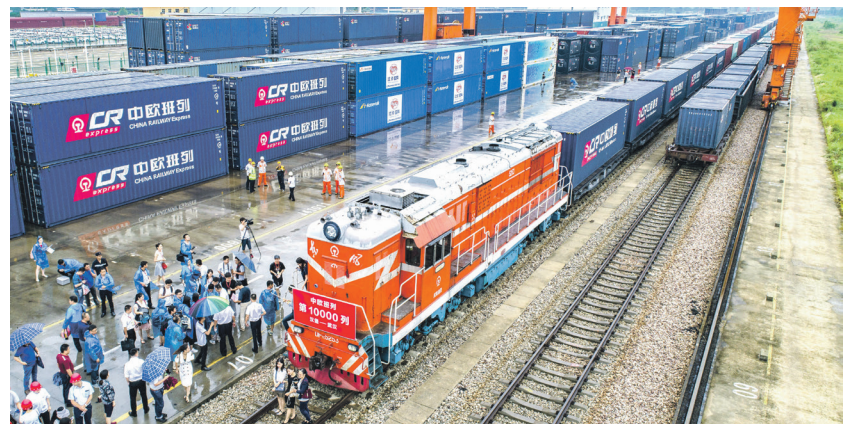
Количество поездов Китай — Европа достигло 10 000 | ChinaVisual

КНР строит транспортную инфраструктуру для развития нового Шелкового пути. Так, например, в конце 2016-го началось возведение высокоскоростной железнодорожной магистрали, которая свяжет Китай с Лаосом. Еще один важнейший проект — строительство дороги Джакарта — Бандунг (Индонезия), которая сократит путь почти на четыре тысячи километров. И это лишь один пример из многих. Не остается в стороне развитие портовой инфраструктуры: завершено строительство порта Хамбангтота в Шри-Ланке, частично сдан в аренду China Ocean