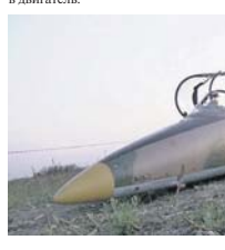
«Ювелирная» посадка самолёта с невыпущенными шасси.

Как выяснилось позже, на скорости около 300 км/ч и высоте 180 метров его учебный реактивный самолёт «Альбатрос» столкнулся с птицей — не с воробьём или голубом. Судя по следу на фюзеляже и фанере кабины, это мог быть гусь или журавль. По статистике авиационных происшествий каждый год в мире случается примерно 5500 столкновений птиц с самолётами. Чаще всего такие аварии происходят при взлёте или посадке. Две трети из них фиксируются на высоте до 300 метров. Птица с кабиной самолёта перпендикулярно сталкиваются реже — всего в 12 процентах случаев. И почти в половине случаев, в 45 процентах, они попадают в двигатель.