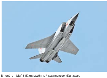
В полёте — МиГ-31К, оснащённый комплексом «Кинжал».

Генерал армии Сергей Шойгу сообщил, что гособоронзаказ на текущий год предусматривает размещение более 3700 заданий на сумму около 1,5 трлн рублей.