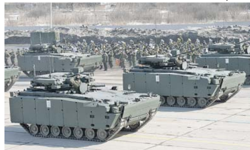
В парадной колонне — БМП «Курганец-25».

Подготовка к параду на Красной площади в ознаменование 73-й годовщины Победы в Великой Отечественной войне близится к завершению