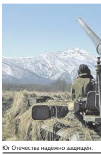
Юг Отечества надёжно защищён.

Лицейский состав ЮВО — от солдата до генерала, являясь преемниками воинов-победителей, завовавших южные рубежи Отечества в тяжёлые времена его истории, с гордостью несут славу подвигов отцов и старших товарищей, считая себя продолжателями их ратного труда, — отметил в разговоре с корреспондентом «Красной звезды» командующий войсками ЮВО Герой России генерал-полковник Александр Дворников.