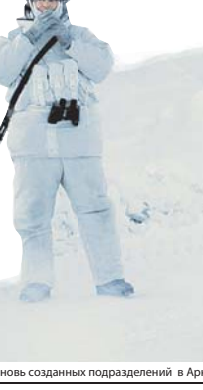
Военнослужащие вновь созданных подразделений в Арктике.

Естественно, что реальные условия крупномасштабной войны вносили