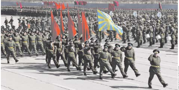
Идеальная выправка достигается тренировками.

— Во время каждой тренировки происшествий было много. Скажите,