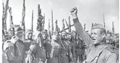
Митинг по случаю выхода к Восточной Пруссии. 25.08.1944 г.

Плох или хорош был Лев Мехлис (сейчас это только «цепной пёс Сталина»), однако в русской армии он с 1911 года, а в 1917 году дослу-