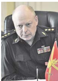
Главнокомандующий Сухопутными войсками генерал-полковник Олег САХУЛТНЫЙ

В процессе тренировок мы достигли такого уровня, когда для дальнейшего его повышения командный состав батальонов, рот психологически разгружать людей, снять с них напряжение, вынуть им, что если они проходили 100 раз, отлично пройдут и 101-й, когда на трибуне будет находиться руководство страны. Когда за одну из репетиций в Алабино прибыл министр обороны (кстати говоря, специально для этого он перенёс на два часа заседание Коллегии), пехотные колонны выстроились на дорожку. Десятники, девчата (у нас два женских парадных расчёта) шли бодры, с улыбками на лицах. А лётчики в строевом отношении — Воен-