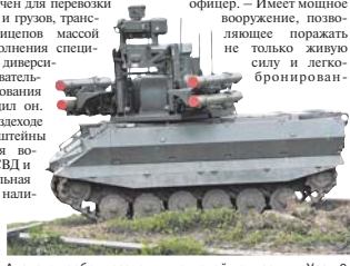
Аналогов роботу разведки и огневой поддержки «Уран-9» в мире нет.

«Уран-9» создан для защиты личного состава, вывода его из непосредственного прикосновения с противником, — указал офицер. — Имеет мощное вооружение, позволяющее поражать с большого расстояния живую силу и бронированные объекты.