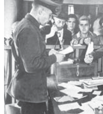
Запись добровольцев в Октябрьском райвоенкомате Москвы. 23.06.1941 г.

кационных технологий и понимания социальной роли стратегической пропаганды. Но создаётся ли у нас потенциал массового героизма?».