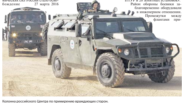
Колонна российского Центра по примирению враждующих сторон.