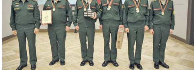
Олимпиадский экзамен сдан великолепно.