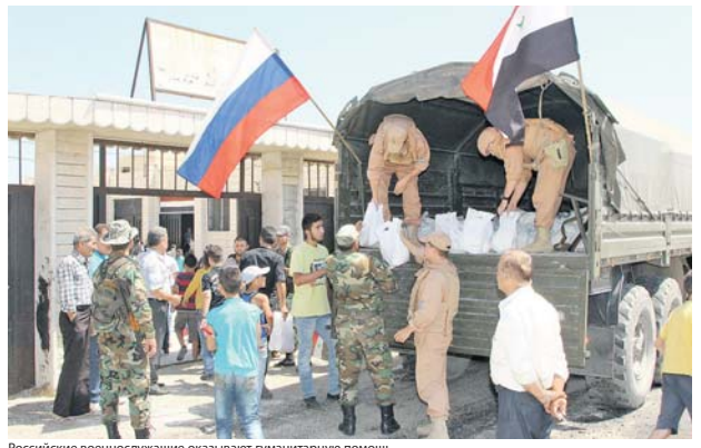
Российские военнослужащие оказывают гуманитарную помощь.

По данным командующего, в 2017 году в войска округа поступило свыше тысячи единиц модернизированных образцов