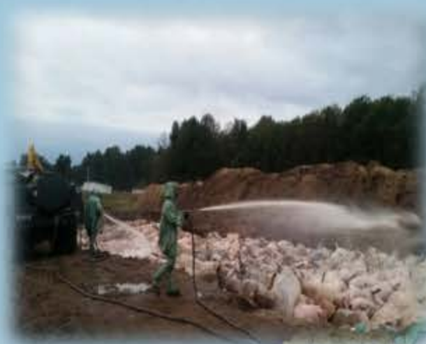
Ликвидация биологической ЧС