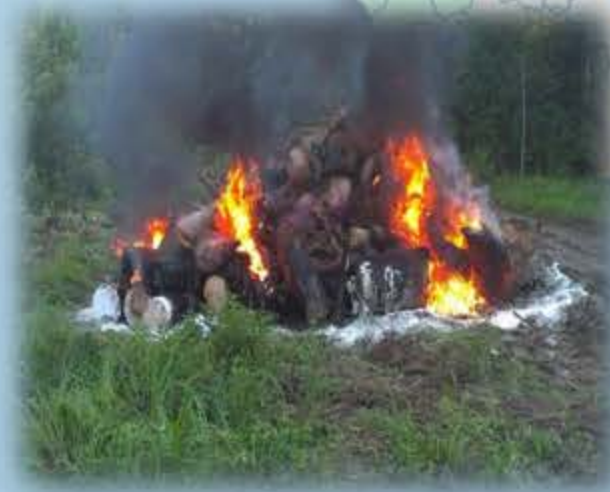
Ликвидация биологической ЧС