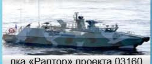
пка «Рептор» проекта 03160