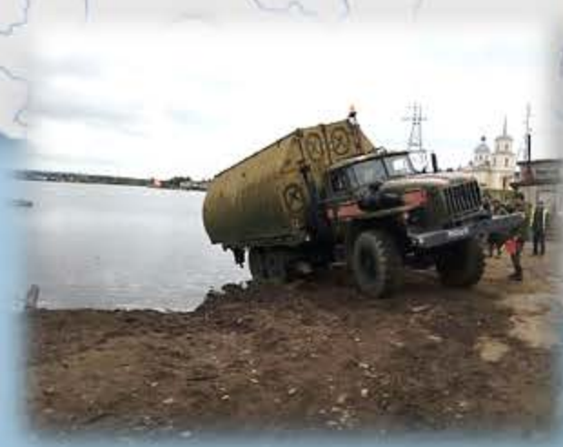
Наведение мостовой переправы