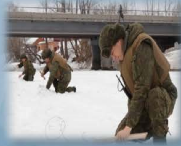
Профилактика ледовых заторов