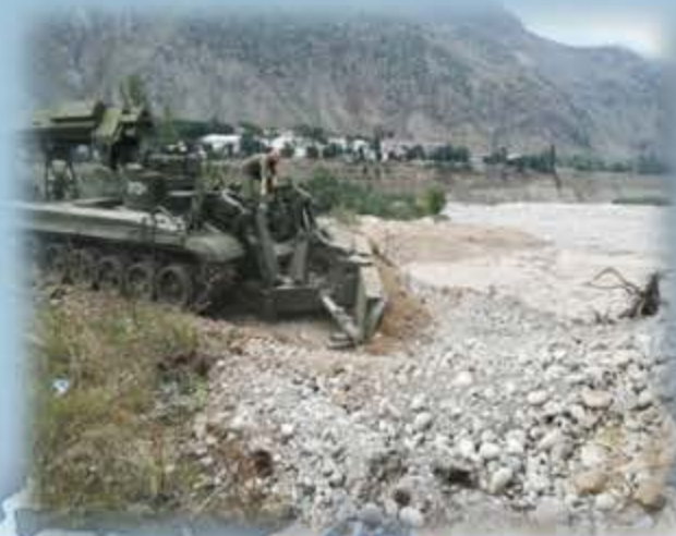
Ликвидация последствий схода селея