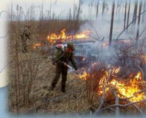
Ликвидация природных пожаров