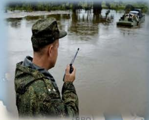
Ликвидация последствий паводков