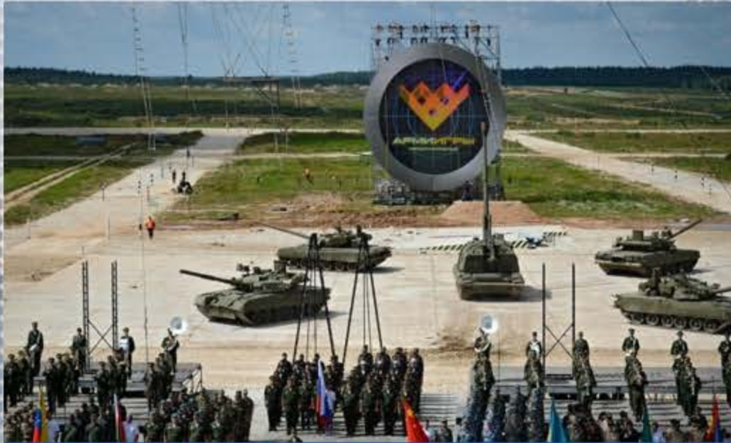
АРМЕЙСКИЕ МЕЖДУНАРОДНЫЕ ИГРЫ