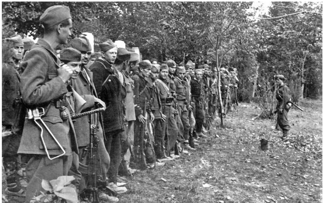
Бойцы Народно-освободительной армии Югославии