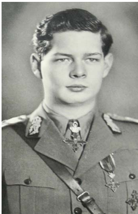
Король Румынии Михай I Гогенцоллерн, разорвавший военный союз с нацистской Германией и объявивший ей войну на стороне Антигитлеровской коалиции. Награжден орденом Победы