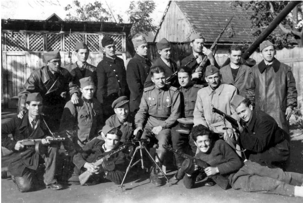
Группа югославских партизан с советскими офицерами