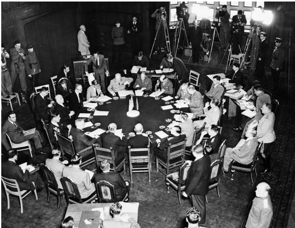
Делегации «Большой тройки» за столом переговоров в Потсдаме