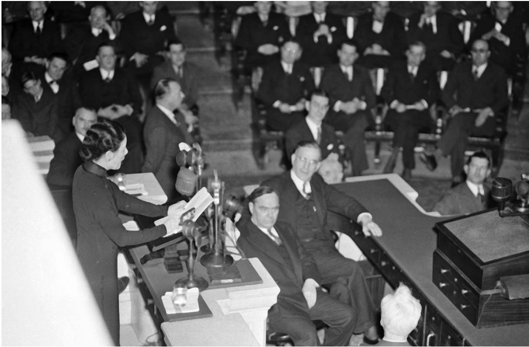
Сун Мейлин, супруга Чан Кайши, выступает перед членами Палаты представителей США