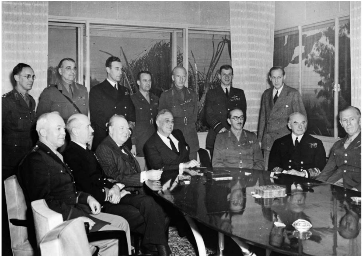
Ф. Рузвельт и У. Черчилль с высшими офицерами союзников на конференции в Касабланке