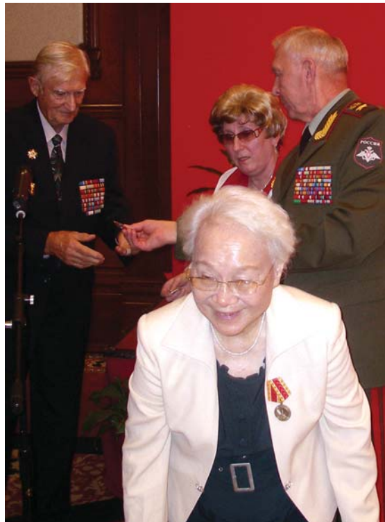
Председатель Российского комитета ветеранов войны и Вооруженных сил М. А. Моисеев вручает памятные медали российским и китайским ветеранам войны с Японией. г. Пекин, сентябрь 2010 г.