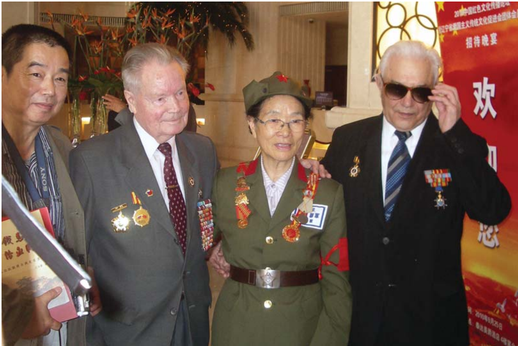
Российские и китайские ветераны войны с Японией в музее Мемориала павшим в боях на китайской земле воинам. г. Порт-Артур (г. Люйшунь), сентябрь 2010 г.