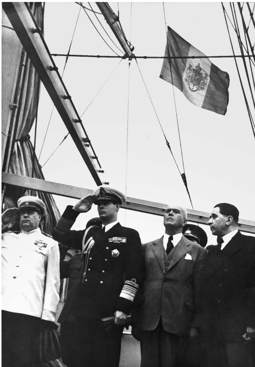
Король Румынии Михай I с советским орденом Победы