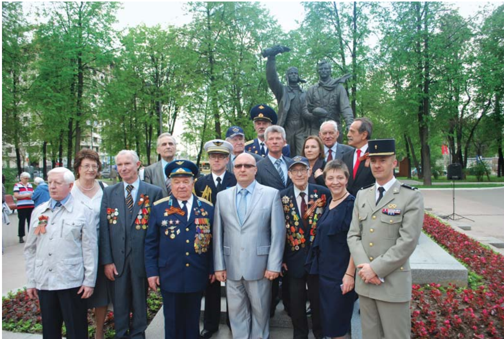
Встреча ветеранов эскадрильи «Нормандия-Неман». 2012 г.