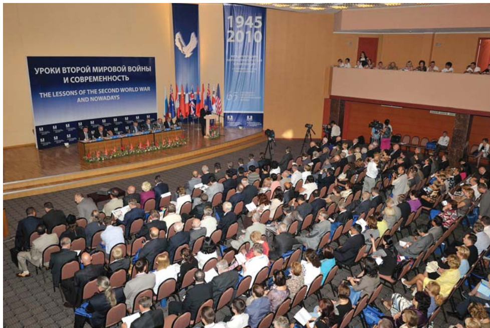
Международная конференция, посвященная 65-й годовщине окончания Второй мировой войны. г. Южно-Сахалинск, 2 сентября 2010 г.