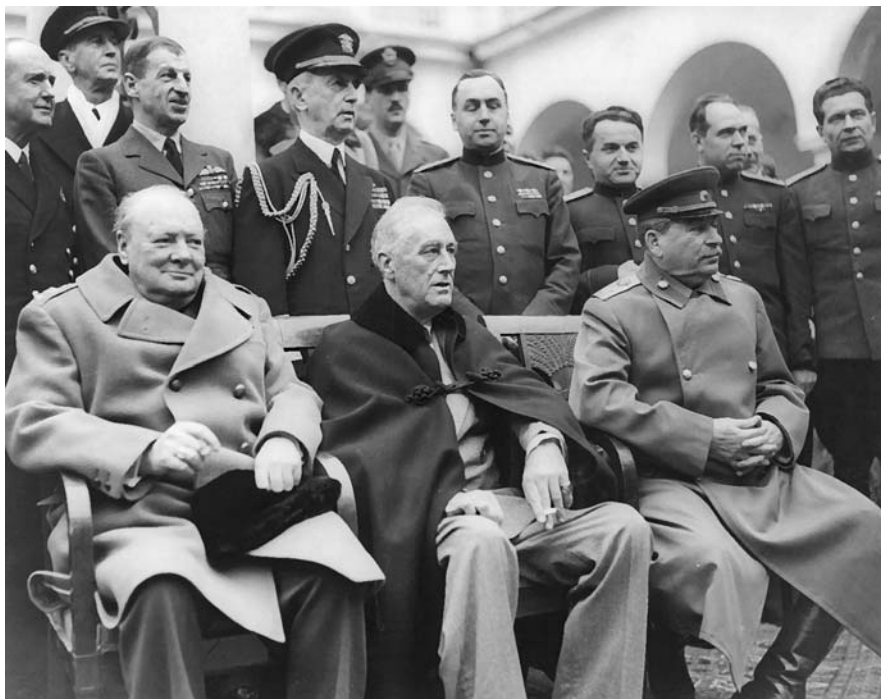
У. Черчилль, Ф. Рузвельт и И. В. Сталин на Ялтинской конференции