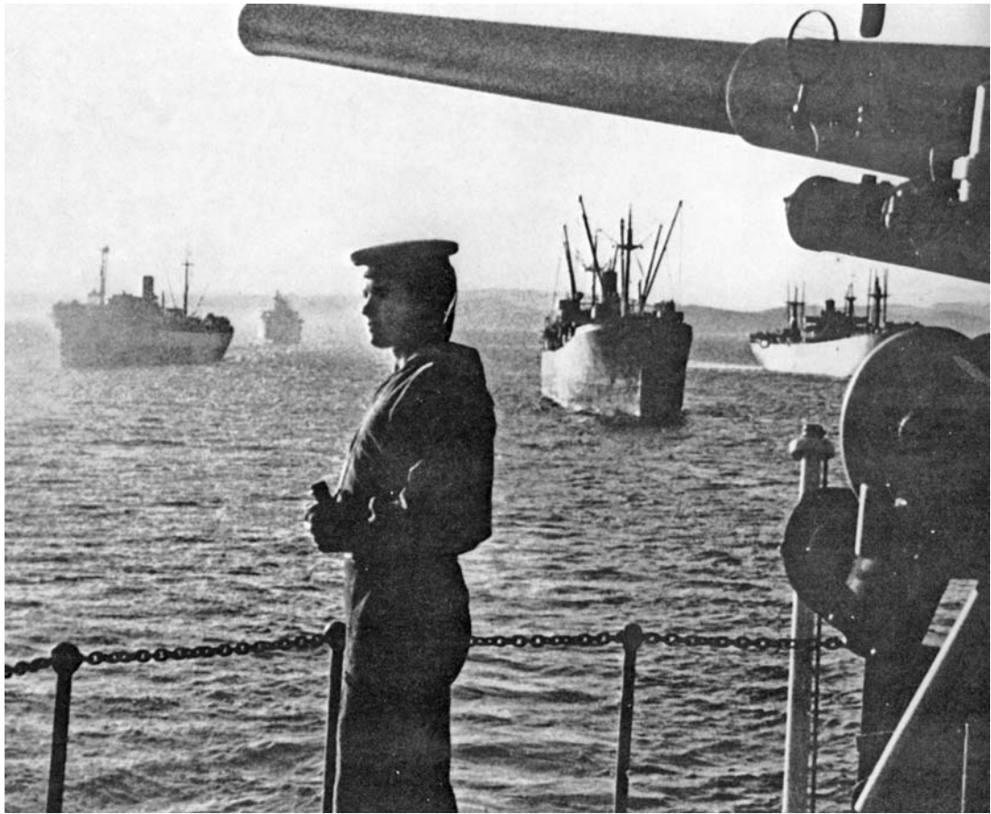
Корабли Тихоокеанского флота в боевом походе