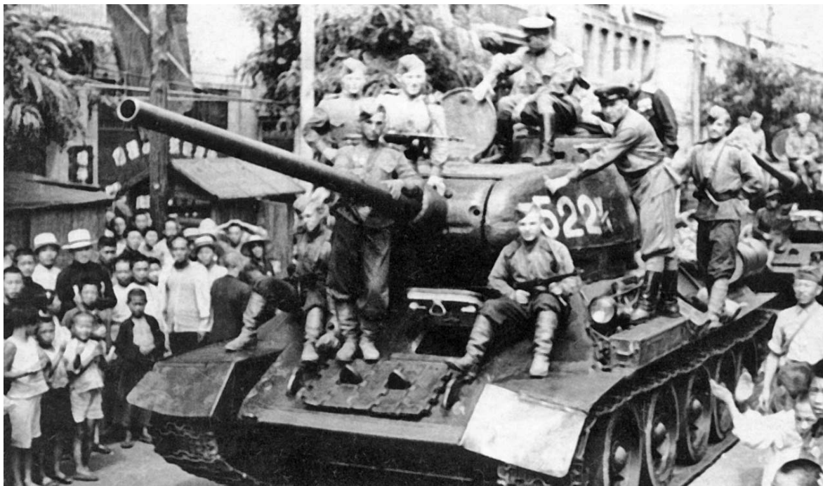
Колонна танков 7-го механизированного корпуса 6-й гвардейской танковой армии на улицах китайского города Далянь