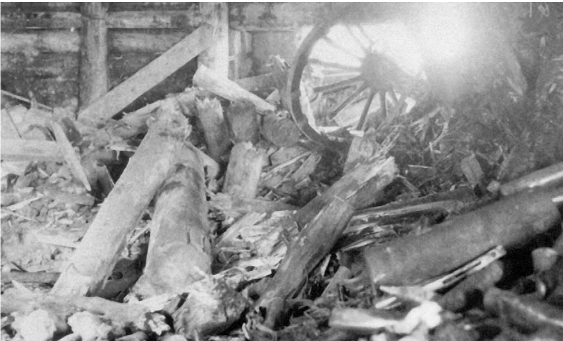
Разбитый японский дот на острове Шумшу