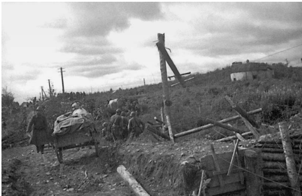
Подразделения 165-го стрелкового полка занимают приграничный опорный пункт японцев на Южном Сахалине — полицейский пост Хандаса