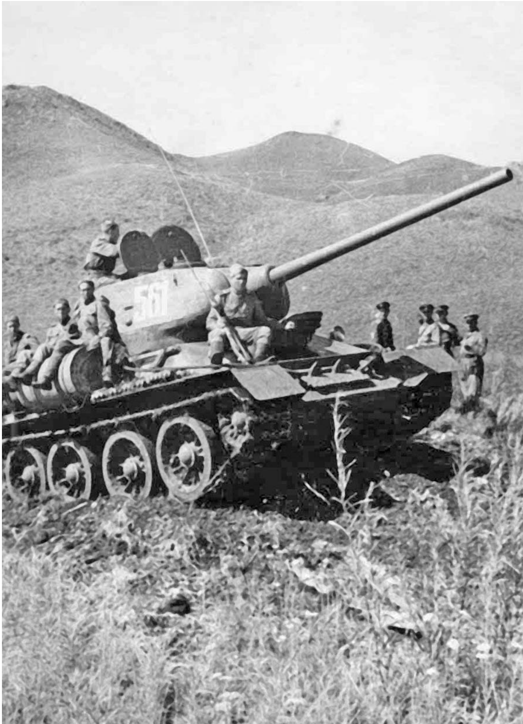
Танкисты преодолевают хребет Большой Хинган