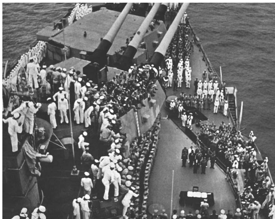
Моряки американского линкора «Миссури» наблюдают за началом церемонии подписания Акта о капитуляции Японии