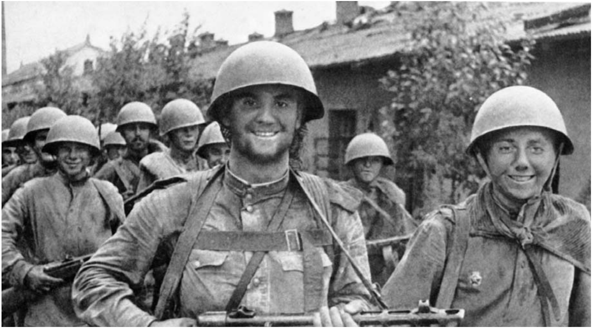
Воины 5-й армии 1-го Дальневосточного фронта, первыми вошедшие в город Мулин