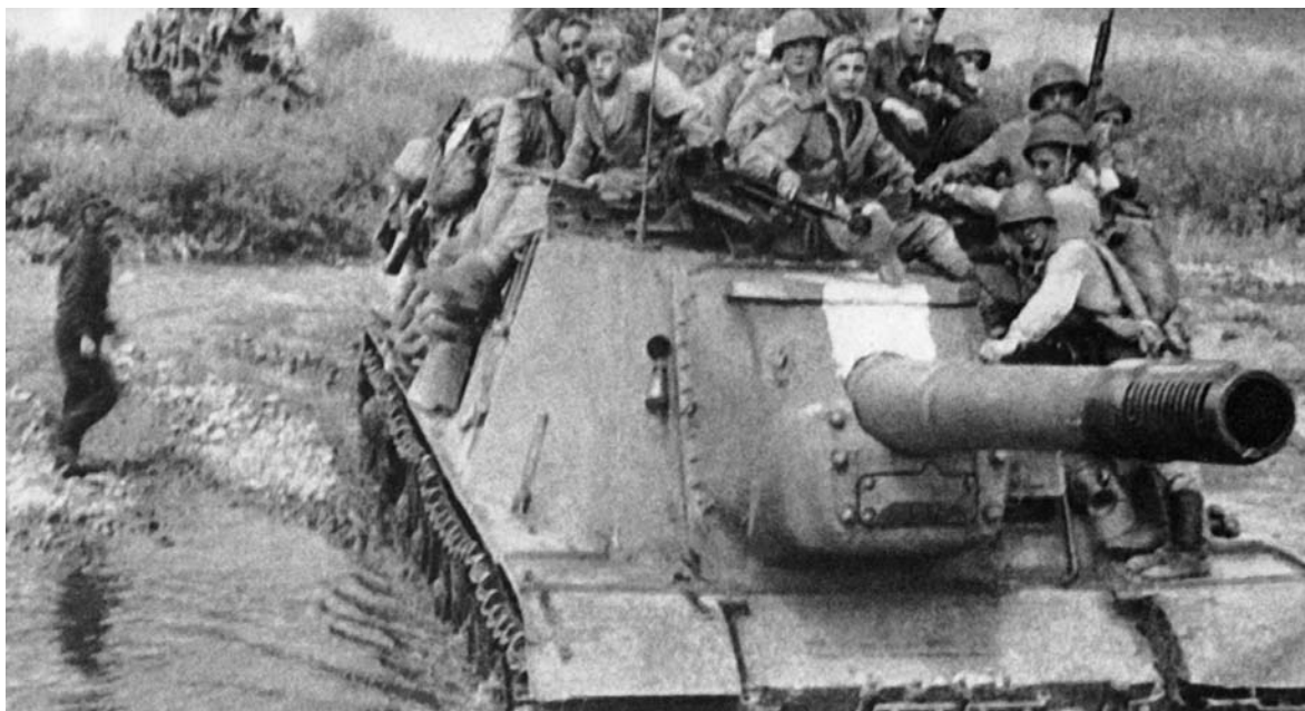
Самоходная установка с десантом на броне