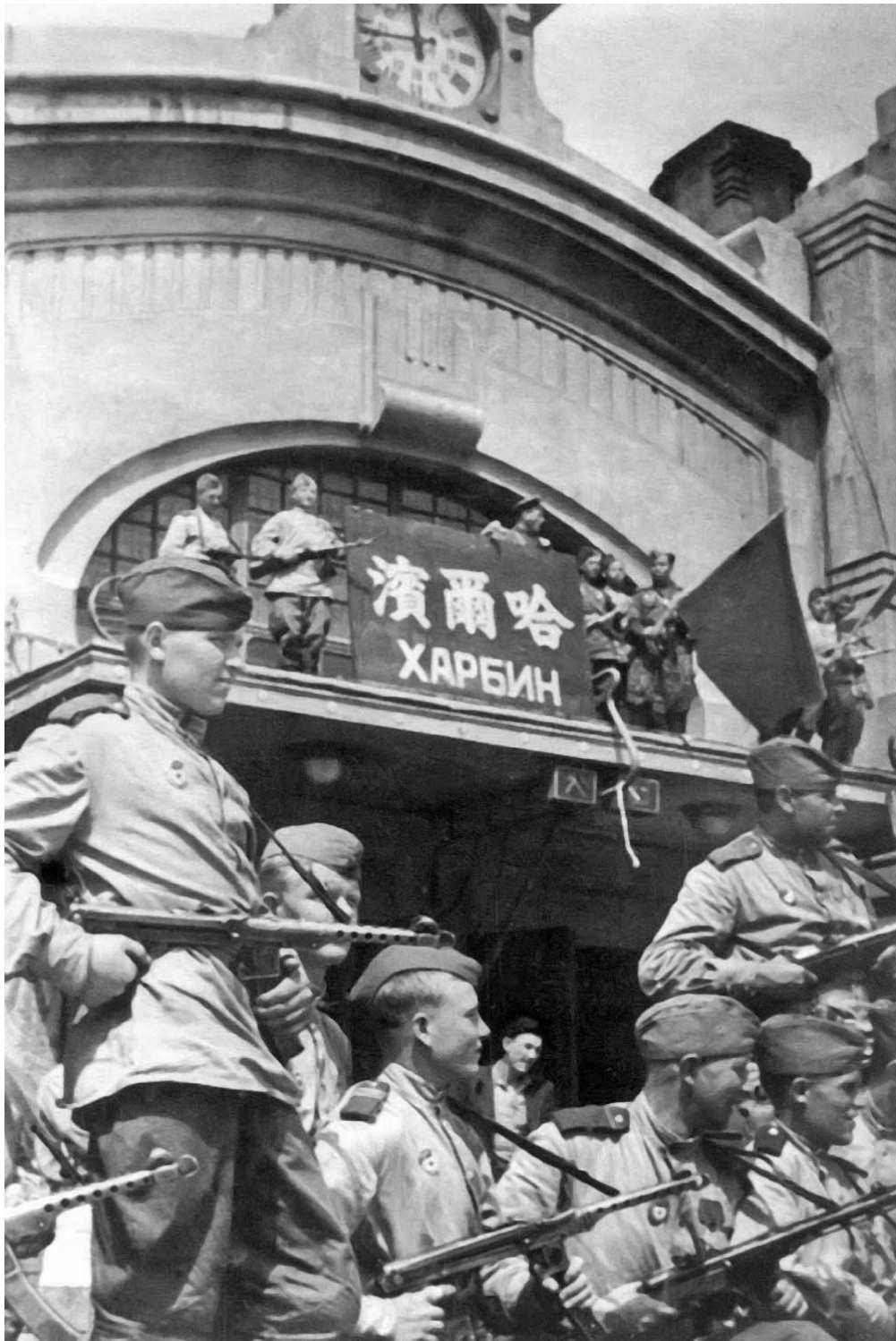
Советские бойцы-гвардейцы у здания железнодорожного вокзала в Харбине