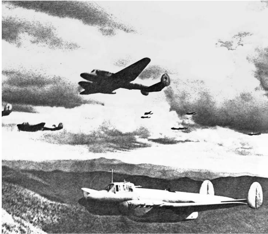
Бомбардировщики 1-го Дальневосточного фронта идут на выполнение боевого задания