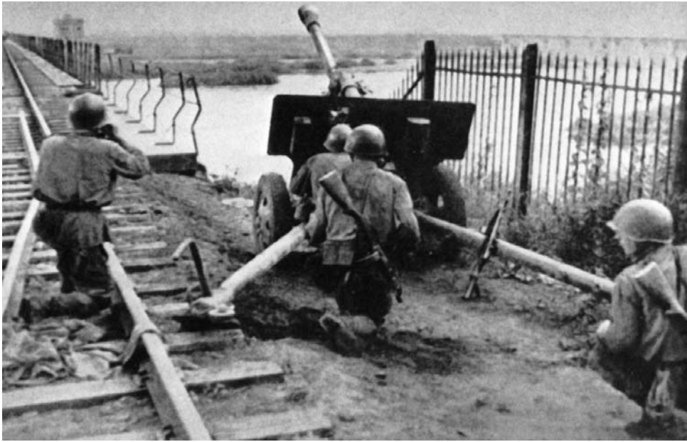
Артиллеристы в боях за Мукден