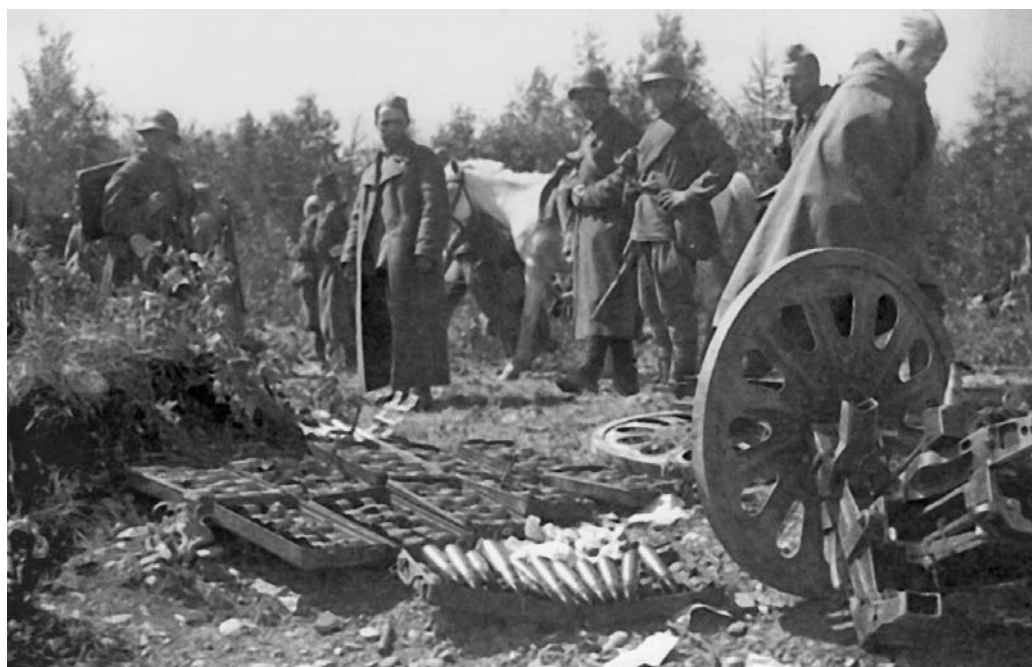
Советские солдаты у трофеев, захваченных на Сахалине