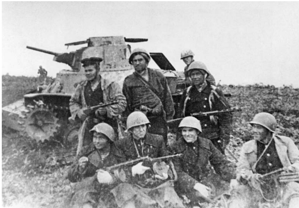
Группа советских морских пехотинцев на фоне подбитого японского танка