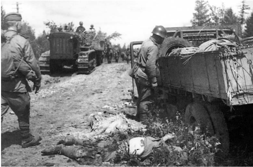
Колонна советских войск на марше. Справа — захваченный японский грузовик