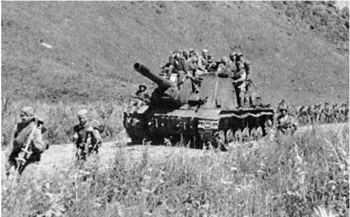
Продвижение советских войск вглубь Маньчжурии