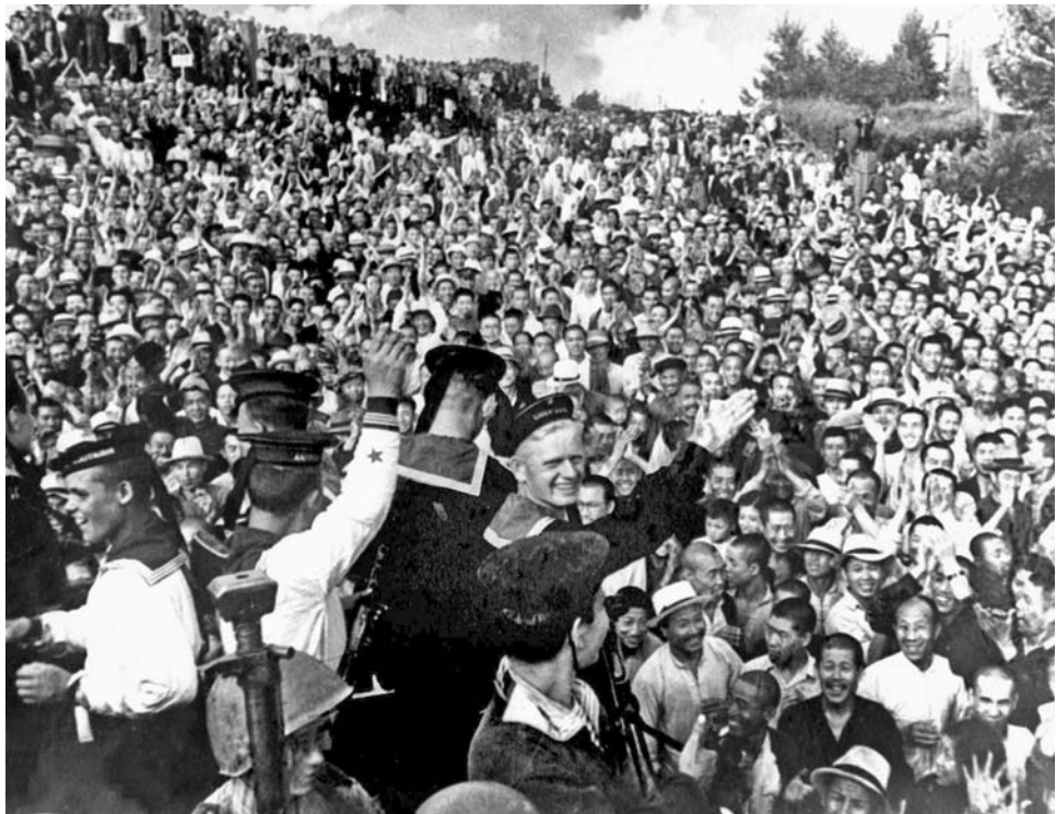
Население Маньчжурии встречает советских военнослужащих