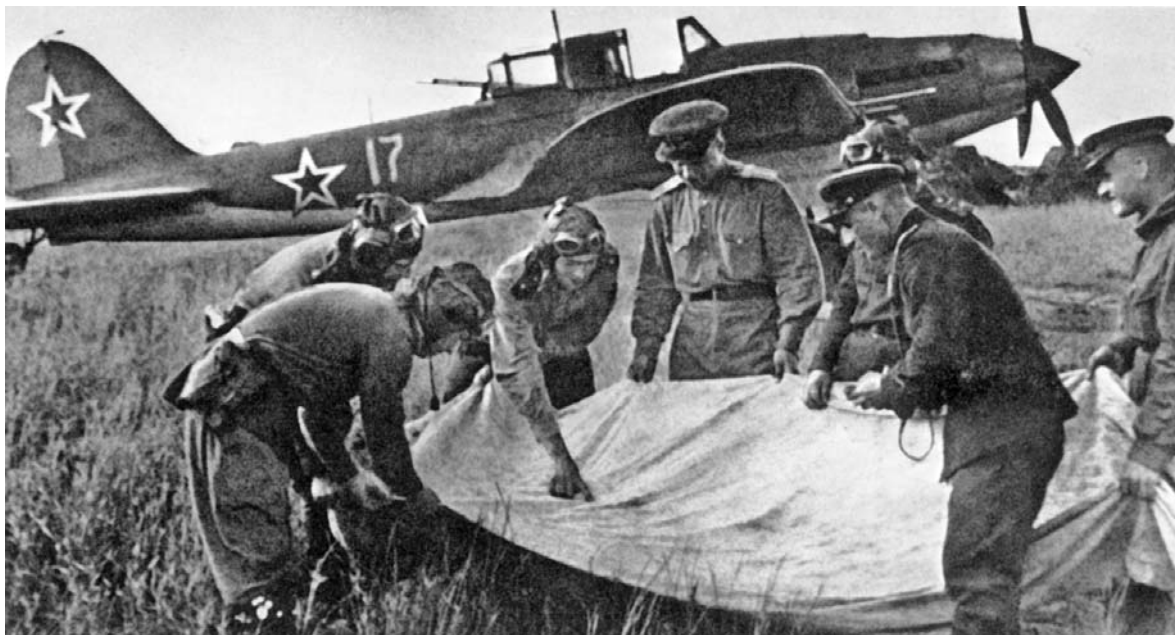
Летчики-штурмовики уточняют боевое задание

либров советские летчики разрушили четыре дота, два дзота, взорвали склад боеприпасов, уничтожили 130 вражеских солдат и офицеров 17 .