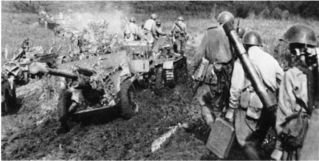
Советские войска переходят границу Маньчжурии