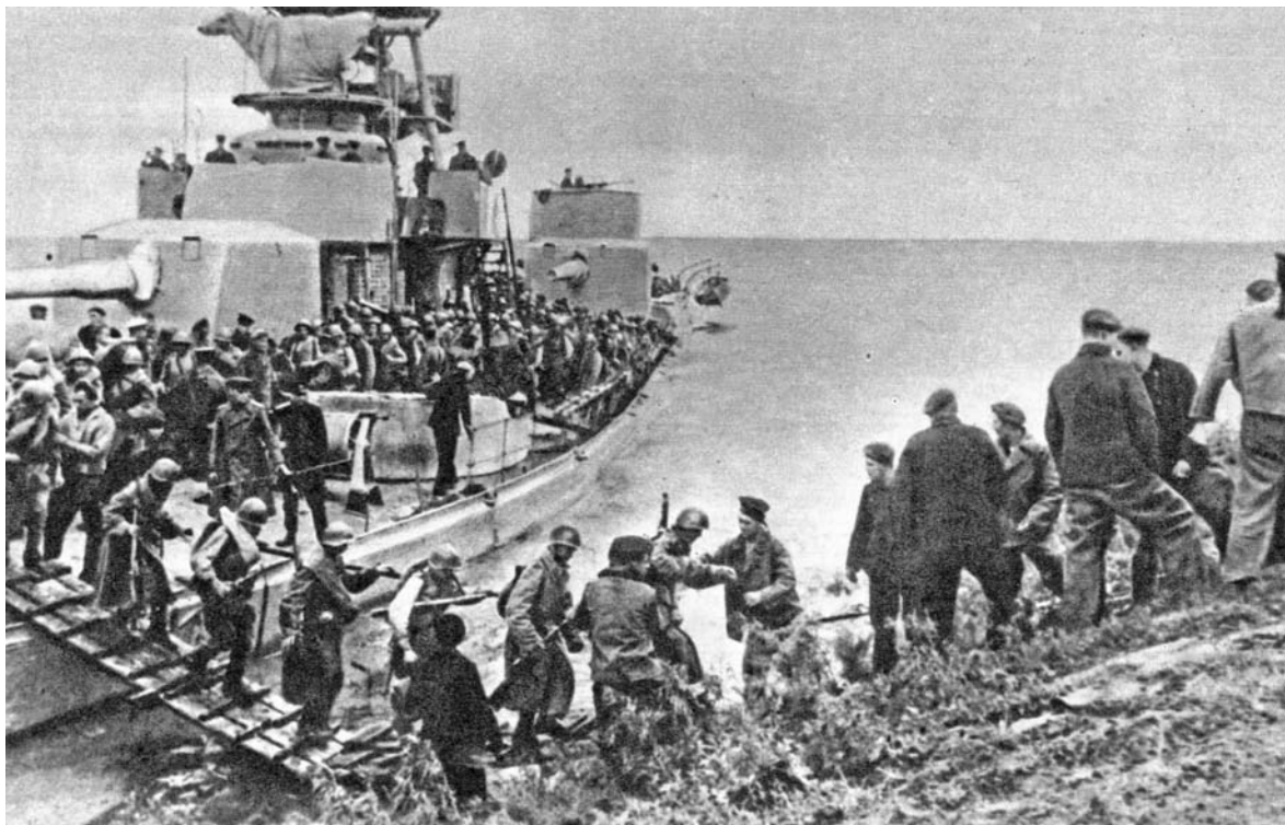
Высадка десанта с монитора Амурской военной флотилии на реке Сунгари

В результате всесторонней и хорошо продуманной с учетом опыта Великой Отечественной войны подготовки, а также благодаря господству фронтовой авиации и кораблей Амурской военной флотилии в зоне боевых действий советские войска успешно форсировали р. Амур на всех направлениях, предусмотренных планом операции.