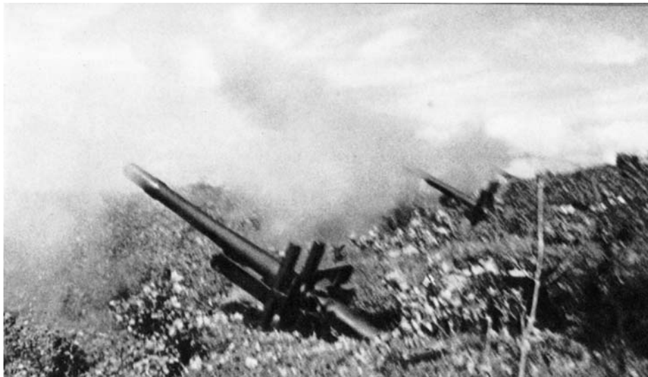
Огонь советской артиллерии по позициям противника