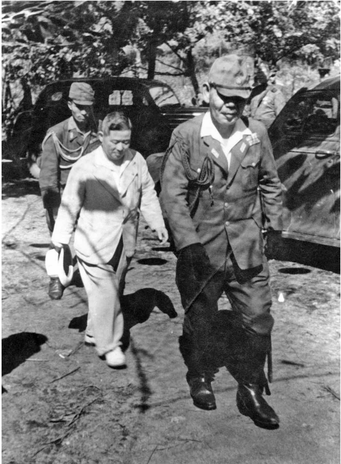
Японские военнопленные, захваченные в ходе боев в Маньчжурии