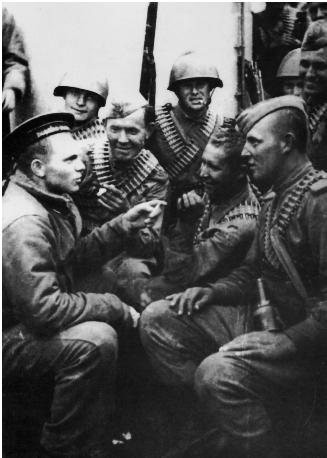
Советские бойцы на палубе транспортного корабля во время перехода к острову Шумшу