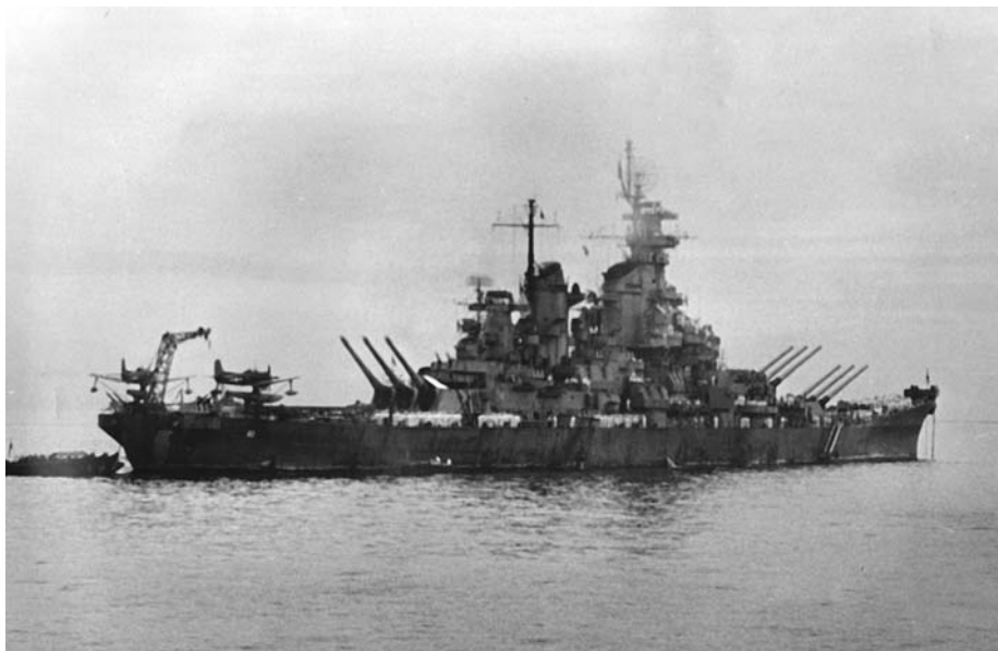
Американский линкор «Миссури»