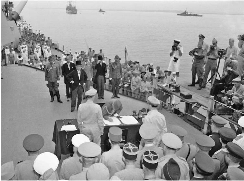
Японская делегация подписывает Акт о безоговорочной капитуляции Японии