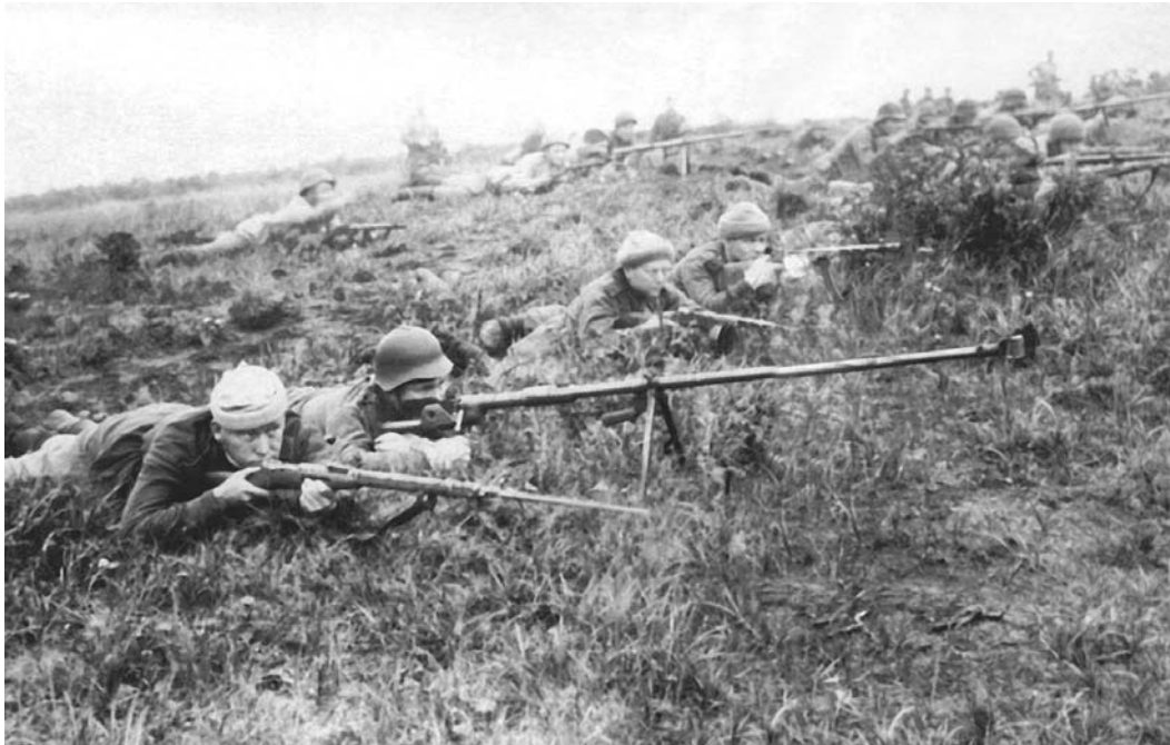
Советские бронбойщнки на позиции