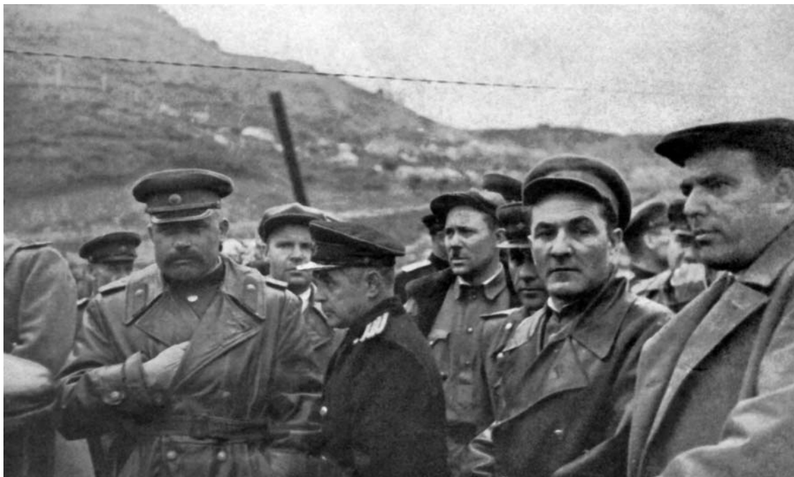
Группа советских офицеров и политработников на Курильских островах