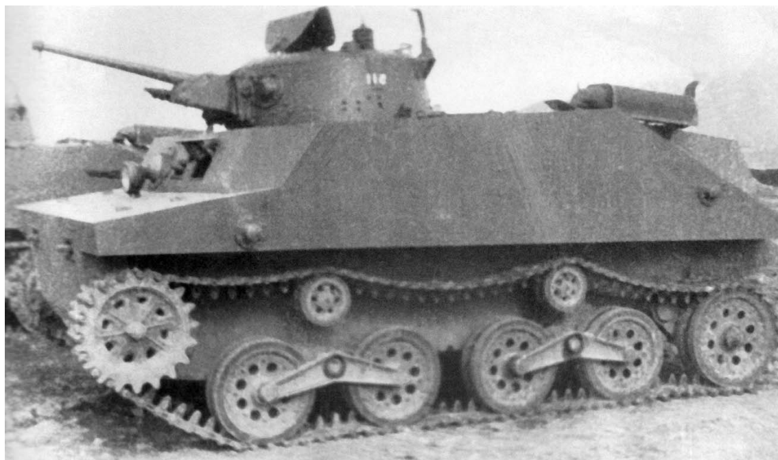
Захваченный японский плавающий танк