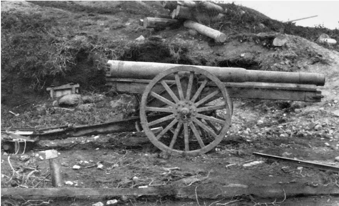
Захваченное на острове Шумшу японское орудие