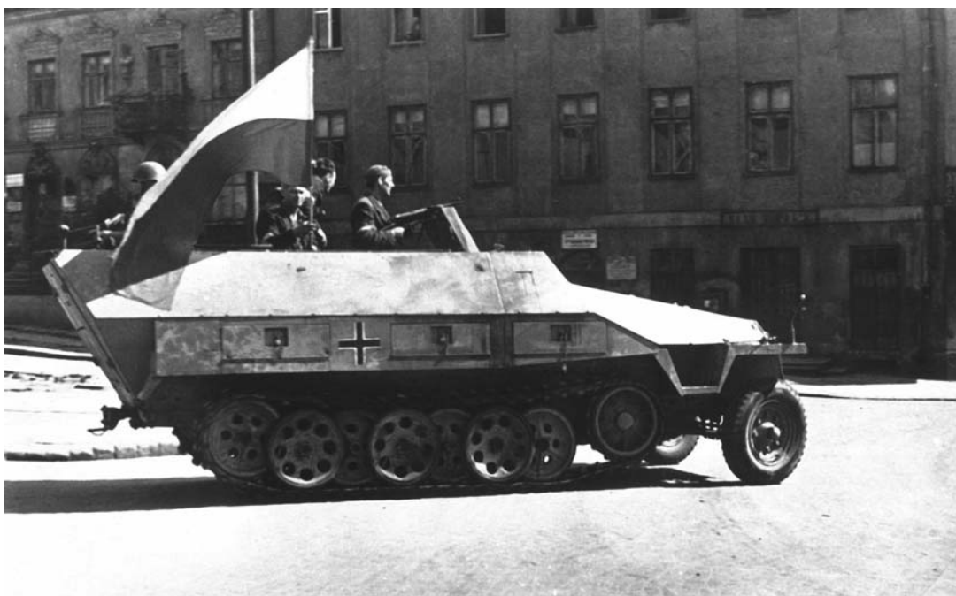
Варшавские повстанцы на захваченном немецком бронетранспортере