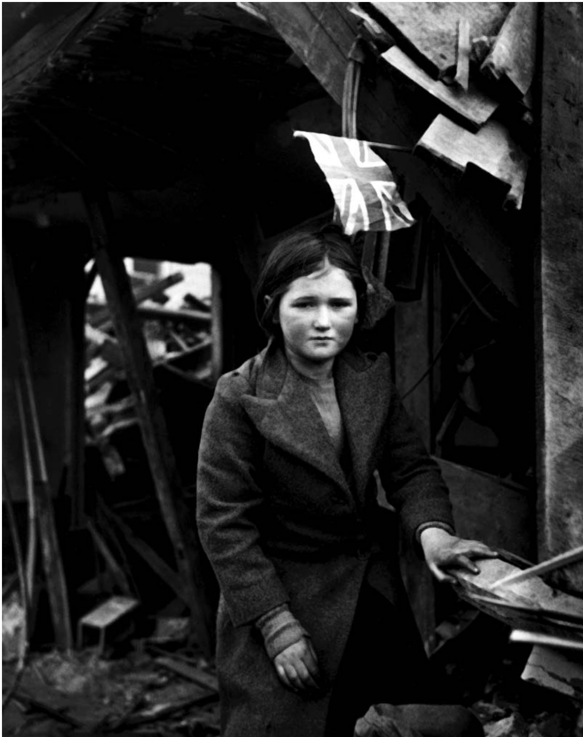
Лондонская девочка у своего дома, разрушенного ракетой «Фау-2»