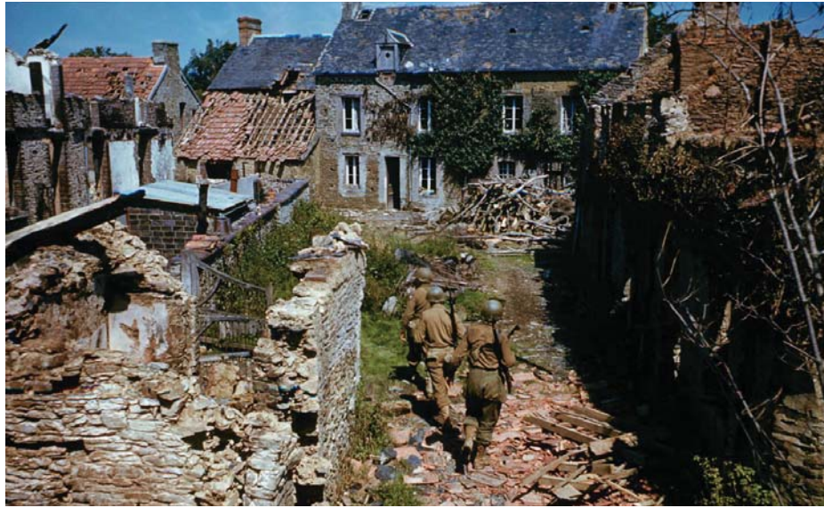
Американские пехотинцы в одном из городков Нормандии. 1944 г.