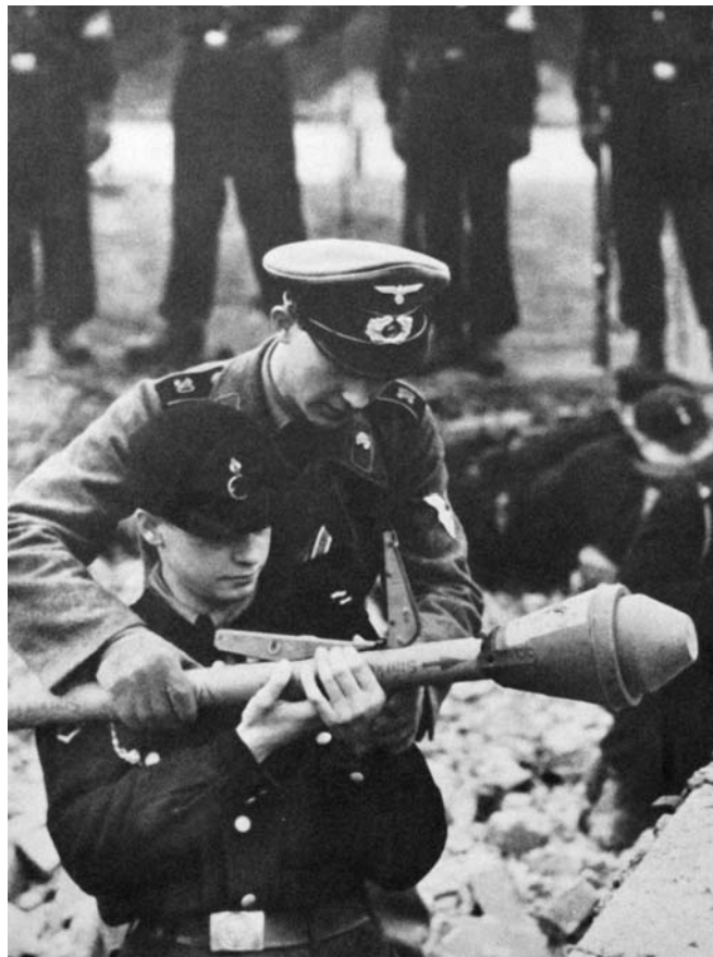
Обучение подростков из гитлерюгенда навыкам стрельбы из гранатомета «Панцерфауст»