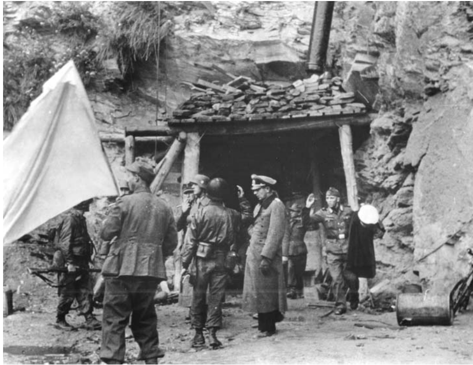
Капитуляция немецких войск во французском городе Шербур