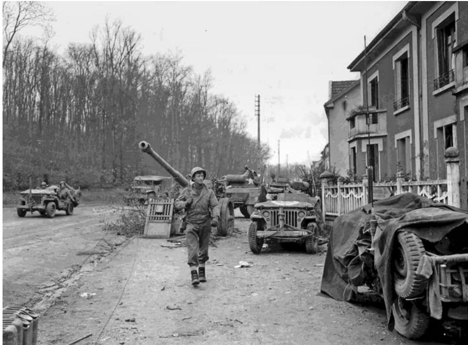
Солдаты союзников в пригороде Меца