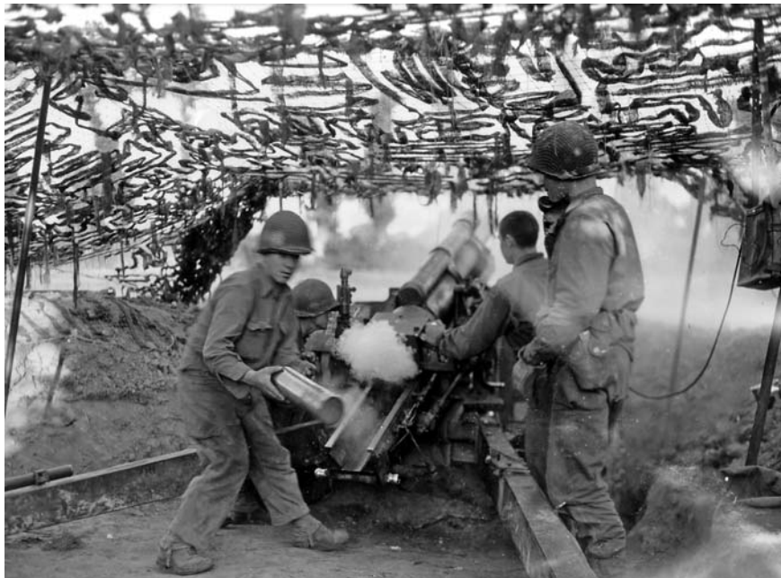
Американские артиллеристы ведут огонь из 155-мм гаубицы в районе Сен-Ло