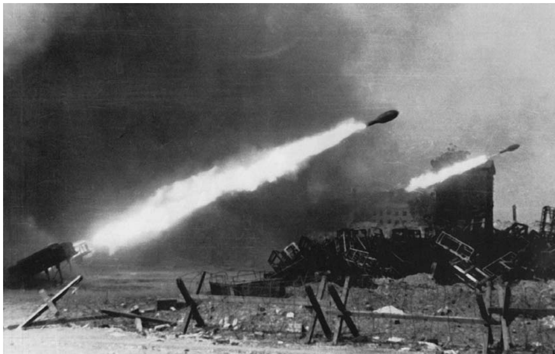
Залп немецких реактивных установок в Варшаве по повстанцам, атаковавшим Старый город