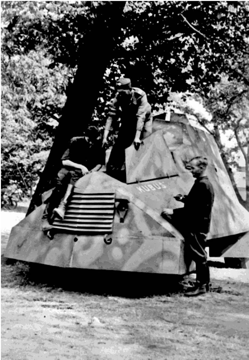
Варшавские повстанцы у броневедомобиля «Кубус»