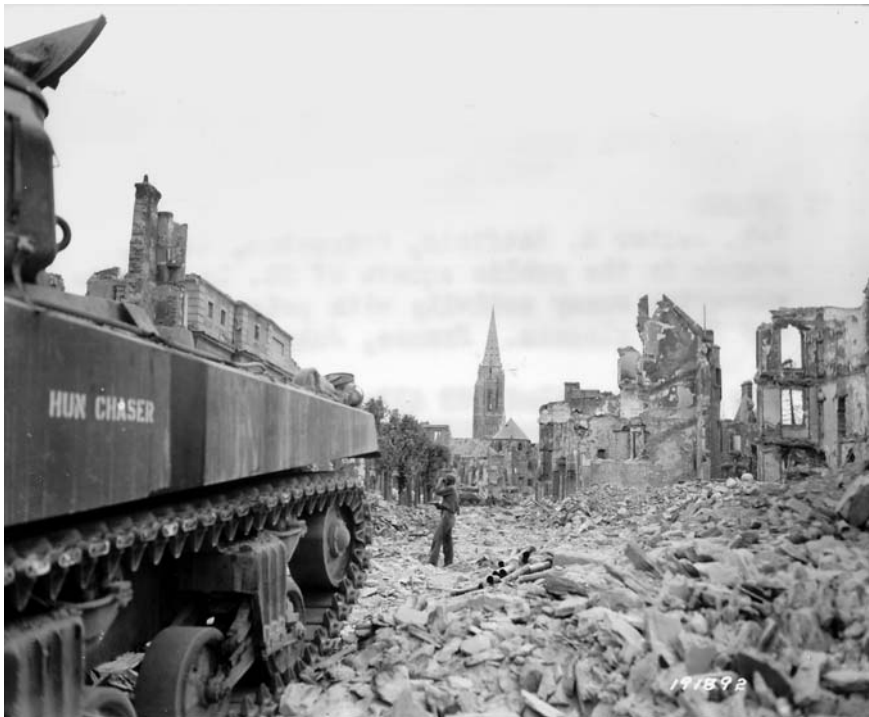
Американские войска в Сен-Ло