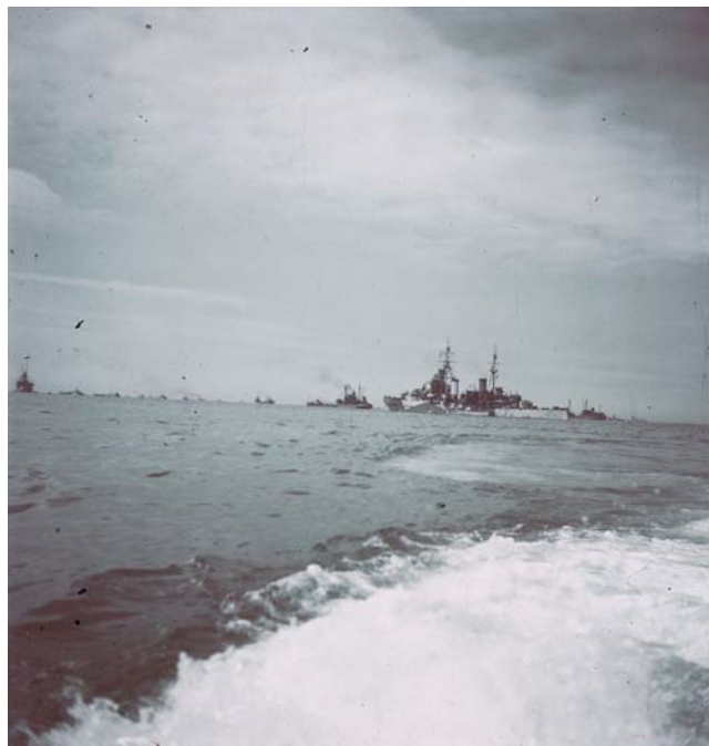
Корабли союзников направляются к берегам Нормандии. 1944 г.