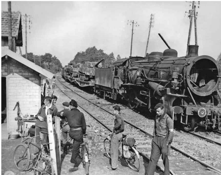
Бойцы французского Сопротивления охраняют немецкий воинский эшелон, разбитый и захваченный американскими войсками