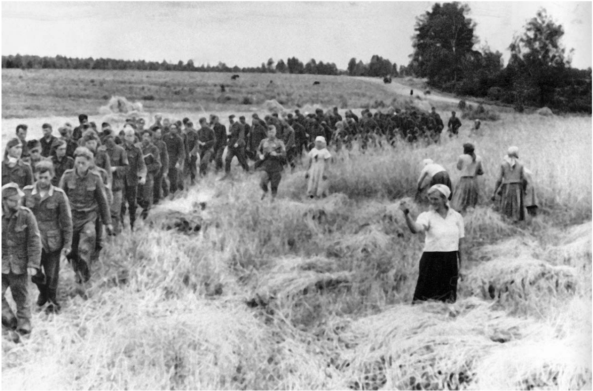
Крестьянка, работающая в поле, грозит кулаком немецким пленным

корректив в заготовительную политику, чтобы облегчить тяжкое бремя, взваленное на плечи крестьянства.