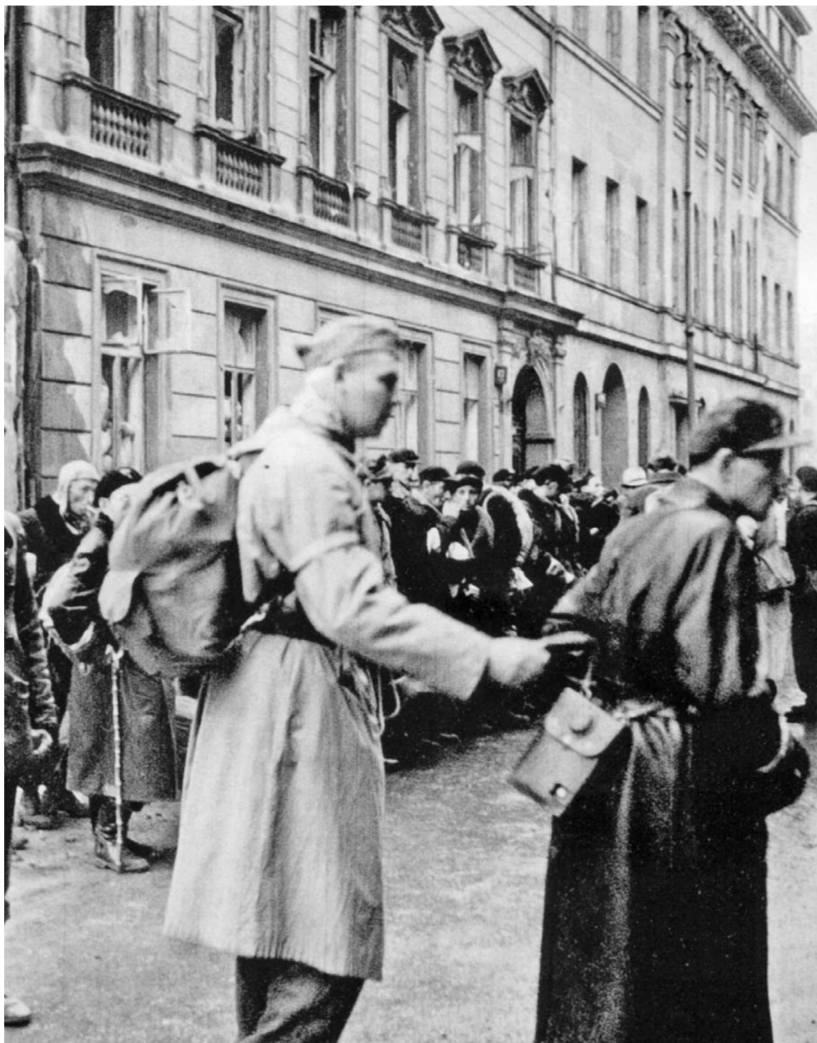
Варшавские повстанцы готовятся к сдаче в плен после капитуляции