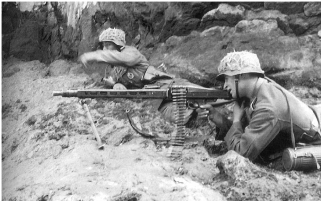
Тренировка немецких солдат незадолго до высадки десанта союзников