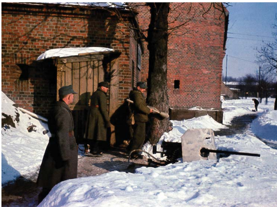
Немецкая оборонительная позиция в Восточной Пруссии. 1945 г.