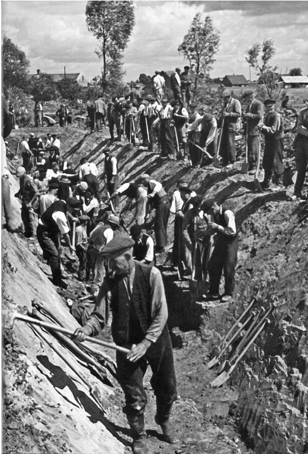
Жители Восточной Пруссии копают противотанковые рвы