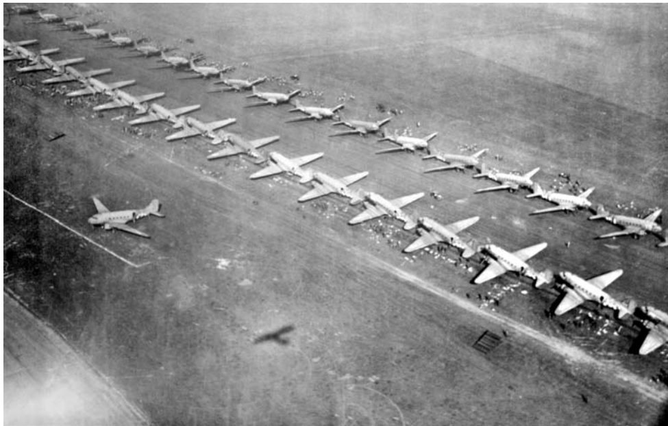
Десантники союзников грузятся на самолеты перед операцией «Маркет-Гарден»