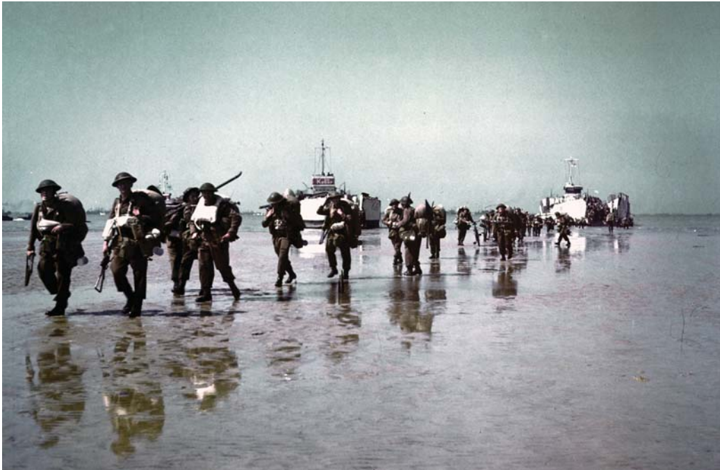
Канадские солдаты высаживаются в Нормандии. 1944 г.