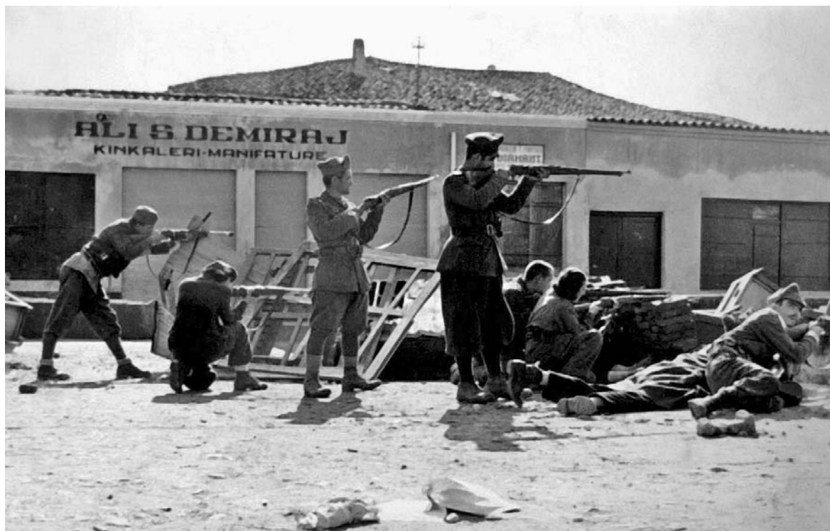
Албанские партизаны в ходе боев за Тирану

готовку, были привлечены к борьбе с врагом еще до 1,5 тыс. человек 144 . В октябре — ноябре 1944 г. в Венгрии партизанскую борьбу вели уже тысячи патриотов. Местные жители, со своей стороны, оказывали всемерную помощь партизанам.