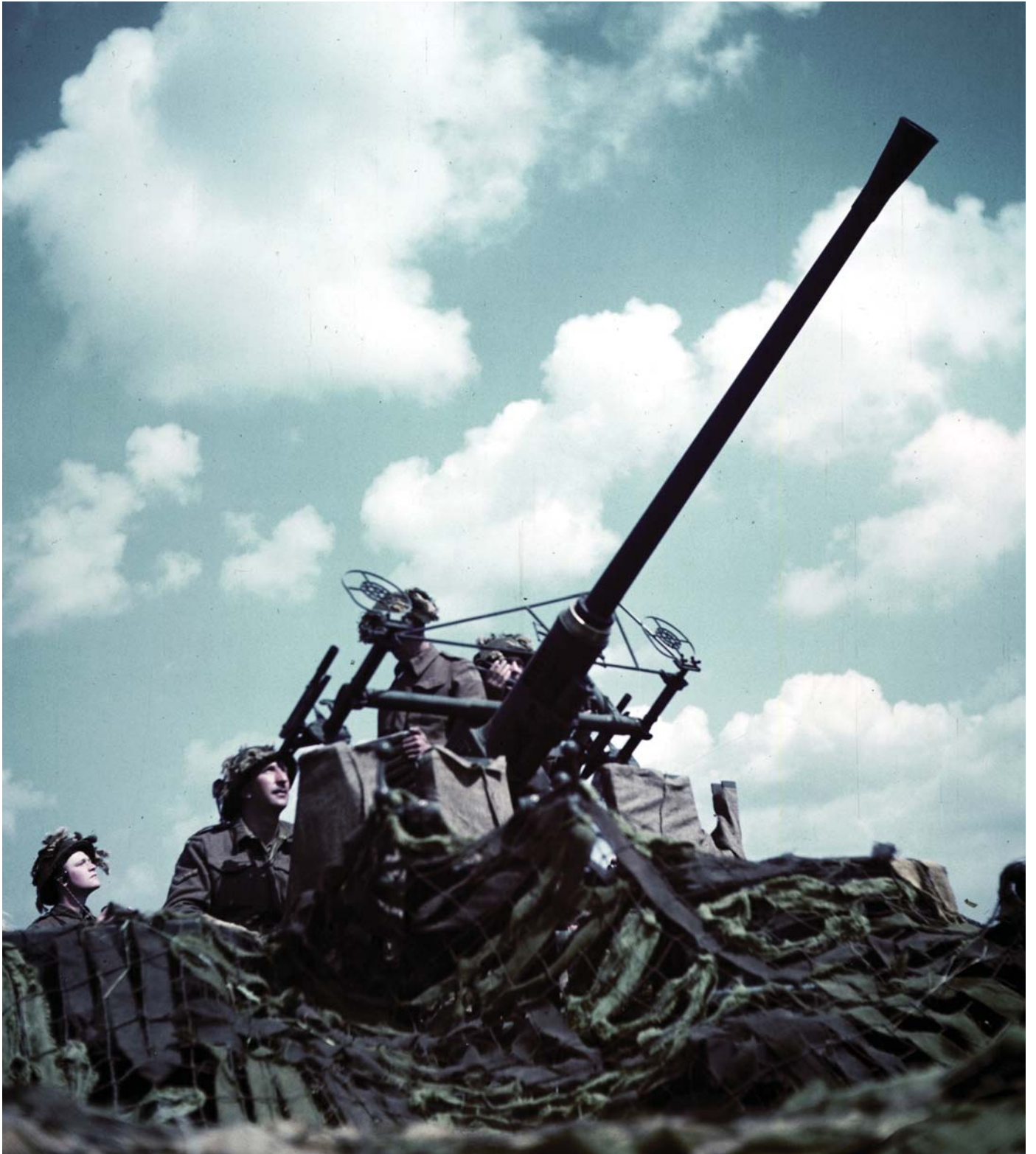
Английский зенитный расчет на позиции. Нормандия, 1944 г.