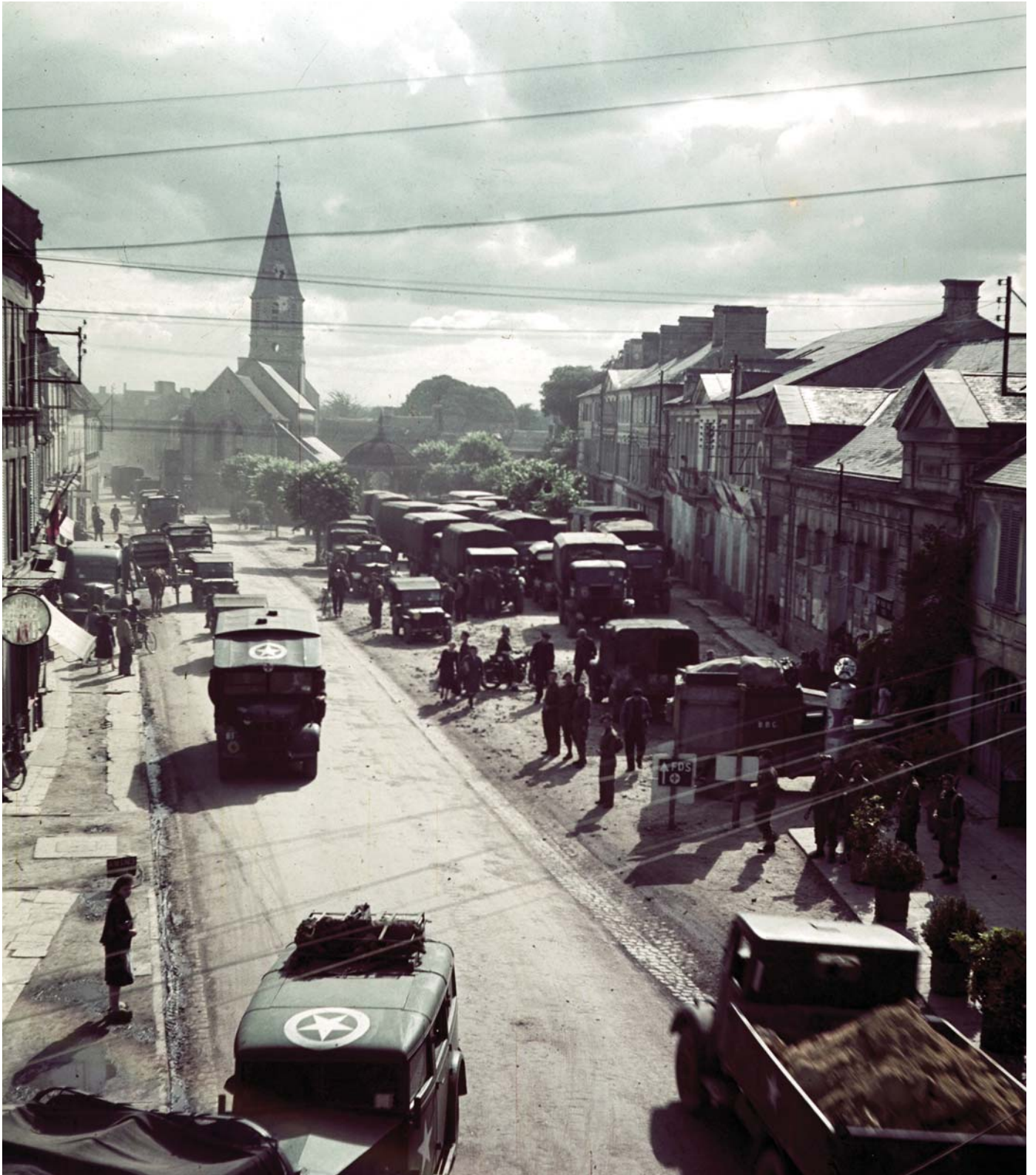
Английские войска в Нормандии. 1944 г.