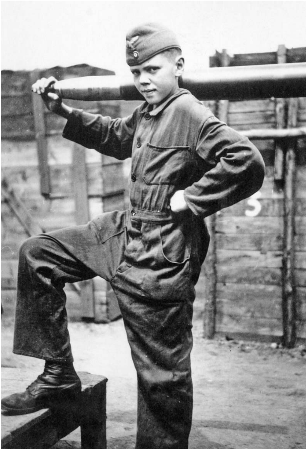
Юный зенитчик рейха