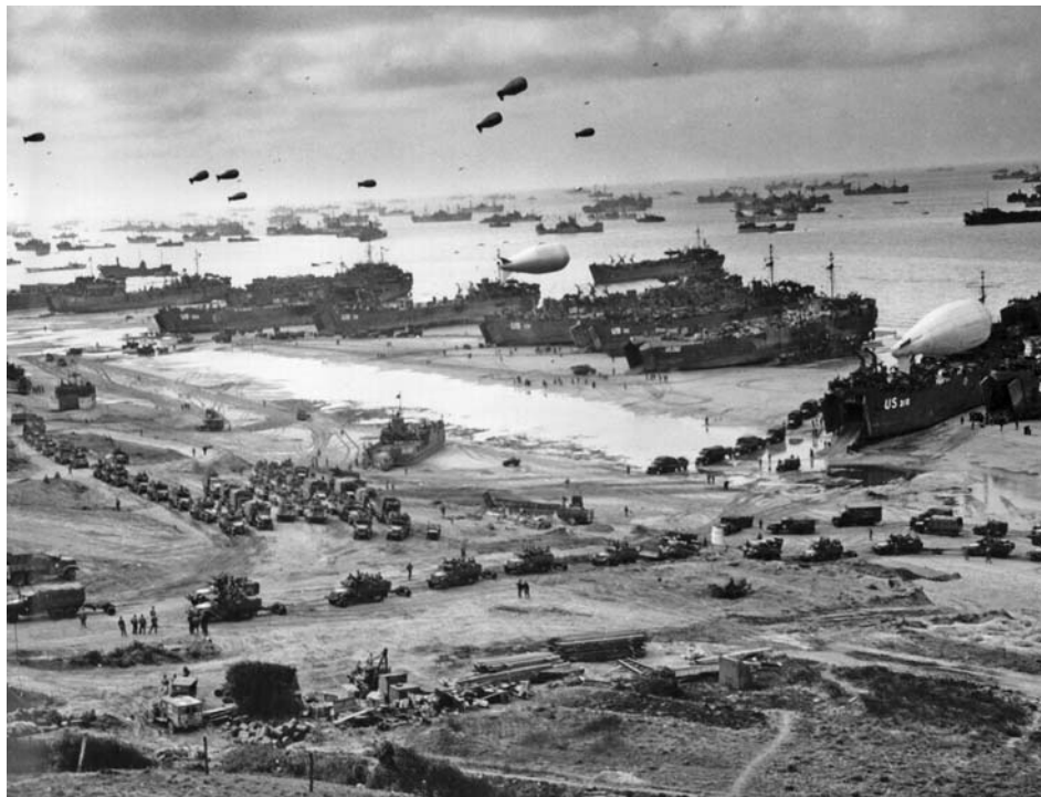
Войска союзников выгружают технику и грузы на захваченном плацдарме