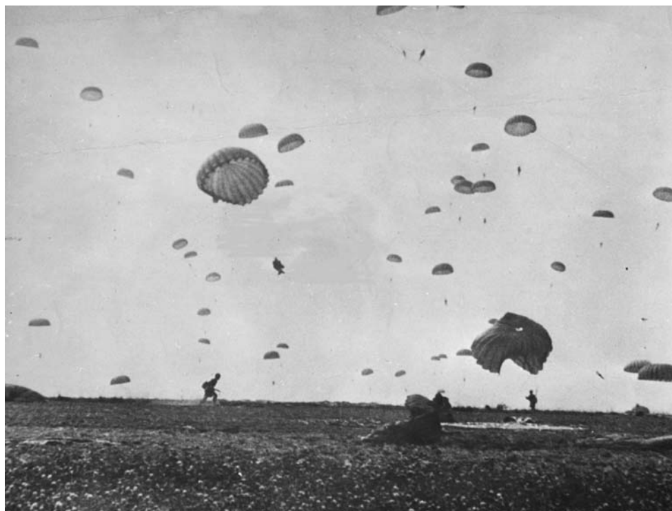
Парашютисты американской 101-й дивизии приземляются на поле в Голландии