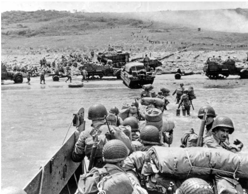
Американское подкрепление высаживается на пляж «Омаха»