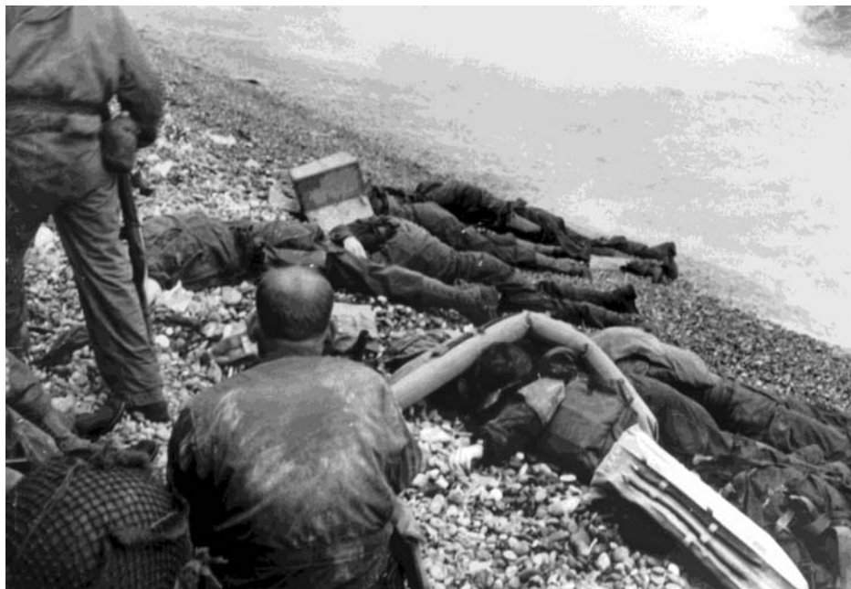
Погибшие американские солдаты на пляже «Омаха»