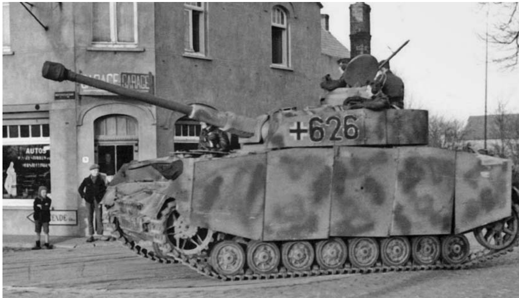
Танк 12-й дивизии СС на улице французского города Кан