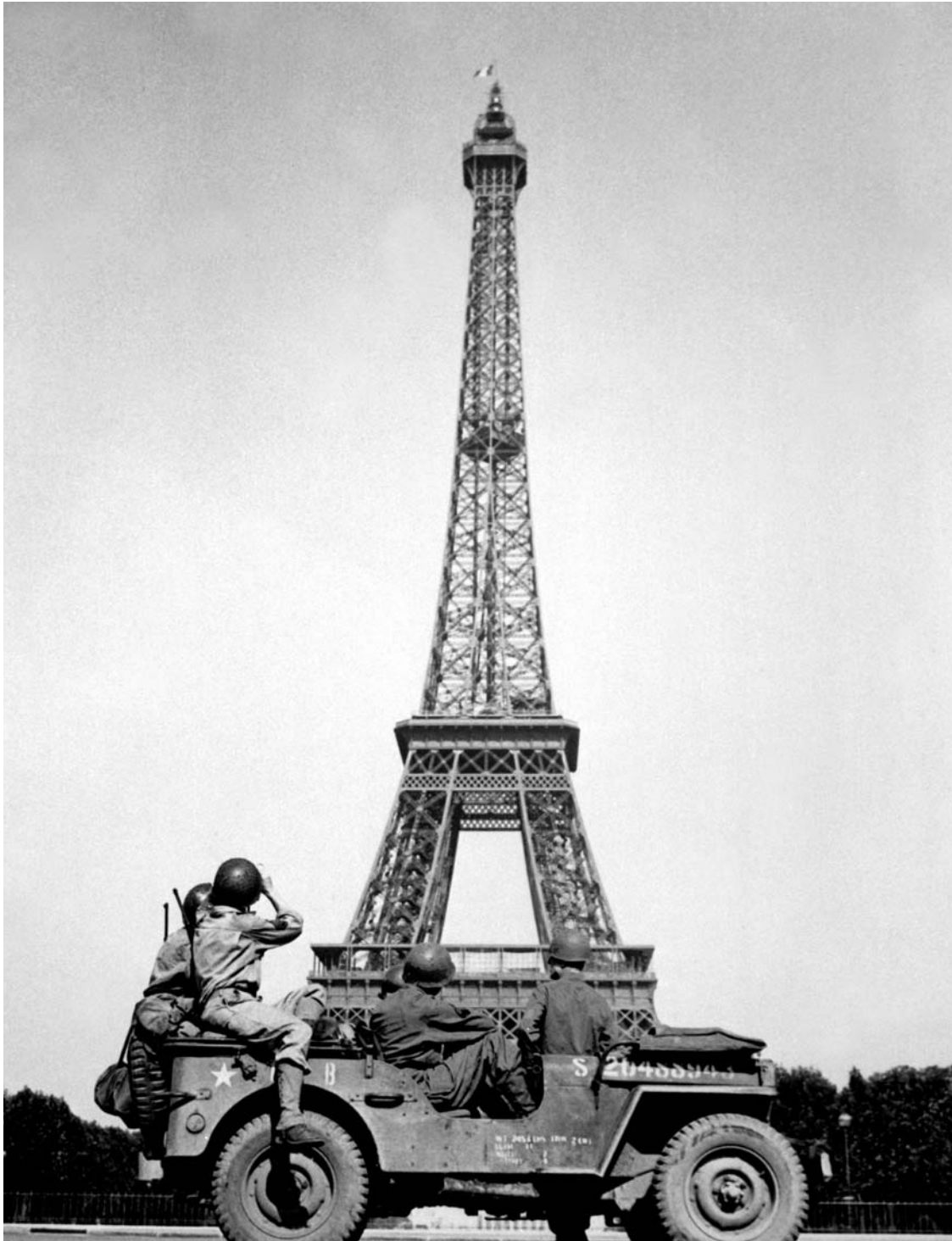
Солдаты 4-й пехотной дивизии США у Эйфелевой башни после освобождения Парижа 25 августа 1944 г.