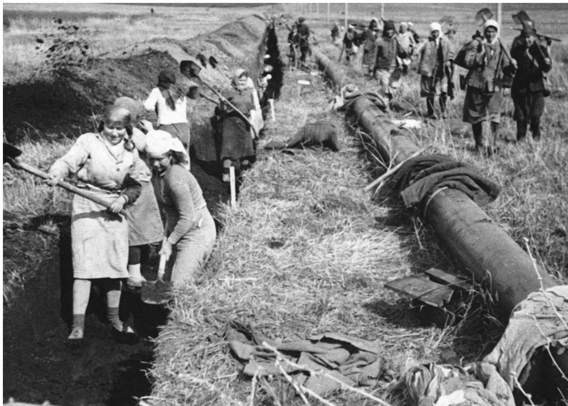
Советские женщины на строительстве газопровода Саратов — Москва