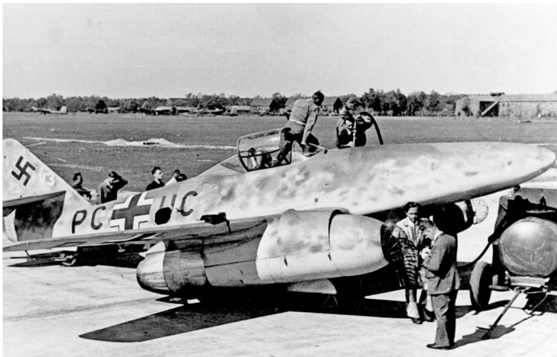
Немецкий реактивный истребитель Me-262