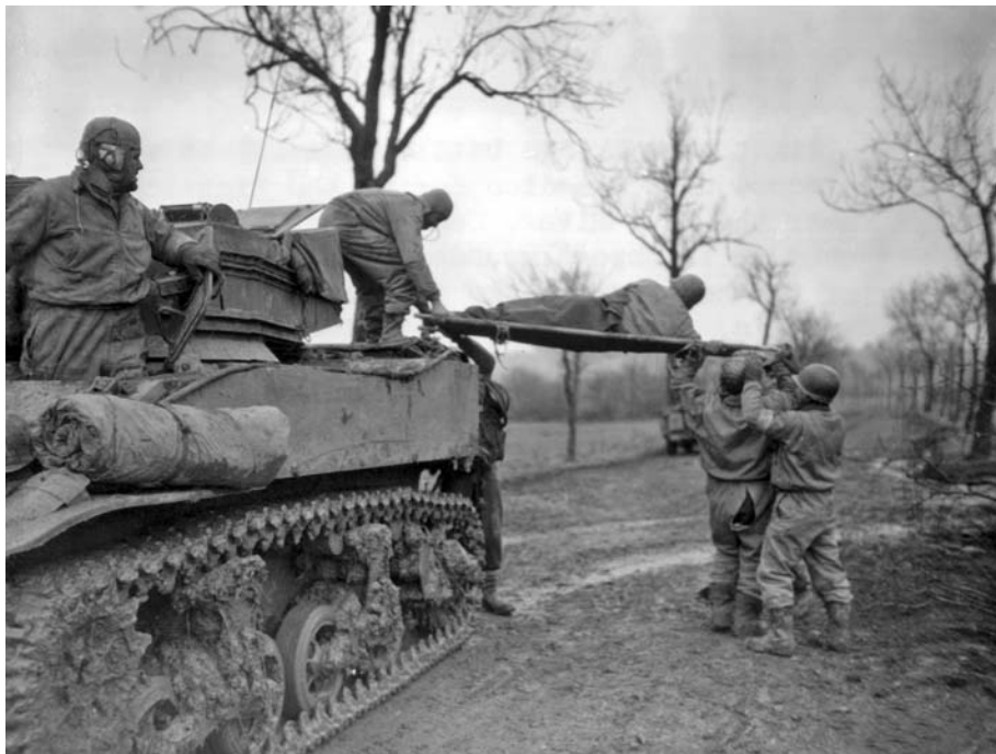
Солдаты снимают носилки с раненым товарищем с легкого танка