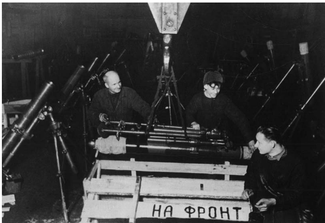
Укладка готовых 120-мм минометов в ящики для отправки на фронт