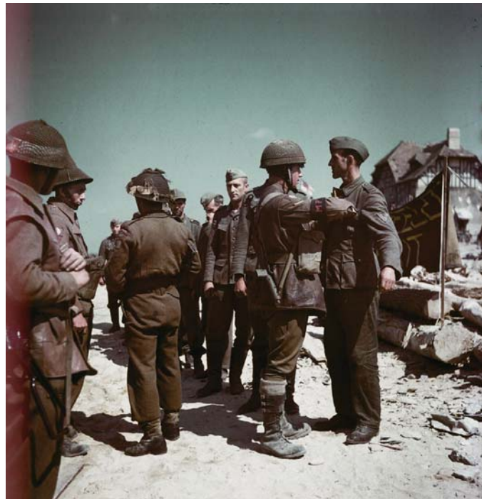
Канадские пехотинцы обыскивают немецких военнопленных. Нормандия, 1944 г.