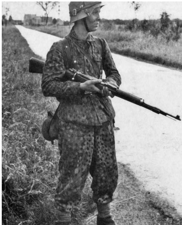
Панцргренадер 12-й танковой дивизии СС в Нормандии