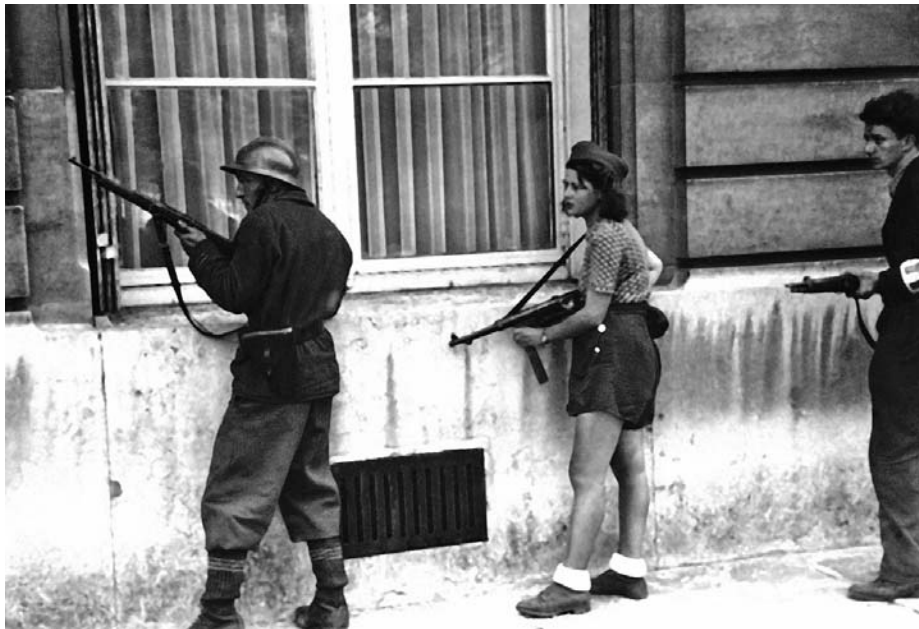
Патруль парижских повстанцев выслеживает немецких снайперов