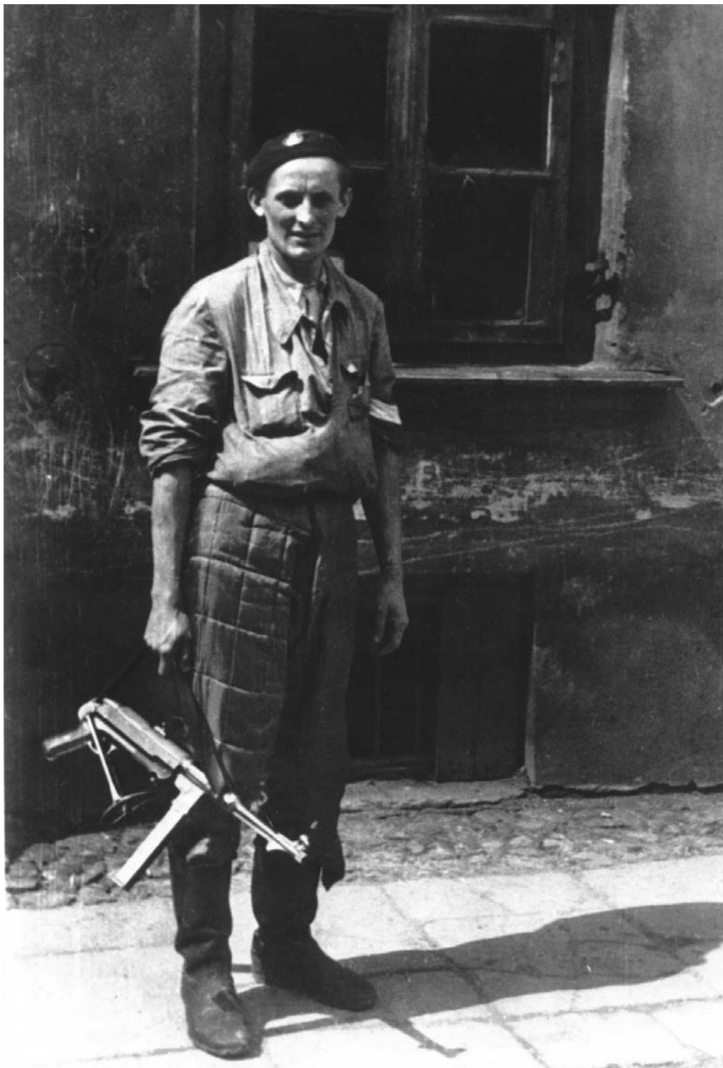
Польский боец Сопротивления