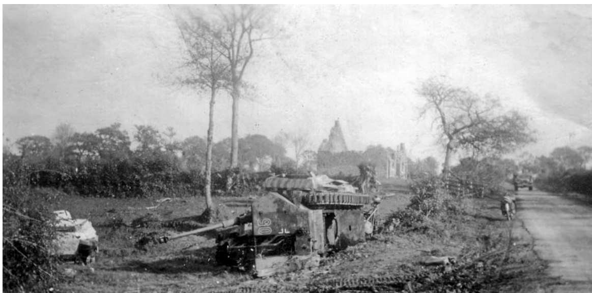
Уничтоженная немецкая техника в Нормандии