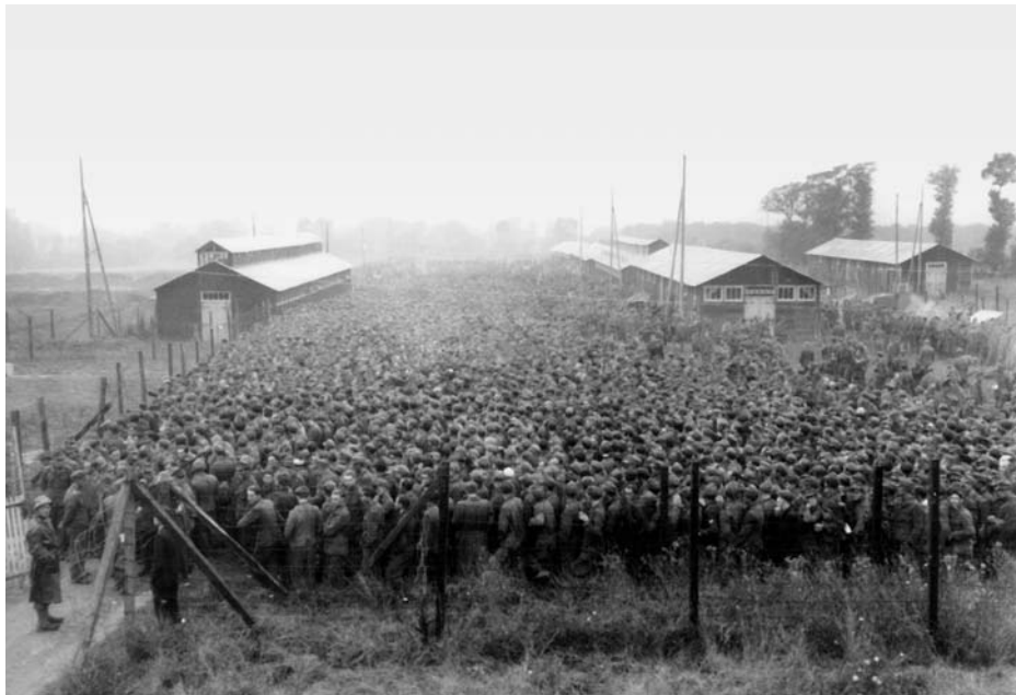
Немецкие солдаты, попавшие в плен в результате Фалезской операции союзников, в лагере у города Нонан-ле-Пен