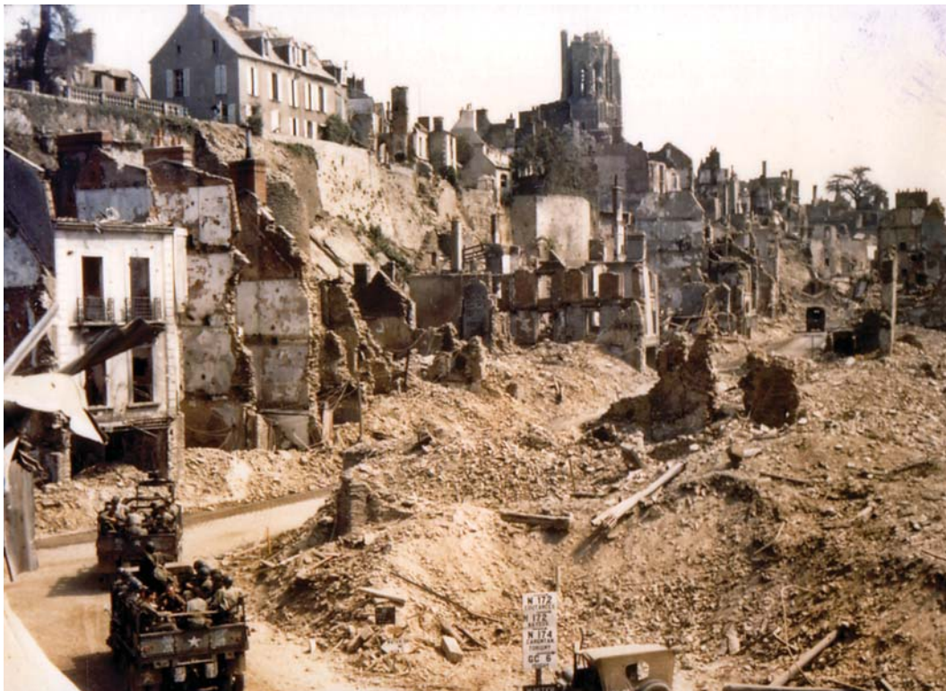
Американские войска входят в Сен-Ло. 1944 г.