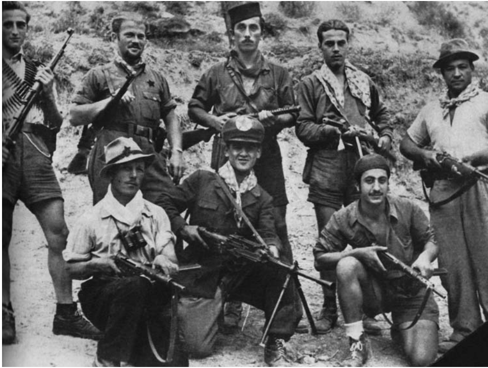
Группа итальянских партизан из района Эмилия-Романья