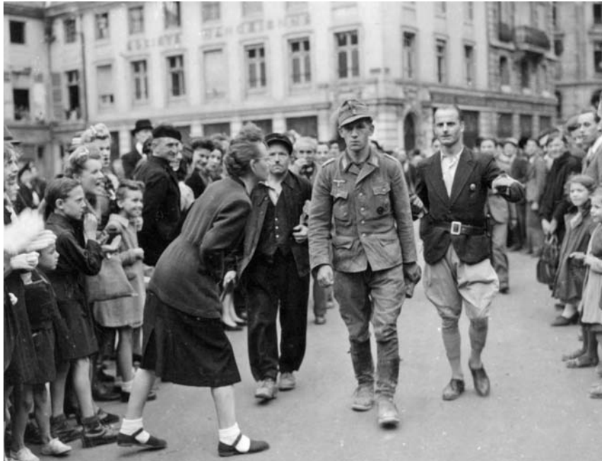
Участники французского Сопротивления конвоируют пленного солдата вермахта