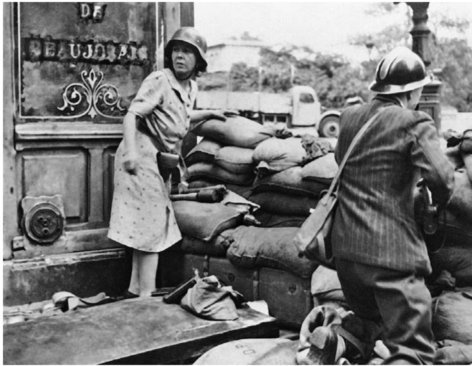
Парижане-повстанцы за уличной баррикадой