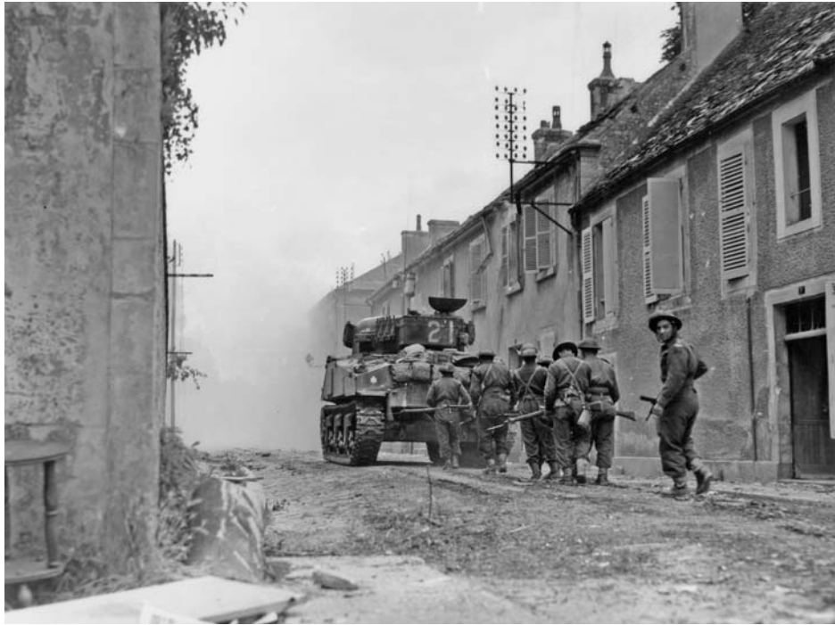
Канадские войска входят в Фалез