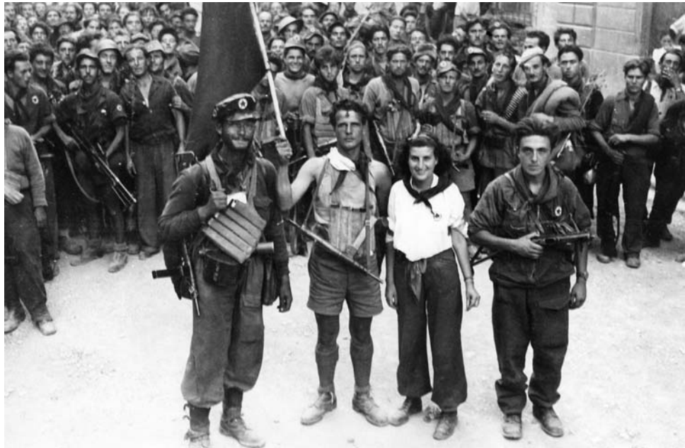
Итальянские партизаны после освобождения Флоренции