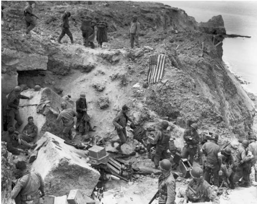
Американцы на захваченном мысе Пуэнт дю Хок в Нормандии. На заднем плане — конвоируемые немецкие военнопленные