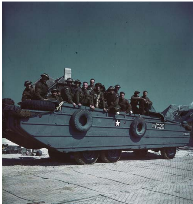
Американский автомобиль-амфибия. Нормандия, 1944 г.