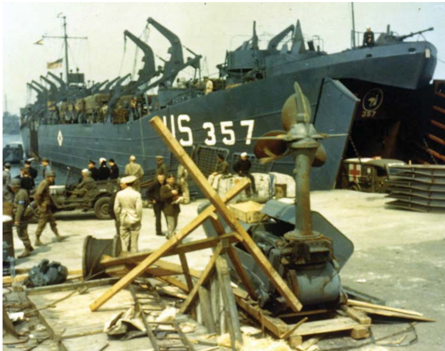
Погрузка снаряжения на десантные корабли накануне высадки союзных войск в Нормандии. 1944 г.