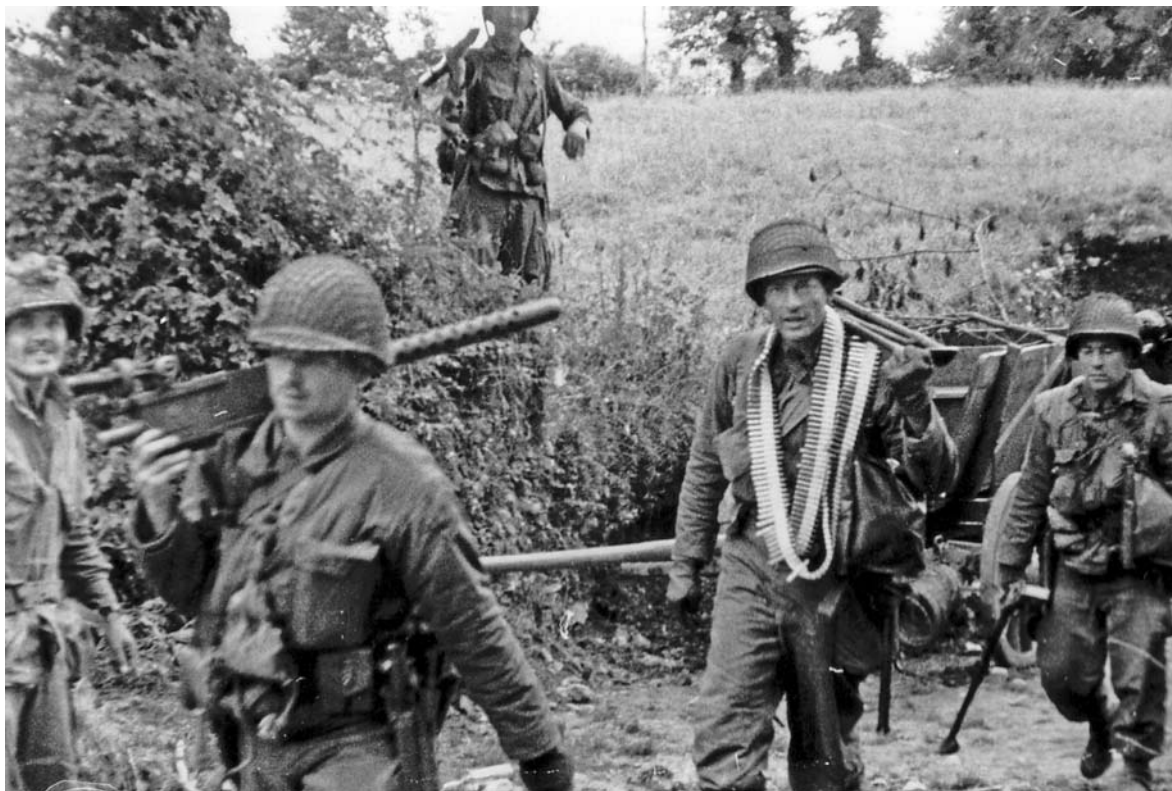
Пулеметный расчет 4-й американской пехотной дивизии выдвигается на позиции