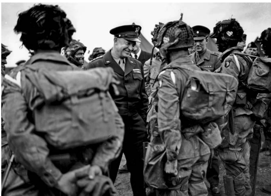
Генерал Дуайт Эйзенхауэр беседует с бойцами роты «Е» 502-го полка 101-й воздушно-десантной дивизии перед их погрузкой в самолеты