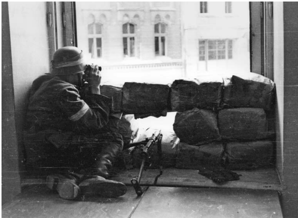
Варшавский патриот наблюдает за немецкими войсками