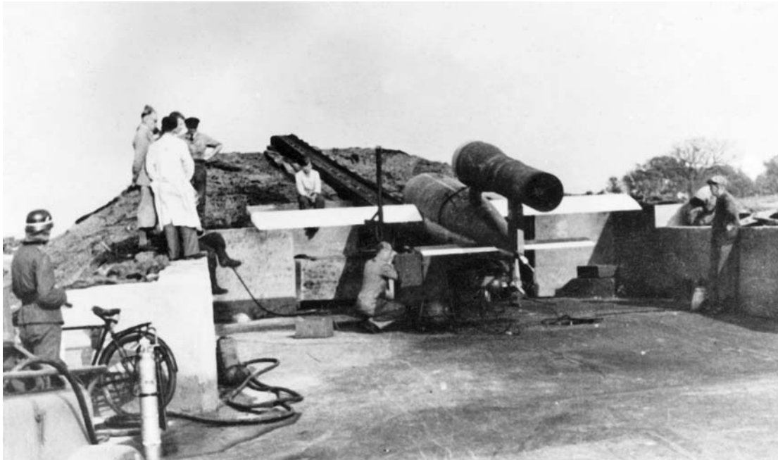
Подготовка к запуску самолета-снаряда «Фау-1»