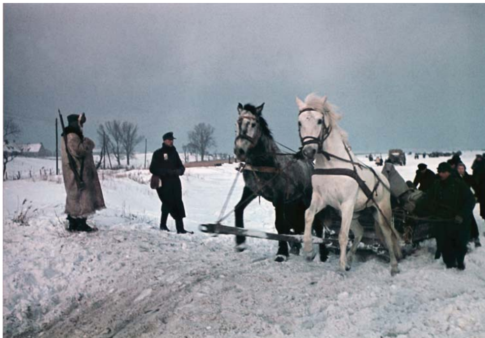
Немецкие беженцы в Восточной Пруссии. 1945 г.