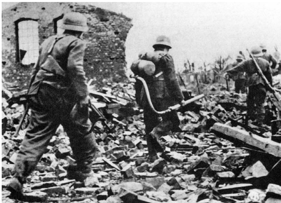
Немецкие солдаты среди развалин города Арнем