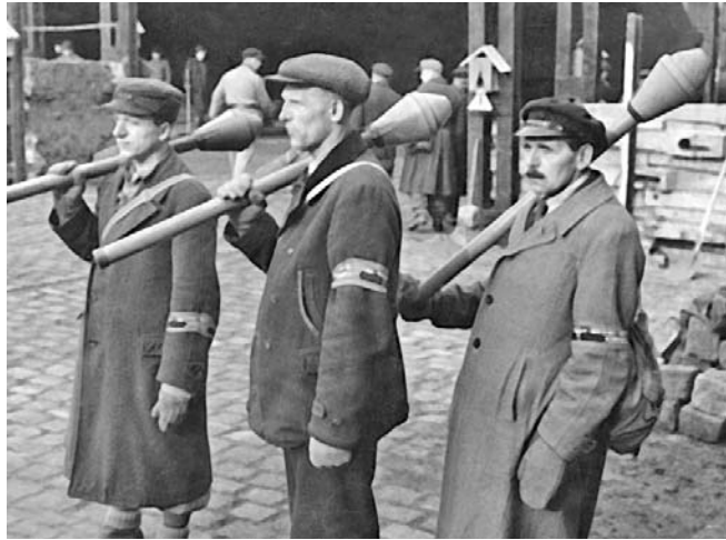
Бойцы немецкого фольксштурма