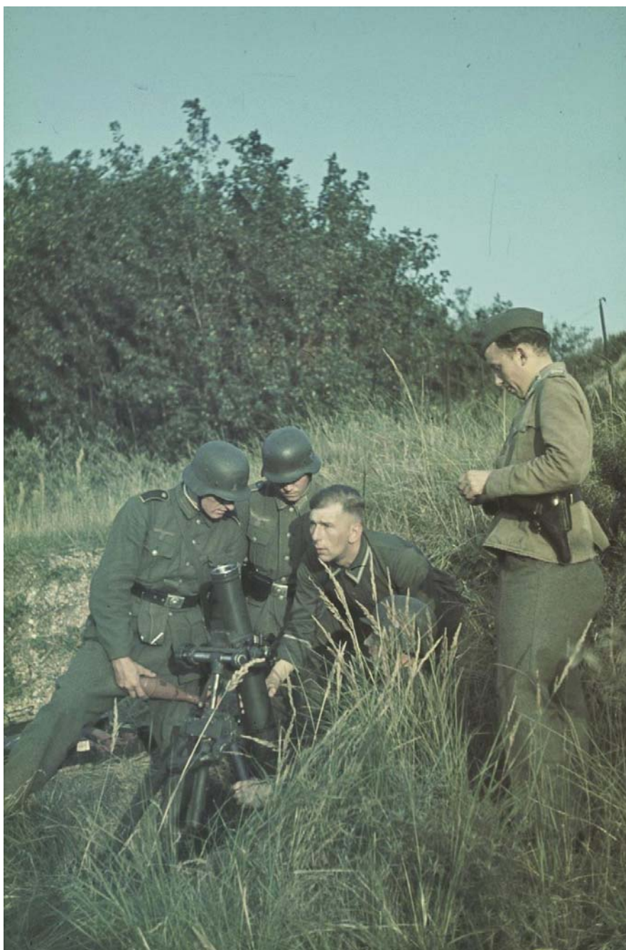
Немецкие минометчики на позиции. 1944 г.