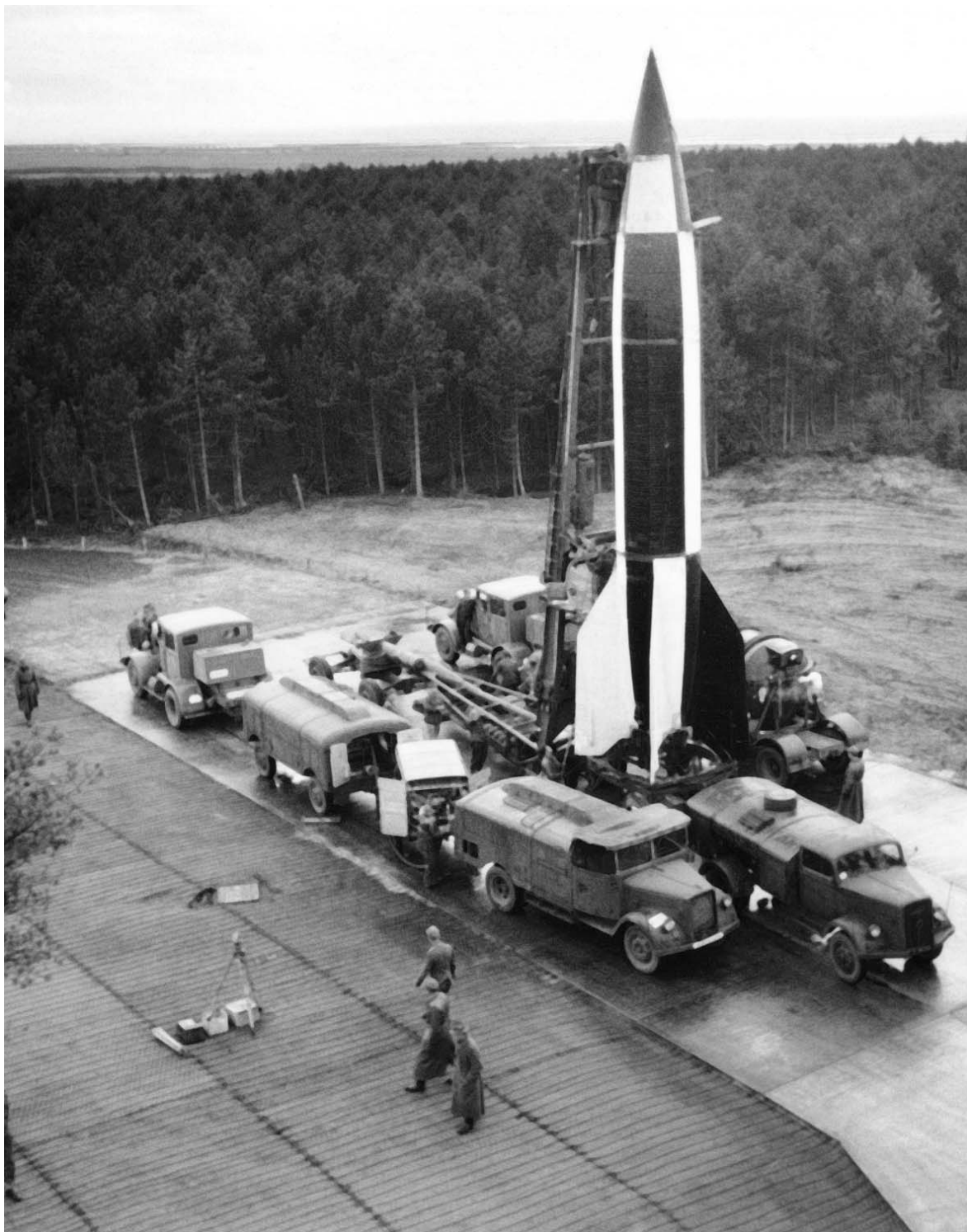
Ракета «Фау-2» на стартовой площадке