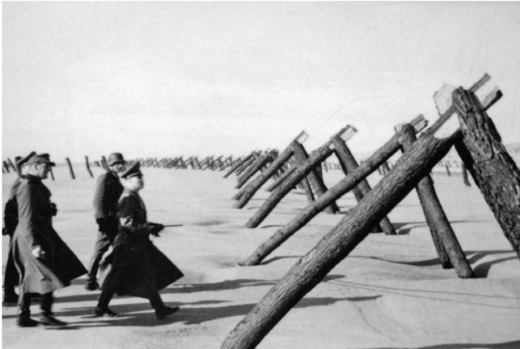
Генерал-фельдмаршал Эрвин Роммель инспектирует укрепления Атлантического вала