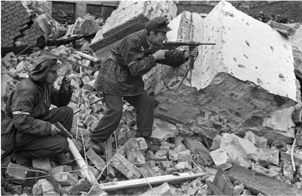
Варшавские повстанцы в бою