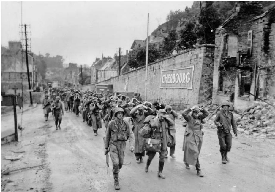
Пленные немецкие солдаты на улице города Шербур