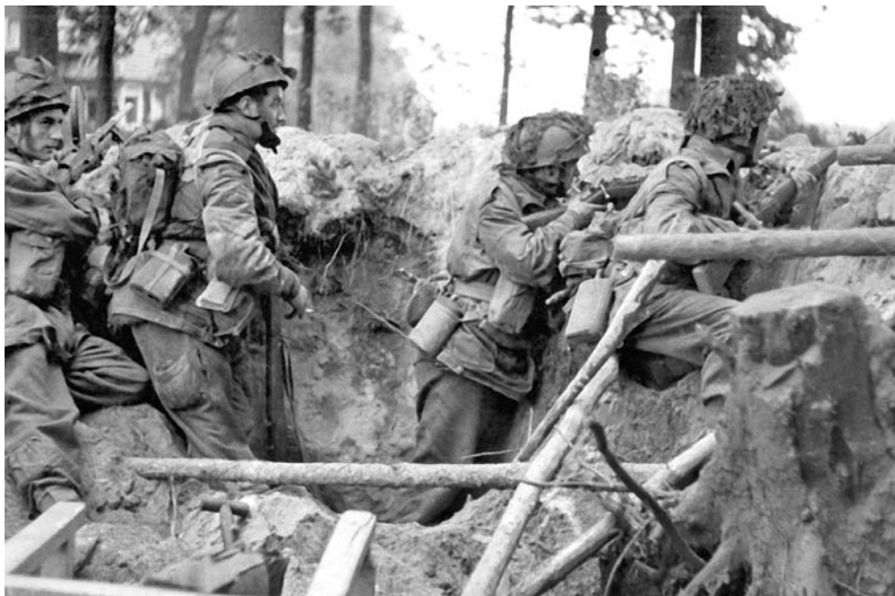
Десантники британской воздушно-десантной дивизии на подступах к Арнему