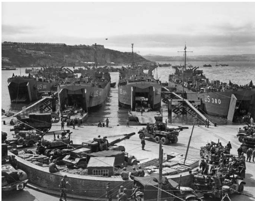
Десантные корабли в английском порту Бриксхэм загружаются техникой для войск, готовых к высадке в Нормандии