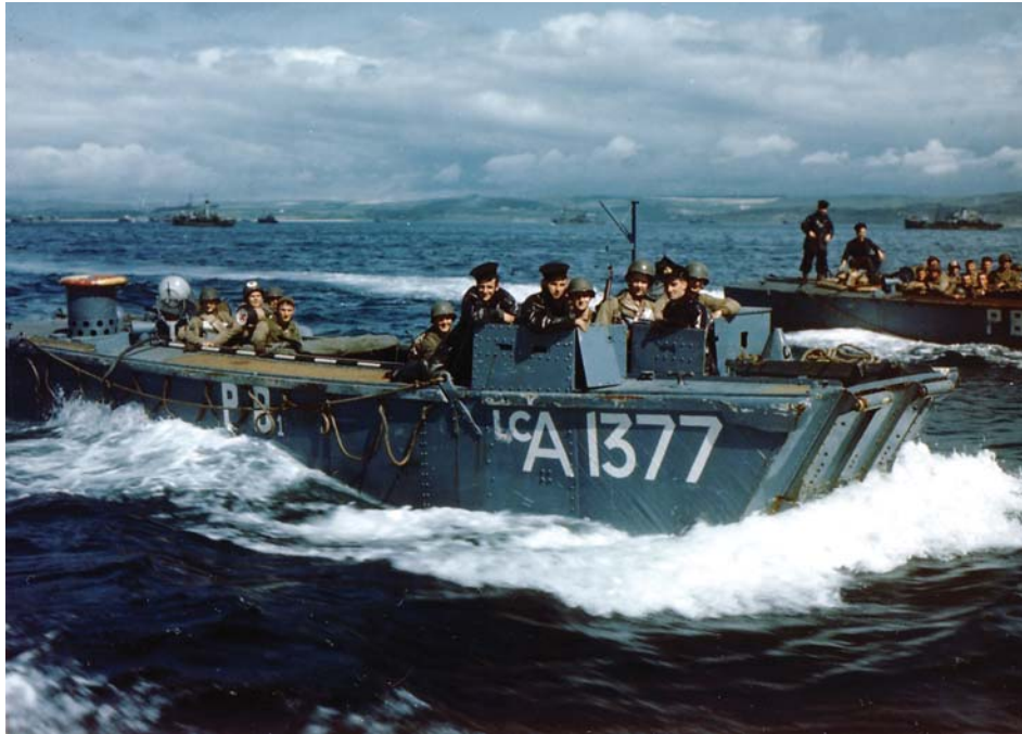
Десантные корабли приближаются к берегу Нормандии. 1944 г.