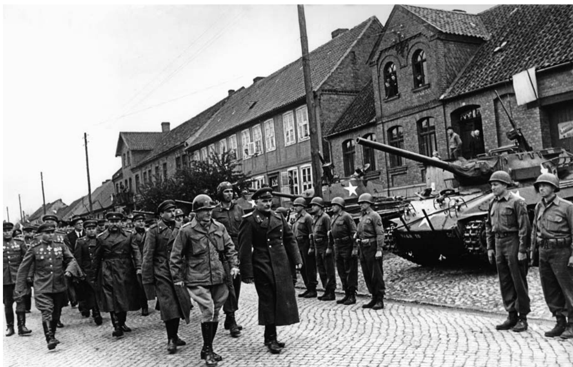
Встреча советских и американских войск на Эльбе. Апрель 1945 г.