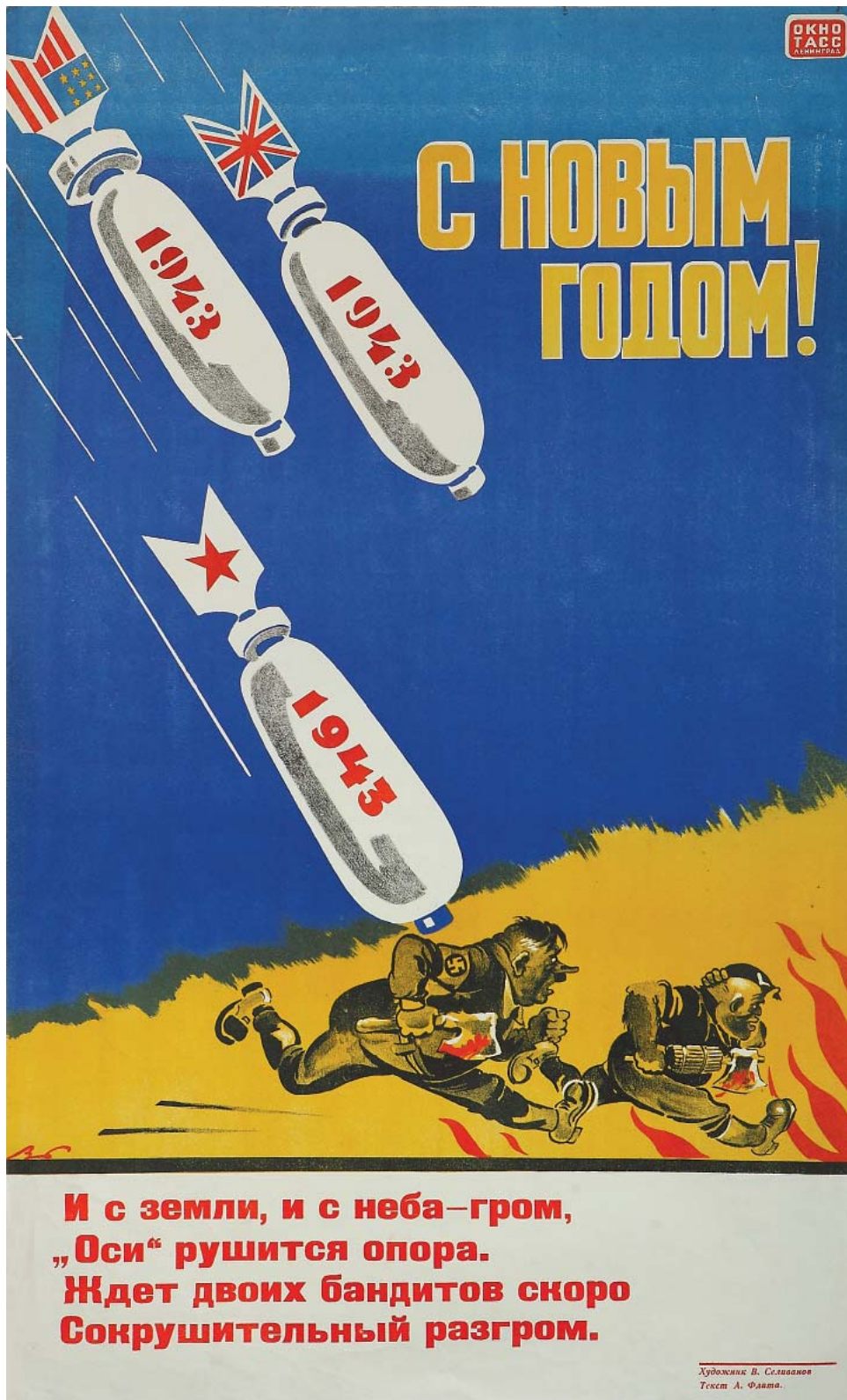
Плакат В. Н. Селиванова. 1943