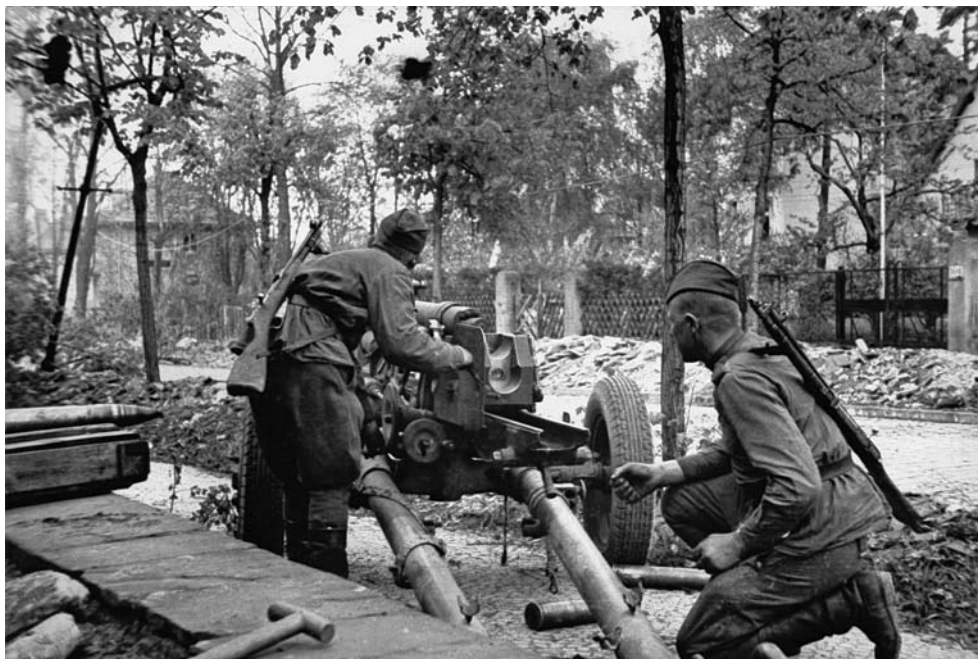
Советские артиллеристы ведут огонь в предместье Берлина