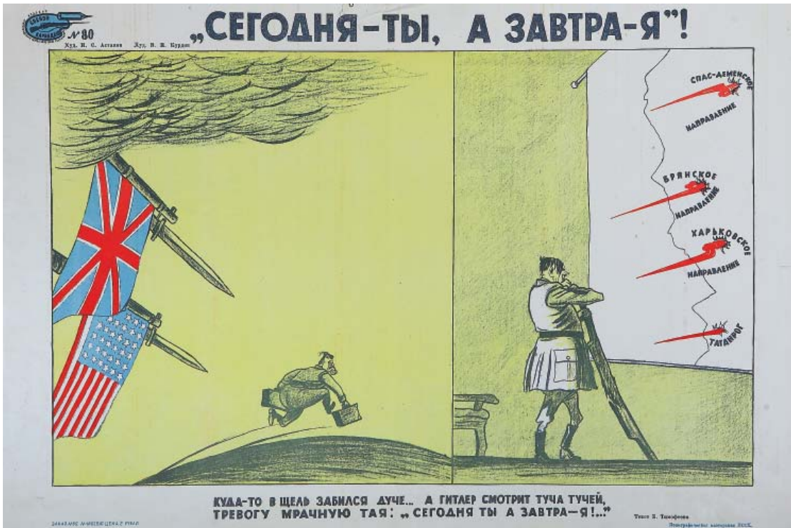
Плакат И. С. Астапова, В. И. Курдова, Ю. И. Петрова. 1944