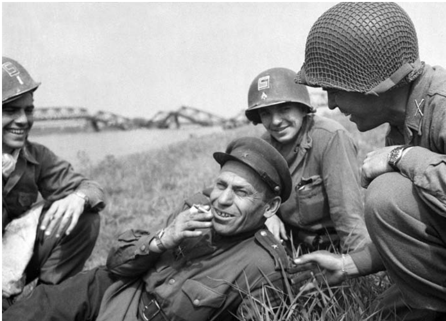
Майор 58-й гвардейской стрелковой дивизии и солдаты 69-й пехотной дивизии США на берегу реки Эльба в Торгау