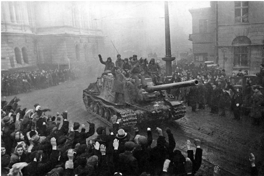
Жители польского города Лодзь приветствуют советские войска