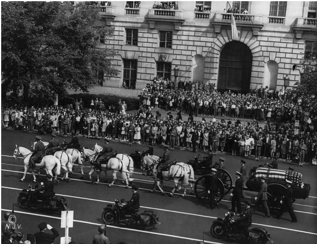
Похороны Ф. Рузвельта

Советский лидер был искренне огорчен кончиной своего партнера по большой тройке. Для руководства СССР Ф. Рузвельт был в это время, пожалуй, наилучшим американским президентом. В соболезновании И. В. Сталина президенту Г. Трумэну говорилось: «Американский народ и Объединенные Нации потеряли в лице Франклина Рузвельта величайшего политика мирового масштаба и глашатая организации мира и безопасности после войны» 39 . Тон, заданный И. В. Сталиным, был подхвачен и развит советской пропагандой. «Мы потеряли одного из величайших государственных деятелей, которых когда-либо знал мир, и великого человека», — заявил посол СССР в США А. А. Громыко. Советские газеты писали о Ф. Рузвельте: «величайший политик мирового масштаба», «выдающийся борец за дело демократии и прогресса» 40 .