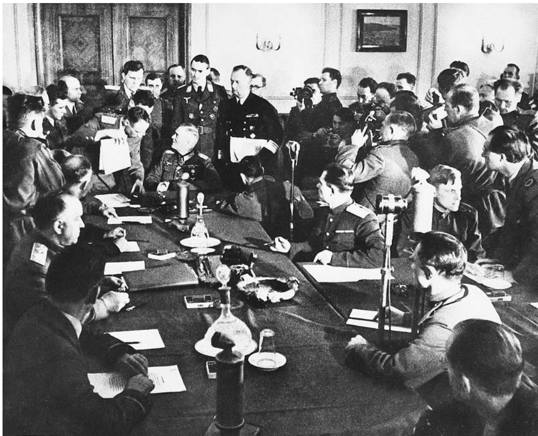
Подписание Акта о капитуляции Германии. В. Кейтелю подают текст Акта. г. Берлин, 8 мая 1945 г.

В июне после некоторых колебаний президент Г. Трумэн все же не последовал призывам У. Черчилля не отводить американские войска с территории советской зоны оккупации. Соглашение о зонах оккупации в Германии и об управлении районом Большого Берлина стало реализовываться. В конце мая было объявлено о создании Контрольного совета из представителей верховного командования четырех союзных держав, призванного «осуществлять высшую власть в Германии на время оккупации» 49 .