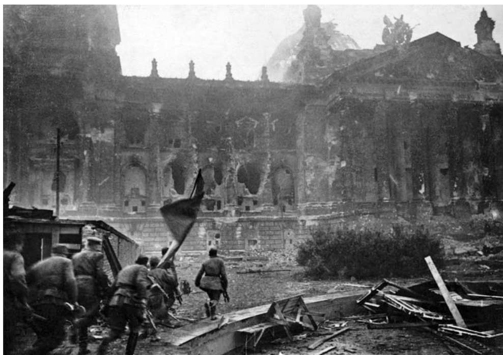
Советская штурмовая группа со знаменем движется к Рейхстагу