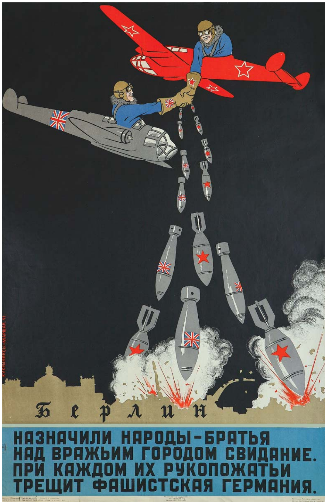
Плакат Кукрыниксов. 1941