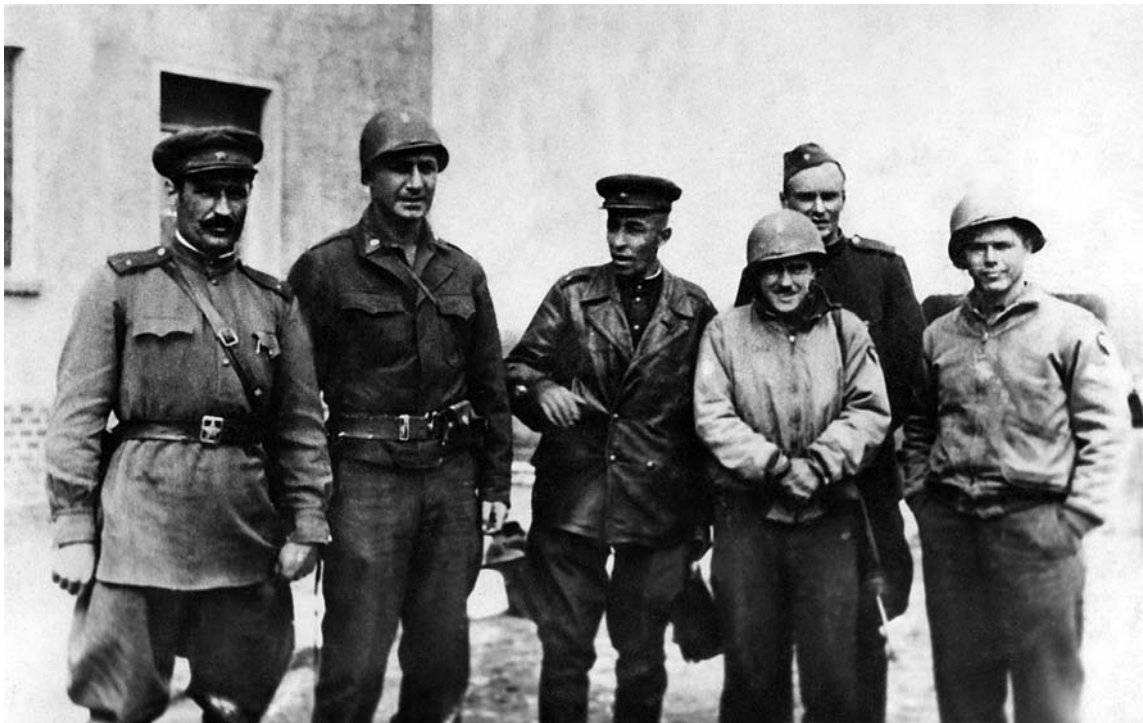
Советские военнослужащие фотографируются с американцами во время встречи на Эльбе