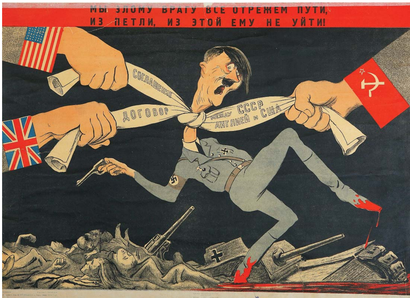
Плакат Кукрыниксов. 1942