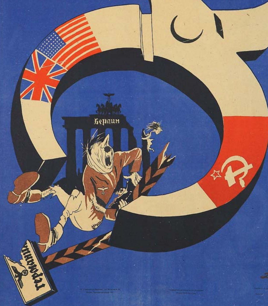
Плакат Н. А. Долгорукова. 1945

ПУЩЕ ДРУГИХ НЕПРИЯТНЫХ ВЕЩЕЙ ГИТЛЕР БОЯЛСЯ ЭТИХ КЛЕЩЕЙ... БЛИЗЯТСЯ СРОКИ: КЛЕЩАМИ ЗАЖАТЫЙ, БУДЕТ РАЗДАВЛЕН БАНДИТ БЕСНОВАТЫМ!