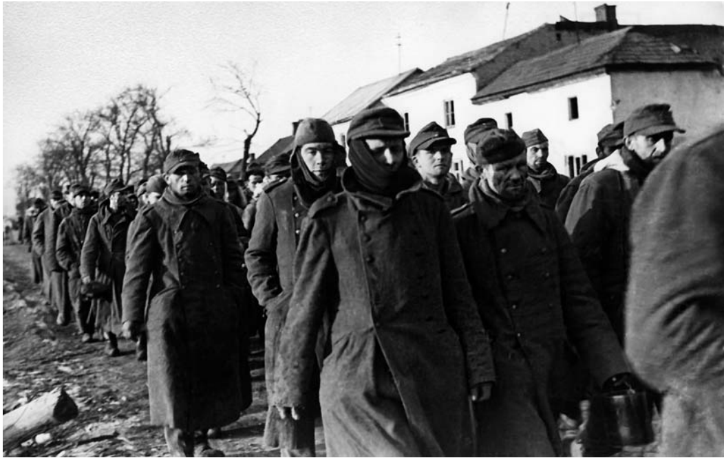
Колонна немецких военнопленных в Варшаве