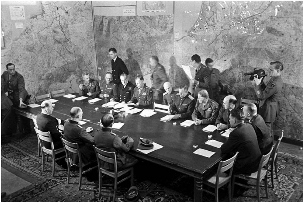
Подписание капитуляции Германии в Реймсе. 7 мая 1945 г.