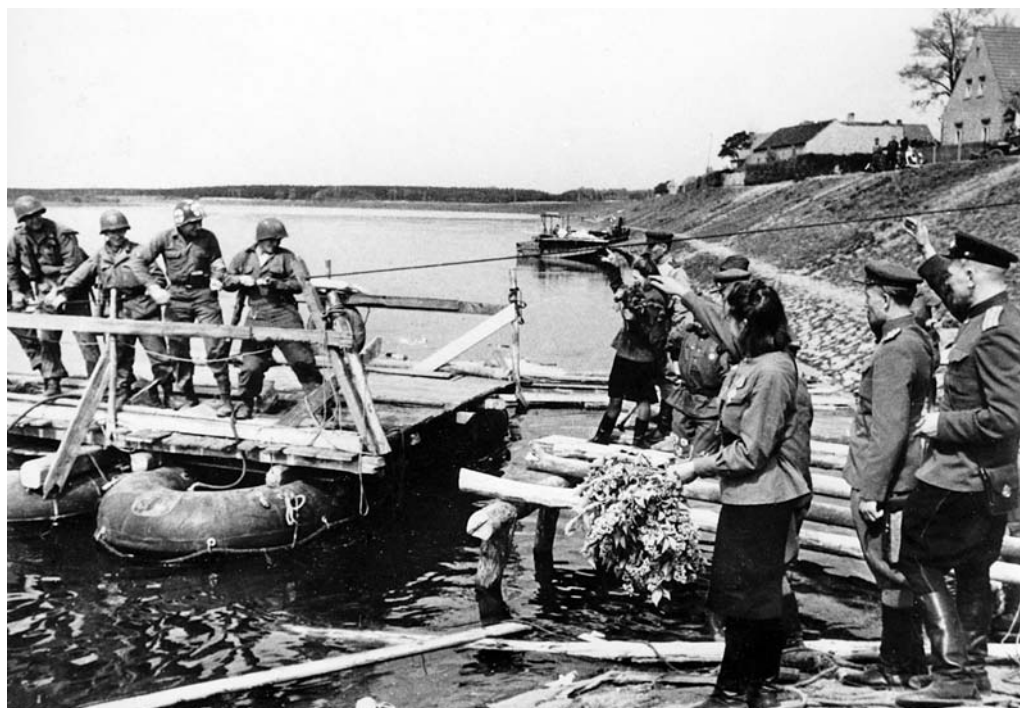
Советские военнослужащие на берегу реки встречают прибывающих американцев