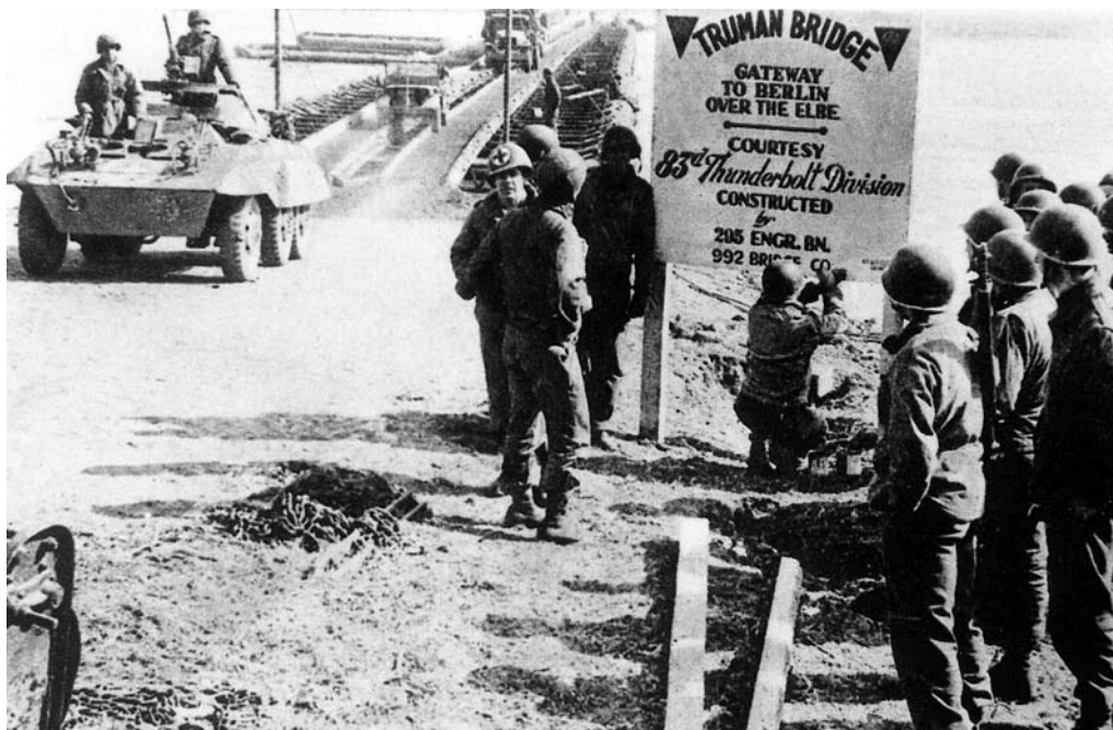
Мост Трумэна через Эльбу