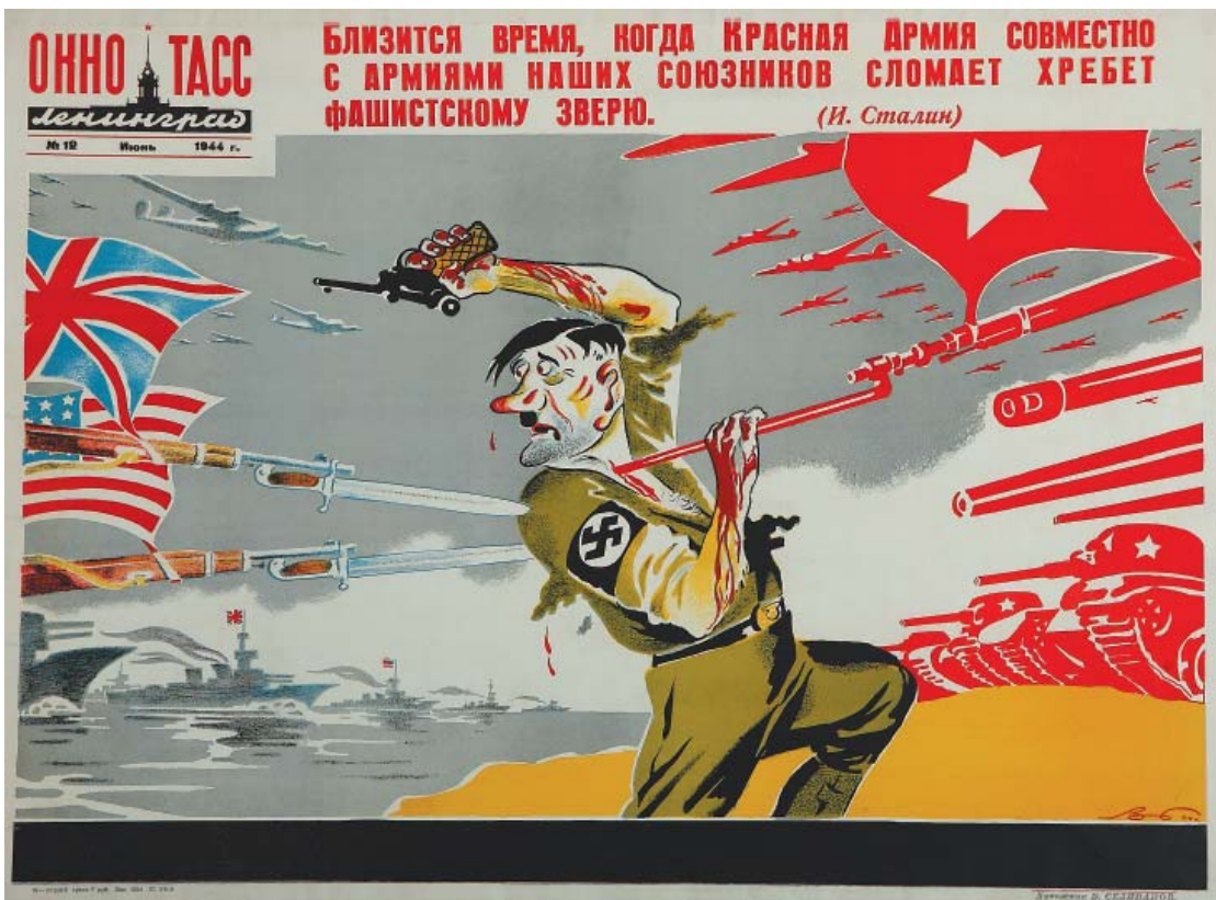
Плакат В. Н. Селиванова. 1944