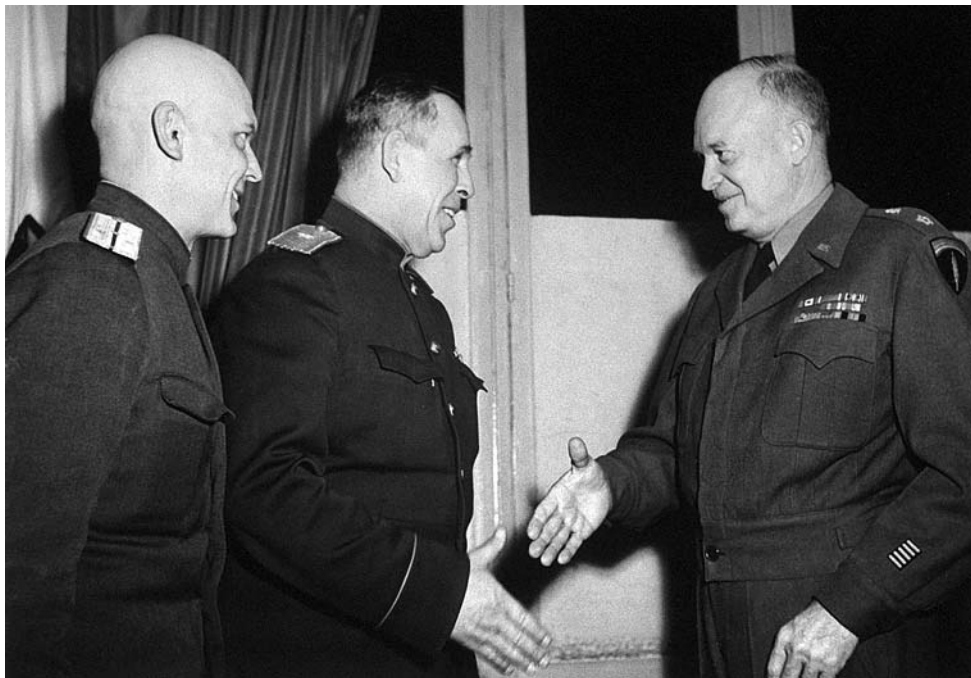
Генерал-майор И. А. Суслопаров пожимает руку Д. Эйзенхауэру на подписании Акта о капитуляции Германии в Реймсе