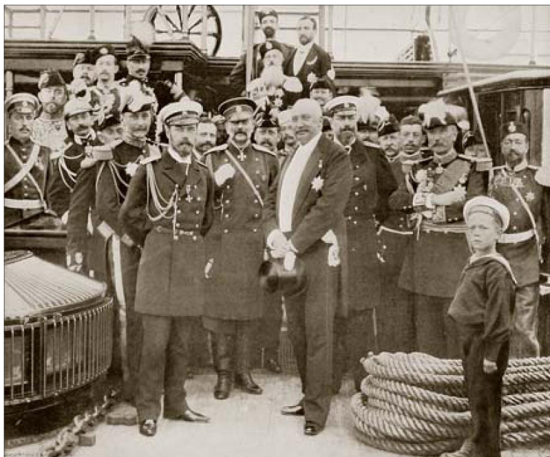
Франко-русский союз провозглашен

соседа, каковым была Германия, союз с Россией был крайне необходим.