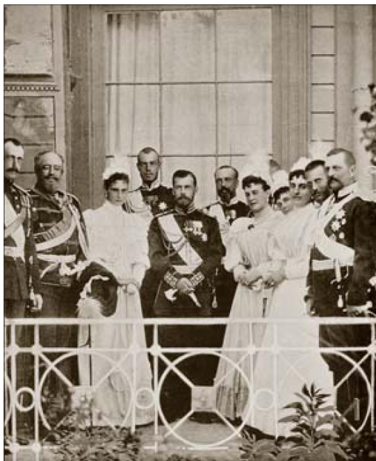
Императорская фамилия в Петергофе

1896 года, соблюдая принцип взаимности, программа должна была содержать мероприятия, аналогичные предложенным французами, с другой стороны — это был первый за долгие годы официальный визит главы Французской республики.