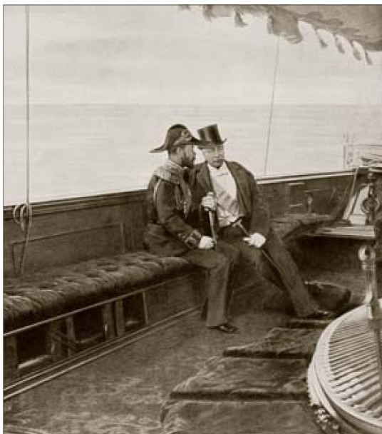
Император и президент на «Александрии»

Во время высочайшего завтрака 14 августа на французском крейсере «Rothuaui» президент поднял бокал и обратился к Их Величествам со следующими словами: «...Шлю России пламенный привет. Русские моряки и французский флот могут гордиться тем, что с первого же дня принимали участие в великих событиях, послуживших началом в тесной дружбе Франции и России. Они сблизили протянувшиеся руки и дали возможность нашим народам, руководимым одним общим идеалом цивилизации, законности и справедливости, соединиться как братьям, в самом чистосердечном и искреннем объятии. От имени Франции я пью за величие России». Император ответил: «Слова, с которыми Вы только что обратились ко мне, Господин Президент, находят живой отклик в моем сердце и совершенно соответствуют чувствам, которые воодушевляют как меня, так и всю Россию. Я счастлив, что Ваше пребывание между нами создает новые узы между нашими двумя народами, дружественными и союзными, одинаково решившими содействовать всеми своими силами сохранению всеобщего мира, основанного на законности и справедливости. Позвольте мне благодарить Вас за Ваше посещение, Господин Президент, и осушить бокал в честь процветания Франции».