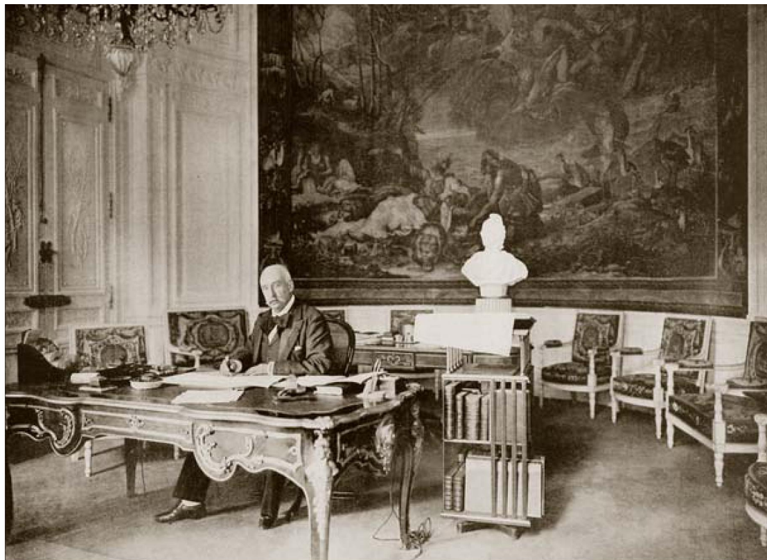
Президент Республики в своем кабинете

(По материалам периодической печати 1897 года из фондов Центральной военно-морской библиотеки; фотографии из фондов Центрального военно-морского музея)