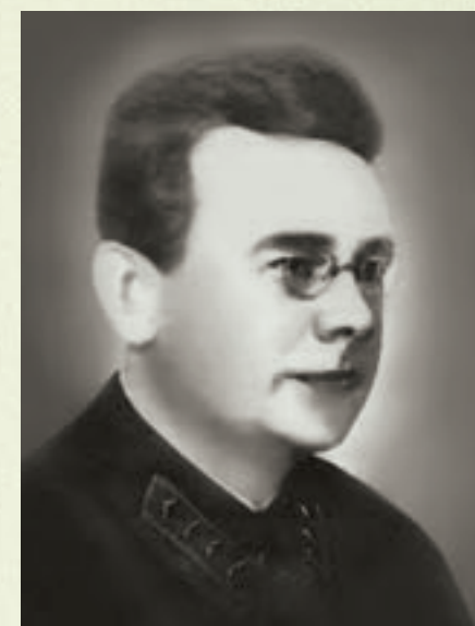
А. И. Корк

В течение ряда лет высоких показателей в боевой и политической подготовке, в овладении новой техникой, в борьбе за строгий уставной порядок и дисциплину добивались 27-я Омская, 33-я стрелковая и 7-я Самарская кавалерийская дивизии.