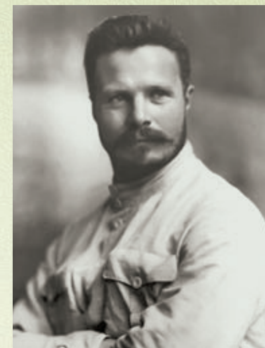
М. В. Фрунзе

В строительстве новой армии советскому государству приходилось идти неизведанным путем. Не было понимания характера будущей войны и представления о способах ее ведения, не было готовых рецептов строительства и подготовки вооруженных сил. Остро стоял вопрос создания военной промышленности — а для этого надо было иметь представле-