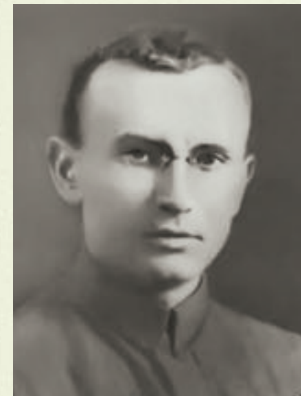
И. П. Уборевич