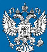
Администрация Президента Российской Федерации