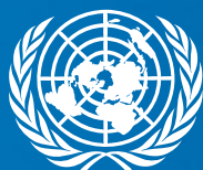
Организация Объединенных Наций