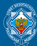
Совет безопасности Российской Федерации