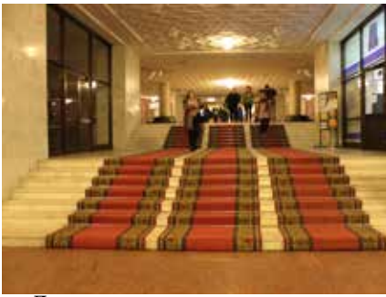
Лестница в шестом корпусе — одна из непреодолимых преград для колясочника

первокурснику с ограниченными возможностями