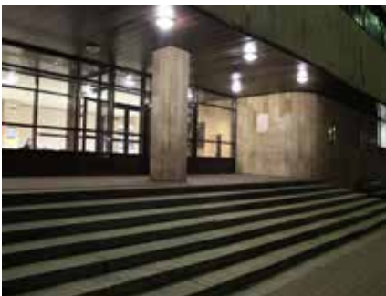
Вход во второй корпус ещё недавно выглядел так. Недавно здесь появился пандус. Идут испытания...