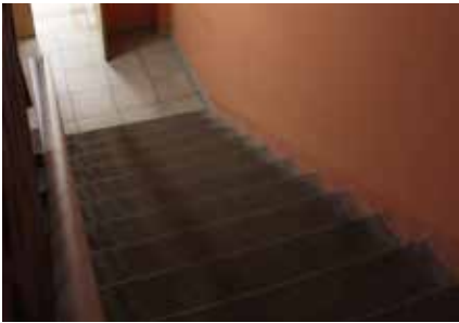
В деканат на третьем этаже второго корпуса придётся ехать на чьих-нибудь сильных руках