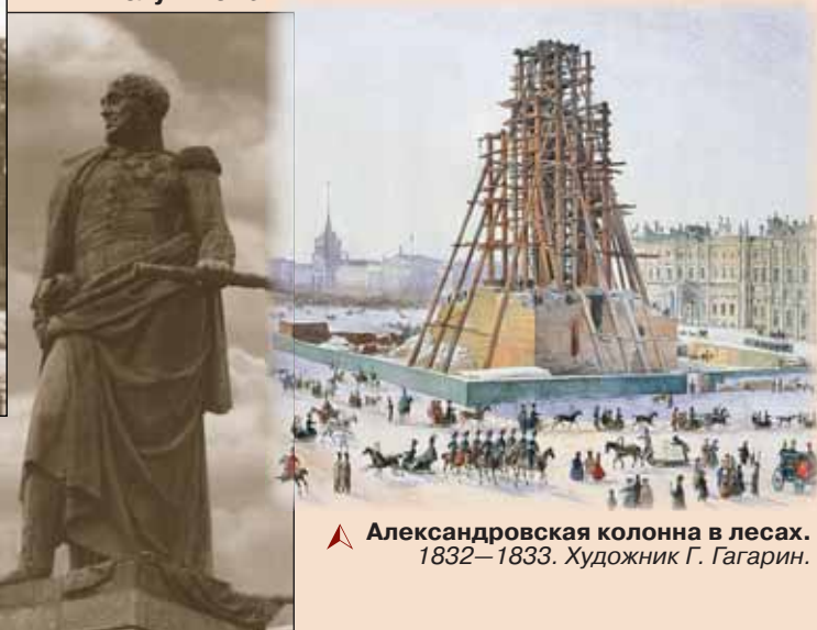
▲ Александровская колонна в лесах. 1832–1833. Художник Г. Гагарин.

▲ Пьедестал колонны, лицевая сторона, обращённая к Зимнему дворцу, наверху – Всевидящее Око в круге дубового венка, который держат в лапах двуглавые орлы, надпись 1812 года, под ним – лавровые гирлянды. На барельефе – две крылатые женские фигуры, держащие доску с надписью: «Александру I благодарная Россия», под ними – доспехи русских витязей, по обеим сторонам от доспехов фигуры, олицетворяющие реки Вислу и Неман