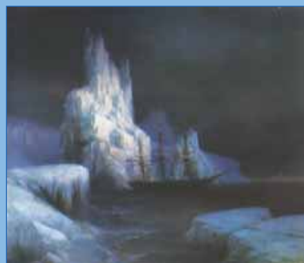
Ледяные горы в Антарктиде Художник И.К. Айвазовский

Публикацию подготовила Н.М. ВЕРЕТЕННИКОВА