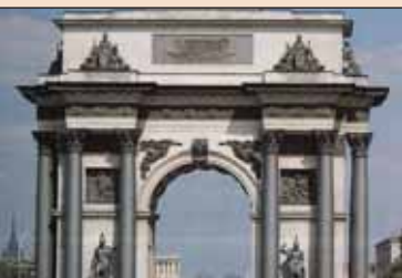
▲ Триумфальные ворота на площади Тверской заставы. 1910-е г.