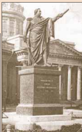
▲ Памятник М.И. Кутузову в Санкт-Петербурге