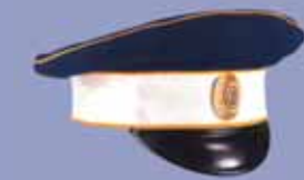
Офицерская фуражка с козырьком 4-го уланского полка