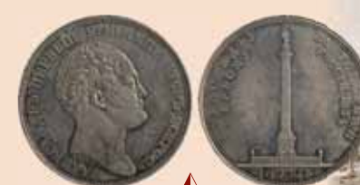
▲ Рубль с портретом Александра I в честь открытия Александровского столпа в 1834 году.