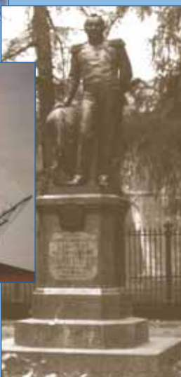
Памятник Ф.Ф. Беллинсгаузену Кронштадт. 1870 г. Скульптор И. Шредер

Иллюстрации из кн.: Губер К., Климовский С., Тронь А., Чернявский С. Балтийский флот три века на службе Отечеству. СПб., Издат дом «Измайловский». 2002. 255 с. ил.; Холкин В.В., Манько В.Л. Черноморский флот в океане филателии. История Черноморского флота, иллюстрированная филателистическими материалами. Ч. I. На вёслах и под парусами (от античных времён до 1855 г.). Севастополь, 2008. 287 с., ил.