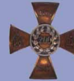
Знак 1-го уланского полка