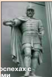
▲ Фигуры воинов в древнерусских доспехах с лавровыми венками. Скульпторы С. С. Пименов и В. И. Демут-Малиновский