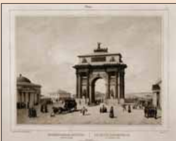
▲ Триумфальные ворота в Москве ▲