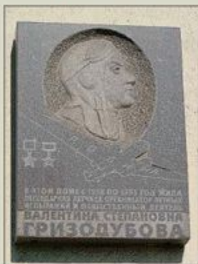
▲ Мемориальная доска на доме, в котором жила В.С. Гризодубова. Москва. Июль 2007 г.