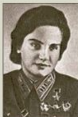
▲ В.С. Гризодубова

В 1942 – 1945 гг. – член Чрезвычайной комиссии по установлению и расследованию злодеяний немецко-фашистских захватчиков. С 1946 года – в отставке. Работала в гражданской авиации начальником летно-испытательной станции, директором НИИ. Была депутатом Верховного Совета СССР 1-го созыва. Награждена двумя орденами Ленина, орденом Октябрьской Революции, двумя орденами Отечественной войны 1-й степени, орденами Трудового Красного Знамени, Красной Звезды и медалями.