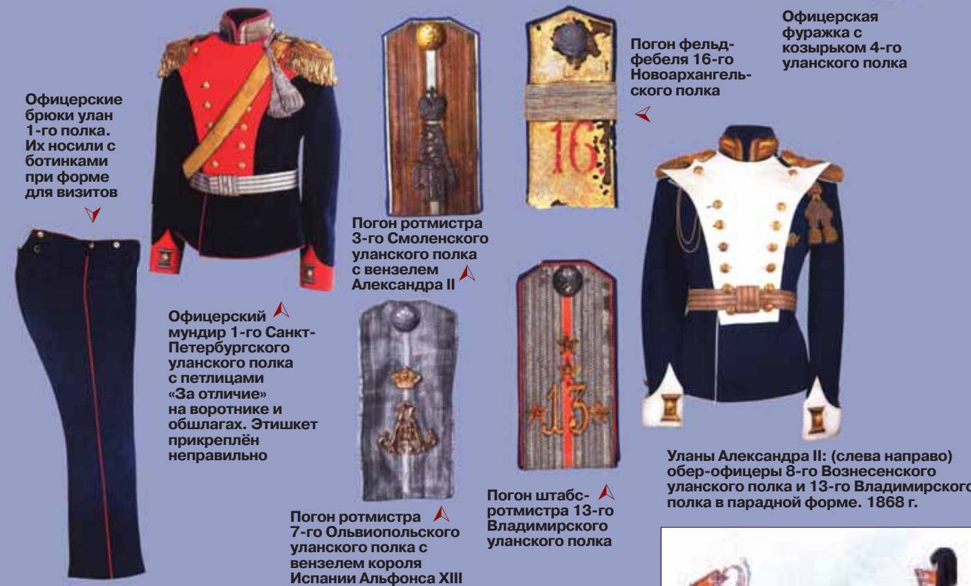
Офицерские брюки улан 1-го полка. Их носили с ботинками при форме для визитов