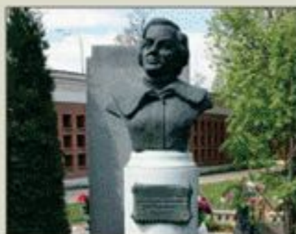
➤ Надгробный памятник В.С. Гризодубовой. Новодевичье кладбище. Скульптор С. Викулов, архитектор В. Курбатов.

Публикацию подготовила Н.М. ВЕРЕТЕННИКОВА