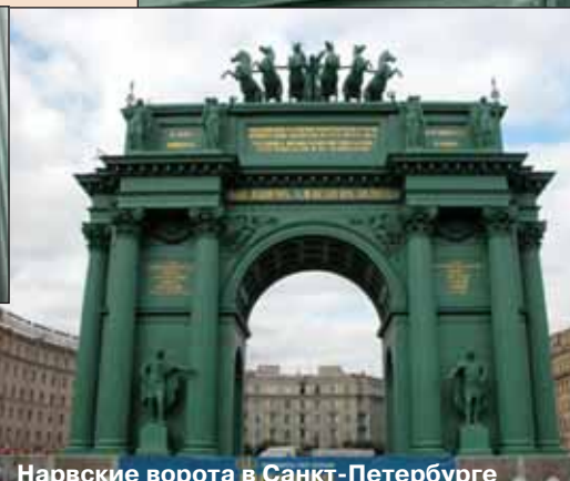
▲ Нарвские ворота в Санкт-Петербурге