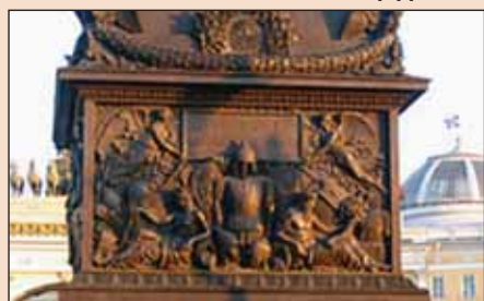
▲ Александровский столп на Дворцовой площади в Санкт-Петербурге