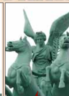
▲ На высоте 15 м – триумфальная колесница Победы из кованой меди. Скульпторы - П.К. Клодт, В.И. Демут-Малиновский, С.С. Пименов.