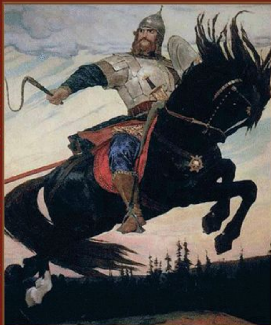
Илья Муромец, 1914 г. Художник В.М. Васнецов

Военно-исторический журнал 2010 № 1 январь