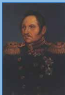
Ф.Ф. Беллинсгаузен. Первая половина XIX в. Неизвестный художник