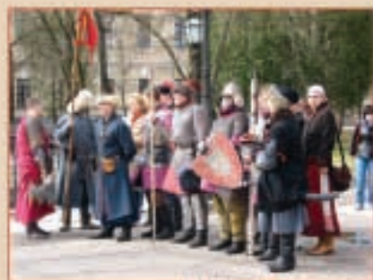
Представление участников фестиваля зрителям