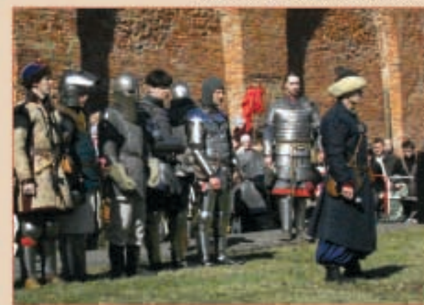
Под бой барабанов открывался турнир по историческому фехтованию