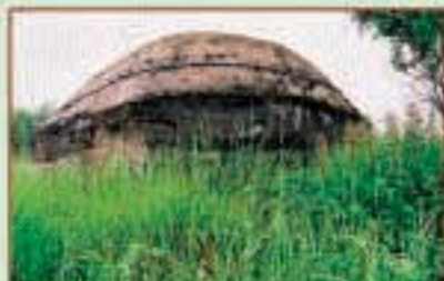
Немецкие доты. Гродненская область, г. Сморгонь (июль 2004 г.)