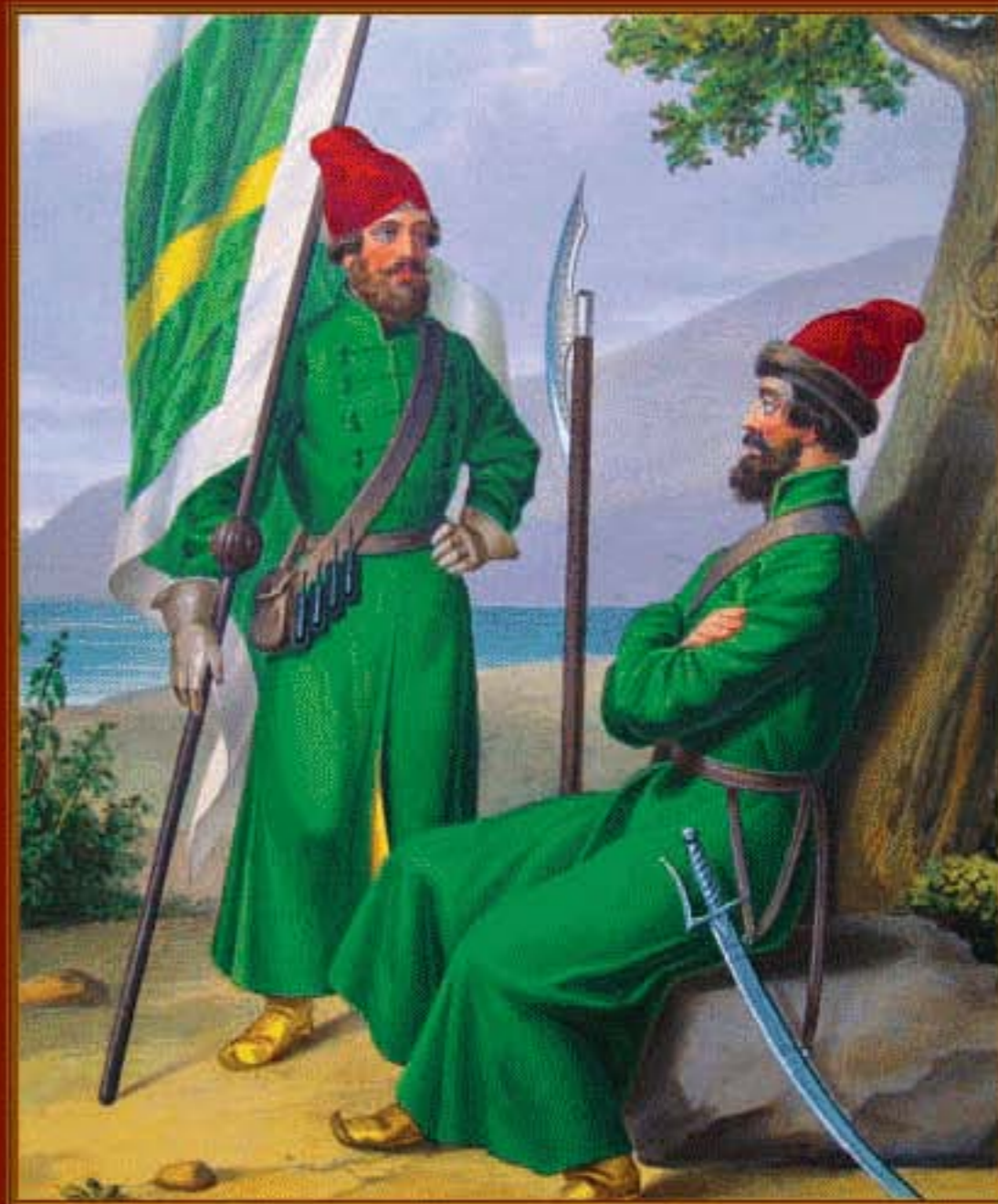
Знаменщик и стрелец Московского стрелецкого Левшина полка в 1674 году. Из коллекций Военно-исторического музея артиллерии, инженерных войск и войск связи (Санкт-Петербург)

Основные причины недостаточной устойчивой работы связи в начальный период войны