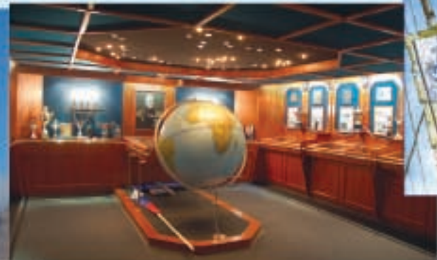
Музей барка «Круzenshtern», где проходила презентация книги