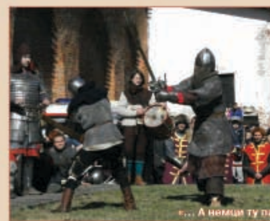
«... А немцы ту падыца в чюдь дрова плещи»