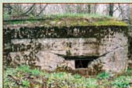
Дот Первой мировой войны. Гродненская область, Сморгонский район, деревня Сутьково (июль 2004 г.)