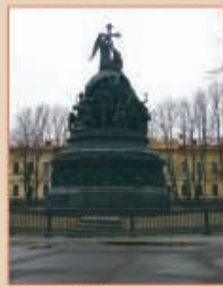
Памятник «Тысячелетие России»