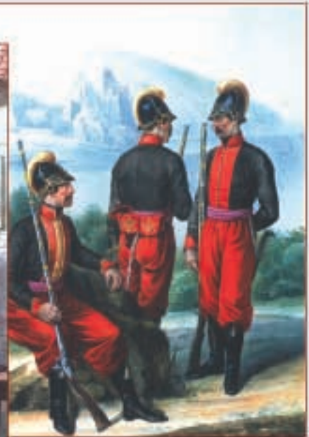
Унтер-офицер и рядовые 1-го батальона Греческого пехотного полка. 1779—1797 гг.