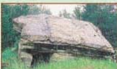
Австро-венгерская линия обороны 1915 – 1917 гг. Брестская область, Барановичский район (апрель 2004 г.)