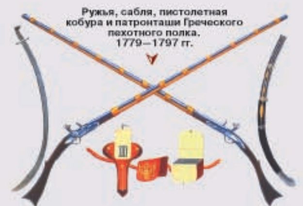
Ружья, сабля, пистолетная кобура и патронташ Греческого пехотного полка. 1779—1797 гг.