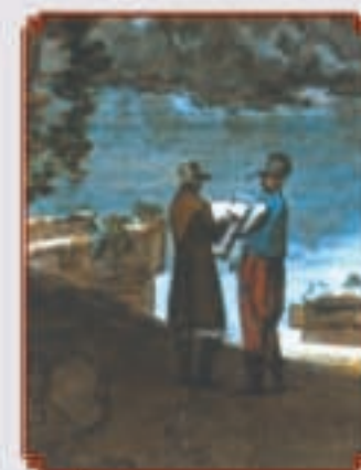
Вид Балаклавского залива Акварель художника Е.М. КОРНЕЕВА, 1804 г. Рядом с художником изображен военнослужащий Греческого пехотного батальона