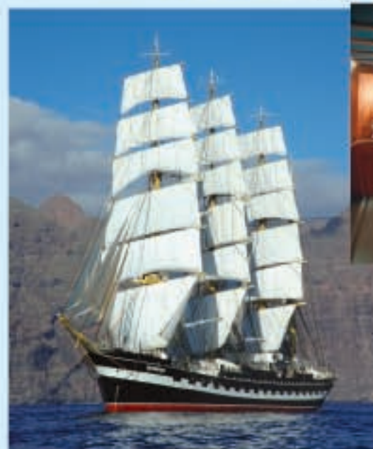
Барк «Круzenshtern» Участники презентации