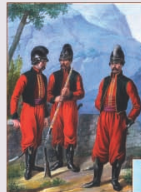
Унтер-офицер, рядовой и офицер 2-го батальона Греческого пехотного полка. 1779—1797 гг.