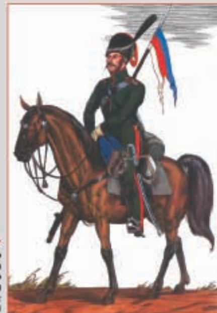
Ратник и казак Нижегородского ополчения Художник О.К. ПАРХАЕВ