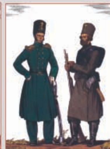
Обер-офицер и егерь Московского ополчения Художник О.К. ПАРХАЕВ