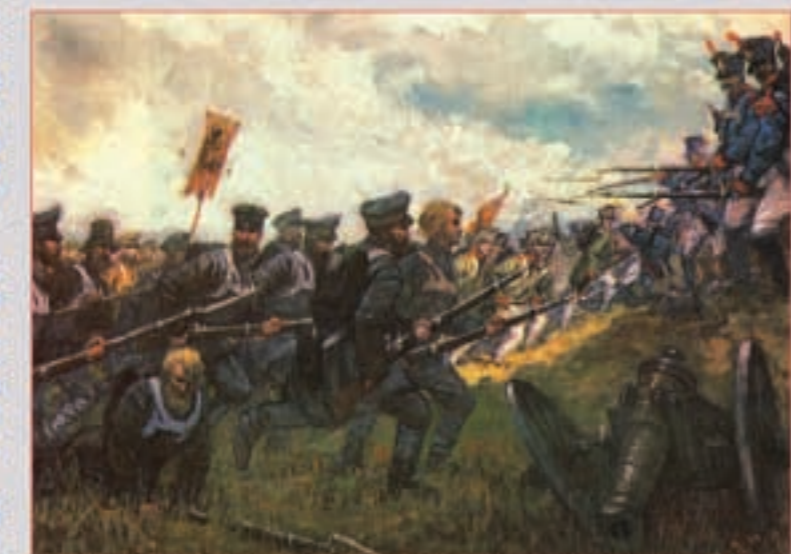
Взятие Полоцка Раскрасшенная гравюра И. БЕГГРОВА