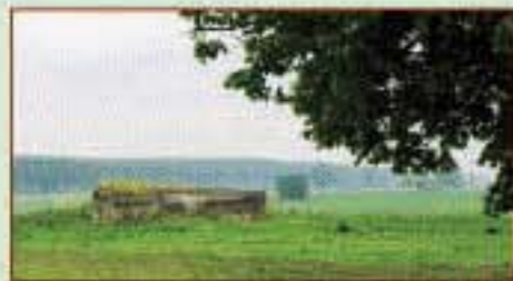
Немецкие доты Первой мировой войны. Гродненская область, Сморгонский район, деревня Ходоки (июль 2004 г.)

Публикацию подготовила Н.М. ВЕРЕТЕННИКОВА