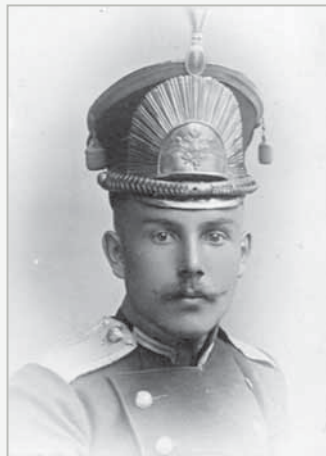
▲ Юнкер в кивере