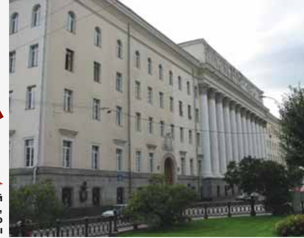
▲ Современный вид здания, реконструированного в 1940-е годы