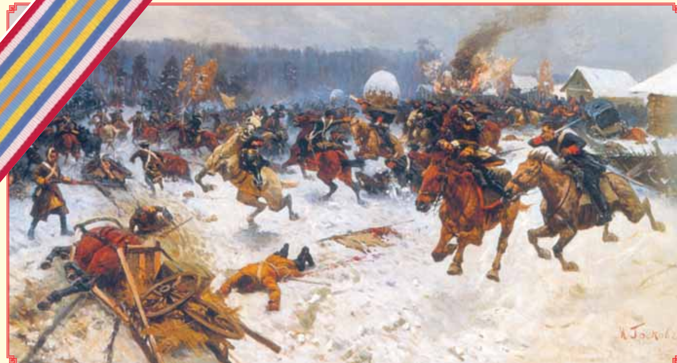
Атака шведов ярославскими драгунами у деревни Эрестфер 29 декабря 1701 г. Художник М.Б. ГРЕКОВ