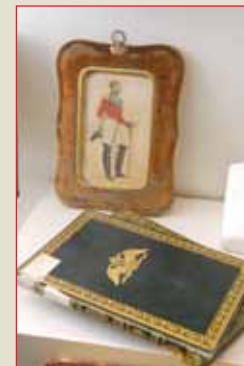
▲ Фрагменты экспозиций выставки