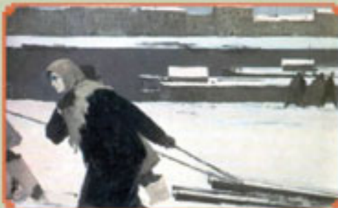
Ленинград Художник Б. УГАРОВ