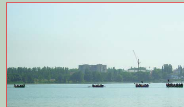
▲ Викинги переправляются с острова на «большую землю»