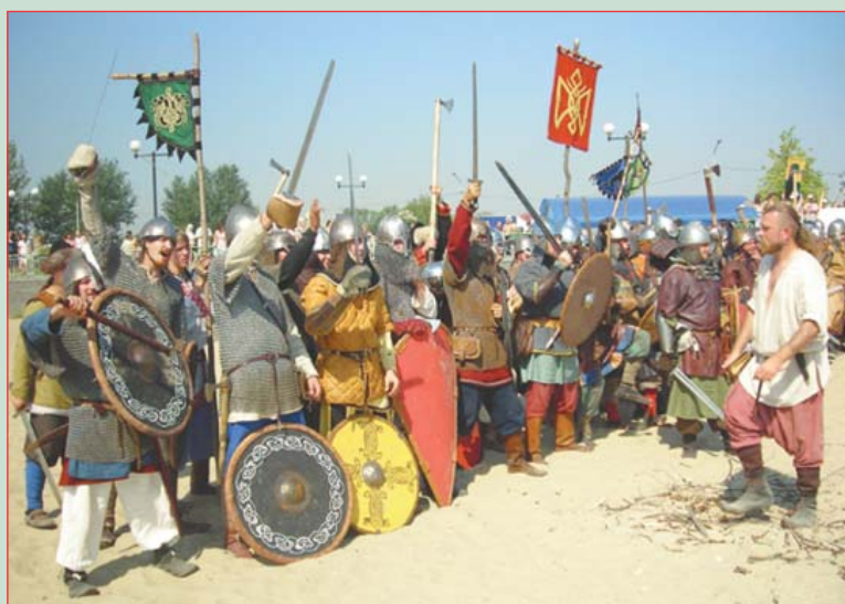
▲ Подготовка к «бою»