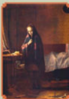
Из дневника блокады Художник П. БЕЛЮСОВ