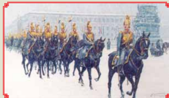
▲ 3-й эскадрон Конной гвардии под командой ротмистра барона Врангеля 1910-е гг.