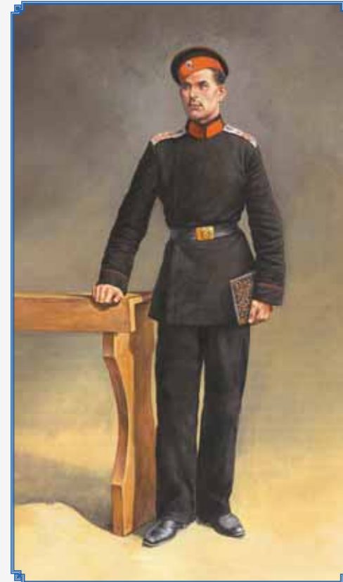
▲ Юнкер АВУ в вицмундире и длинных шароварах 1885 г.