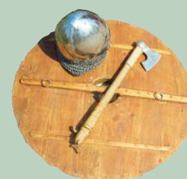
▲ В атаку!