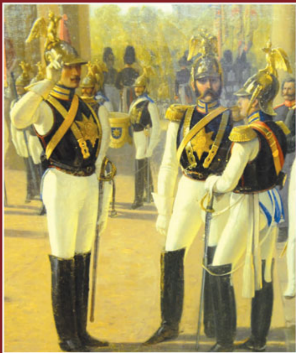
Взвод лейб-гвардии Конного полка перед Зимним дворцом Фрагмент картины художников А.И. ЛАДЖОРНЕРА, Е.Д. ТИДЕМАНА, 1855 г.

Русская военная эмиграция в Египте. 1920—1980-е годы 1884-0321-0828