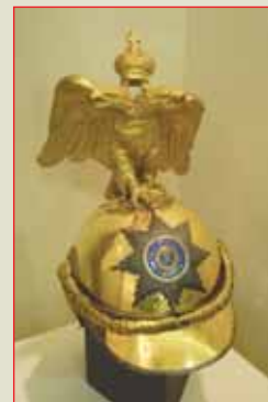
▲ Каска офицерская лейб-гвардии Конного полка образца 1878—1914 гг.