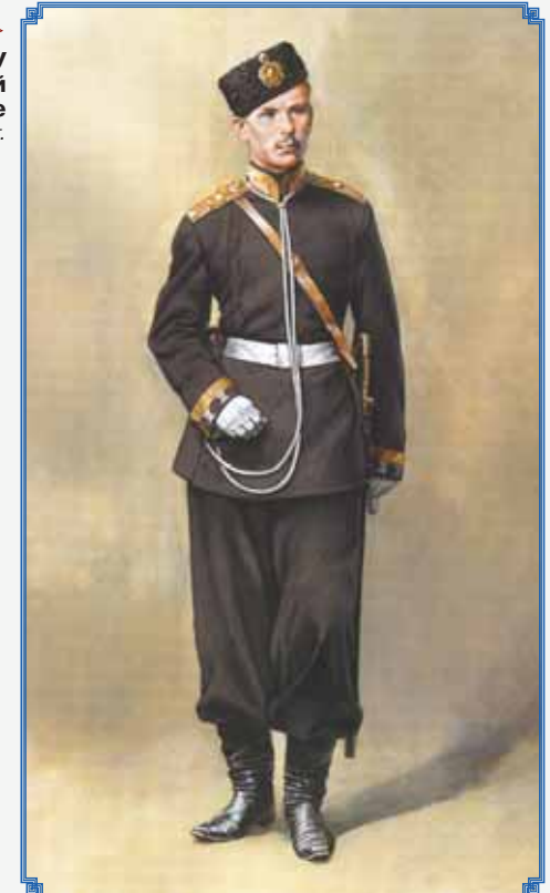
▲ Фельдфебель АВУ в парадной строевой форме 1885 г.