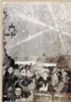
Салют 27 января 1944 г. Художник А.Ф. ПАХОМОВ, литография