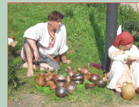
▲ Украшения и домашняя утварь, изготовленные участниками фестиваля