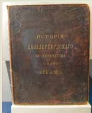
▲ История Кавалергардского её величества полка 1724—1851 гг.