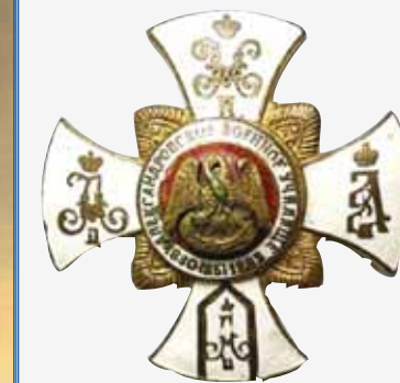
▲ Знак выпускника АВУ