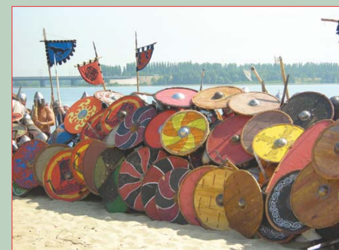
▲ Викинги готовы к отражению атаки русичей