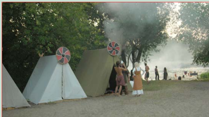
▲ Стоянка участников фестиваля