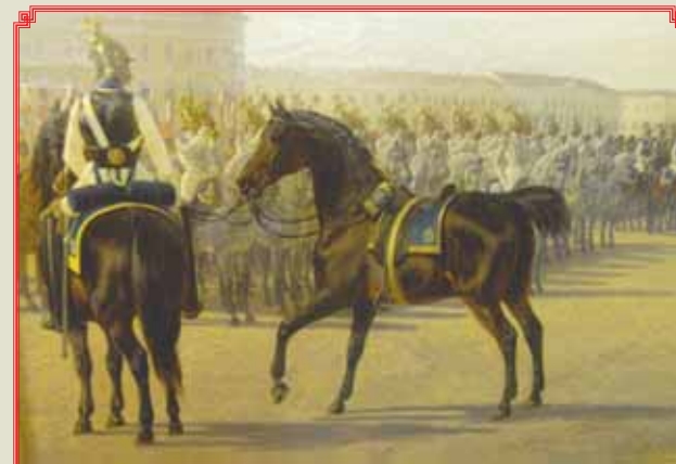
▲ Фрагменты картины «Взвод лейб-гвардии Конного полка перед Зимним дворцом» Художники А.И. ЛАДЮРNER, Е.Д. ТИДЕMAN 1855 г.