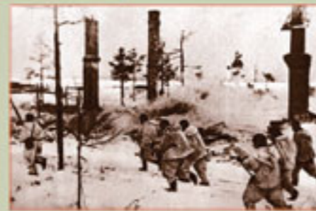
Наступление войск Волховского фронта Январь 1943 г.