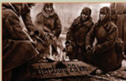
Красноармейцы у костра