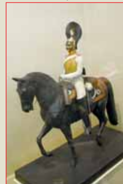
▲ Фигура унтер-офицера лейб-гвардии Конного полка времён Александра I Середина XIX в.