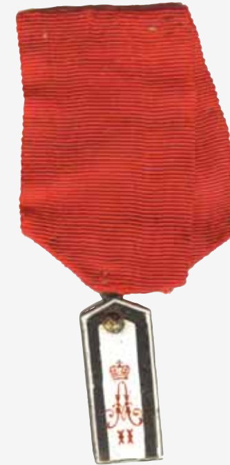
▲ Жетон АВУ