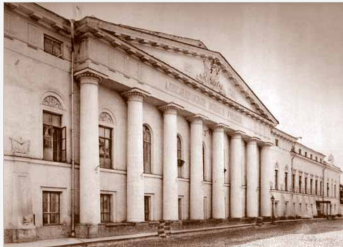
▲ Александровское военное училище (АВУ)