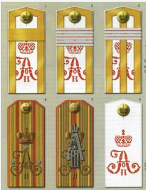
▲ Погоны военнослужащих Александровского военного училища