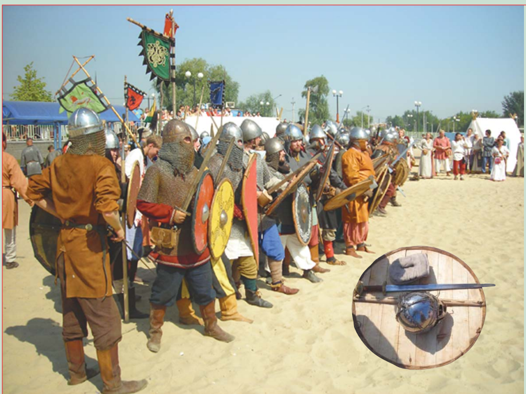
▲ Отряд русичей