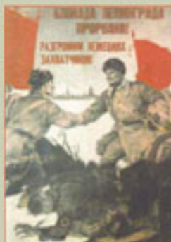
Блокада Ленинграда прорвана! Плакат