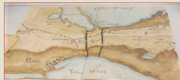
▲ Карта, иллюстрирующая военные действия во время Гражданской войны К лекциям на курсах генерала Н.Н. Головина