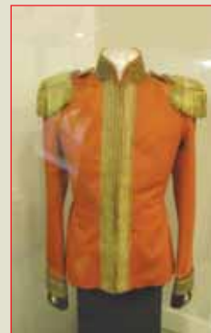
▲ Мундир офицера лейб-гвардии Конного полка