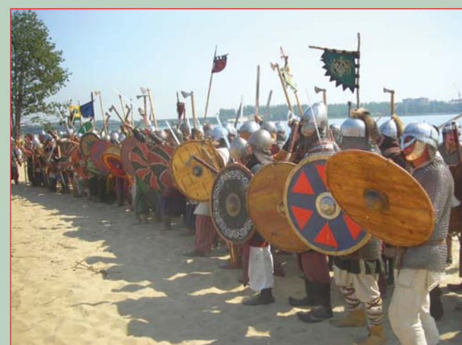
▲ Отряд викингов