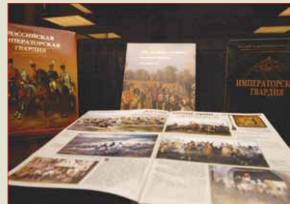
▲ Экспозиция выставки. На переднем плане — публикация «Военно-исторического журнала» о лейб-гвардии Конном полку в эпоху Наполеоновских войн (№ 9—2005 г.)