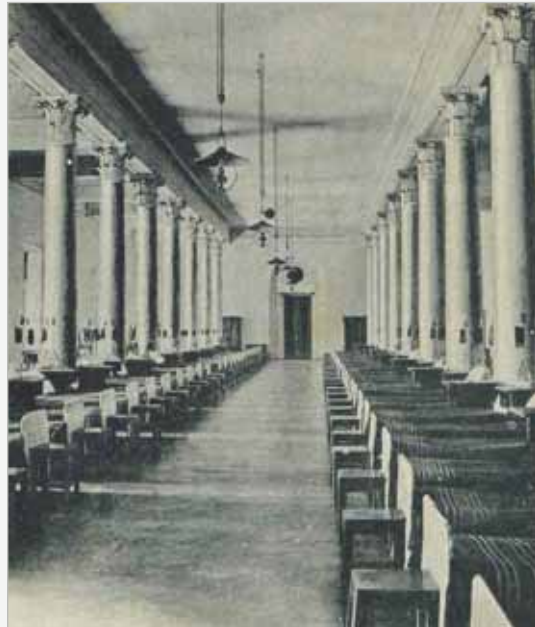
▲ Спальня 2-й роты АВУ

Здание, построенное Ф.И. Кампорези в формах раннего классицизма в 1792 году, принадлежало Апраксиным. В XIX веке перестраивалось, заняв целый квартал между Пречистенским (ныне Гоголевским) бульваром, улицей Знаменкой и Большим Знаменским переулком. В 1944—1946 гг. корпуса по Знаменке реконструировались М.В. Посохиним и А.А. Мндоянцем, соорудившими тяжёлый 12-колонный классицистический портик. Ныне здание на Знаменке, до недавнего времени ул. Фрунзе, известно в основном своим Кабинетом-музеем Г.К. Жукова. Об истории училища, его людях и традициях читайте в номере статью А.Ю. Бабурина «Александровское военное училище».