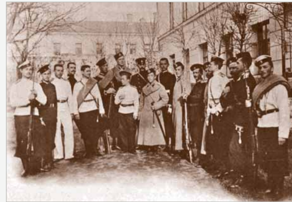
▲ Юнкера АВУ на плацу

А ЛЕКСАНДРОВСКОЕ военное училище — военно-учебное заведение для подготовки офицеров пехоты. Основано оно было в 1863 году. Училась в нем в основном дворянская молодёжь. Срок обучения — 2 года, с началом Первой мировой войны — 4 месяца. Этому военному учебному заведению, подготовившему для русской армии тысячи офицеров сегодня исполнилось бы 144 года. 54 из них училище функционировало в Москве, 13 — на чужбине, окончательно прекратив свою деятельность в 1932 году.