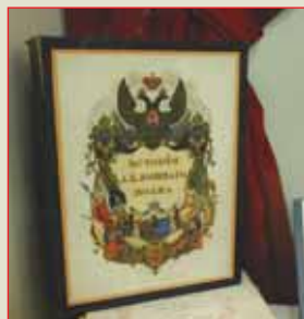
▲ История лейб-гвардии Конного полка

Слева направо: История лейб-гвардии Егерского полка. 1796—1896 гг., История 44-го Драгунского Нижегородского его императорского высочества государя наследника цесаревича полка, История гвардейской артиллерии