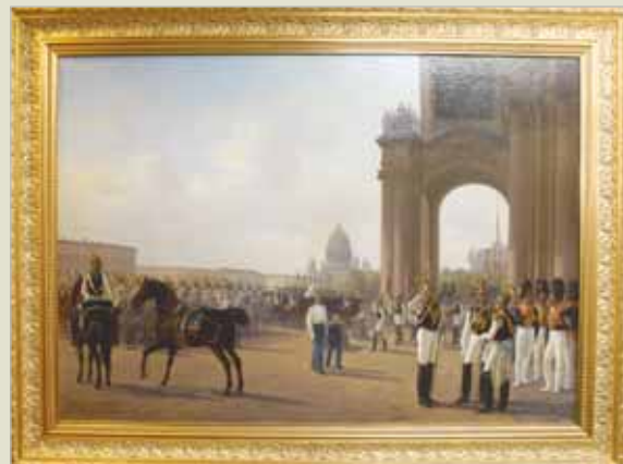
▲ Взвод лейб-гвардии Конного полка перед Зимним дворцом Художники А.И. ЛАДЮРNER, Е.Д. ТИДЕMAN 1855 г.