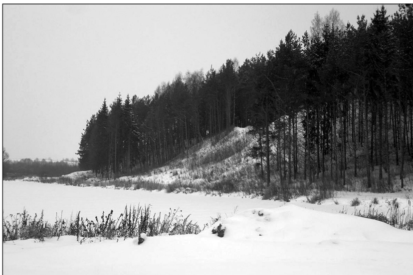
Остатки вала крепости Белая

Восстановив более-менее в 1620-е годы разрушенное хозяйство страны, Московия довела численность дворянского ополчения, стрельцов и городовых казаков до 93 тыс. человек. Помимо того сформировала несколько полков западного образца (солдатских, драгунских и рейтарских), набрав в них 9000 чужеземных наёмников. Оснащались они на средства,