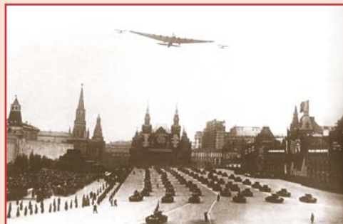
Начало парада в небе и на земле 1 мая 1935 г.