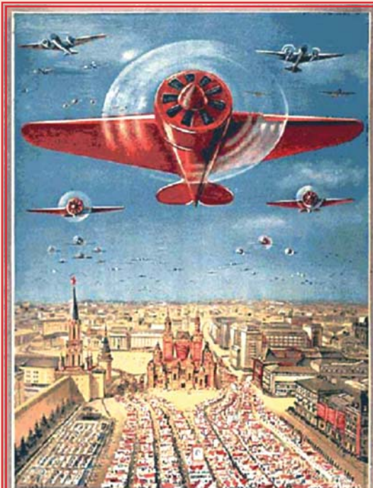
Плакаты с изображением «красной пятёрки»