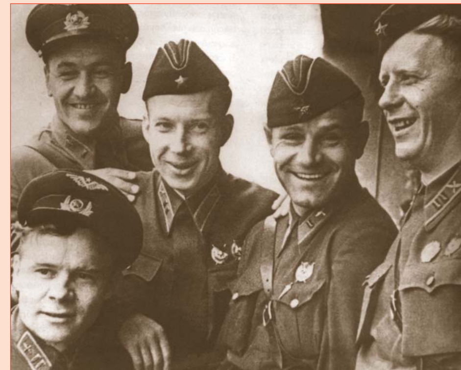
Лётчики-испытатели НИИ ВВС — участники показательного пилотажа «красной пятёрки»