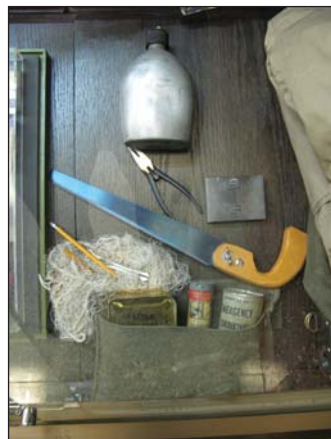
Личные вещи шпиона