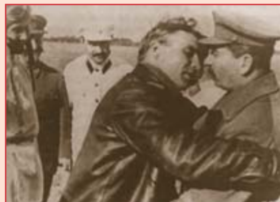
И.В. Сталин и В.П. Чкалов