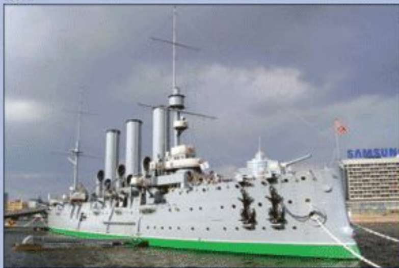
Крейсер «Аврора» у Петроградской набережной в Санкт-Петербурге