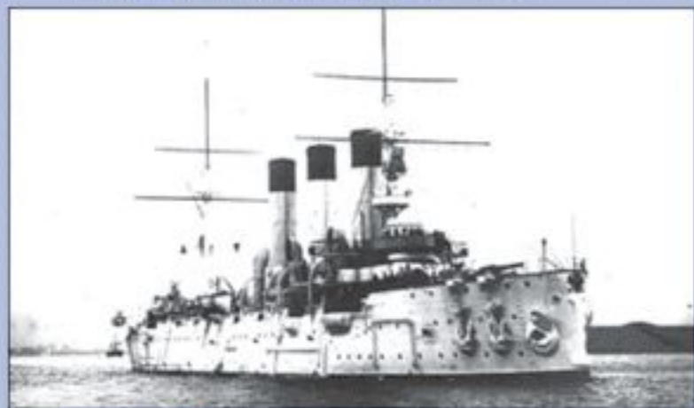
Крейсер «Аврора» 1904 г.