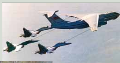
▲ Заправка самолётов в воздухе