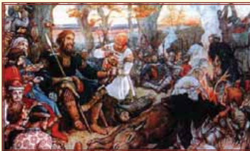
Отдых великого князя Владимира Мономаха после охоты Художник В. Васнецов, 1848 г.