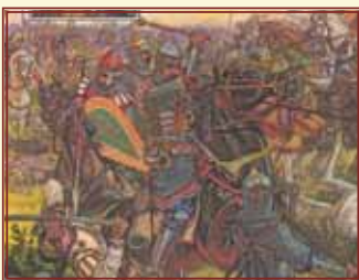
Битва русского войска с половцами