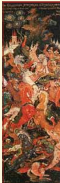
Битва Владимира Мономаха с половцами Лаковая миниатюра