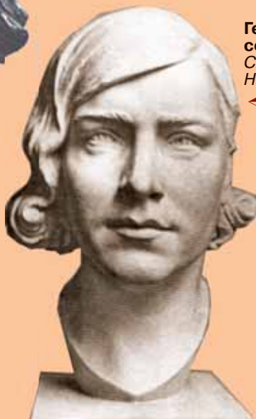
Зоя Космодемьянская Художник Л.Ф. Голованова