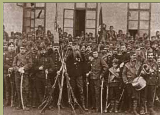
Народное войско 1876 г.