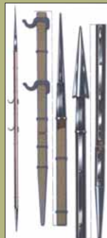
Пика пехотная образца 1807 г.