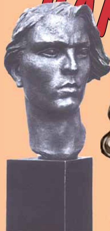
Партизанка Скульптор В.И. Мухина, 1942 г.