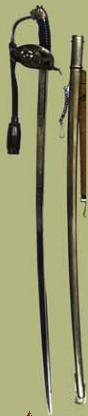
Сабля офицерская сухопутных войск образца 1920 г. Исторический музей Сербии, Белград