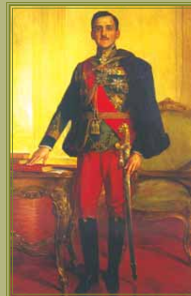
Король Александр I Карагеоргиевич с наградной саблей — подарком Герцеговины Художник П. Ионаннович. Исторический музей Сербии. Галерея Матицы сербской, г. Нови сад