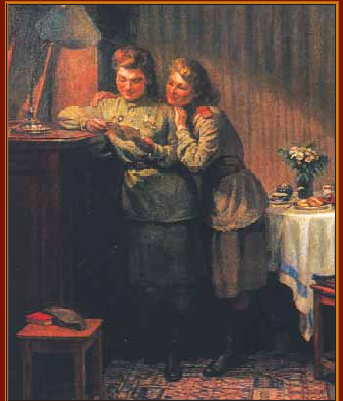
Боевые подруги Художник С.В. Рянгина, 1945 г.