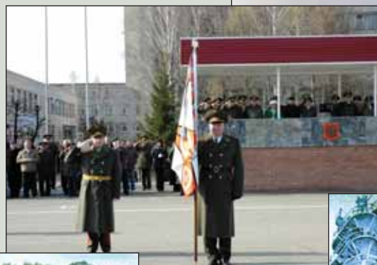
▲ Вручение нового знамени на 60-летнем юбилее УВВТУ