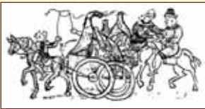
Половцы Миниатюра из Радзивилловской летописи. Начало XIII в.