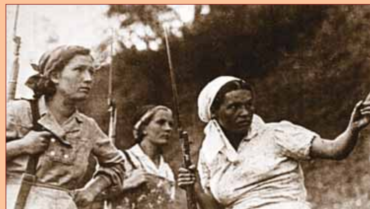
Девушки-партизанки на боевом задании Август 1941 г.

Находясь в партизанских отрядах, девушки принимали самое непосредственное участие в изгнании оккупантов с советской земли, в боевой обстановке проявляли героизм и бесстрашие, нередко шли на смерть ради спасения Родины. И в том, что Великая Победа пришла к нам, — немалая заслуга женщин, таких как Зоя Космодемьянская, Лиза Чайкина и многих других, кто плечом к плечу с мужчинами отстоял свободу и независимость нашей Отчизны.