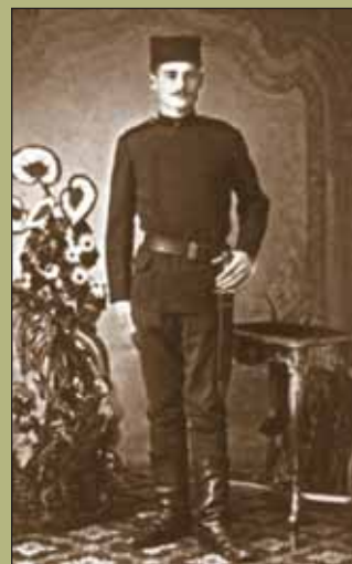
Рядовой артиллерии Активного войска. Вооружён тесаком образца 1897 г. 1900 г.