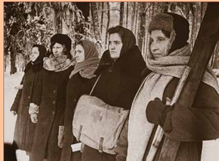
Женщины-партизанки в оккупированном районе Подмосковья Фото М. Бачурина, 1941 г.