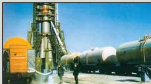
▲ Заправка ракеты