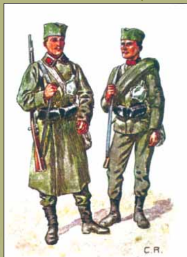
Виды обмундирования Сербской армии 1911 г.