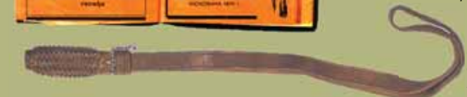
Солдатский темляк образца 1895 г. Исторический музей Сербии, Белград