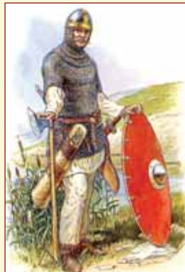
Русский пеший ратник X в.

Весть о походе русских войск в степь и их победе распространилась в Византии, Венгрии, Польше, Чехии и достигла Рима.