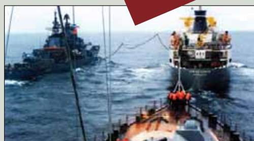
▲ Заправка боевых кораблей в открытом море