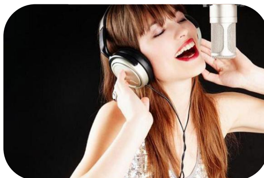
Запись и монтаж ролика