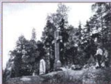
Монобюст перед памятником морскому сражению под Гангутом