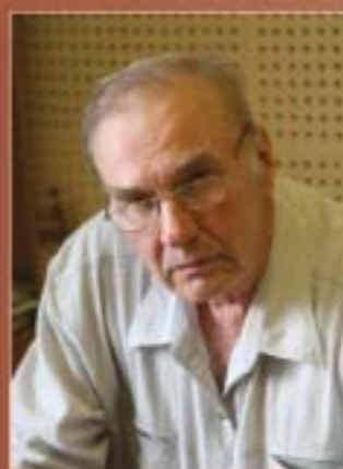
Ведущий научный редактор А.В. Островский