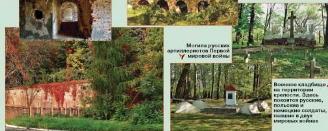
Могила русских артиллеристов Первой мировой войны