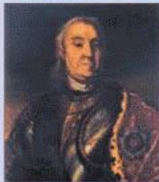
Генерал-адмирал Ф.М. Апраксин. Портрет известного художника

Публикацию подготовила И.М. ВЕРЕТЕННИКОВА