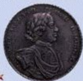
Серебряная медаль за победу при Гангуте