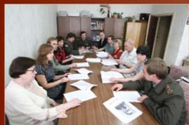
На редакционной летучке

Вот и настал этот день – юбилейный день выхода в свет первого номера нашего с вами, уважаемые читатели, замечательного «Военно-исторического журнала». Семьдесят лет. Возраст серьёзный. Как и серьёзны те задачи, которые приходилось и приходится решать изданию на протяжении многих десятилетий. Мы не будем сегодня описывать историю журнала. Она была подробно изложена пять лет назад в юбилейном июльском номере ВИЖа за 2004 год. Отметим лишь основные вехи.