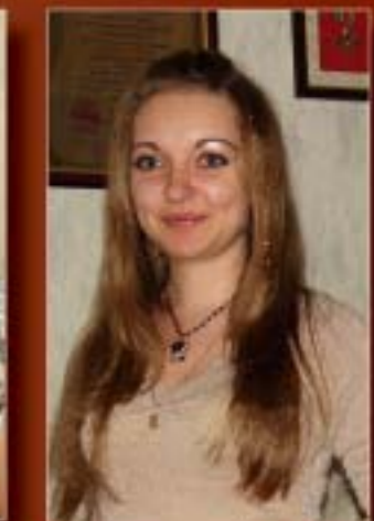
Художественный редактор И.В. Недостова