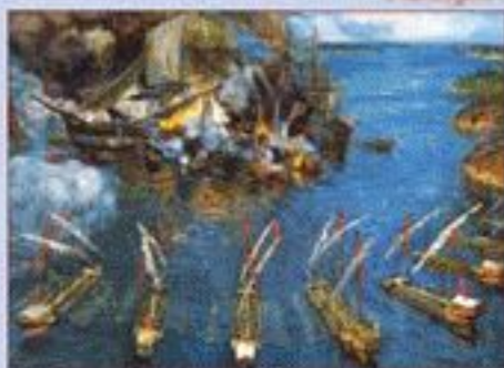
Гангутское сражение. А. Художник В.М. Сибирский, 1906 г.

215-летие Гангутского сражения 6 – 7 августа 1714 года между русскими и шведскими флотами в ходе Северной войны у полуострова Гангут (Шанто)