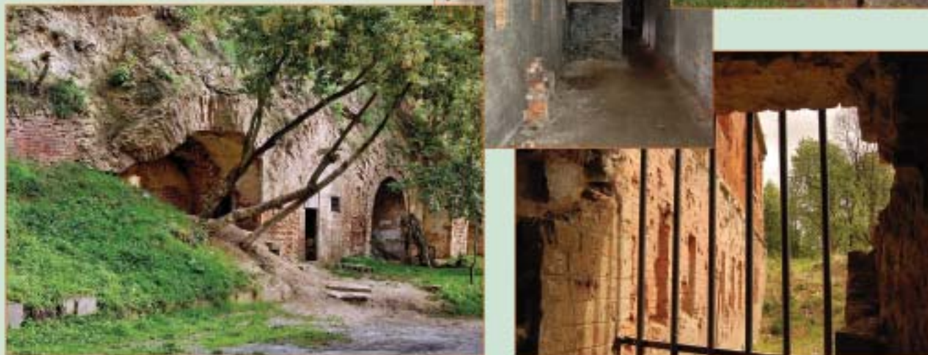
Крепость Модлин (Новогеоргиевск)