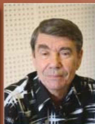
Ведущий научный редактор В.Г. Оплюков