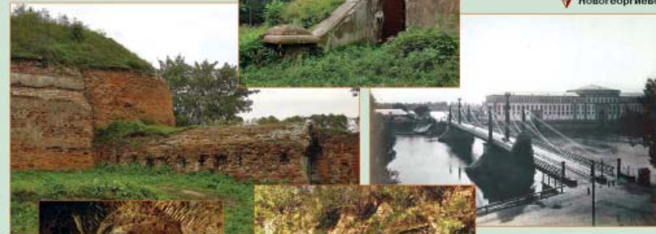
Проволочный мост в крепости Новогеоргиевск