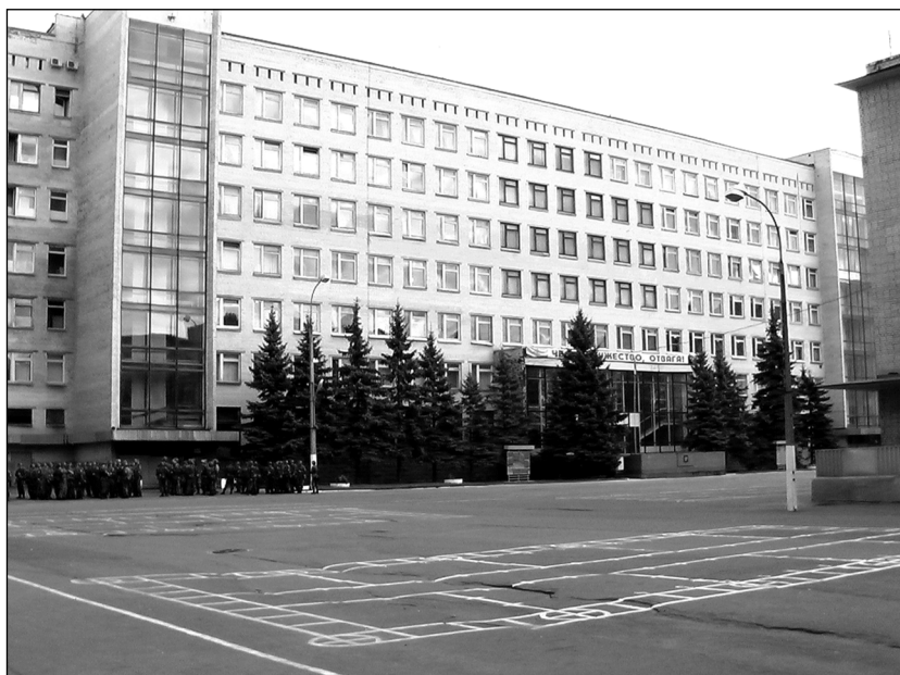
Основное здание училища 1977 г.