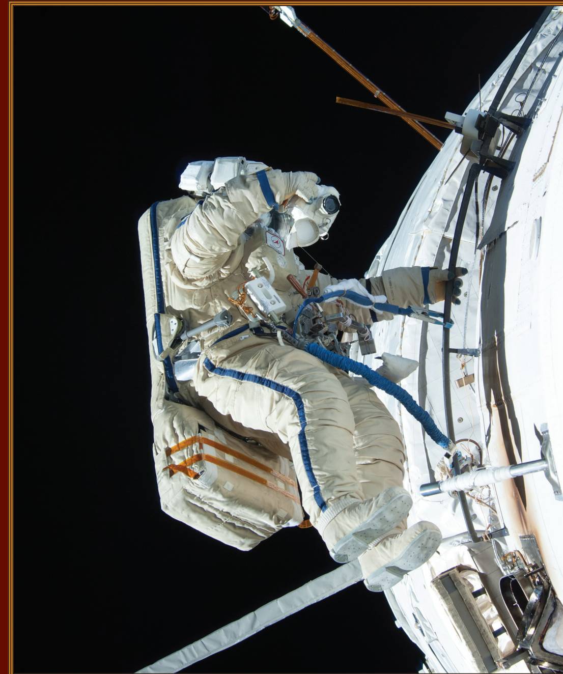
Герой Российской Федерации лётчик-космонавт А.А. Мисуркин в открытом космосе 531-й космонавт мира. Совершил космический полёт на транспортном пилотируемом корабле «Союз ТМА-08М» в марте—сентябре 2013 года к Международной космической станции. Участник основных экспедиций МКС-35/МКС-36. Совершил три выхода в открытый космос

Военно-исторический журнал 2017 № 4 апрель