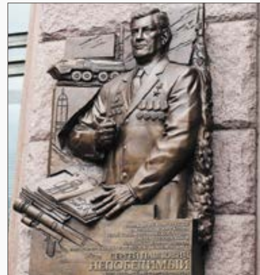
Мемориальная доска на Котельнической набережной в Москве