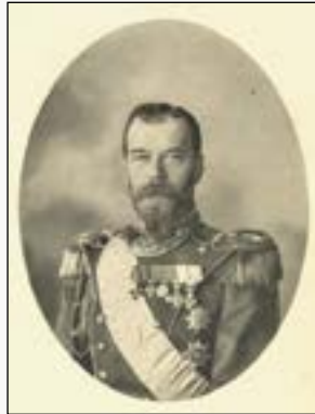
Николай II принял звание почётного председателя РВИО, даровав ему право именоваться Императорским