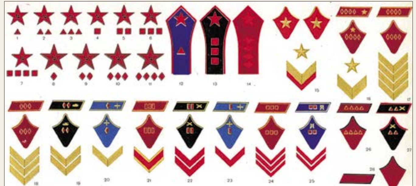
Нарукавные знаки различия командного состава РККА, введённые 16 января 1919: 1. Отделённый командир, 2. Помощник командира взвода, 3. Старшина, 4. Командир взвода, 5. Командир роты, 6. Командир батальона, 7. Командир полка, 8. Командир бригады, 9. Начальник дивизии, 10. Командующий армией, 11. Командующий фронтом. Нарукавные знаки различия командного состава РККА, введённые 31 января 1922 (цвет поля кантана — по роду войск): 12. Командир отделения (кавалерия), 13. Командир батальона (дивизиона артиллерии), 14. Командующий фронтом. Остальные нарукавные знаки различия на кант аналогичны знакам, показанным на рис. 7—5, 7—10. Петлицы и нарукавные знаки различия военнослужащих РККА, введённые 3 декабря 1935 (цвет поля петлиц и канта — по роду войск): 15. Маршал Советского Союза, 16. Командарм 1 ранга, 17. Командарм 2 ранга, 18. Комкор (пехота), 19. Комдив (автомобригадирские войска), 20. Комбриг (ВВС), 21. Полковник, с 1939 — подполковник (пехота), 22. Майор (артиллерия), 23. Капитан (ВВС), 24. Старший лейтенант (пехота), 25. Лейтенант (кавалерия), 26. Старшина (пехота), 27. Отделённый командир (артиллерия), 28. Красноармеец (пехота).