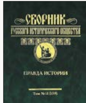
Современные переиздания книг ИРВИО