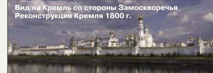
Вид на Кремль со стороны Замоскворечья Реконструкция Кремля 1800 г.

При реставрации стен и башен в 1947 году к празднованию 800-летия Москвы Кремль окончательно приобрёл свой натуральный кирпичный цвет.