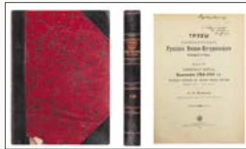
Дореволюционные издания ИРВИО