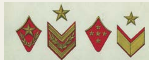
Маршал Советского Союза Генерал армии