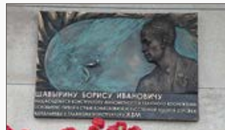
Мемориальная доска на спортивном комплексе в Коломне