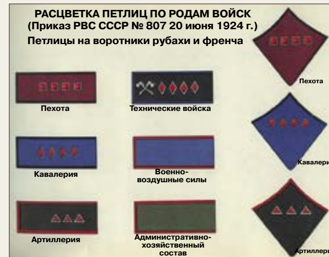
Расцветка по родам войск (Приказ РВС № 807 20 июня 1924 г.)

Лейтенант — командир взвода конной разведки 22-го эстонского территориального корпуса РККА. Северо-Западный фронт, июнь 1941 г. На нём мундир для кавалерии образца 1936 г., красные галифе и кавалерийские сапоги, принятые для ношения в эстонской кавалерии. Сабля эстонская образца 1925 г. Фуражка общевойсковая образца 1936 г. Знаки различия — советского образца Из кн.: Мощанский И.Б. Оружие Сталина. Провалы и успехи летне-осенней кампании 1941 года. М.: Кучково поле, 2013. 100 с., ил.