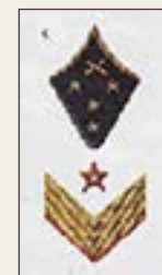
Знаки различия командного состава 1 — Маршал Советского Союза; 2 — генерал армии; 3 — генерал-полковник (артиллерия); 4 — генерал-лейтенант (пехота); 5 — генерал-майор (авиация)