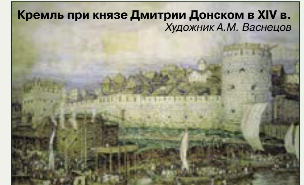
Кремль при князе Дмитрие Донском в XIV в. Художник А.М. Васнецов