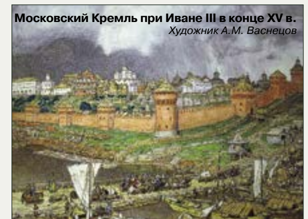
Московский Кремль при Иване III в конце XV в. Художник А.М. Васнецов