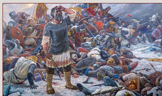
«Доколе, Господи?» (Ледовое побоище) Художник С.С. Рубцов, 1990—1994 гг. Государственный музей художественной культуры Новгородской земли

5 апреля 1242 года на льду Чудского озера произошла одна из самых известных битв в истории Руси — Ледовое побоище. Русские понесли серьёзные потери от главной атаки противника по центру, но затем нанесли сокрушительные удары конницей с флангов и тыла, что принесло победу, которая имела большое значение для истории Руси.