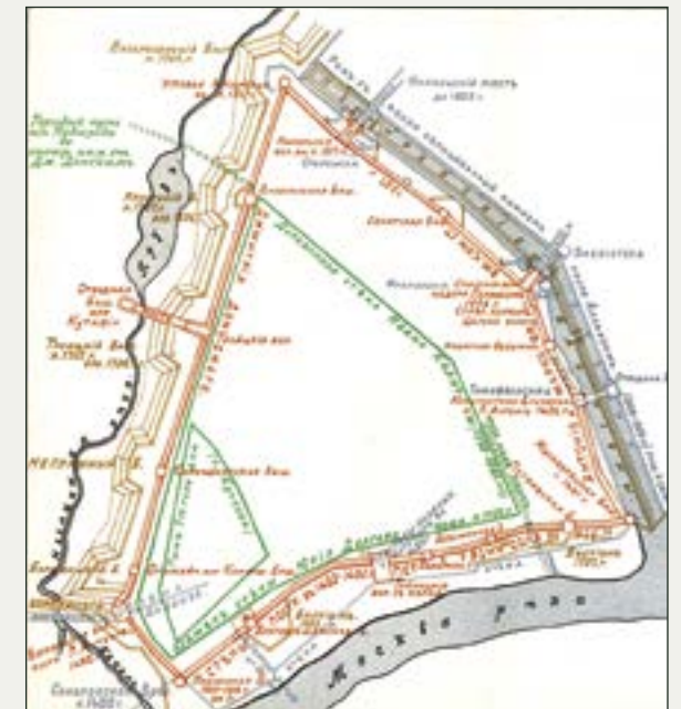
Развитие Кремля к 1913 г. Схема из Военной энциклопедии И.Д. Сытина