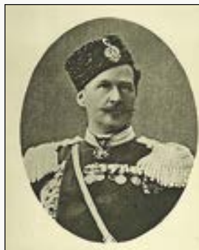
Генерал-майор Д.А. Скалон Фото 1859 г.