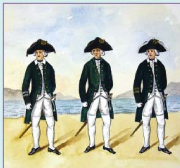
Флота штаб- и обер-офицер 2-й дивизии 1-й эскадры, штурманский офицер 3-й дивизии 2-й эскадры, флагман 1-й дивизии. 1796 г. Вторая половина XIX в.