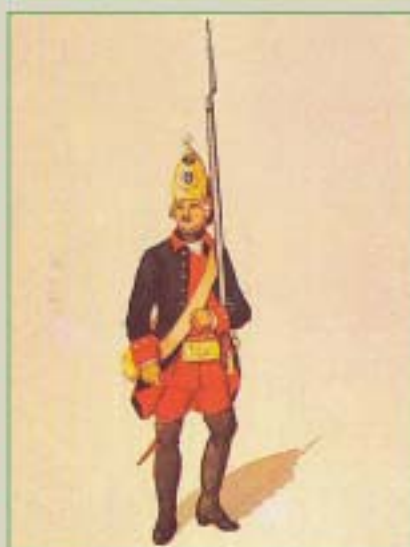
Гренадер пехотного полка ▲ 1756-1761 гг.