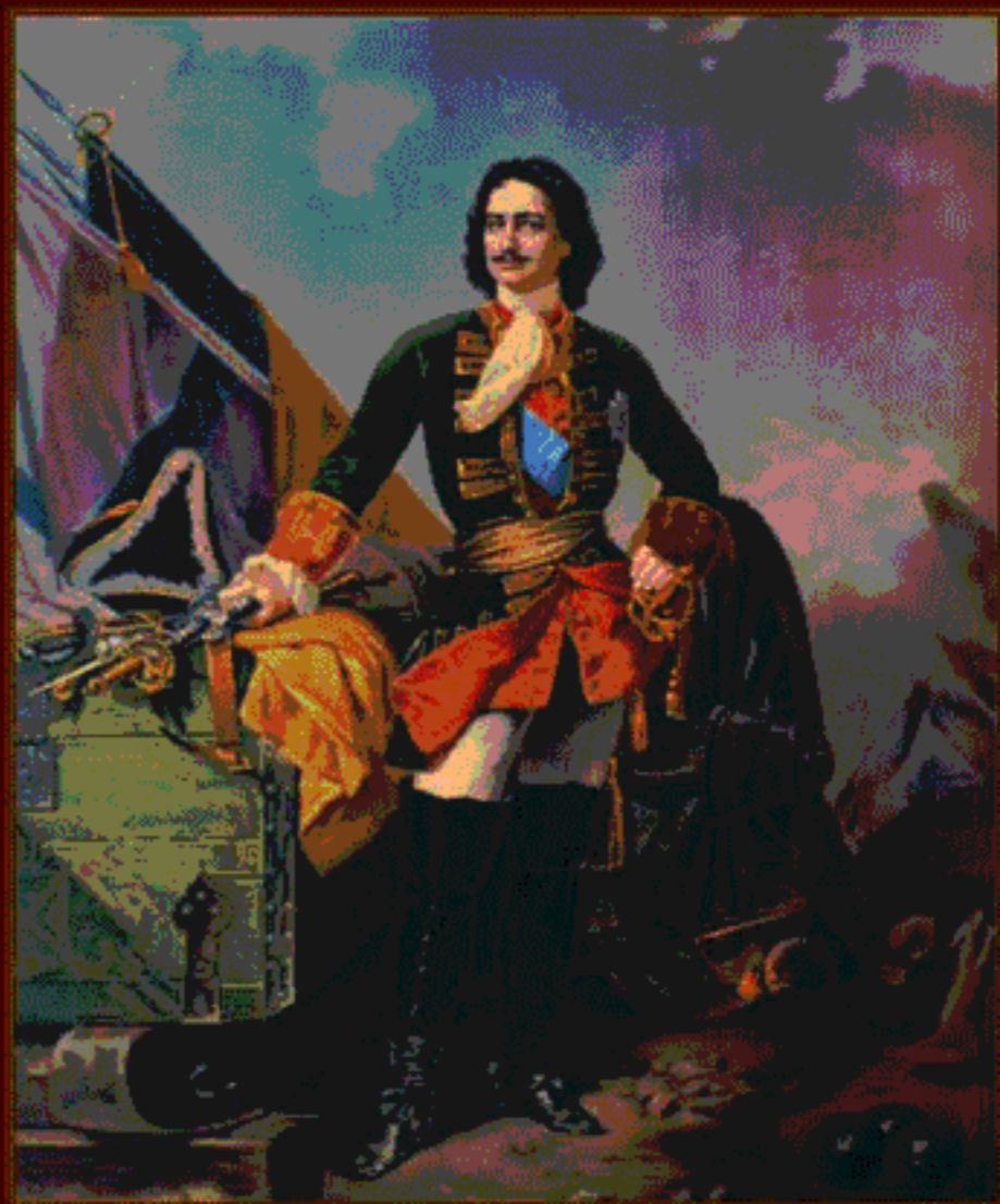
Петр Великий Художник М.Д. Дмитриев-Оренбургский. XIX в.

10 июля – День победы русской армии под командованием Петра I над шведами в Полтавском сражении 1709 года. День воинской славы России