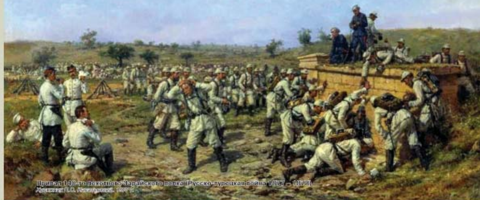
Полк 140-го пехотного Зарайского полка (Русско-турецкая война 1877 – 1878) Художник Н.А. Шенников. 1907 г.