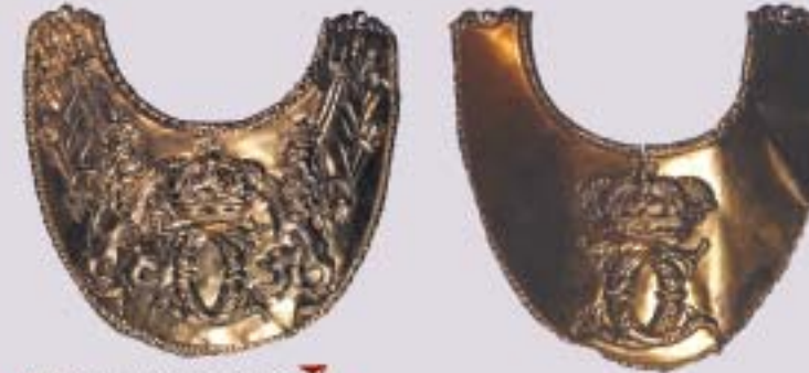
Шведские шейные офицерские знаки с вензелем короля Карла XII Швеция. Конец XVII – начало XVIII вв.