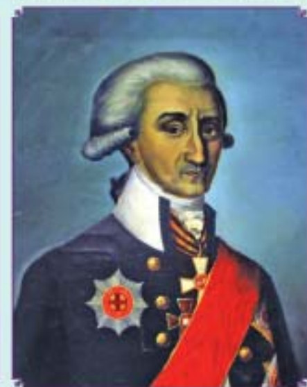
Вице-адмирал И.А. Поваляшин. 1739 – 1799 гг. Портрет Неизвестный художник. Первая половина XIX в.