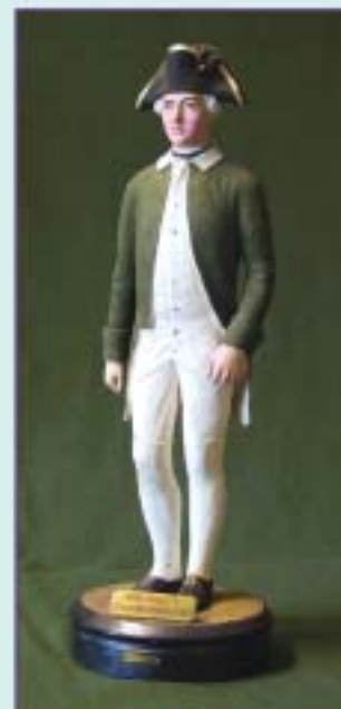
Офицер 2-й флотской дивизии. 1796 г. Конец XIX в.

В короткий, но яркий период царствования Павла I форма одежды российского флота, как и многое в государстве, была вновь изменена. Пожалованный в малолетстве в генерал-адмиралы Павел ещё до вступления на престол был знаком с порядком и организацией флотской службы. Первые его повеления направлены на экономию средств: в ноябре 1796 года были отменены шитые золотом парадные мундиры, и приказано «быть всем навсегда в вице-мундирах». Вскоре, 17 ноября того же года, для адмиралов и офицеров были установлены тёмно-зелёные мундиры с белыми воротниками, камзолами и штанами. Согласно новым образцам покрой кафтанов стал уже, а камзолы короче. Адмиралам полагались шляпы с белым плюмажем, а офицерам – с золотым галуном по краям. На левом поле шляпы располагалась кокарда в виде банта из чёрной ленты с оранжевой каймой. Разделение флота на три дивизии, каждая по три эскадры, нашло отражение в мундире. На клапанах обшлагов полагались особые нашивки: в 1-й дивизии – золотые,