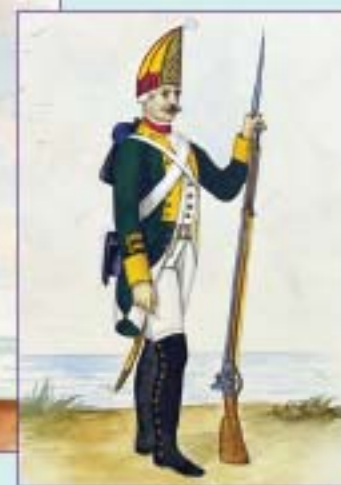
Рядовой грендерской роты 3-го флотского батальона. 1798 г. Вторая половина XIX в.