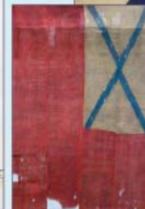
Флаг третьего адмирала русского флота XVIII в.