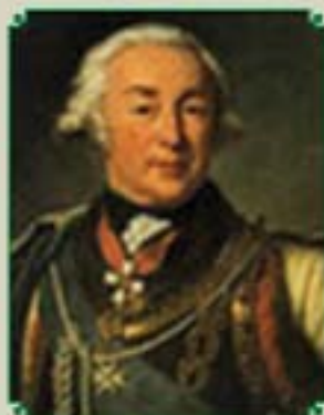
П.С. Салтыков ▲

Поражение корпуса Веделя в Пальцигском сражении резко ухудшило положение главных сил прусской армии, открыв путь для совместного наступления русской и австрийской армий на Берлин.