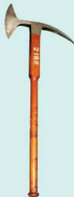
Топор абордажный (интрепель) Россия. Вторая половина XVIII в.