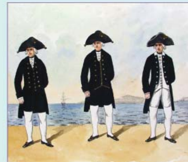
Медик обер-офицерского ранга, адмиралтейский мастер штаб-офицерского ранга, офицер Адмиралтейств-коллегии. 1796 г. Вторая половина XIX в.

формы одежды, на что раньше, по свидетельству современников, обращали мало внимания.