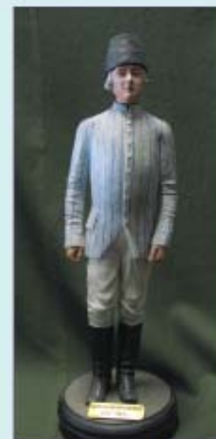
Матрос в тиковом бастроге. 1764 – 1802 гг. Конец XIX в.