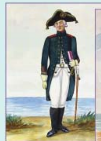
Младший артиллерийский унтер-офицер. 1798 г. Вторая половина XIX в.