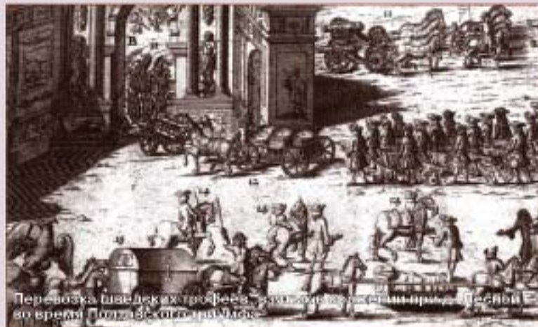
Перевозка шведских трофеев, захваченных в сражении. Первая четверть XVIII в.