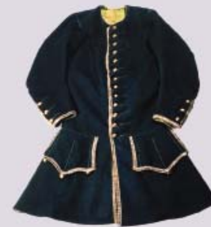
Артиллерия в Полтавском сражении Художник А.Н. Самойлов. 1906 г.