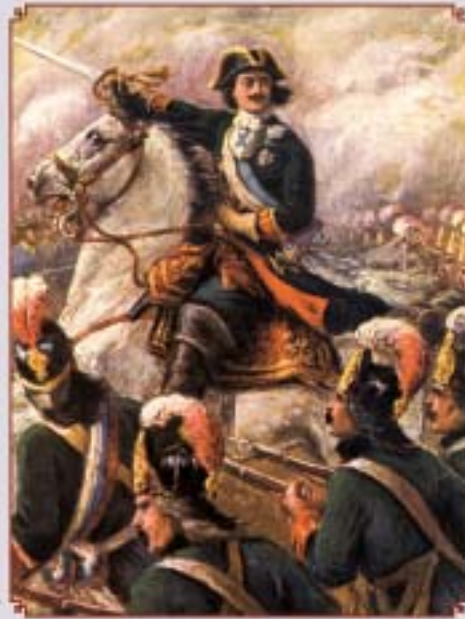
Пётр Великий в Полтавском сражении Художник П.Д. Шитов. 1909 г.