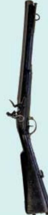
Мушкетон флотский. 1789 г. Россия. Конец XVIII – начало XIX в.