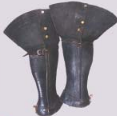
Краги, которые были на Петре I во время Полтавского сражения 27 июня 1709 г. Россия. Начало XVIII в.