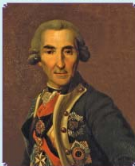
Адмирал И.Л. Голенищев-Кутузов. 1729 – 1802 гг. Художник А.Х. Фомин. 1624 г.