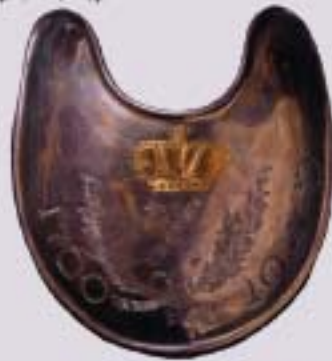
Знак шейный офицерский серебряный. Возможно принадлежал Петру I и был на нём в Полтавском сражении