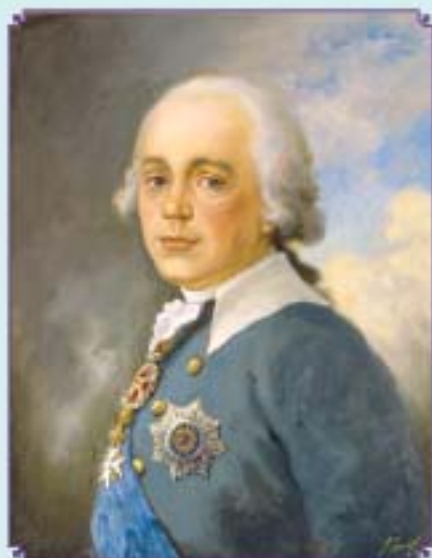
Император Павел I. 1754 – 1801 гг. Портрет Художник С. В. Пен. 1988 г.