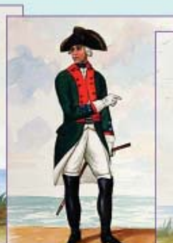
Офицер 2-го артиллерийского батальона. 1796 г. Вторая половина XIX в.