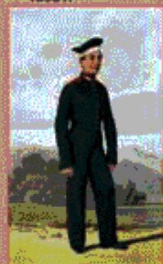
Канонист лейб-гвардии Измайловского полка. 1858 г.

Публикации подготовила И.М. ВЕРЕТЕННИКОВА