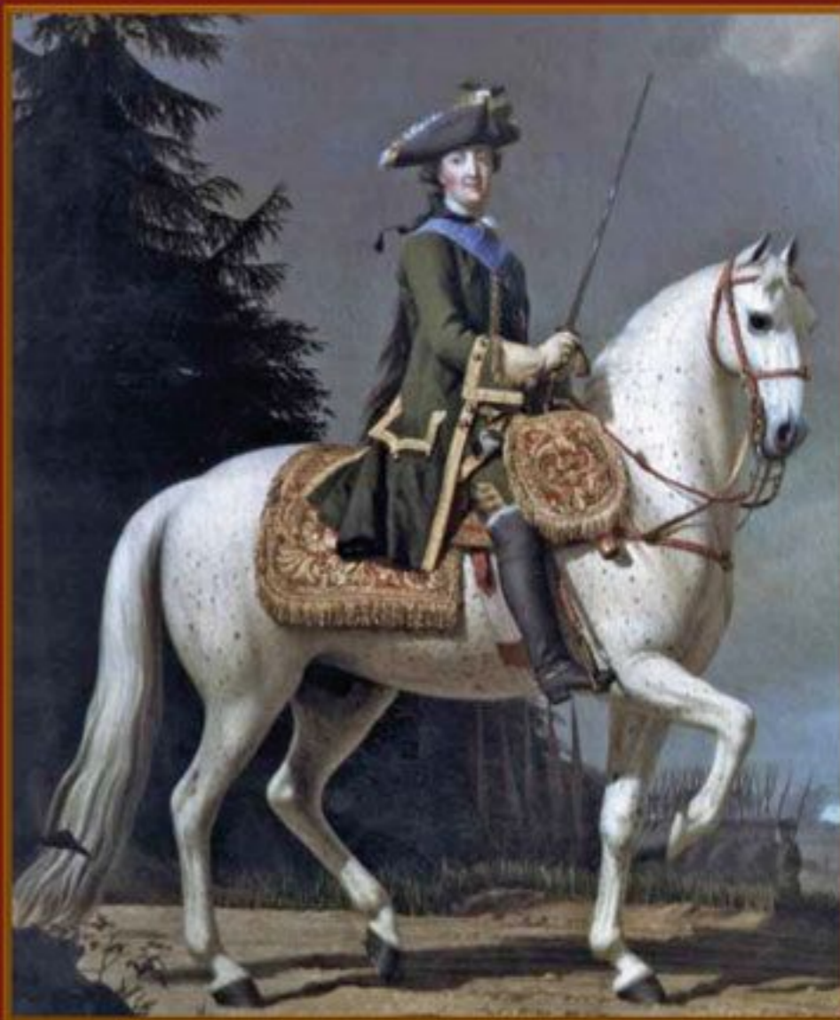
Екатерина II Алексеевна Художник В. Эрикссон, 1762 г. Государственный Русский музей

Военно-исторический журнал 2010 № 7 июль