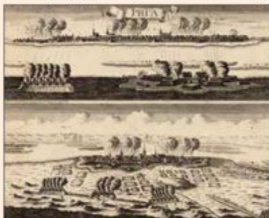
▼ Вид и план осады Риги 14 июля 1710 года