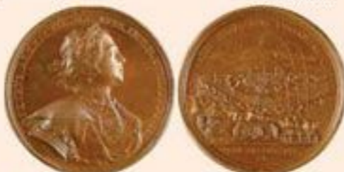
▲ В честь взятия Риги была выбита специальная медаль