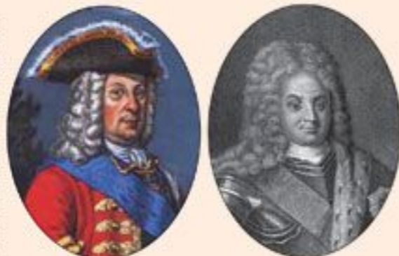
▲ Б.П. Шереметев

Шереметев назначил новым генерал-губернатором А.И. Репнина. Вскоре на Ратушной площади прошла торжественная церемония принесения присяги на верность России и её государю Петру I.