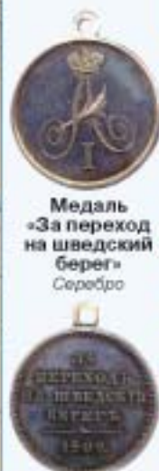
Медаль «За переход на шведский берег» Серебро

В ХОДЕ Русско-шведской войны 1808 – 1809 гг. русским командованием намечалось в 1809 году перенести боевые действия на территорию Швеции, овладеть Стокгольмом и уничтожить шведский флот.