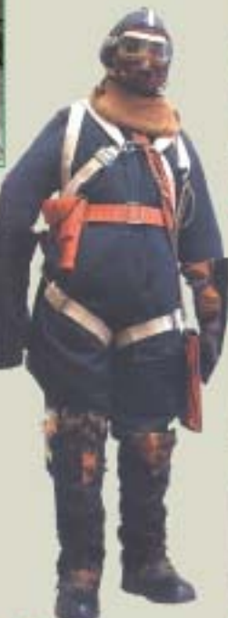
Зимняя форма одежды лётчика. 1941 – 1945 гг.