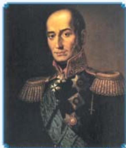
М.Б. Барклай-де-Толли Художник Джордж Дой, 1829 г.

К 200-летию героических переходов русских войск по льду Ботнического залива на территорию Швеции 10 – 19 марта 1809 года