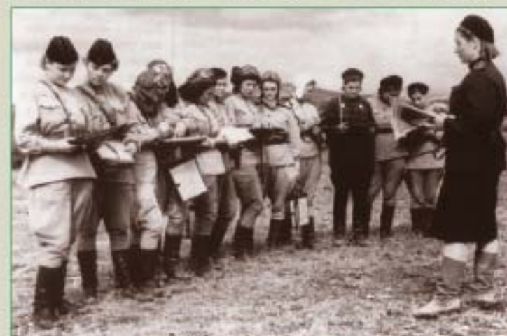
Постановка задачи. 46-й гв. ибап. 1943 г.