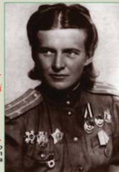
Командир 46-го гв. ибап Е.К. Бершанская