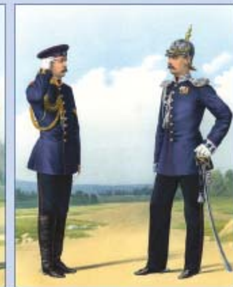
Лейб-гвардии Жандармский полуэскадрон. 1874 г.