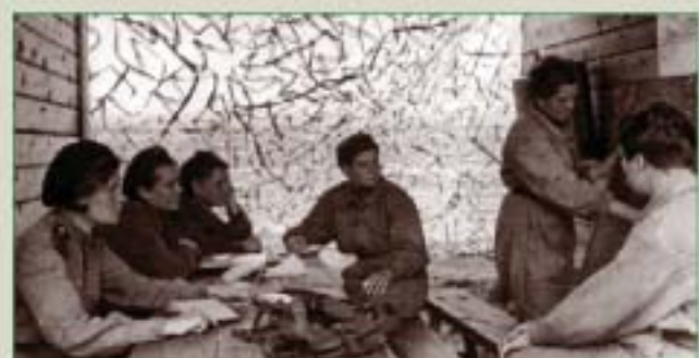
Эскадрилья на занятиях по тактике воздушного боя

Публикацию подготовила Н.М. ВЕРЕТЕННИКОВА