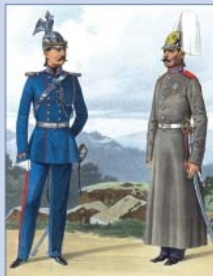
Обер-офицер лейб-гвардии Жандармского полуэскадрона и рядовой Жандармского полка в парадной форме. 1857 г.