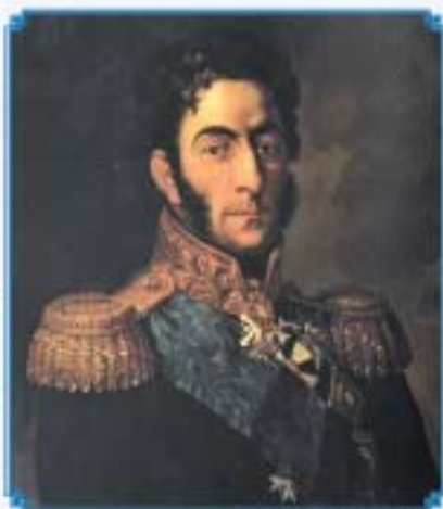
П.И. Багратион Копия с портрета художника Джорджа Дой, конец XIX в.