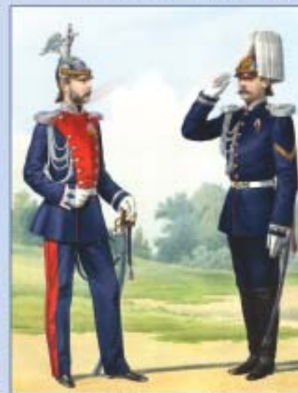
Лейб-гвардии Жандармский полуэскадрон и жандармский командир при военном округе в праздничной форме. 1874 г.