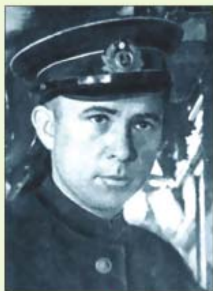
▲ А.И. Маринеско фото, вероятно, 1944 года