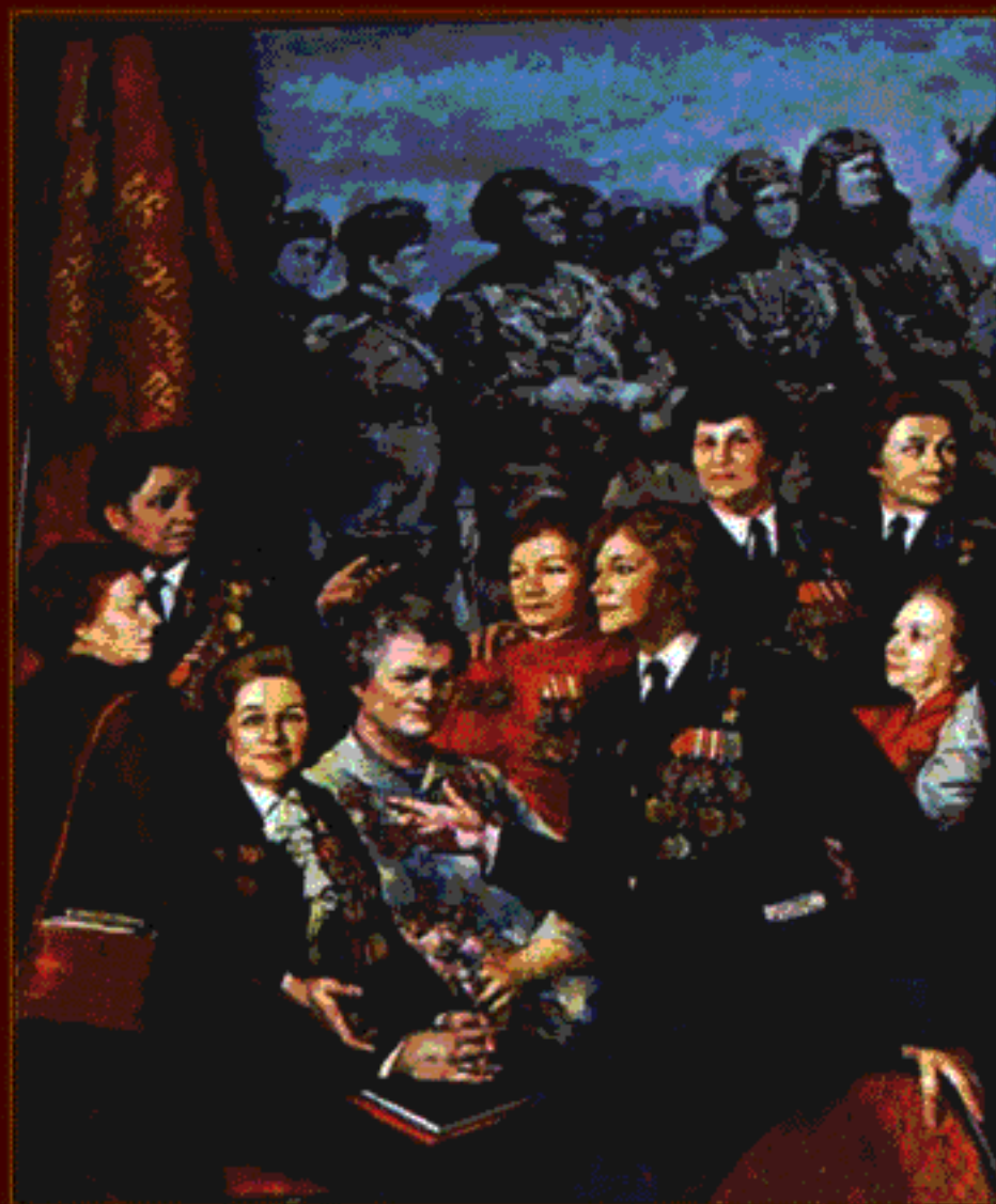
40 лет спустя. Встреча ветеранов 46-го женского авиалюка Художник С. Бочаров Из коллекции Центрального дома авиации и космонавтики РОСТО (Москва)