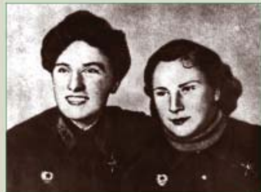
Лётчики-истребители Екатерина Буданова и Лилия Литвяк