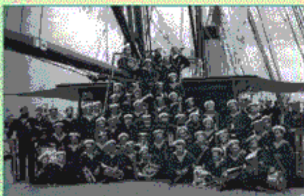
1893 г. Духовой оркестр на императорской яхте «Поларная звезда»

18 апреля 1860 года Александр II утвердил новые штаты военно-морских оркестров для портов (военно-морских баз): для портов 1-го разряда (Кронштадт, Архангельск, Николаевск-на-Амуре) — 50 музыкантов, для портов 2-го разряда (Севастополь, Ревель, Севастополь) — 25 музыкантов. В том же году были утверждены штаты военно-морских оркестров флагманских кораблей.