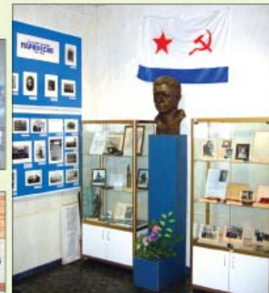
▲ Экспозиция, посвященная А.И. Маринеско