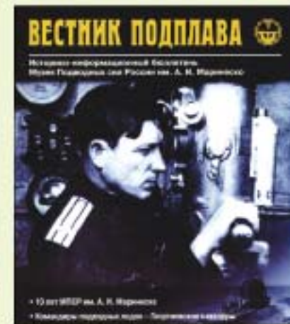
▲ Бюллетень «Вестник подплава»