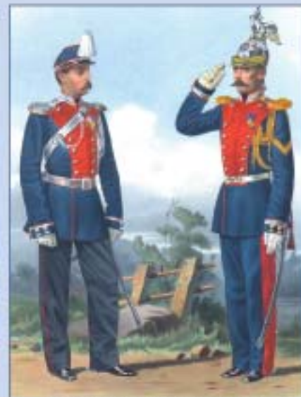
Обер-офицер и унтер-офицер лейб-гвардии Жандармского полуэскадрона в парадной, походной и городской форме. 1867 г.