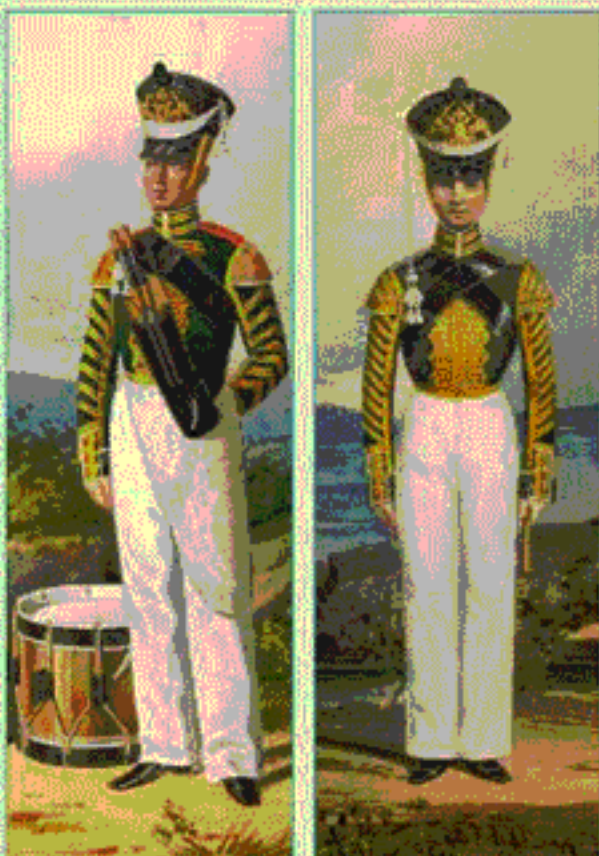
Барабанщик Гвардейского экипажа. 1817 — 1819 гг.