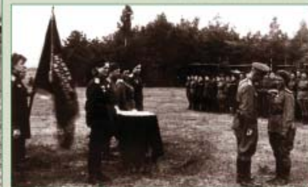
Вручение наград. 46-й гв. ибап. 1943 г.