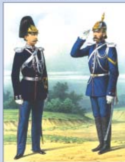
Жандармские командиры в парадной и походной формах. 1872 г.