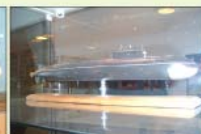
▲ ▼ Макеты подводных лодок ▲ ▼