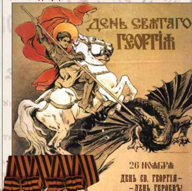
▲ Плакат ко дню Святого Георгия