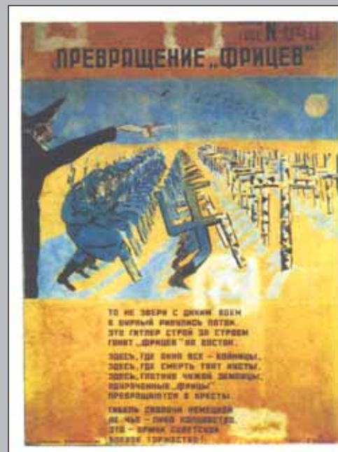
«Окно ТАСС» № 540