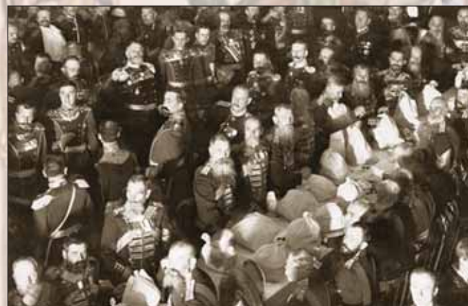
Праздник в честь георгиевских кавалеров в зале Народного дома императора Николая II