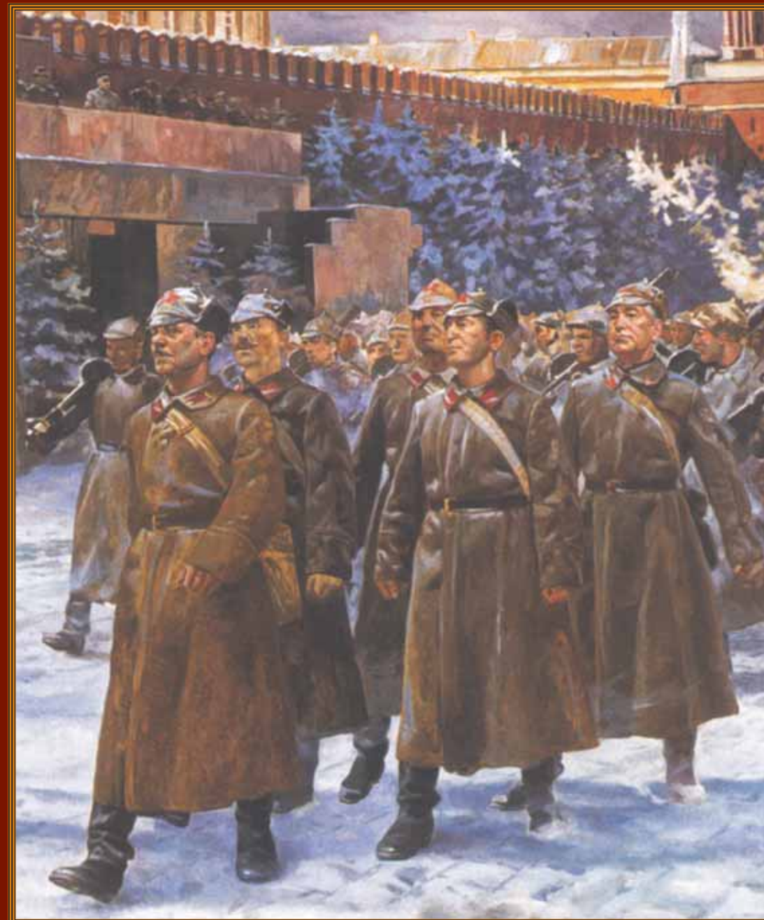
Парад 1941 года Художник А.М. Самсонов, 2004 г.

7 ноября — проведение военного парада на Красной площади в честь 24-й годовщины Октябрьской революции. День воинской славы России