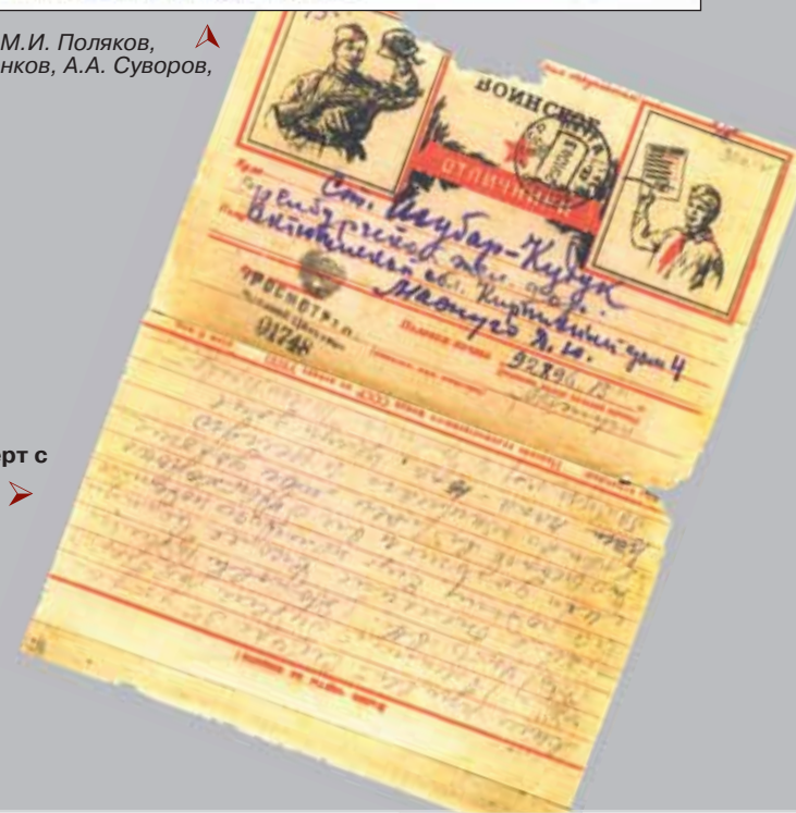
Письмо-конверт с фронта, 1943 г.