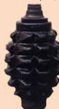
Тяжёлая ручная граната Schwerkhandgranate