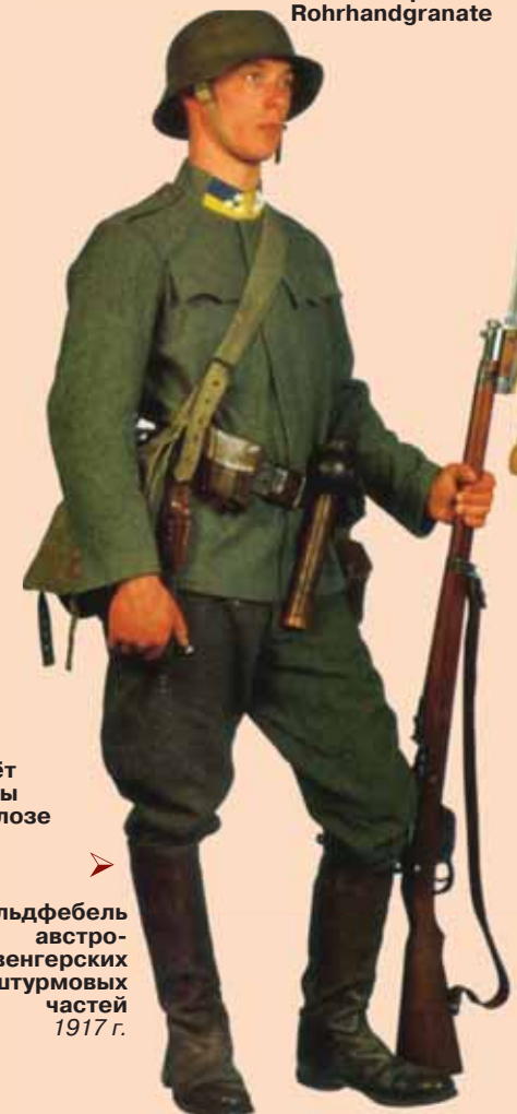
Фельдфебель австро-венгерских штурмовых частей 1917 г.