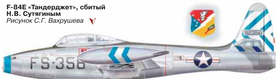
F-84E «Тандерджет», сбитый Н.В. Сутягиным Рисунок С.Г. Вахрушева ▼