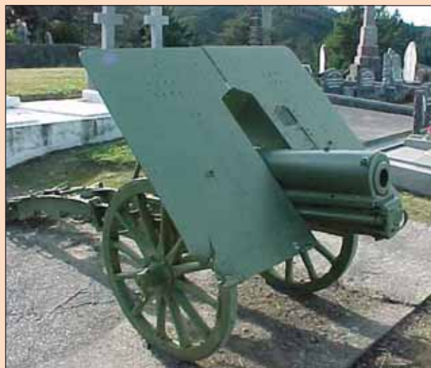
75-мм горная гаубица