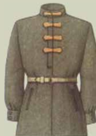
▲ Рубаша летняя образца 1919 года