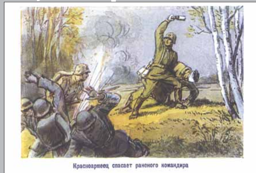
Красноармеец спасает раненого командира

Художники А. Лаптев, В. Сигорский, 1941 г.