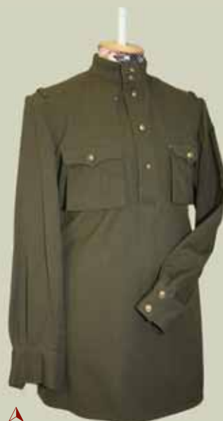
▲ Гимнастёрка габардиновая сержантского состава Из фонда Центрального пограничного музея ФСБ РФ