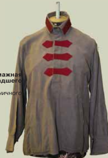
▲ Зимняя байковая рубашка образца 1922 года красноармейца стрелковых частей РККА Из фонда Центрального пограничного музея ФСБ РФ