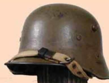
Австро-венгерский стальной шлем модели 1917 года, также называемый «немецкая модель»