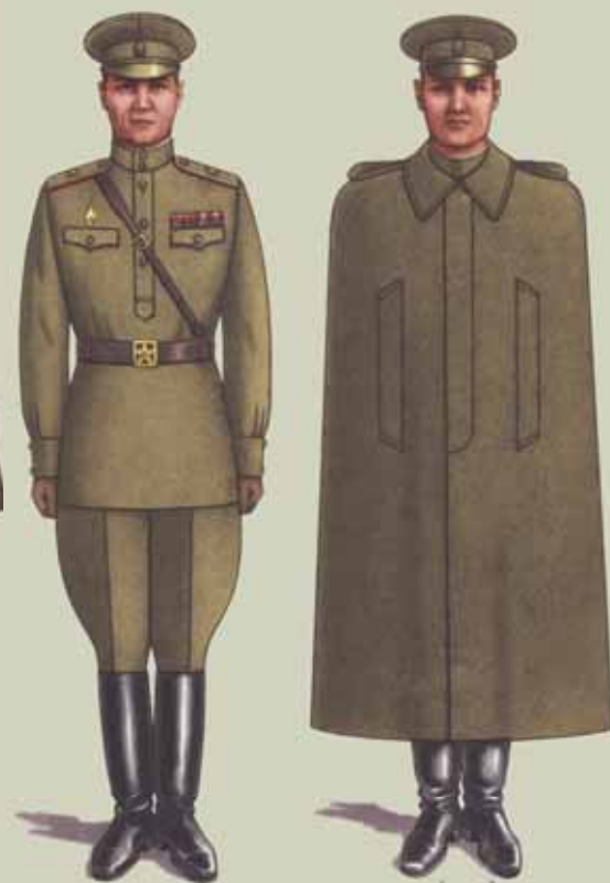
▲ Летняя полевая форма одежды маршалов и генералов Советской армии