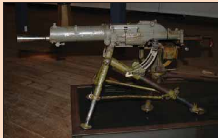
Пулемёт системы Шварцлозе

Вооружение и снаряжение: 1 – штык и ножны с лопастью; 2 – эрзац – штык; 3 – унтер – офицерский штык с темляком; 4 – ручная наступательная граната; 5 – ручная оборонительная граната; 6 – кастет; 7 – кусачки для резки проволоки; 8 – траншейный кинжал