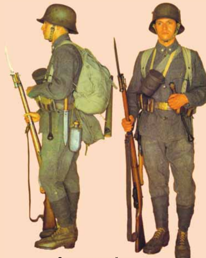
Солдат штурмовой части в полном снаряжении Итальянский фронт, 1917 г.

Более подробно о составе штурмовых подразделений, их амуниции и вооружении, а также целях и задачах в бою читайте в статье А.В. Олейникова «Организация, вооружение и тактика австро-венгерских штурмовых частей в годы Первой мировой войны».