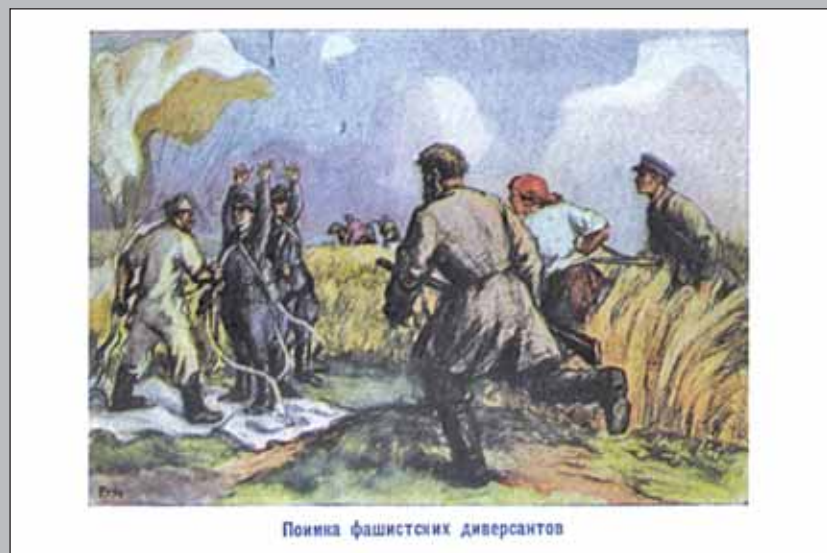
Поимка фашистских диверсантов

Художники М.И. Поляков, Б.Ф. Рыбченков, А.А. Суворов, 1941 г.