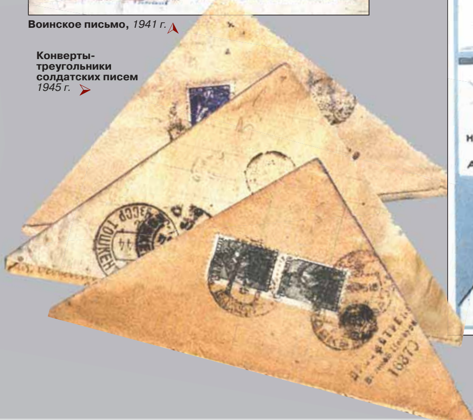
Конверты-треугольники солдатских писем 1945 г.

Художники М.И. Поляков, Б.Ф. Рыбченков, А.А. Суворов, 1941 г.