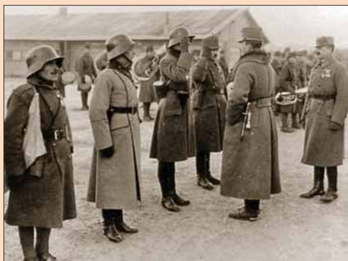
Солдаты австро-венгерской штурмовой роты и император Карл

В 1916 году в австро-венгерских войсках началось формирование штурмовых частей, что по своей сути стало ответной реакцией на новые условия войны. В области организации и обучения этих войск командирам была предоставлена почти безграничная власть. И к 1918 году австрийские штурмовые части стали элитой вооружённых сил как по подбору кадров, так и по вооружению и оснащению.