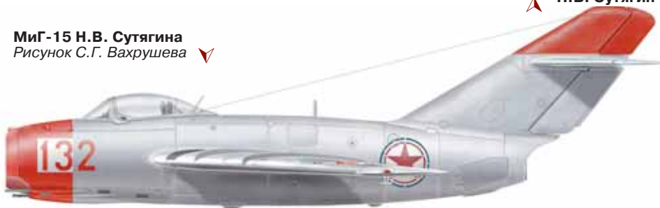
МиГ-15 Н.В. Сутягина Рисунок С.Г. Вахрушева ▼