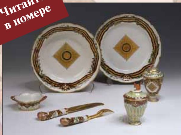
▲ Георгиевский сервиз

В ПЕРВОЙ половине XIX века 26 ноября вошло в историю как день высочайшего приёма георгиевских кавалеров в императорских резиденциях.