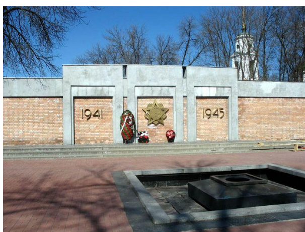
Мемориал на Скорбящем кладбище.