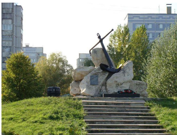
Парк морской славы Рязани

в 1995-м списана из состава боевого флота и поставлена на отстой в г.Полярный. В 2006 году Министерство обороны РФ по запросу организации ветеранов подводников передало Рязани рубку лодки. С высокого берега, на котором расположен «Парк морской славы», открывается восхитительный вид на Рязанский кремль и на Оку. И весной сюда едут посмотреть на разлив со всего города! И еще про море. В водах Северного моря несет боевую вахту ракетный подводный крейсер стратегического назначения «Рязань».