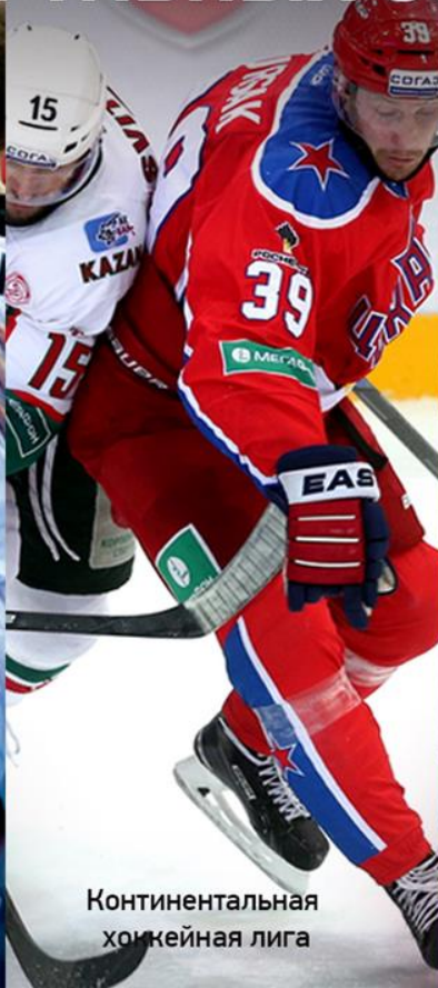
Континентальная хоккейная лига