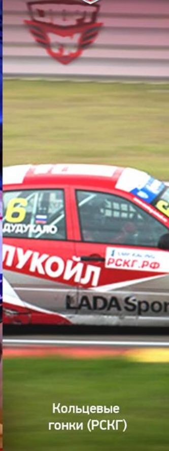
Кольцевые гонки (PCKГ)