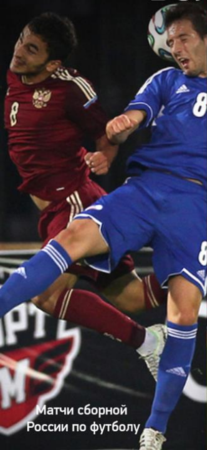
Матчи сборной России по футболу