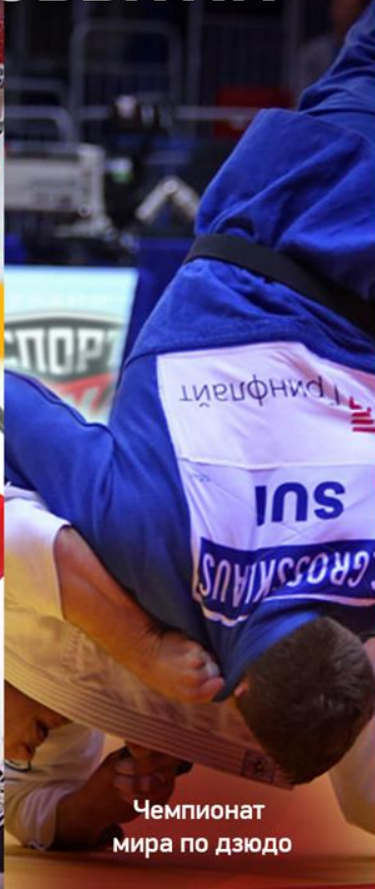
Чемпионат мира по дзюдо