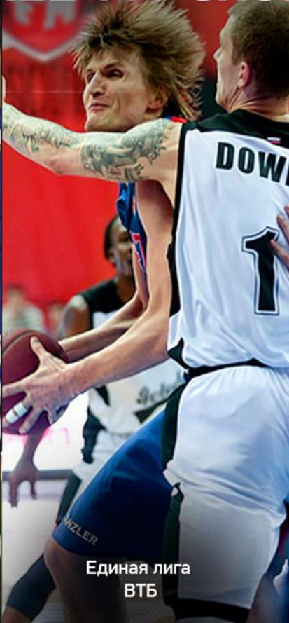
Единая лига ВТБ