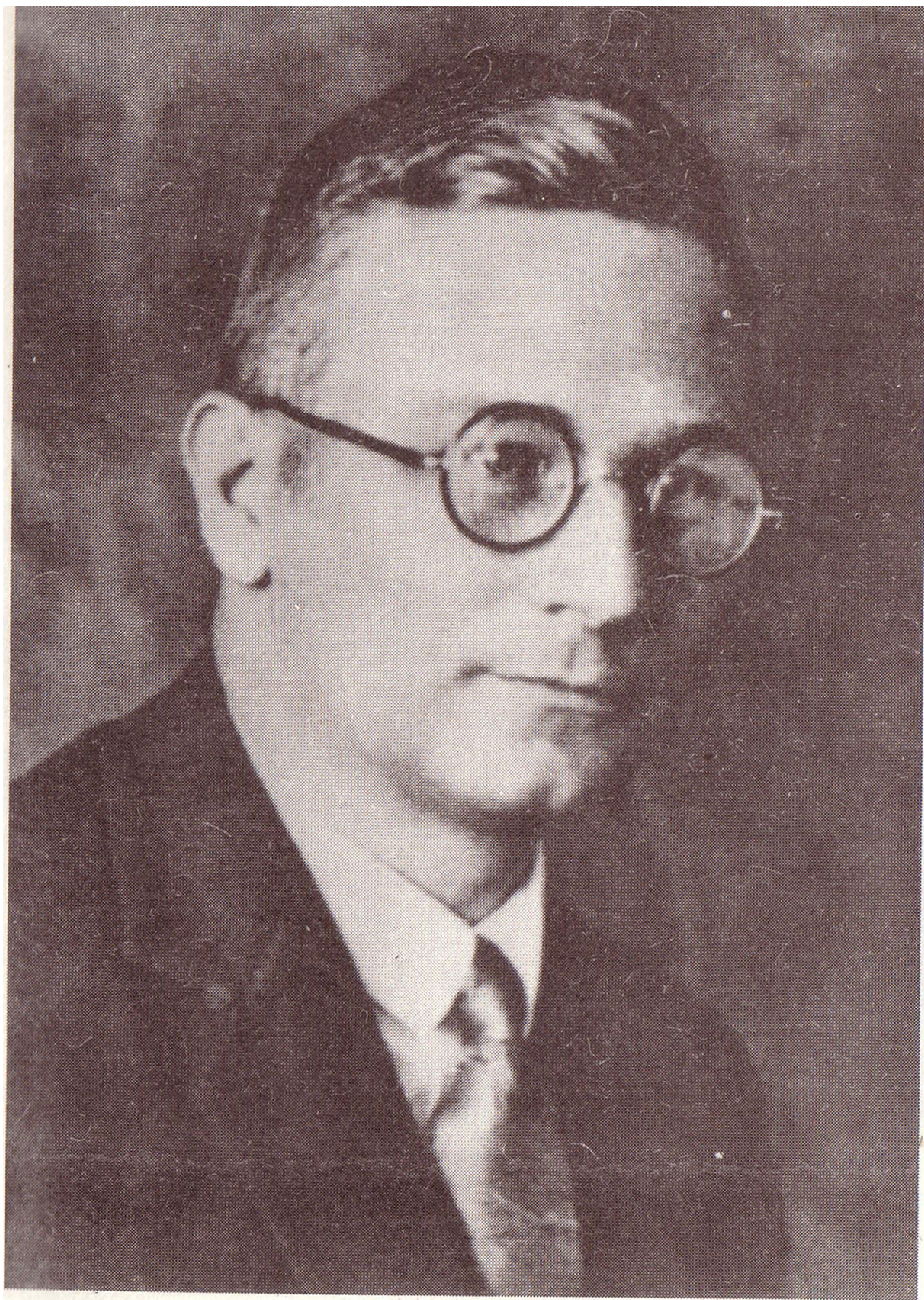
Вальтер Шубарт (1897–1942)