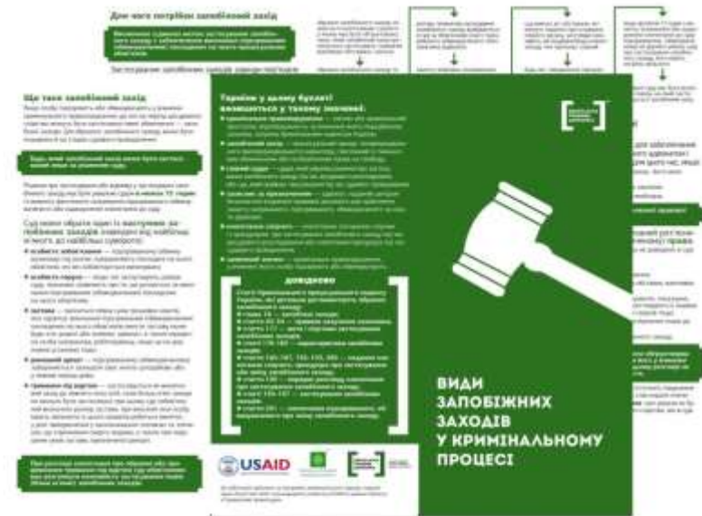
2. Види запобіжних заходів у кримінальному процесі