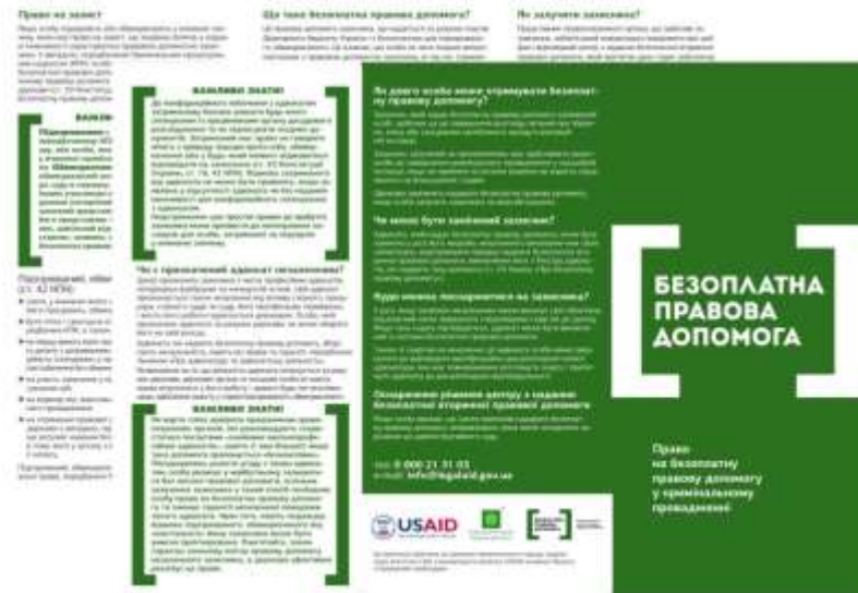
3. Право на безоплатну правову допомогу у кримінальному провадженні