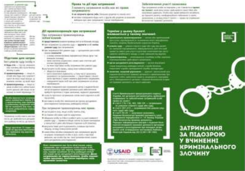
1. Затримання за підозрою у вчиненні кримінального злочину