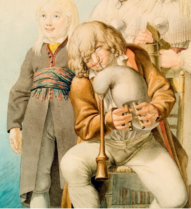
F. L. von Maydell. Torupillipuhuja/Bagpipe Player. Akvarell/Aquarelle. 1840

3. juuni – 31. oktoober Harulduste kogu näitusesaal PÄRIS JA PRII 200 aastat pärisorjuse kaotamisest Eestimaa