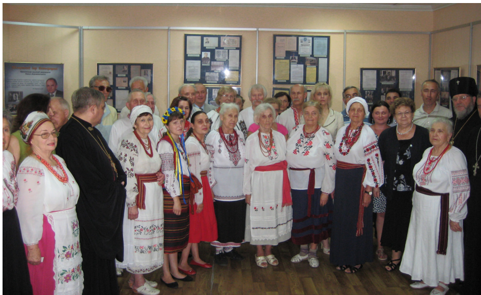
Спільне фото учасників заходу.