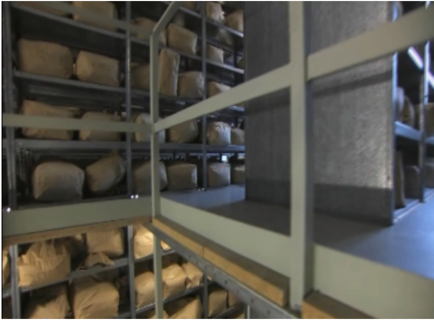
Архівосховище пошкоджених документів Штазі (BStU) в Німеччині. Презентація на XVI Міжнародна конференція архівів країн Центральної та Східної Європи “Складні питання історії та архівів” із циклу Colloquia Jerzy Skowronek dedicata, м. Варшава (Польща), 19 травня 2016 р. Кадр із фільму фондів ІНП Польщі, м. Катовиця.

невидимі у звичайному світловому спектрі. В подальшому вся інформація про марковану частину документа буде заноситися до бази даних під цим ідентифікатором;