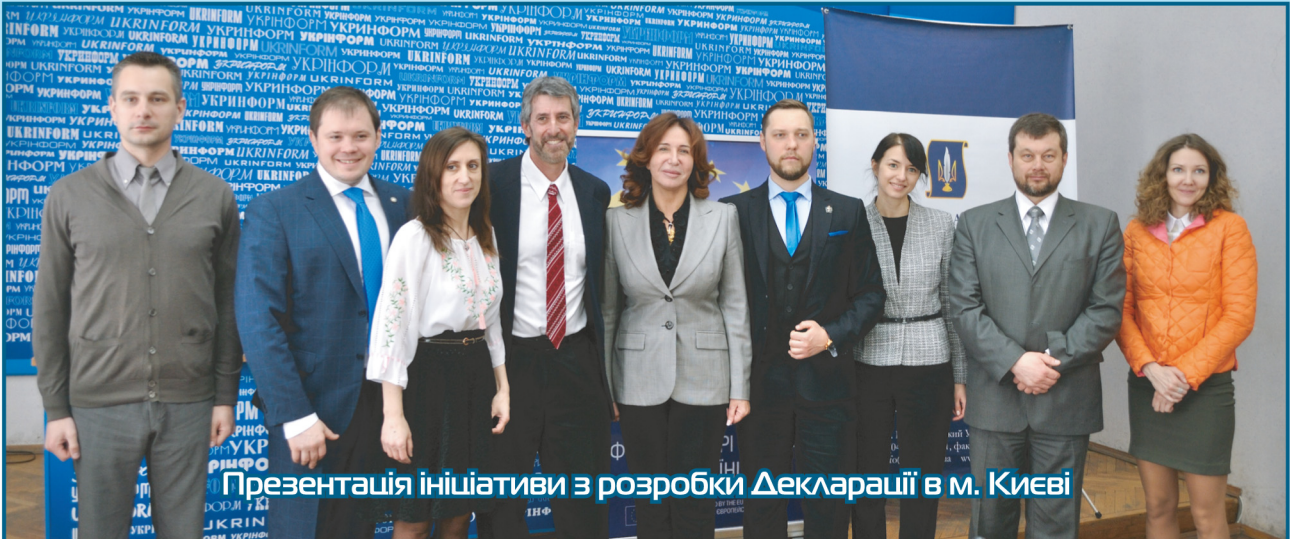
Презентація ініціативи з розробки Декларації в м. Києві