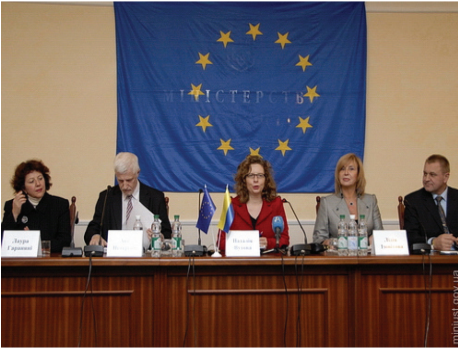
Презентація спільної програми Європейського Союзу та Ради Європи "Прозорість і ефективність судової системи України"

ходами, запропонованими САУ під час зустрічі з представником Генерального секретаря Ради Європи з координації Програм співробітництва в Україні паном Аке Петерсенном, зазначивши, що досягнення цілей програми є неможливим без зміцнення адвокатури та належного законотворчого вирішення питань безоплатної правової допомоги, з чим погодились більшість представників організаторів проекту.