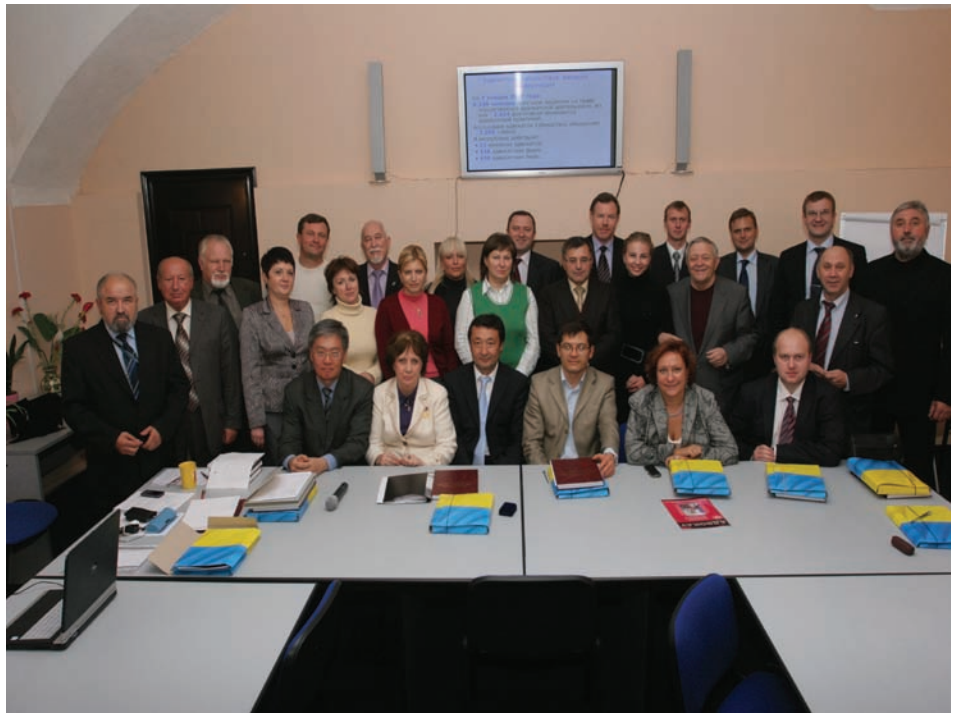
Фото на пам'ять. Учасники першого засідання Міжнародної науково-експертної ради адвокатури (МНЕРА)