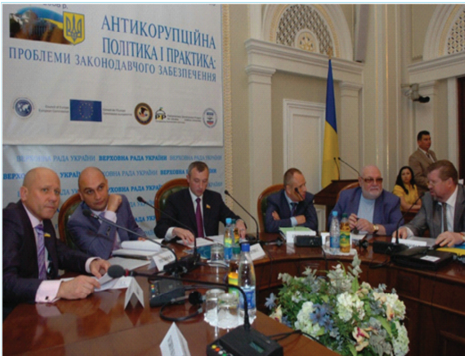
Парламентські слухання з питань боротьби з організованою злочинністю і корупцією