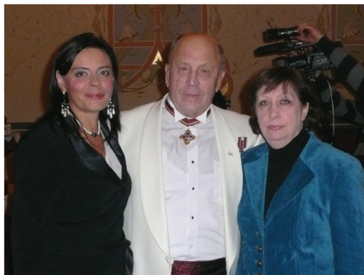
Голова Союзу юристів України В.Євдокімов – один з підписантів Меморандуму

додаткового опрацювання. Члени ВККА повідомили, що збори адвокатів у регіонах засвідчили несприйняття адвокатами ідеї уніфікації, висловлювалися сумніви у необхідності прийняття нового закону "Про адвокатуру". У роботі ВККА взяв участь народний депутат України Юрій Мірошніченко, який у своєму виступі підкреслив, що треба знайти компроміс, задля внесення єдиного законопроекту і щонайшвидшого прийняття закону "Про адвокатуру".