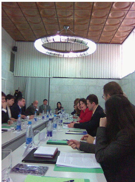
Робоча нарада з питань реформування вищої юридичної освіти в Україні за участі представників Спілки адвокатів України