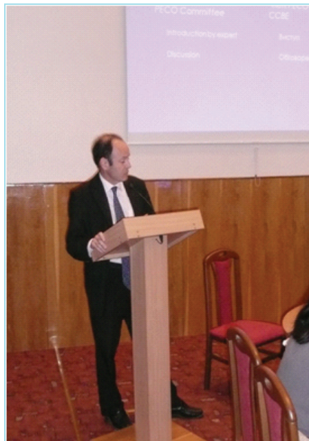
Член "української групи" РЕСО-комітету ССВЕ виступає з доповіддю у Києві

ССВЕ тримала це питання в полі своєї уваги протягом всіх цих років і надавала з ініціативи САУ допомогу у вигляді участі експертів ССВЕ у круглих столах САУ, надісланні листа голові парламенту щодо засад організації адвокатури в Європі, ініціативи введення експертів