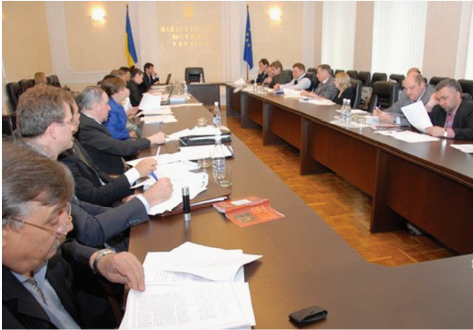
Робочий момент засідання Національної комісії із зміцнення демократії та утвердження верховенства права

Спілка проводить різнобічну діяльність у законотворчому процесі, це, перш за все, ініціативи з подання нових проектів законів, пропозиції щодо внесення змін у чинне законодавство, відгуки на законопроекти, які надходять на рецензування до САУ з Верховної Ради, Кабінету Міністрів, Мінюсту, різних відомств. Крім того – це наукове обґрунтування нових концепцій, наукове коментування кодексів і судової практики, наукові розробки з актуальних проблем, написання членами САУ дисертаційних досліджень. Це також висновки з проблемних питань застосування законодавства, узагальнення судової і адвокатської практики. Все це дає можливість ефективно брати участь у законотворенні.