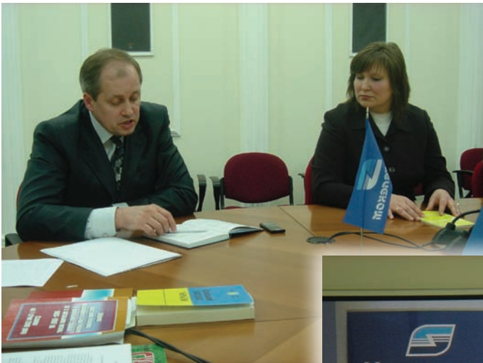
Дистанційний семінар за участю суддів ВСУ та викладачів Академії адвокатури

в 2008 році три посібника для адвокатів. У найближчий час вийдуть декілька номерів журналу "Адвокат".