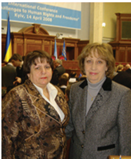
Суддя КСУ М.Маркуш та Т.Варфоломеєва на Міжнародній конференції “Сучасні виклики правам і свободам людини”, що проходила у Верховній Раді

Українська медико-правова асоціація, Спілка адвокатів України, Академія адвокатури України за сприяння Національного медичного університету ім. О.О. Богомольця,