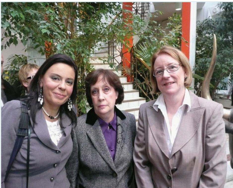
Президент САУ Т.Варфоломеєва, віце-президент САУ О.Жуковська, президент ССВЕ Анна Біргіт Гаммельйорд

ССВЕ до складу робочої групи при парламентському комітеті з правової політики тощо.