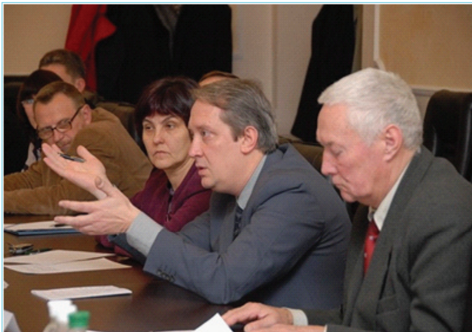
Круглий стіл в Міністерстві юстиції щодо викладання прав людини в школах