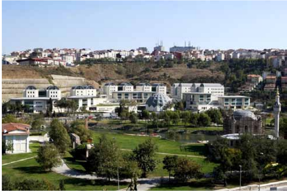
Комплекс приміщень Османського архіву (Başbakanlık Osmanlı Arşivi) в районі Кагітхане (Kağıthane) у Стамбулі, відкритий у червні 2013 р.