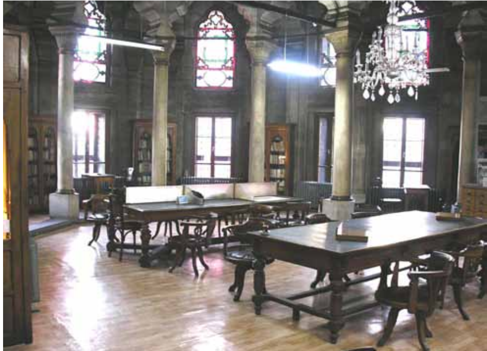
Читальний зал бібліотеки «Сулейманіє» (Süleymaniye Kütüphanesi) у Стамбулі.