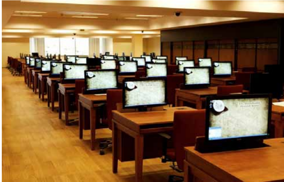
Читальна зала архівного комплексу у Стамбулі. 2014 р.

Hümayun). Тут виготовлялися копії всіх важливих документів, що стосувалися міжнародних справ. Установа була також відповідальною за фіксацію та збереження доповідей великого візира, адресованих султану, імперських декретів (hatt-ı Hümayun) та меморандумів (tezkere), які великий візир одержував від султана. Отже, тут зберігалися офіційні заяви, доповідні записки великого візира, адресовані султану, листи візира до глав іноземних держав, копії протоколів, міжнародних угод, листи посланникам. Начальник підрозділу (amedci) посідав високу позицію у раді і супроводжував вищих сановників на зустрічі із посланниками інших країн, записуючи всі дискусії та рішення 8 .