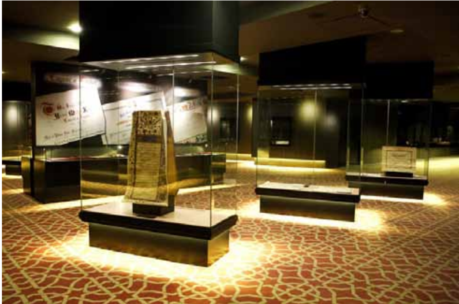
Документальна експозиція у приміщенні Османського архіву у Стамбулі. 2014 р.

блем української історії 2 . У 1992 р. на сторінках першого випуску відродженого “Українського археографічного щорічника” побачила світ ґрунтовна публікація співробітника Українського наукового інституту Гарвардського університету (нині – професора Торонтського університету), д-ра Віктора Остапчука “Проблеми і перспективи розвитку української османістики” 3 , в якій автор, спираючись на солідну історіографічну та джерельну базу, здійснив аналіз витоків, стану та перспектив розвитку тюркологічних досліджень в Україні, а також коротко охарактеризував склад, мовні та стилістичні особливості джерел з історії Османської імперії в архівах Туреччини. На важливому значенні та джерельному потенціалі османських архівів для вивчення української та всесвітньої історії наголошують у своїх публікаціях і сучасні українські тюркологи О. Галенко та Ф. Туранли (останній, зокрема, здійснив джерелознавчий аналіз цілої низки цінних документів з Османського архіву та архіву Музею Топкапи у Стамбулі у праці “Тюркські джерела до історії України”) 4 .