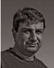
Γράφει ο Βασίλης Δημητριάδης Διευθυντής της ΦΩΝΗΣ του Γέρακα